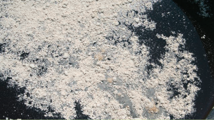
Steinmehl bindet Gerüche