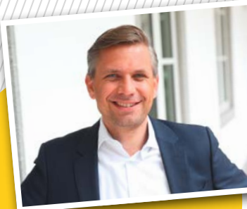
Ein Tipp von Wolfgang Hattmannsdorfer Jugend-Landesrat

Hilfreich für die Entscheidungsfindung können auch Gespräche und Testungen sein. Gemeinsam mit unseren erfahrenen Beraterinnen und Beratern entdeckst du neue Perspektiven und Möglichkeiten, reflektierst deine Stärken und konkretisierst Ideen zu deiner beruflichen Zukunft. Zusätzlich können im Zuge der Beratung verschiedene Testungen (wie z.B. die Potenzialanalyse der WKO) durchgeführt werden, die ebenso förderlich für diesen Entscheidungsprozess sind. Melde dich einfach in deinem nächsten JugendService für einen Termin.