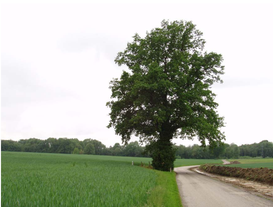
Abb. 7: Markanter Einzelbaum in der ausgeräumten Agrarlandschaft des südöstlichen Gemeindegebietes