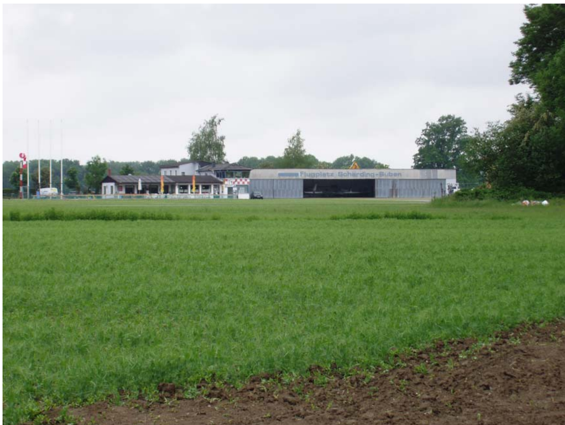
Abb. 14: Flugplatz Scharding-Suben