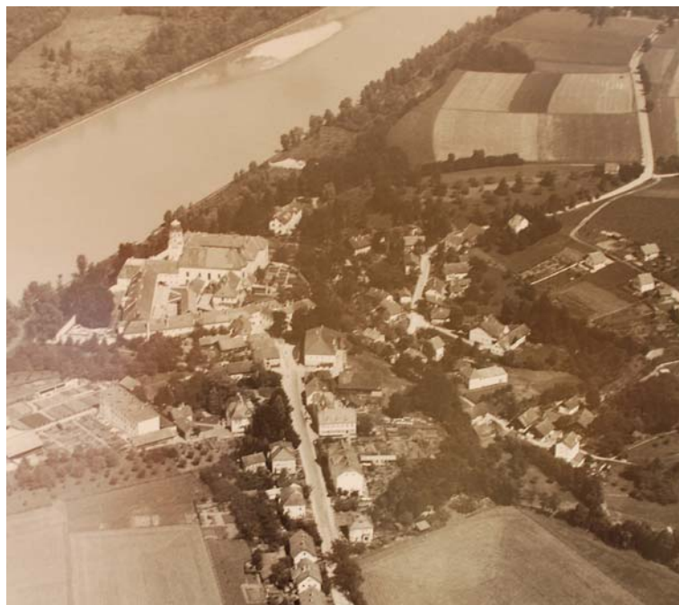
Abb. 2: Alte Ansicht von Suben vor dem Einstau des Inn