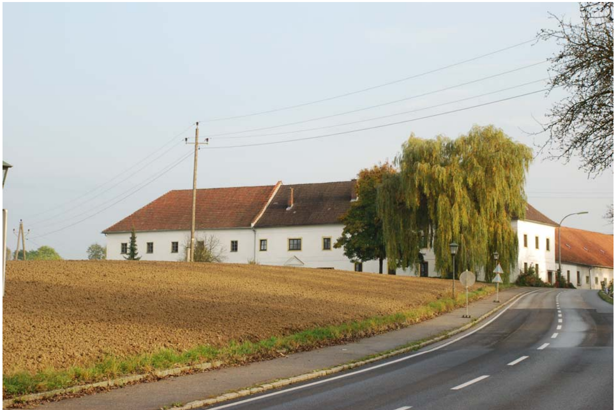
Abb. 3: Bauernhof an der Bundesstraße