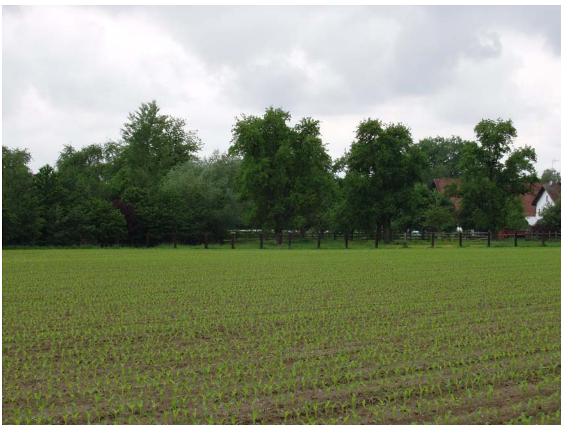
Abb. 8: Ortsrand von Roßbach mit Streuobstbäumen