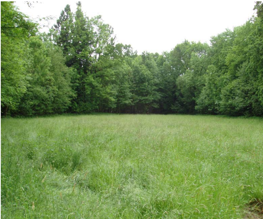
Abb. 12: Intensivgrünland und Eschen-reicher Laubwald beim Flugplatz bzw. Lindetwald