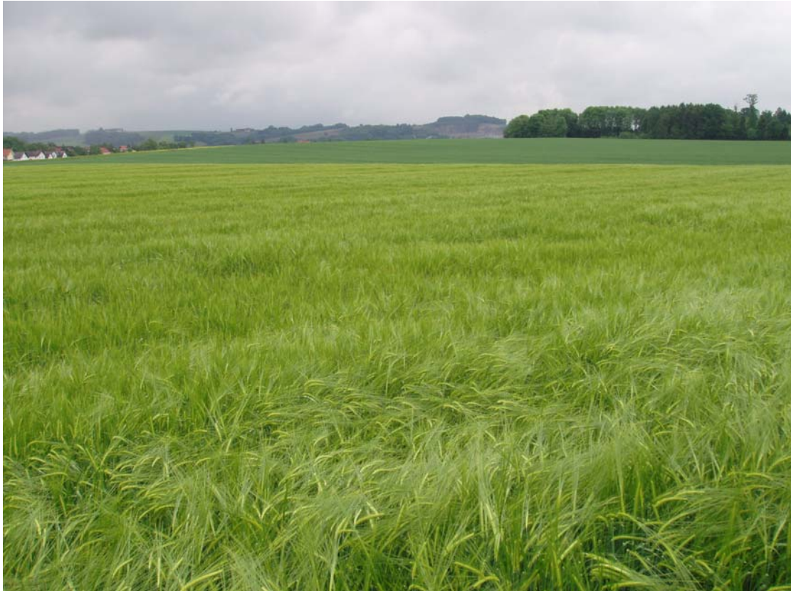
Abb. 5: Intensiv bewirtschaftete Ackerflächen zwischen Dorf und Roßbach