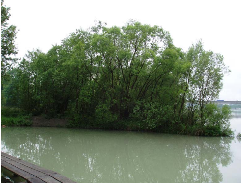
Abb. 11: Insel zwischen Inn und Subener Bucht mit Weidenbestand