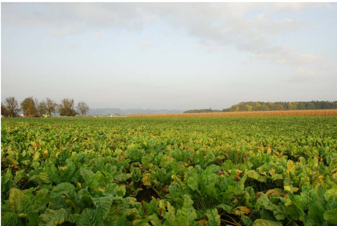
Abb. 6: Zuckerrübenfeld nördlich von Etzelshofen