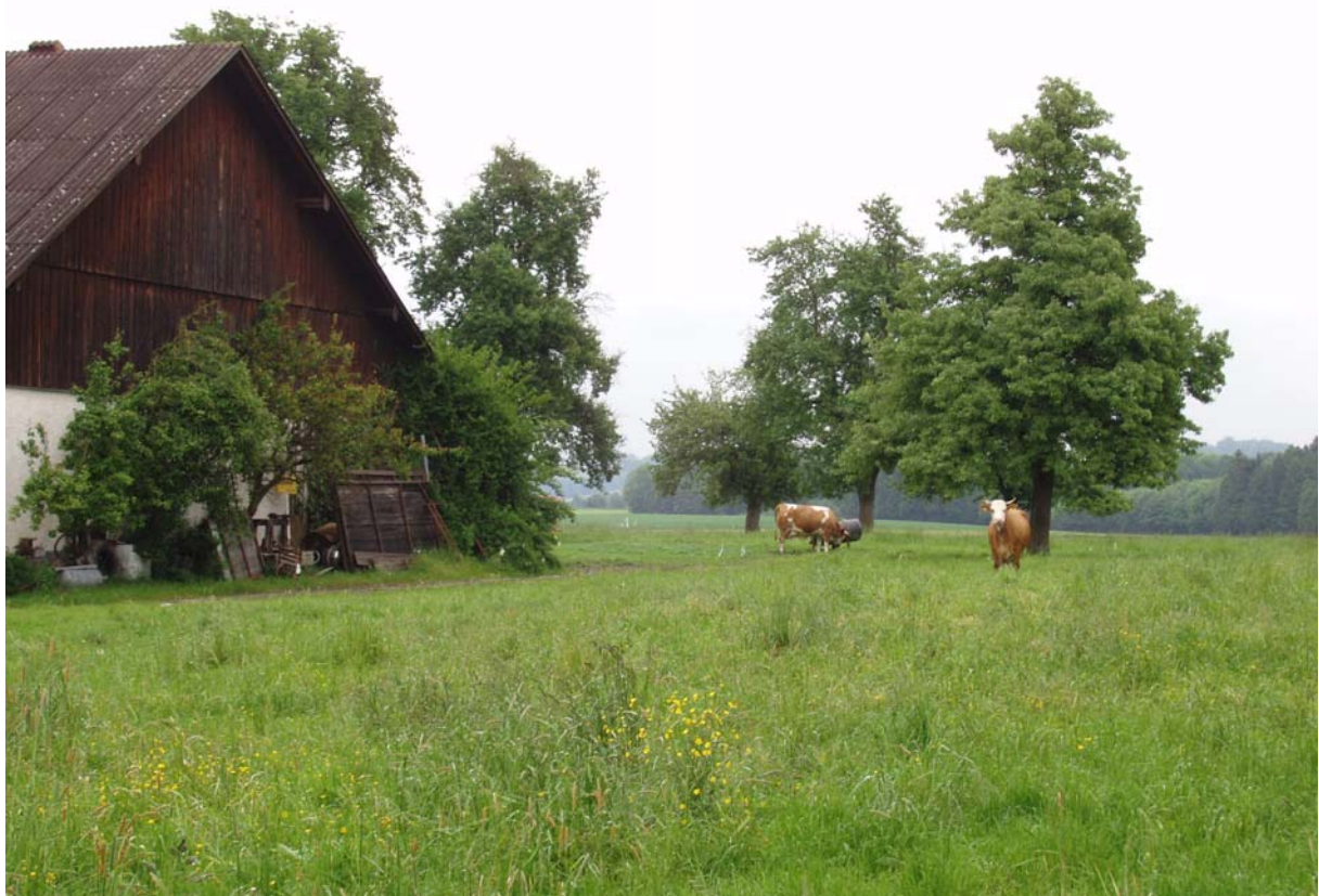
Abb. 4: Rinderweide in Dorf