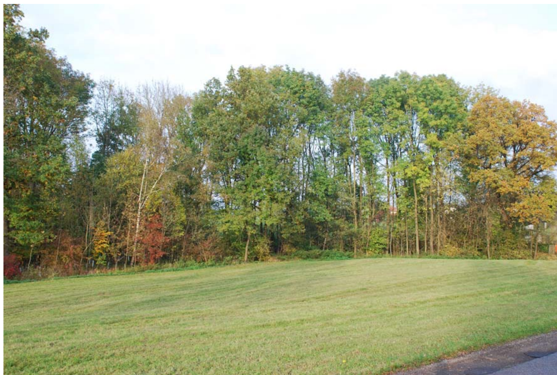
Abb. 9: Laubwald entlang des Etzelhofer Baches