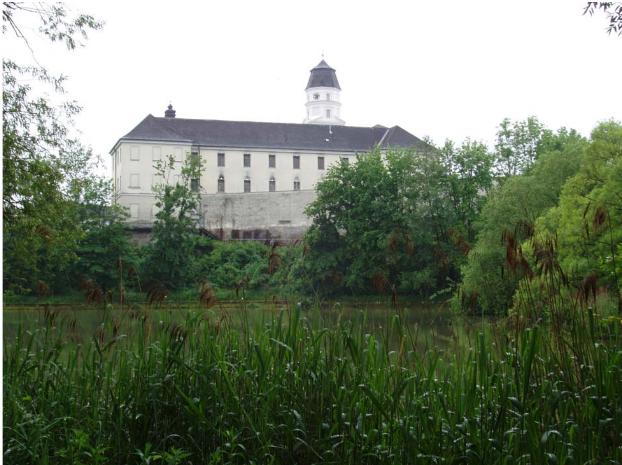
Abb. 1: Subener Bucht und Kloster Suben