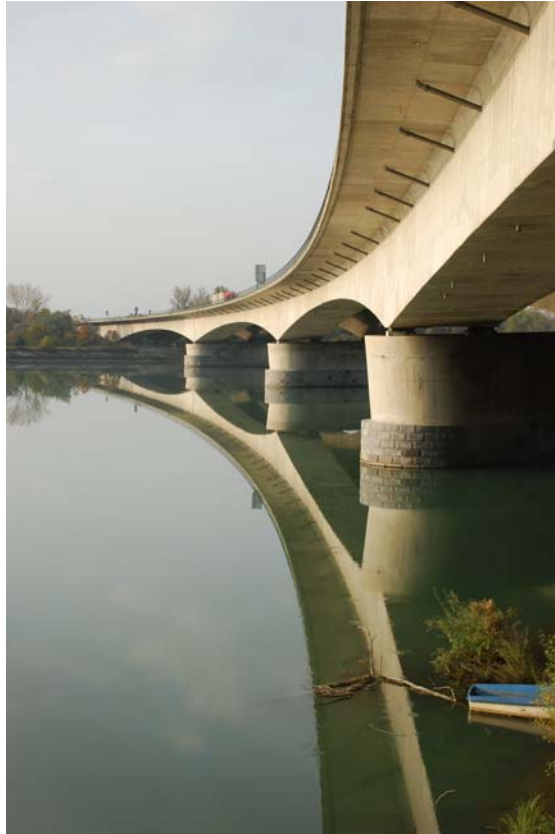
Abb. 13: Inn bei der Autobahnbrücke