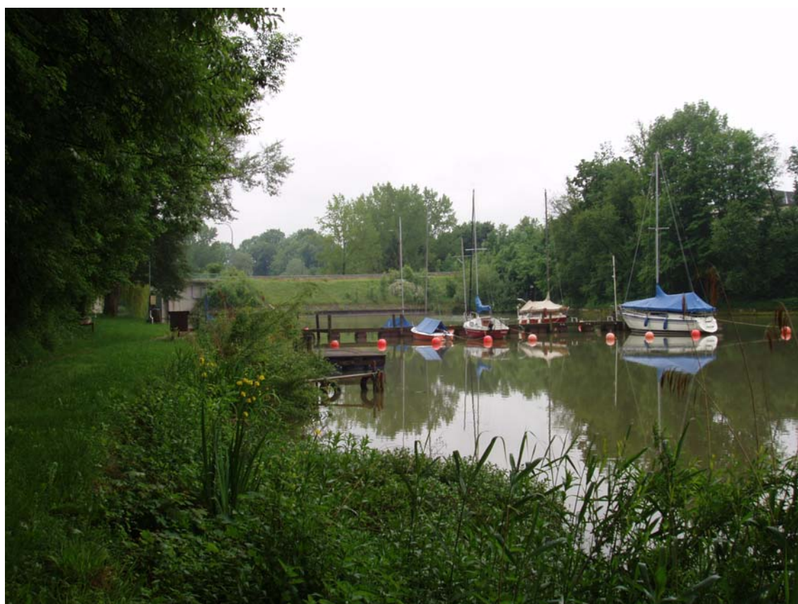
Abb. 10: Hafen in der Subener Bucht