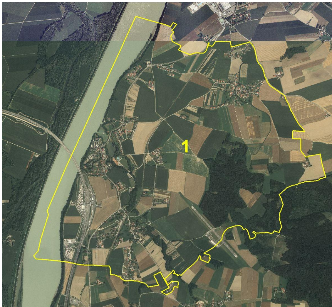
Abb. 2: Übersicht des Erhebungsgebietes mit Abgrenzung des Teilgebietes auf Grundlage von Orthofotos

Teilgebiet 1: Intensiv landwirtschaftlich genutzte, ackerbaudominierte Terrassenlandschaft