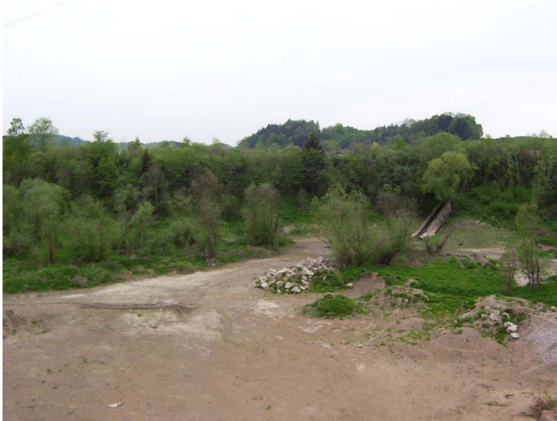
Abb. 7: Ehemalige Schottergrube bei Winkl