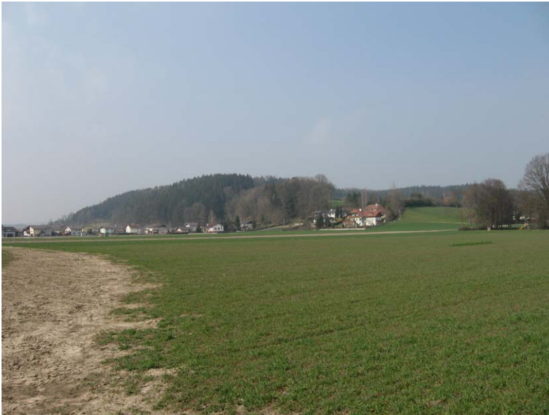
Abb. 5: Ackerbaulich genutzte Niederterrasse, im Hintergrund die Höckersiedlung