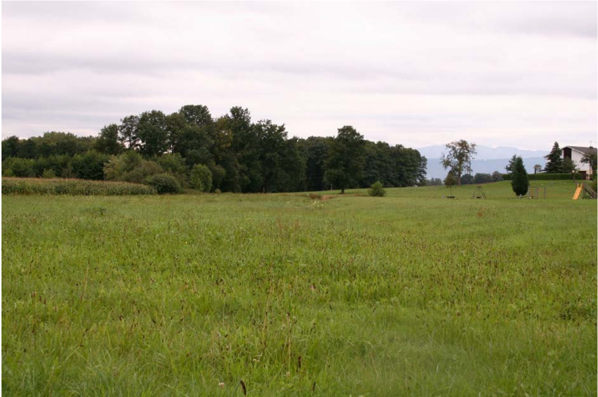
Abb. 3: Blick von Niederholzham zum Erlenbruch bei Philippsberg