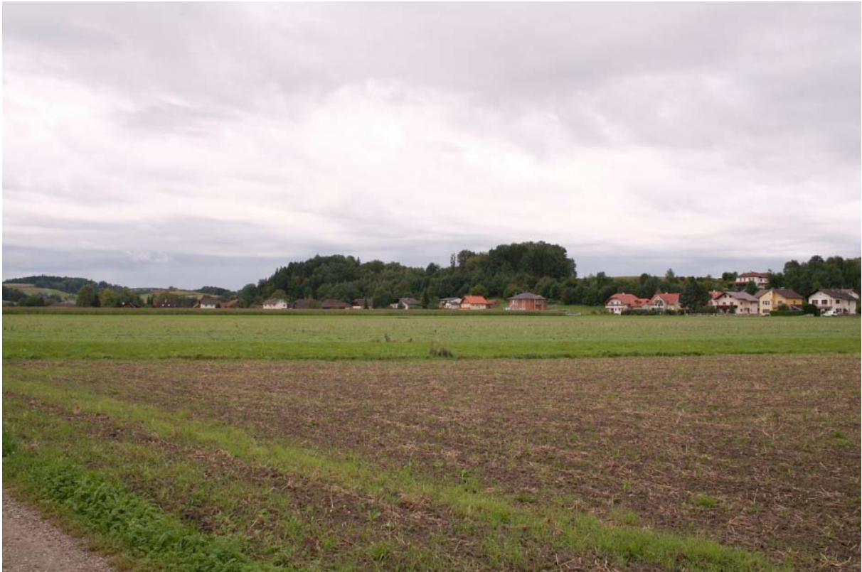
Abb. 1: Ackerbaudominierte Niederterrasse bei Winkl