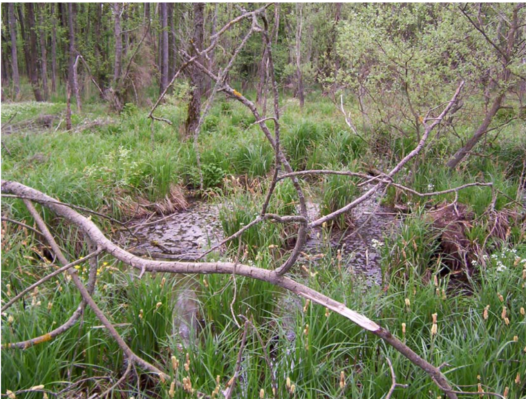
Abb. 6: Erlenbruch bei Philippsberg