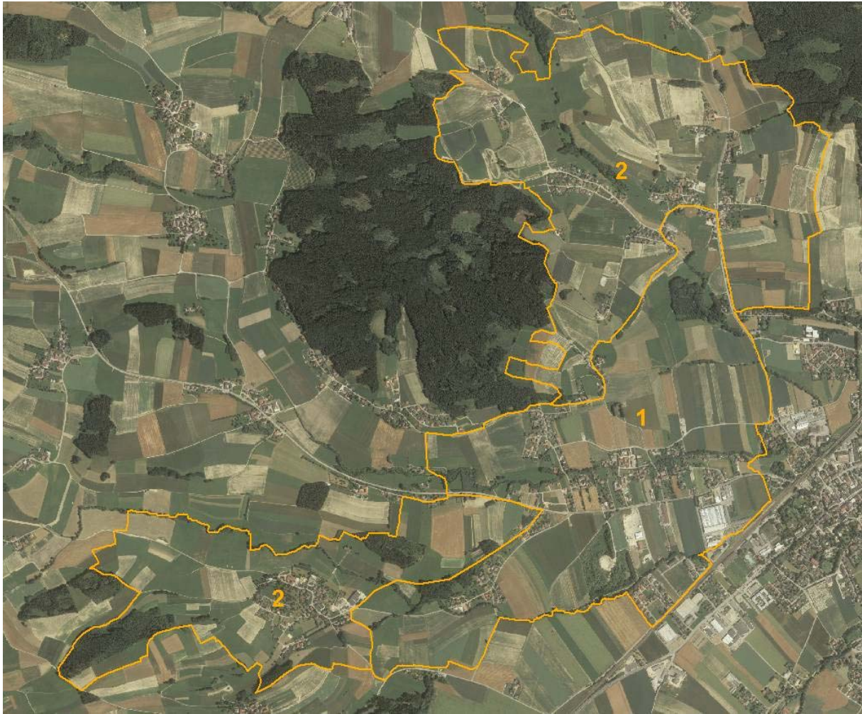
Abb. 2: Übersicht über das Erhebungsgebiet, Abgrenzung der Teilgebiete; Grundlage: Orthofoto

Teilgebiet 1: Ebene siedlungs- und ackerbaudominierte Tallandschaft