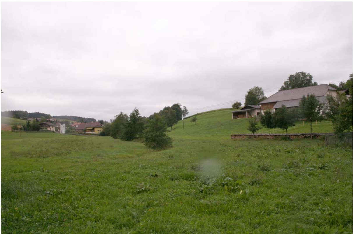
Abb. 2: Bach bei Niederholzham