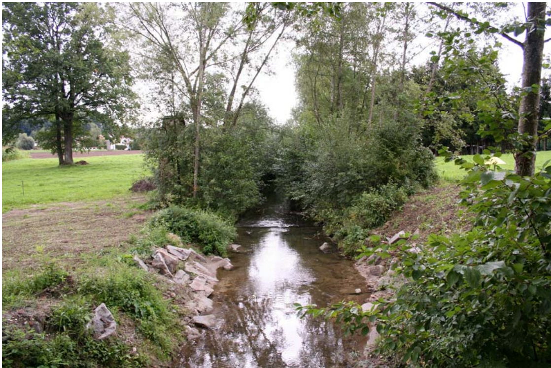
Abb. 8: Regulierter Weißbach westlich von Oberndorf