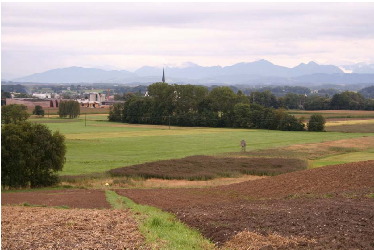
Abb. 4: Feuchtfläche am Niederterrassenrand, bei Philippsberg