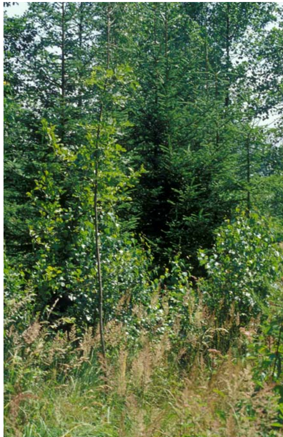
Abb. 12: Schlagfläche mit jungen Fichten, dominiert von Vorhölzern und Land-Reitgras-Flur