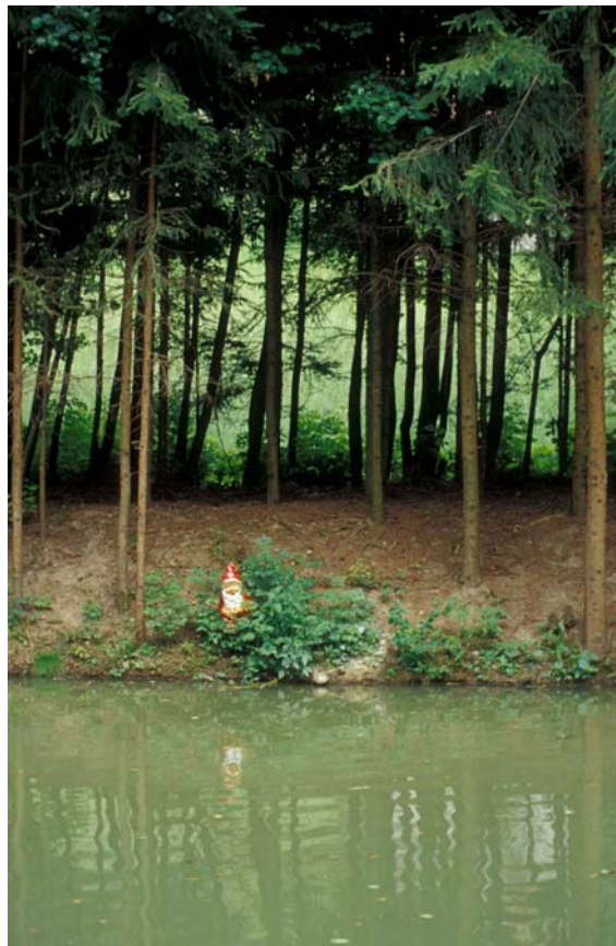
Abb. 8: Fischeich am Fällbach mit Fichtenzeile anstelle eines standortgerechten Ufergehölzes; stark eutrophiertes Wasser