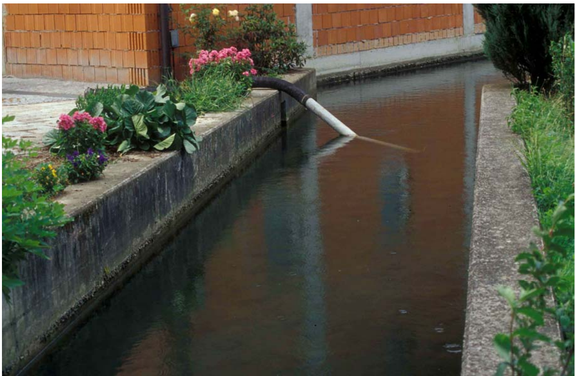
Abb. 4: Betonierter Wehrgraben an Mühlengebäude