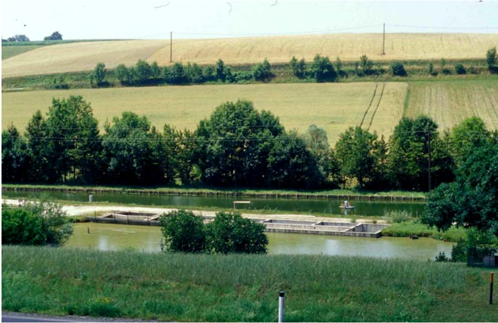
Abb. 7: Fischeichanlage mit gemähten Fettwiesen-Uferstreifen, dahinter forstlich überprägtes Bachgehölz des Ipfbachs