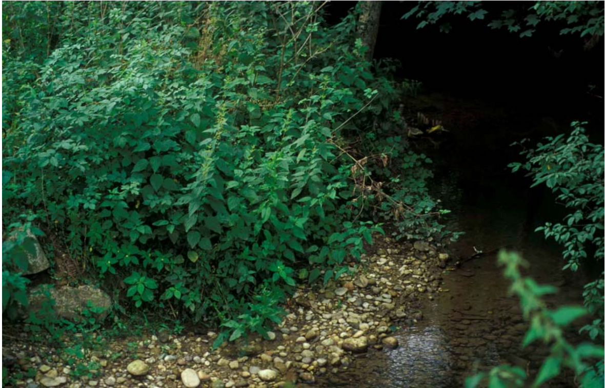
Abb. 3: Naturnaher Bach mit Schotterbank und nitrophiler Hochstaudenflur