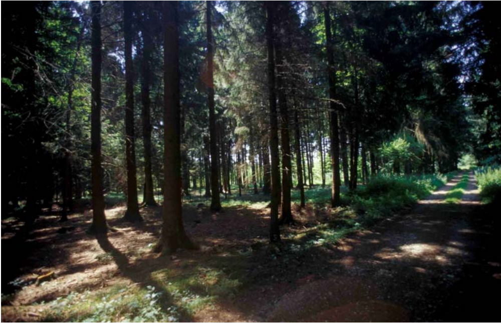
Abb. 11: Dichter Fichtenforst, lichtarm und fast unterwuchsfrei