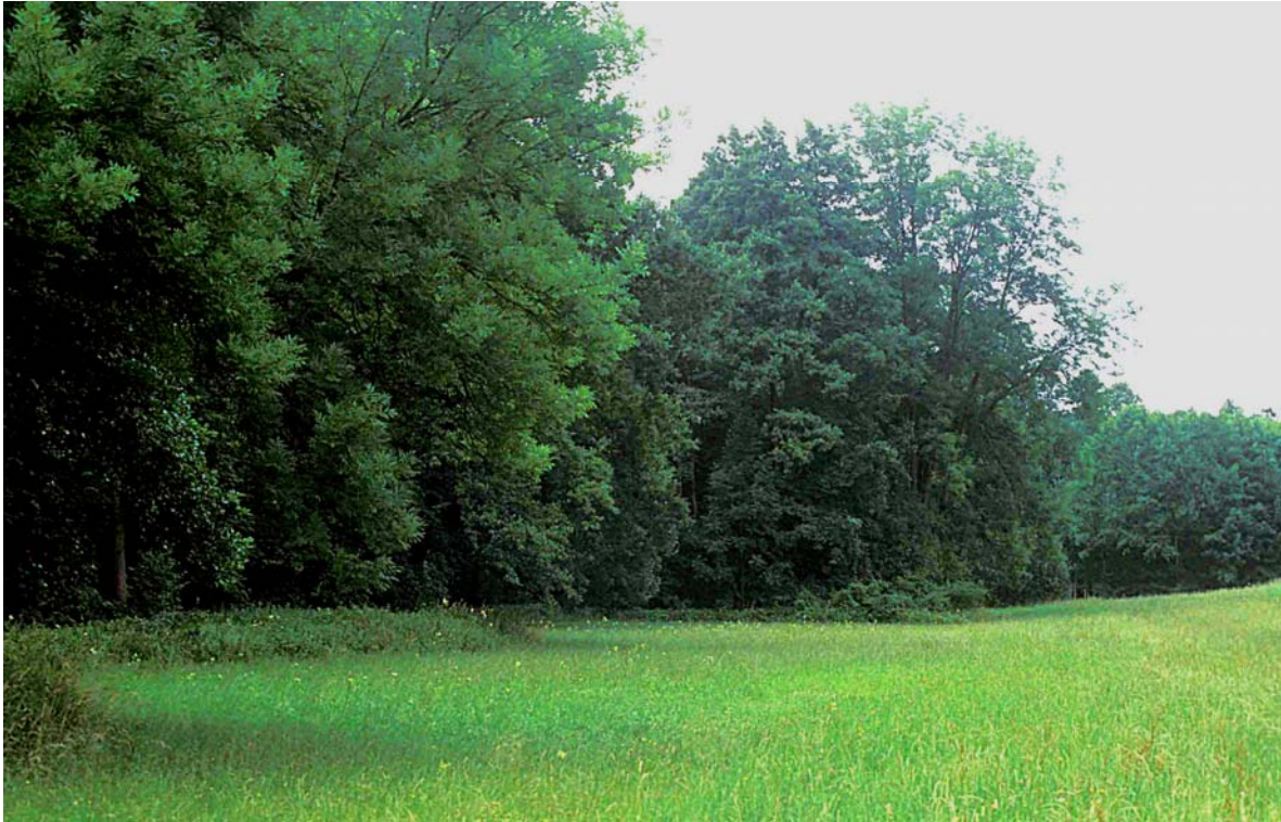
Abb. 5: Altes, eschenreiches Bachgehölz mit Hochstaudensaum, an intensiv bewirtschaftete Talbodenfettwiese grenzend