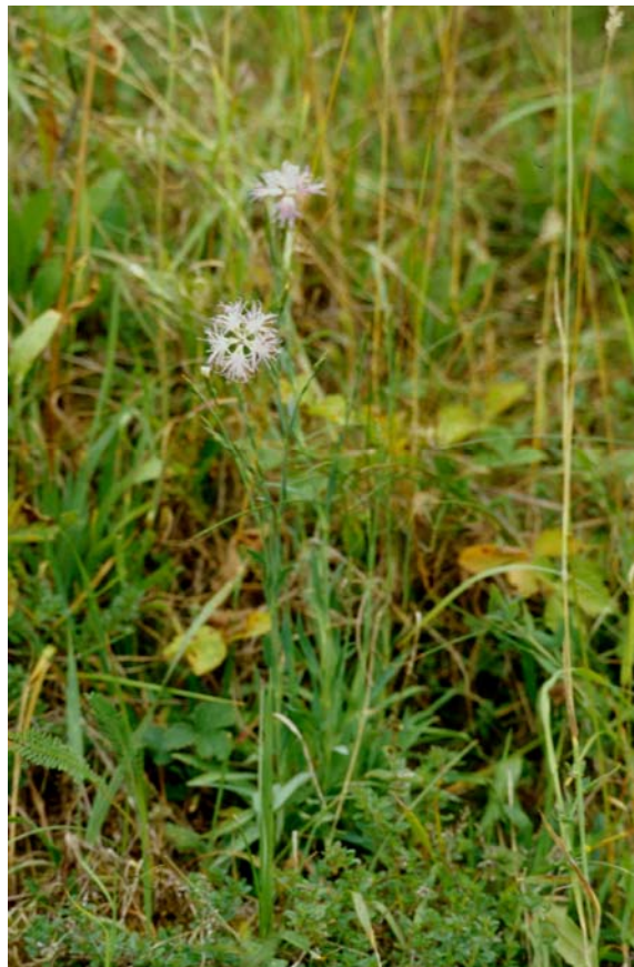
Abb. 10: Prachtnelke ( Dianthus superbus ) auf einer kleinen Restfläche mit trocken-magerer Mähwiese in Böschungssituation