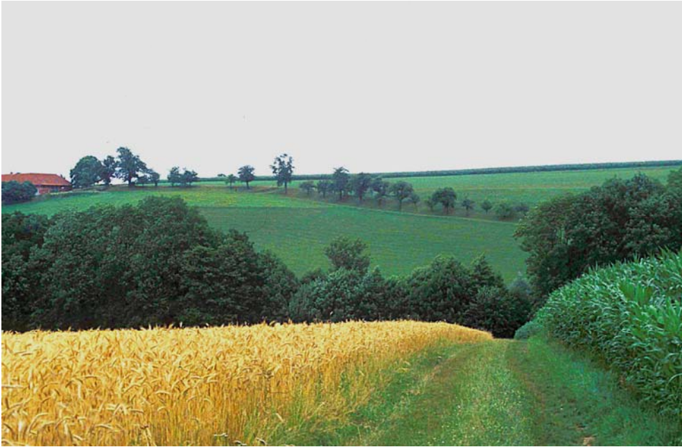
Abb. 1: Streusiedlungsgebiet im Riedelland mit intensiv bewirtschafteten Acker- und Wiesenflächen; Einzelhof mit Streuobstbestand; Muldental mit gehölzbegleitetem Bach