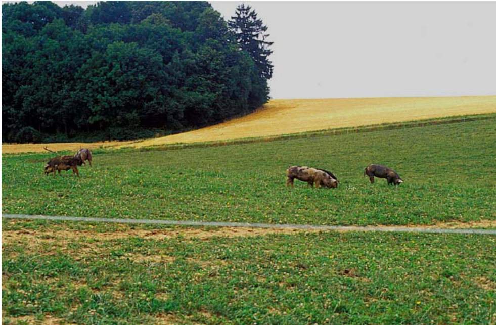
Abb. 9: Artgerechte Schweinehaltung auf einer Weide am Distlberg