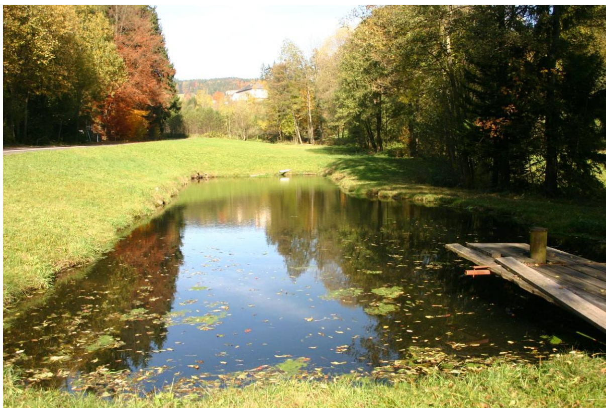
Abb. 5: Einer von zahlreichen Teichen in der Gemeinde.