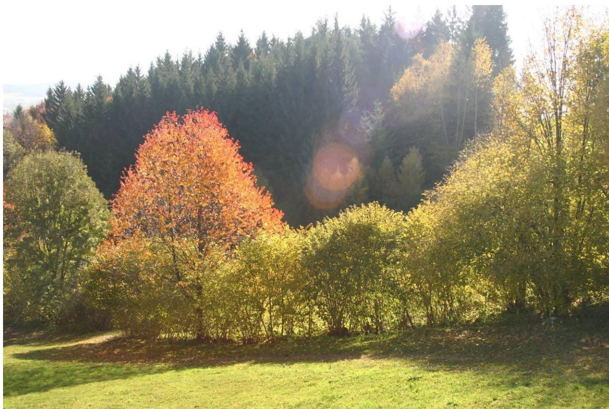
Abb. 3: Laubholzgeprägte Hecke.