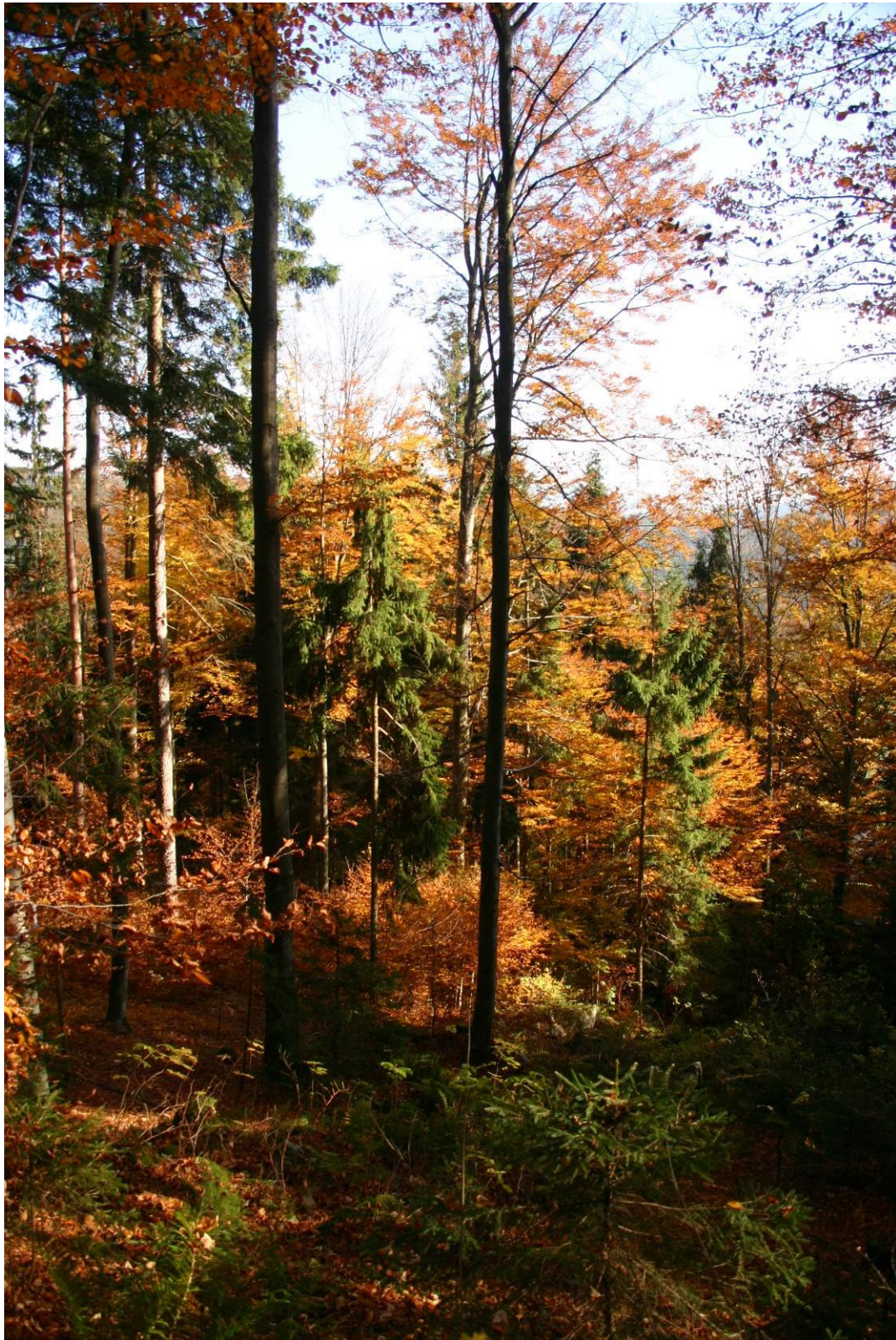
Abb. 1: Mischwaldbestand in Helfenberg.