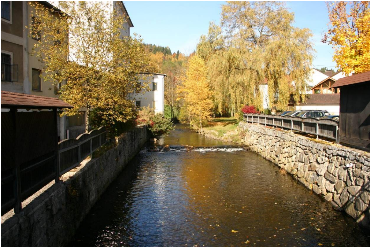
Abb. 10: Ein Abschnitt der Steinernen Mühl im Ortsgebiet von Helfenberg.