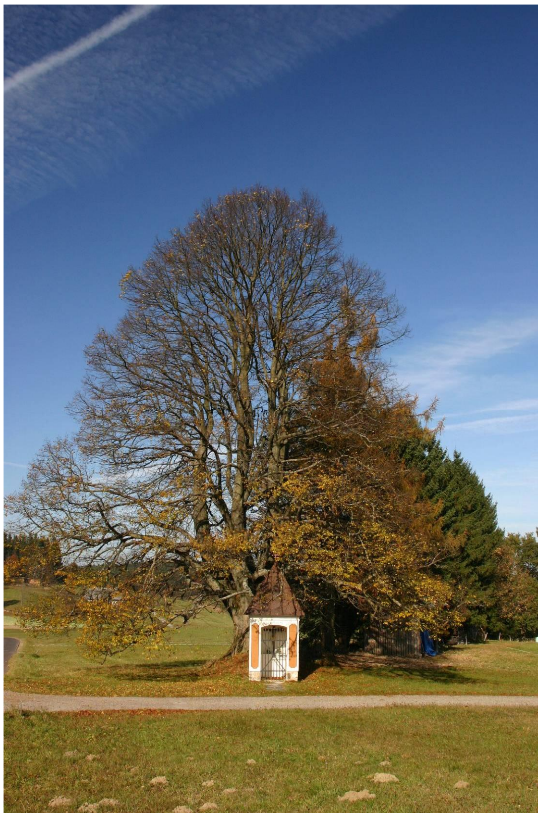
Abb. 11: Eine alte Linde als landschaftsprägender Baum.