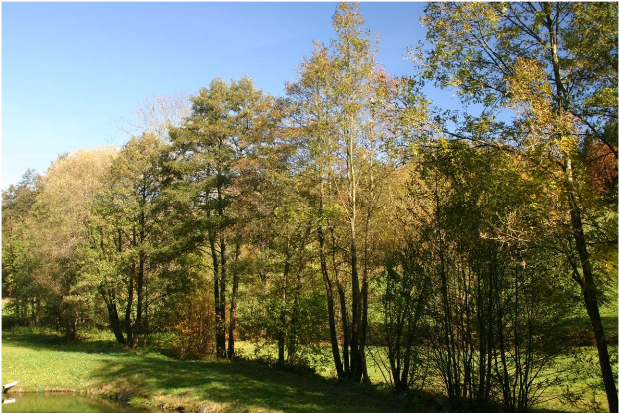
Abb. 6: Ufergehölzsäume begleiten die Fließgewässer auf längeren Strecken.