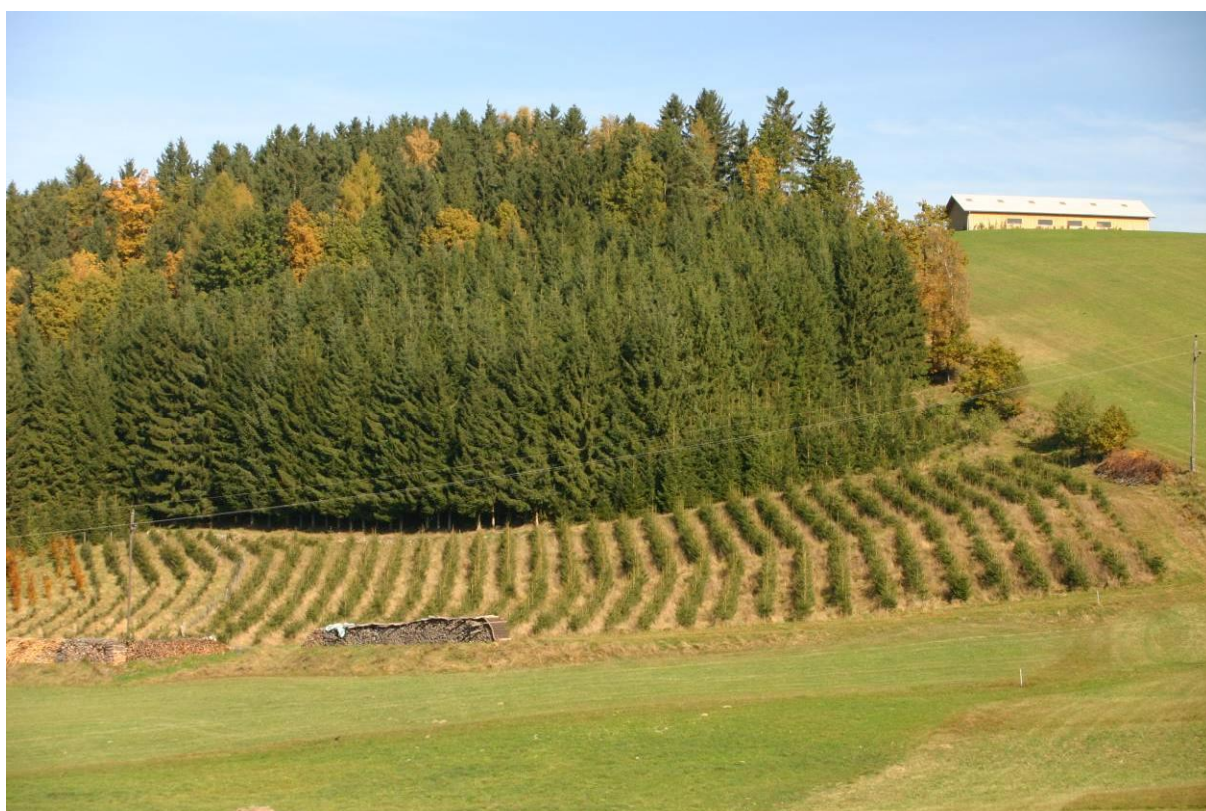
Abb. 9: Neuaufforstung auf vermutlich vormals extensiv genutztem Grünland.