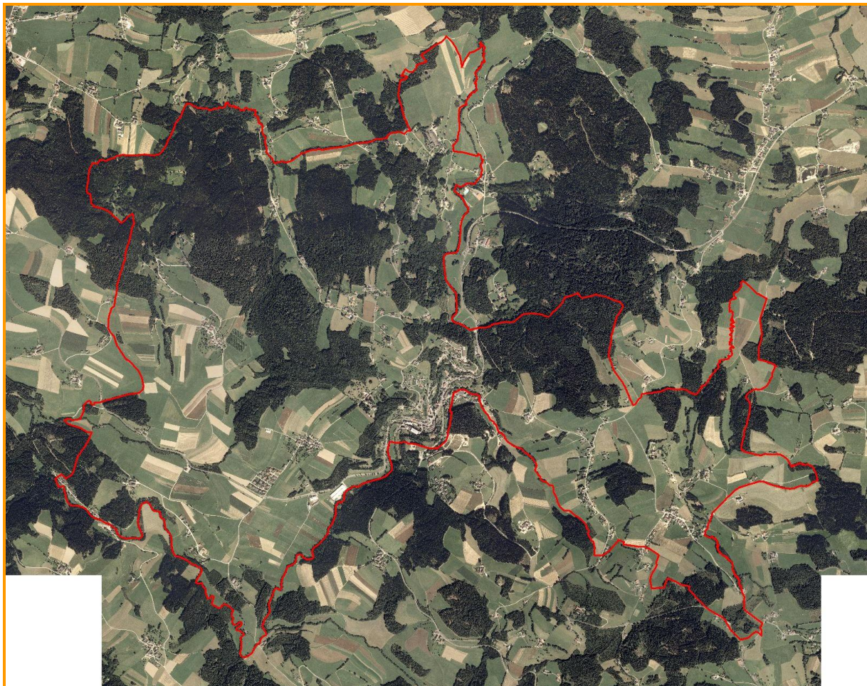
Abb. 3: Übersicht über das Bearbeitungsgebiet über Orthofoto (rot = Gemeindegrenze).

Einen Überblick auf Basis des Orthofotos (Flugdatum 16.8.2001) zeigt Abbildung 3: