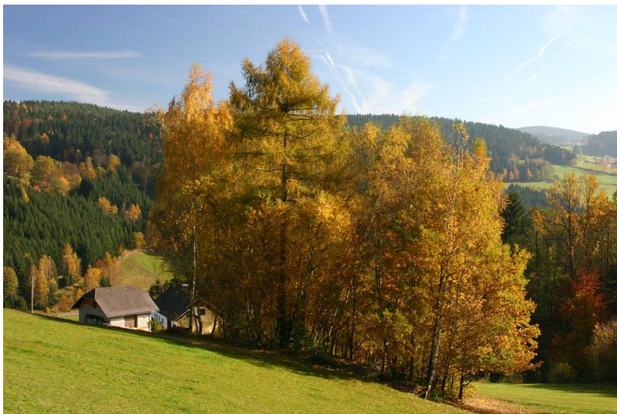
Abb. 2: Zahlreiche Feldgehölze tragen zur vielfältigen Strukturierung der Landschaft bei.