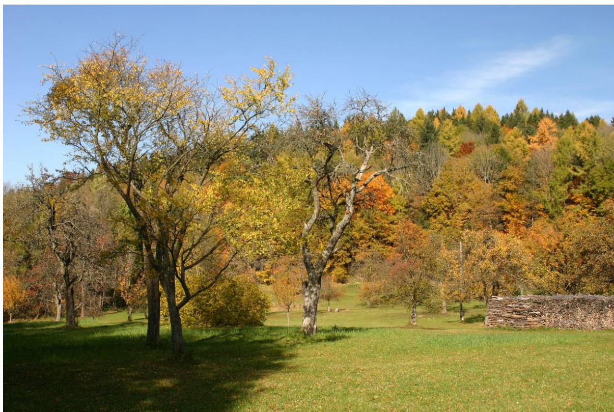
Abb. 8: Streuobstwiese mit älterem Baumbestand.