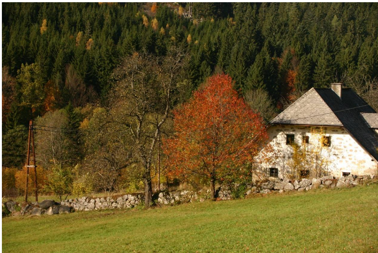
Abb. 4: Für die Region typisch: Lesesteinmauer.