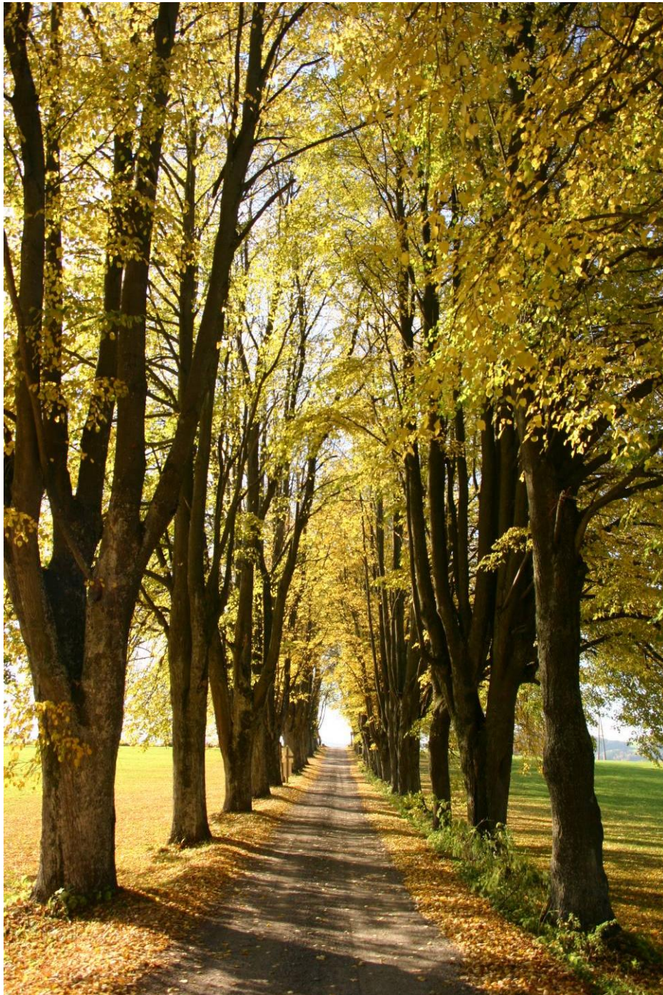
Abb. 7: Wunderschöne, landschaftsprägende Allee zu beiden Seiten eines Feldweges.