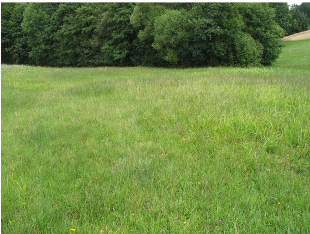
Abb. 4: Eine naturschutzfachliche Besonderheit: Ein feuchter Borstgrasrasen!