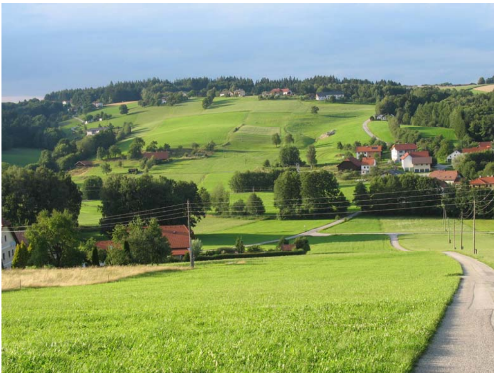
Abb. 8 Stark strukturierte Kulturlandschaft bei Mitteraubach