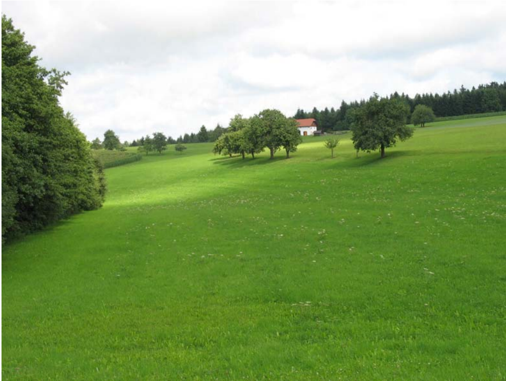
Abb. 1: Obstbaumreihen strukturieren die Landschaft.