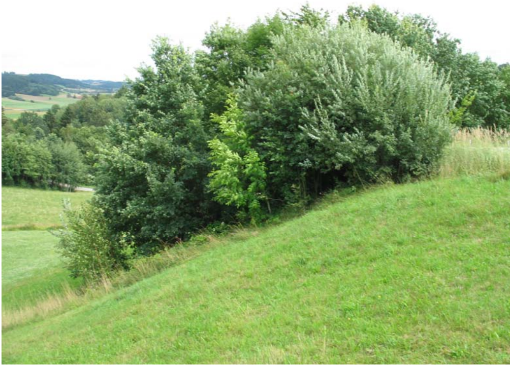
Abb. 7: Feldgehölze befinden sich häufig auf steilen Böschungen (Foto: Grossauer, Ingenieurkonsulent für Landschaftsplanung, Gmünd).