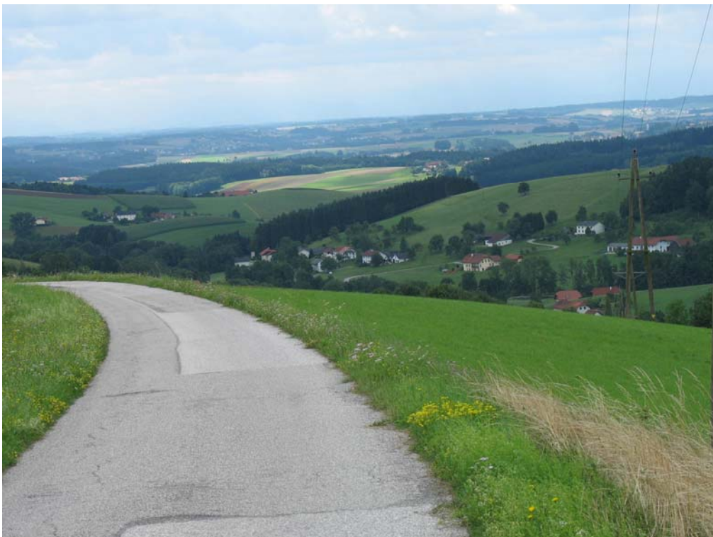
Abb. 2: Blick in die stark reliefierte Landschaft der Gemeinde