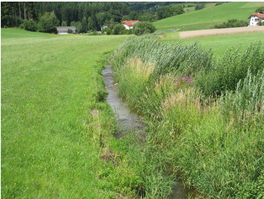
Abb. 6: Regulierter Wiesenbach bei Eschenau