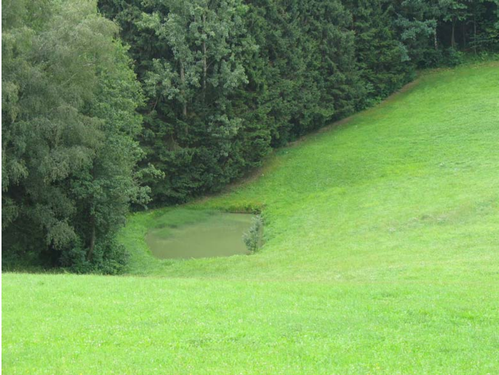
Abb. 9: Naturfernes Kleinstillgewässer westlich von Eschenau