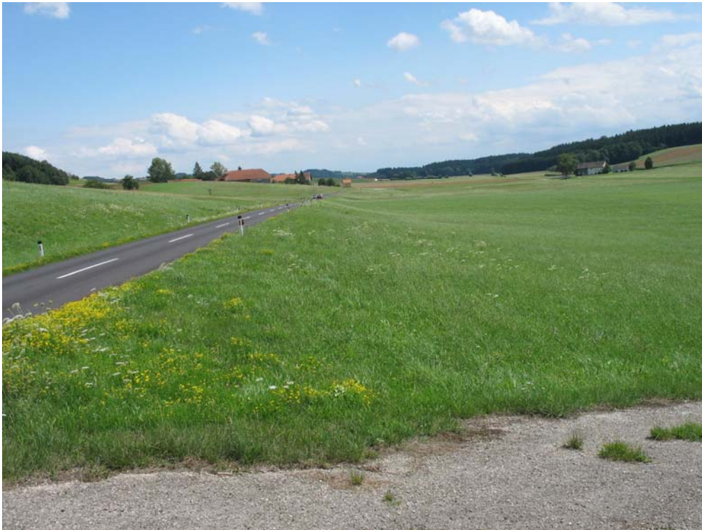
Abb. 5: Ganz im Süden der Gemeinde läuft die Landschaft flach aus.