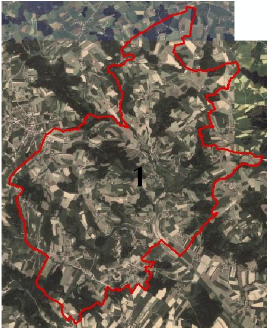
Abb. 2: Übersicht Erhebungsgebiet mit Abgrenzung der Teilgebiete und Orthofotos

Teilgebiet 1: Waldreiche, landwirtschaftlich geprägte Kuppenlandschaft