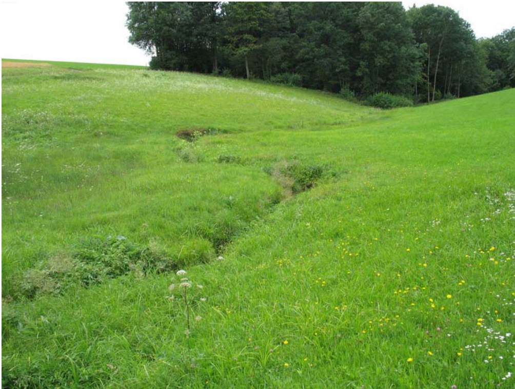
Abb. 3: Unverbauter aber gehölzloser Wiesenbach