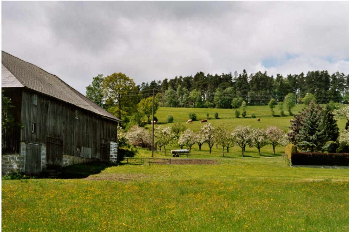
Abb. 20: Streuobstwiesnbestand in Oberlaimbach neben einem typischen Mühlviertler Hof.