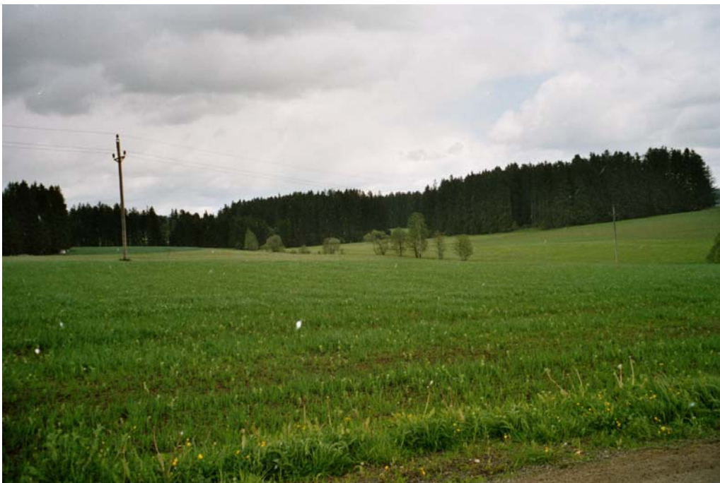
Abbildung 13: Übergangsbereiche zwischen Agrarlandschaft und großflächigem Fichtenforst in der Nähe von Weinzierl

Östlicher Randbereich des Gemeindegebietes zwischen Elmegg im Süden und Staatsgrenze im Norden, einschließlich der Weiler Weinzierl und Rading. Charakteristisch ist die Verzahnung zwischen Fichtenforstparzellen und Wiesen- bzw. Ackerparzellen.