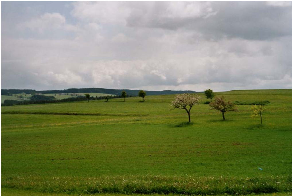
Abbildung 7: Blick von Dietrichschlag nach Südosten. Einige kleine Wiesenraine mit Baumzeilen.

Durch zahlreiche kleine Stufenraine charakterisierte Landschaft um die Weiler Schönau und Dietrichschlag. Eine Besonderheit stellen die großflächigen Streuobstwiesen in Dietrichschlag dar. Zwischen Dietrichschlag und Schönau sind zahlreiche Gehölzinsel auf flachgründigen Kuppen vorhanden.