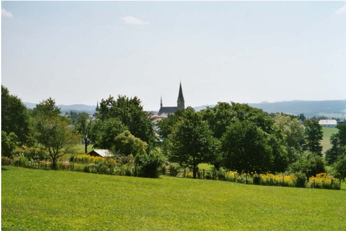
Abb. 16: Blick auf Bad Leonfelden von Unterlaimbach nach Süden. Dichte Streuobstbestände und Hausgärten am Rande des dichten Siedlungsgebietes.