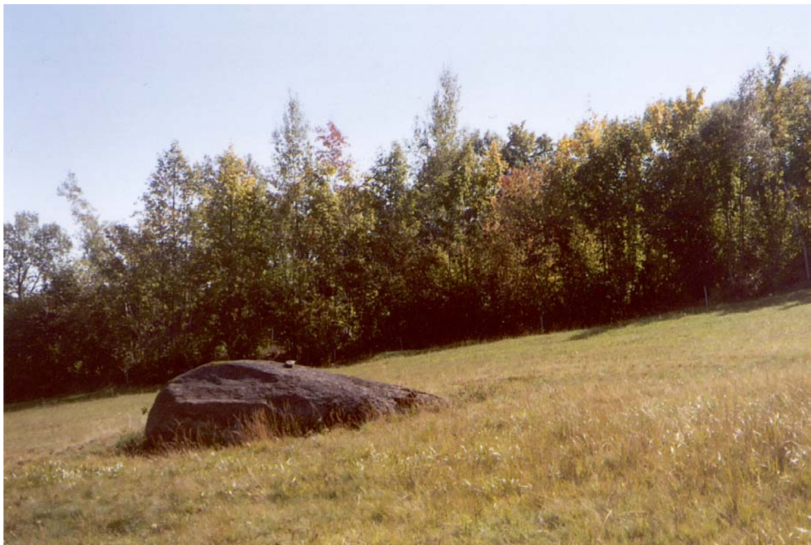
Abb. 25: Einer der letzten Granitblöcke in der Agrarlandschaft um Weigetschlag.