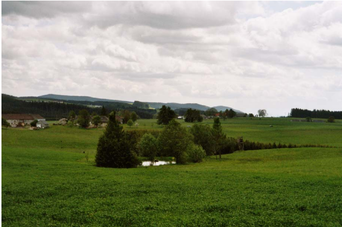
Abb. 22: Naturnah ausgestalteter Teich bei Langbruck.