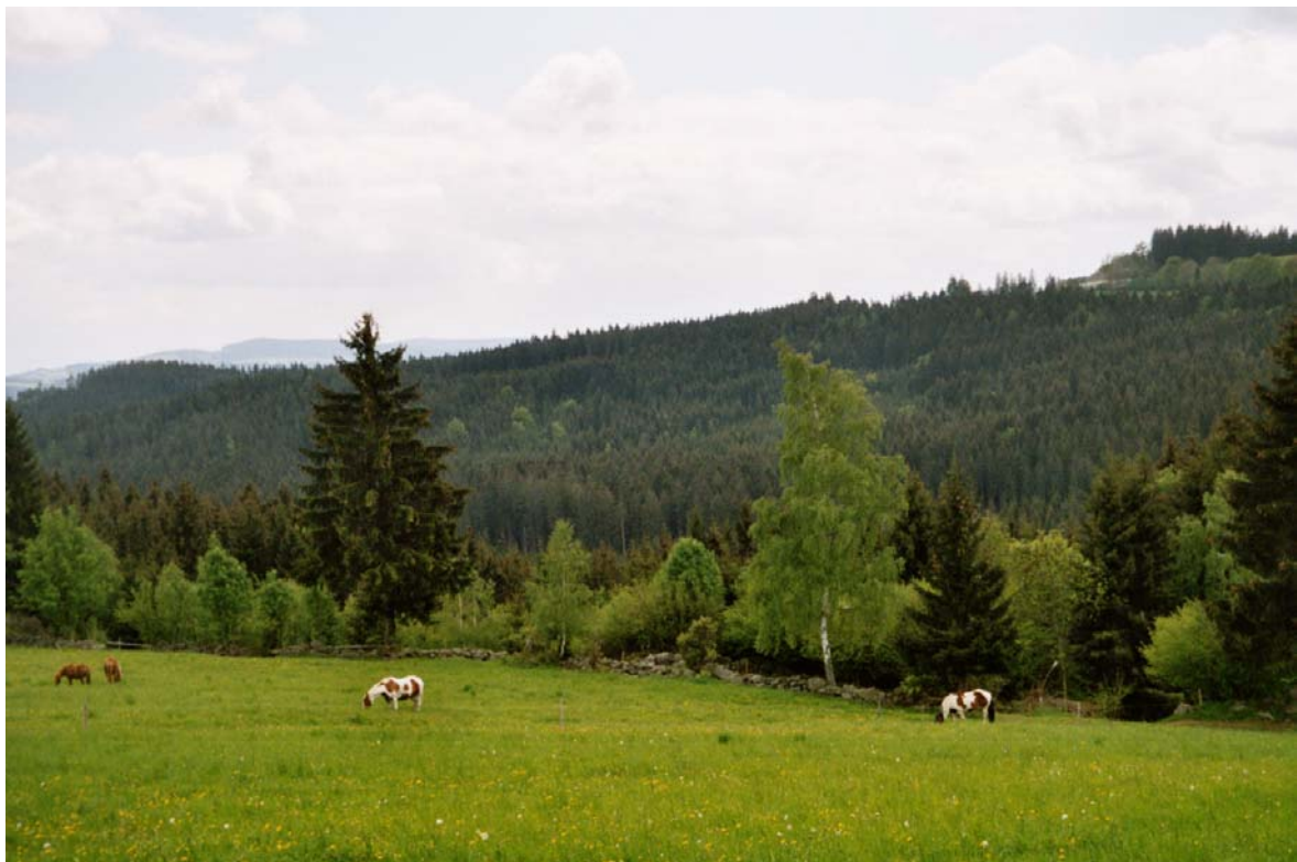
Abb. 23: Blick vom Hof Schwarzbauer Richtung Sternstein. Dichtes Waldgebiet mit nur kleinen Rodungsinseln.