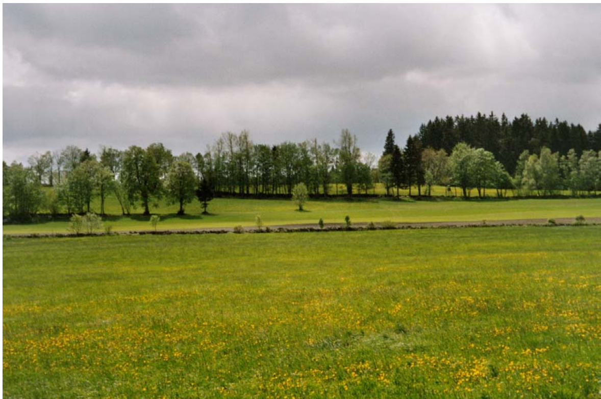
Abb 21: Baumreihen und Hecken als Strukturelemente in den Randbereichen der intensiv genutzten Agralandschaft.