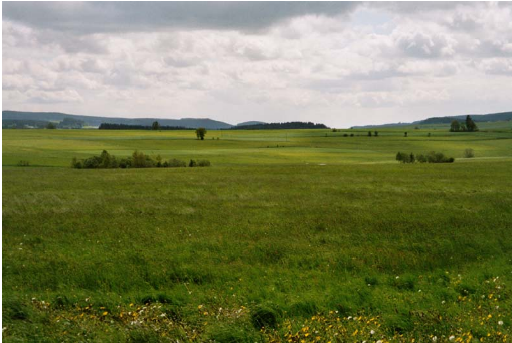
Abbildung 9: Reststrukturen wie kurze Heckenfragmente in der weitläufigen Agrarlandschaft.

Relativ strukturarme Agrarlandschaft zwischen Au im Norden und Langbruck im Süden. Nur südöstlich von Oberstifting sind auf den südexponierten Hängen magere Böschungen mit Trockenwiesenresten vorhanden.