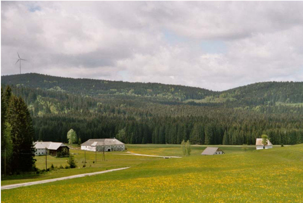
Abbildung 3: Feuchtwiesenlandschaft um den Weiler Dürnau mit den dichten Fichtenwäldern und –forsten des Böhmerwaldes im Hintergrund.

Kleinräumige Kulturlandschaft um die Weiler Dürnau, Affetschlag und Silberhartschlag. Charakteristisch sind Feuchtwiesen im Grenzbereich zur Republik Tschechien und magere, trockene Wiesen in den Kuppenlagen bei Silberhartschlag.