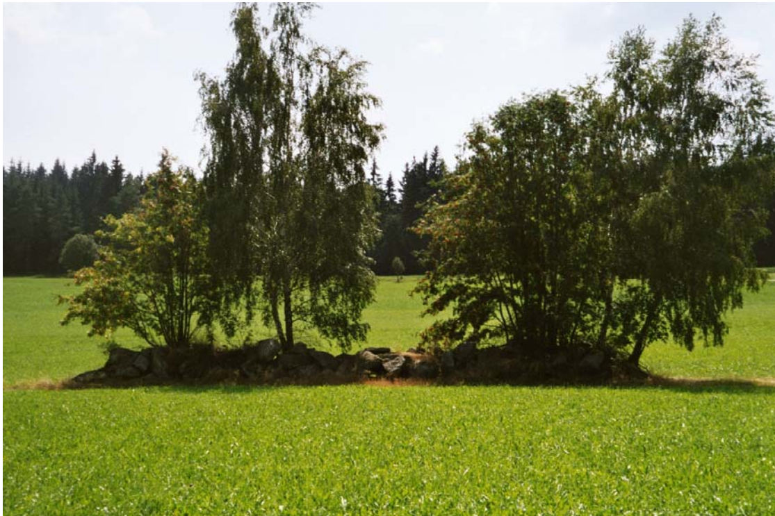
Abbildung 15: Vogelbeer-Gehölz auf einem alten Lesesteinwall bei Affetschlag..

Insgesamt wurden 64 Teiche im Kartierungsgebiet erfasst. Der weitaus überwiegende Teil dient allerdings zur Fischzucht und ist weitgehend naturfern ausgestaltet. Nur einige wenige Teiche sind durch naturnahe Ufergestaltung, zumindest in Teilbereichen und vereinzelt auch durch Wasserpflanzenbewuchs als naturnah zu bezeichnen. Besonders hervorzuheben ist der Teich mit der Nummer 17 nördlich von Langbruck.