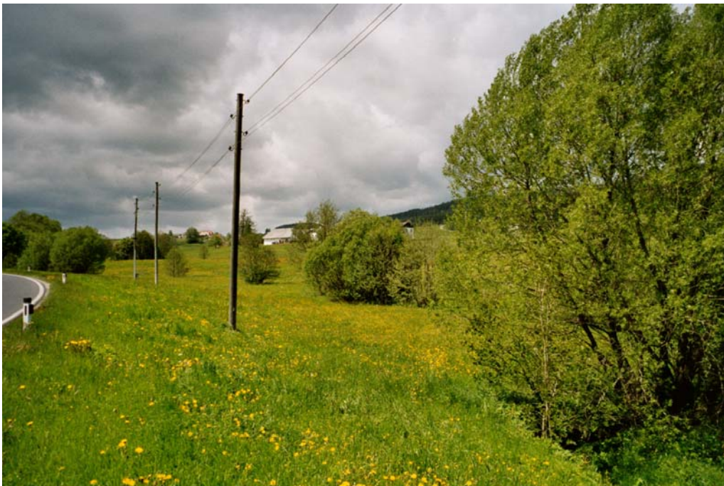
Abbildung 5: Talbodenwiese entlang des Amesschlagerbaches an der Gemeindegrenze zu Vorderweißenbach.

Talboden des Steinbaches und des Amesschlager Baches um die Weiler Haid und Spielau, einschließlich der angrenzenden Unterhänge des Sternsteins mit der Rodungsinsel um das Gehöft Unterstern. Landwirtschaftlich intensiv genutzt mit Siedlungssplittern durchsetzt. Durch die Bundesstraße nach Vorderweißenbach in zwei Teilbereiche zerschnitten. Charakteristisch sind die zahlreichen Fischteichanlagen.