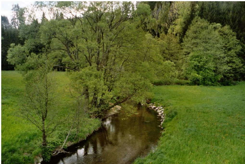
Abbildung 14: Große Rodl an der Südgrenze des Gemeindegebietes.

Die genannten Bäche weisen zumindest in Teilabschnitten naturnahen Charakter auf und wurden nur abschnittsweise begradigt.