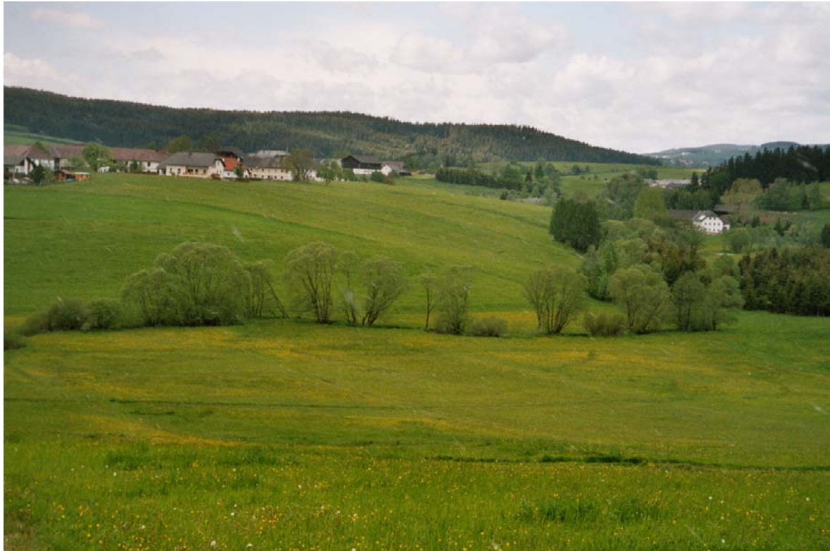
Abb. 24: Bachnahe Feuchtwiese bei Ortmühle an der Großen Rodl.