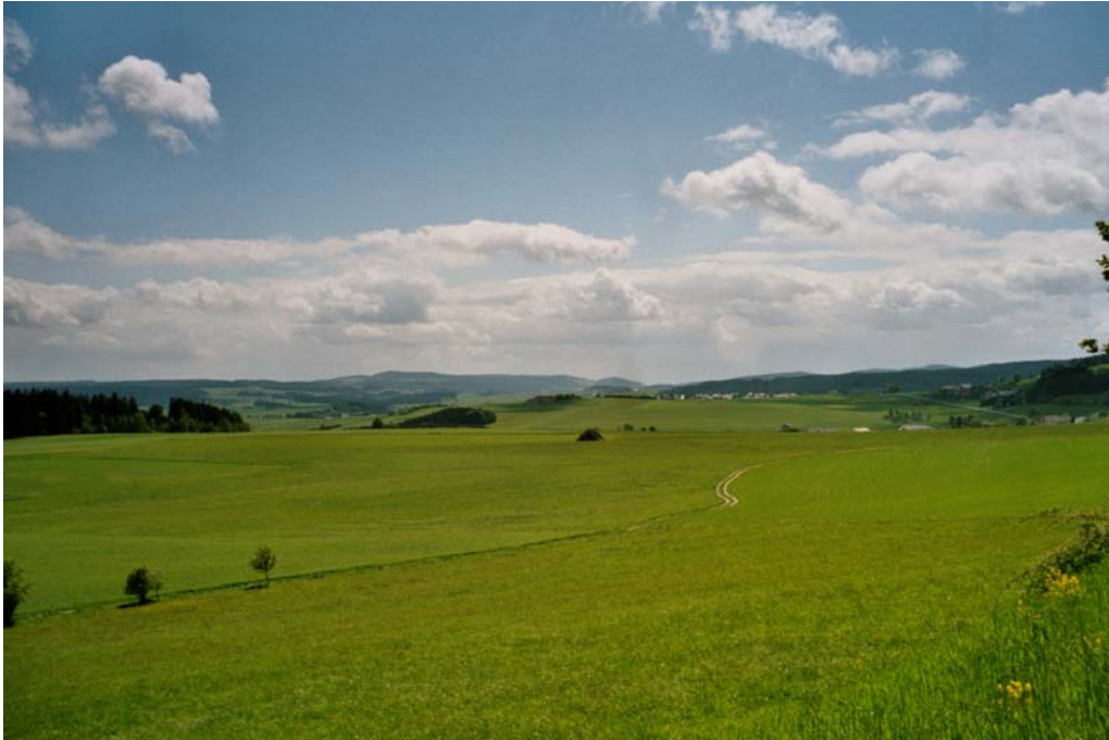
Abbildung 11: Strukturarme Agrarlandschaft. Blick von Rading Richtung Bad Leonfelden.