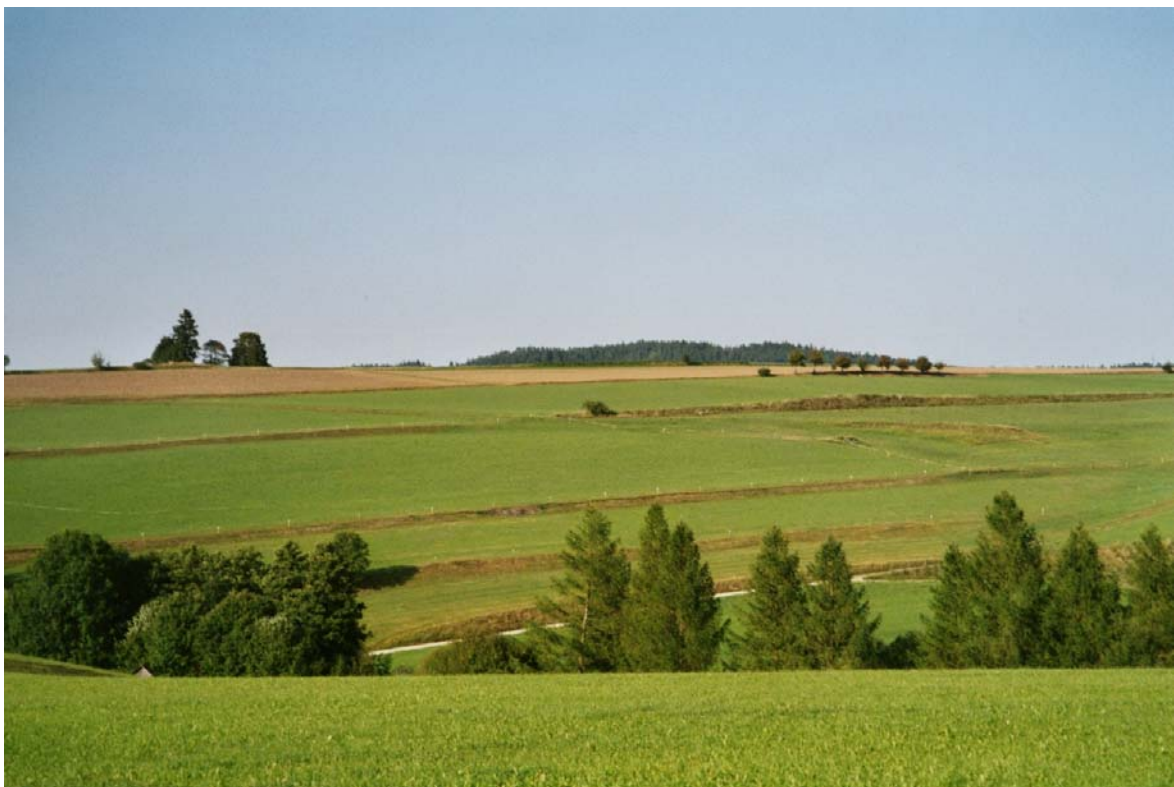
Abb. 17: Reste einer Stufenrainlandschaft mit zum Teil noch magerer und trockener Wiesenvegetation.