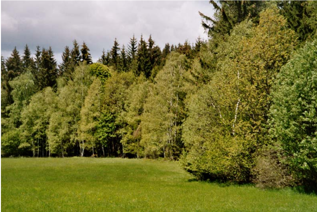
Abbildung 6: Laubgehölzsaum als Randstruktur zu den großflächigen Fichtenforsten.