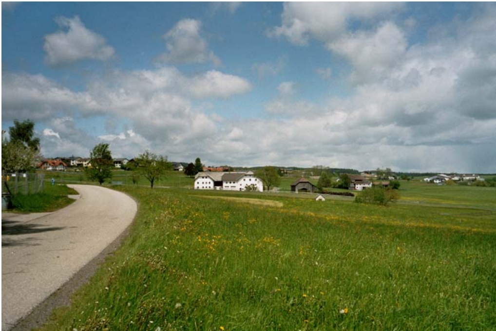
Abbildung 10: Südlicher Rand des zentralen Siedlungsgebietes von Bad Leonfelden mit Übergängen zur Agrarlandschaft.

Zentraler Siedlungsbereich des Gemeindegebietes inklusive der Siedlungsachsen nach Süden mit den Weilern Ober- und Unterstiftung und dem Weiler Unterlaimbach im NW des Teilgebietes. Nur in den Randbereichen des geschlossenen Siedlungsgebietes ist noch landwirtschaftliche Nutzung vorhanden.