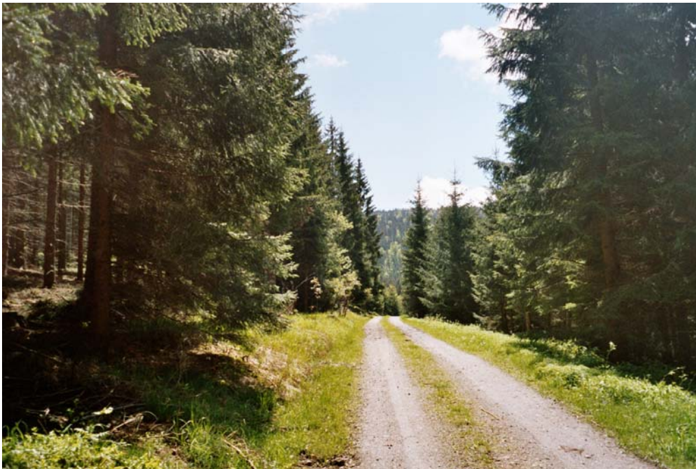
Abbildung 4: Forststraße von Dürnau in das Teilgebiet (Nr.2)