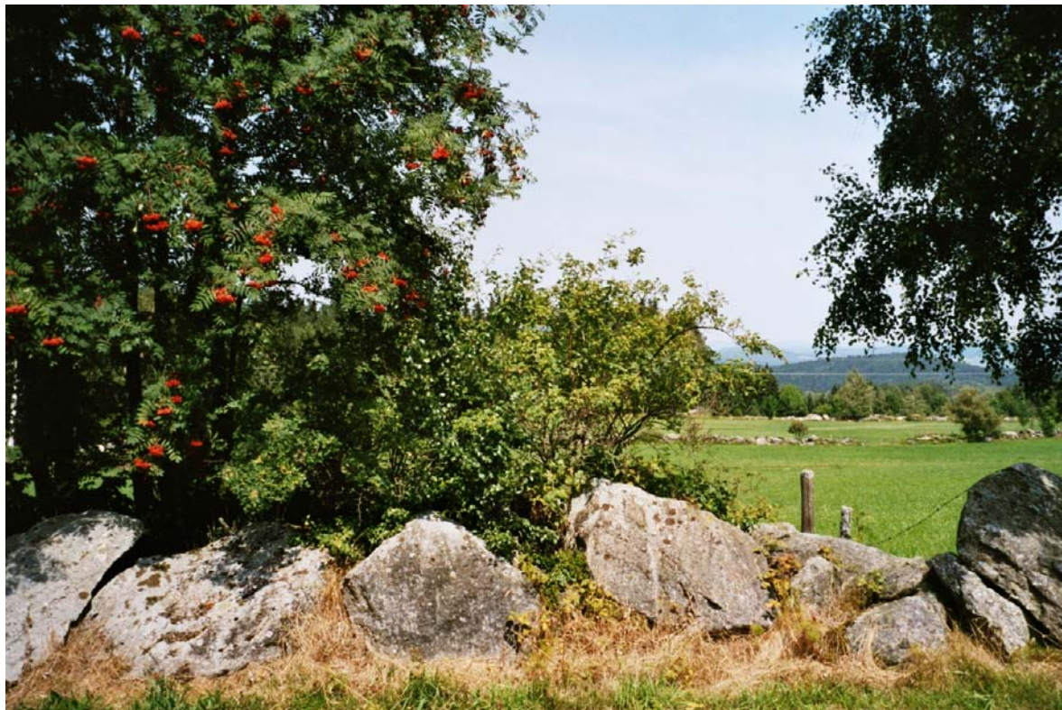
Abb. 18: Kleinteilige Wiesenlandschaft mit zahlreichen Lesesteinwällen westlich von Weigetschlag.