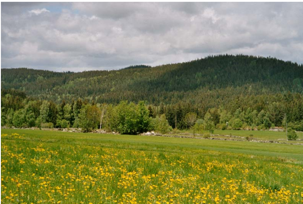
Abbildung 12: Lesesteinwälle nördlich der Straße von Weigetschlag nach Affetschlag. Abschnittsweise mit kurzen Vogelbeerhecken.

Kleinteilige Agrarlandschaft zwischen Böheimschlag und der Staatsgrenze zu Tschechien, die sich durch zahlreiche Lesesteinwälle auszeichnet. Einige dieser, aus Granitblockresten gebildeten Wälle sind mit dichten Vogelbeerhecken bestockt.