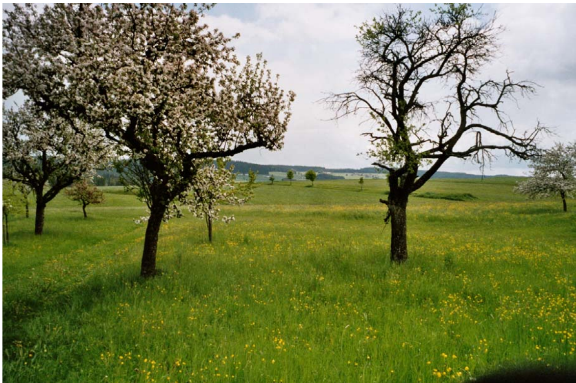
Abb. 19: Streuobstwiesenbestand am Ortsrand von Dietrichschlag.