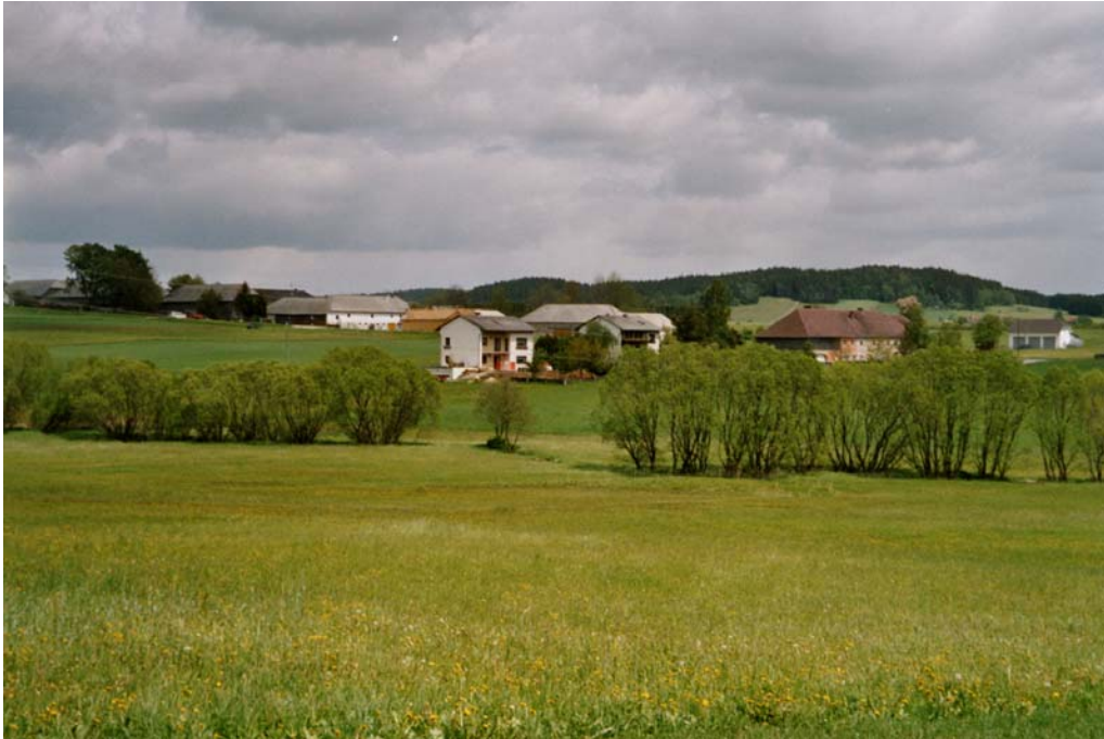
Abbildung 8: Uferbegleitgehölz des Steinbaches bei Dietrichschlag. Im Vordergrund vernässte Talbodenwiesen mit Niedermoorresten.