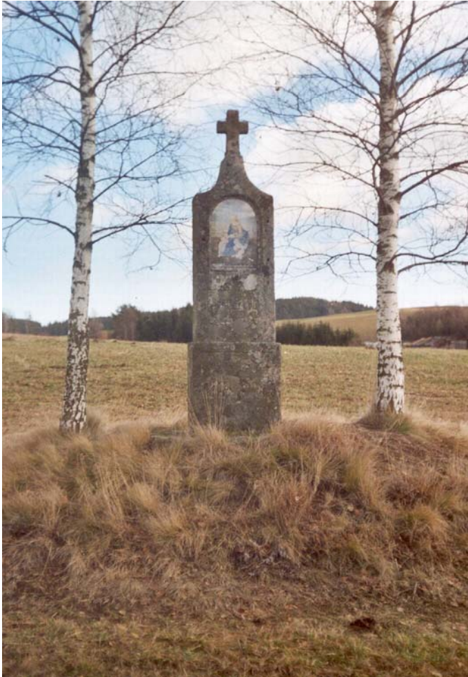
Abbildung 1: Bildstock an einem Wiesenweg bei Oberstifting.