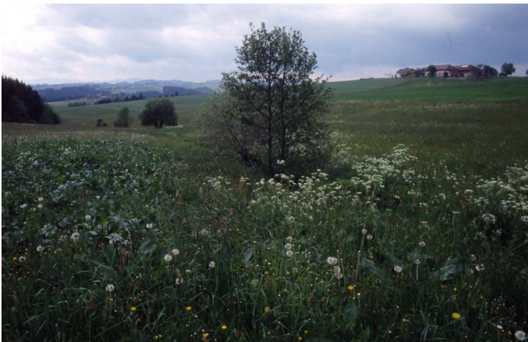
Abb. 6: Unverroht gebliebener Wiesenbachabschnitt beim Mairhofer, ein zu erhaltendes Landschaftselement laut ÖPUL 2000.