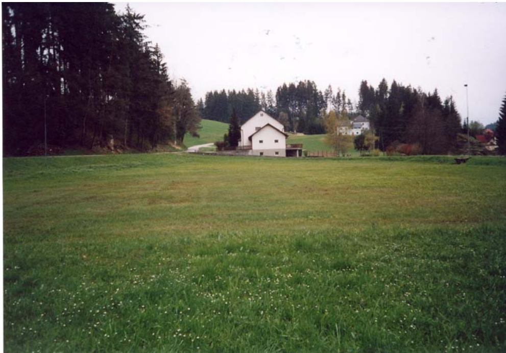
Abb. 10: Die wohl wertvollste Wiese Aubergs dient im Winter als Eisstockplatz; Feuchtwiese unter der Teufelmühle.