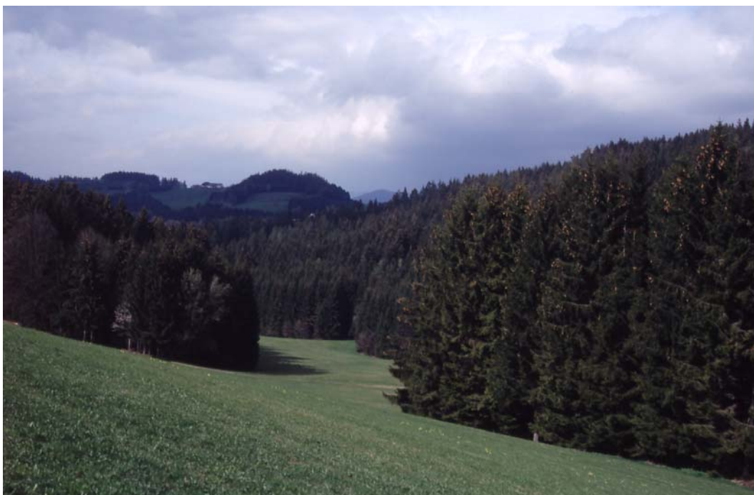
Abb. 4: Fichtenforste ohne jeglichen Laubholzsaum. Die Verzahnung Wald-Kulturland ist aus ökologischer Sicht positiv; beim Grillenberger.