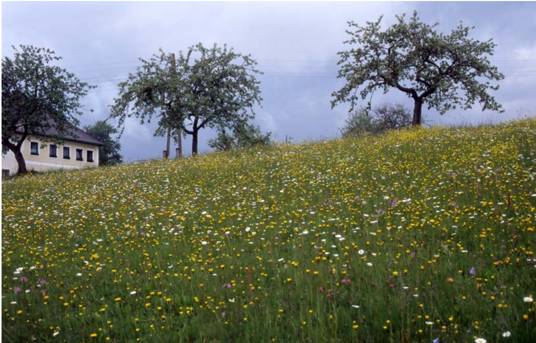
Abb. 7: Ertragsarme, extreme Blumenwiese in Marbach, u.U. durch Baulandwidmung gefährdet.