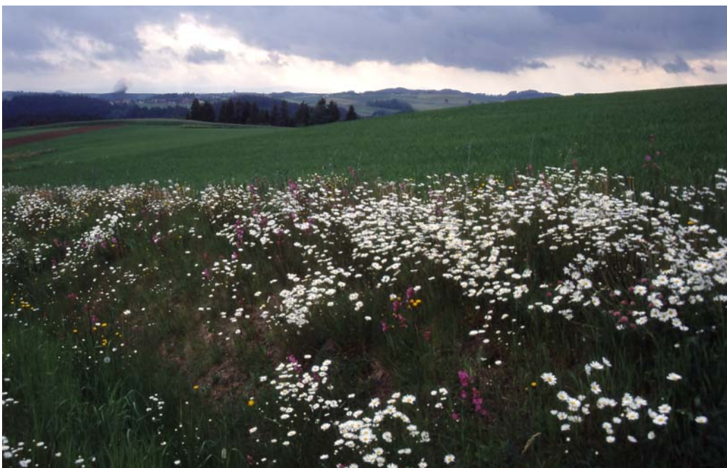
Abb. 8: Blumenreiche Straßenböschung am Ortsende von Marbach.