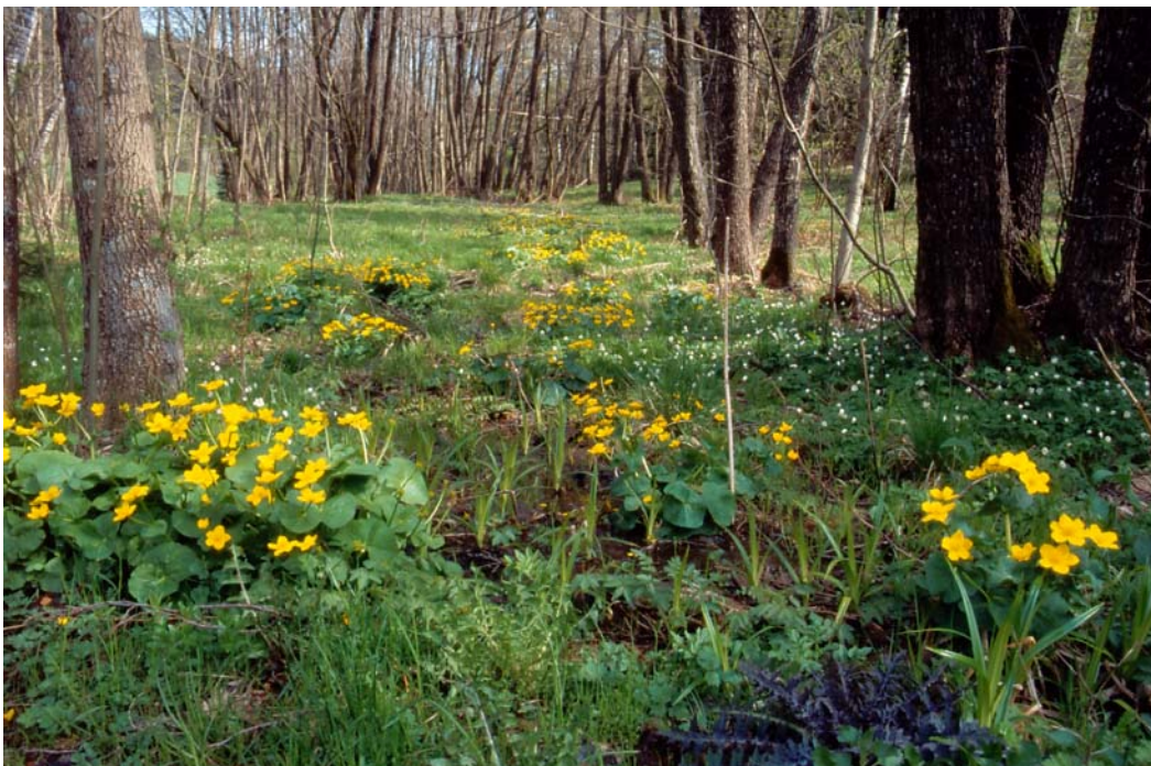
Abb. 2: Sehr naturnaher Eschen-Erlen-Sumpfwald beim Frei bzw. unter den Leitenhäusln / St. Peter.