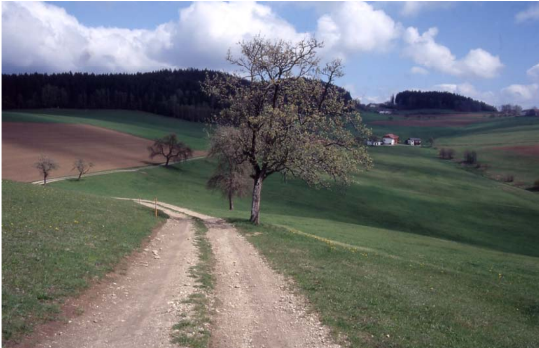
Abb. 3: Blick vom Grillenberger zum Freihäusl: ansprechende Landschaftsgliederung durch Flurbäume.