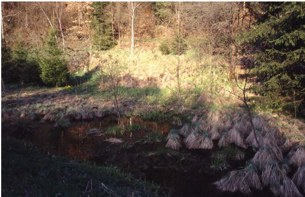
Abb. 1: Aufforst- und zuschüttgefährdeter Seggensumpf oberhalb Schönbergmühle; auf angrenzender Straße Amphibien-Todesstrecke.