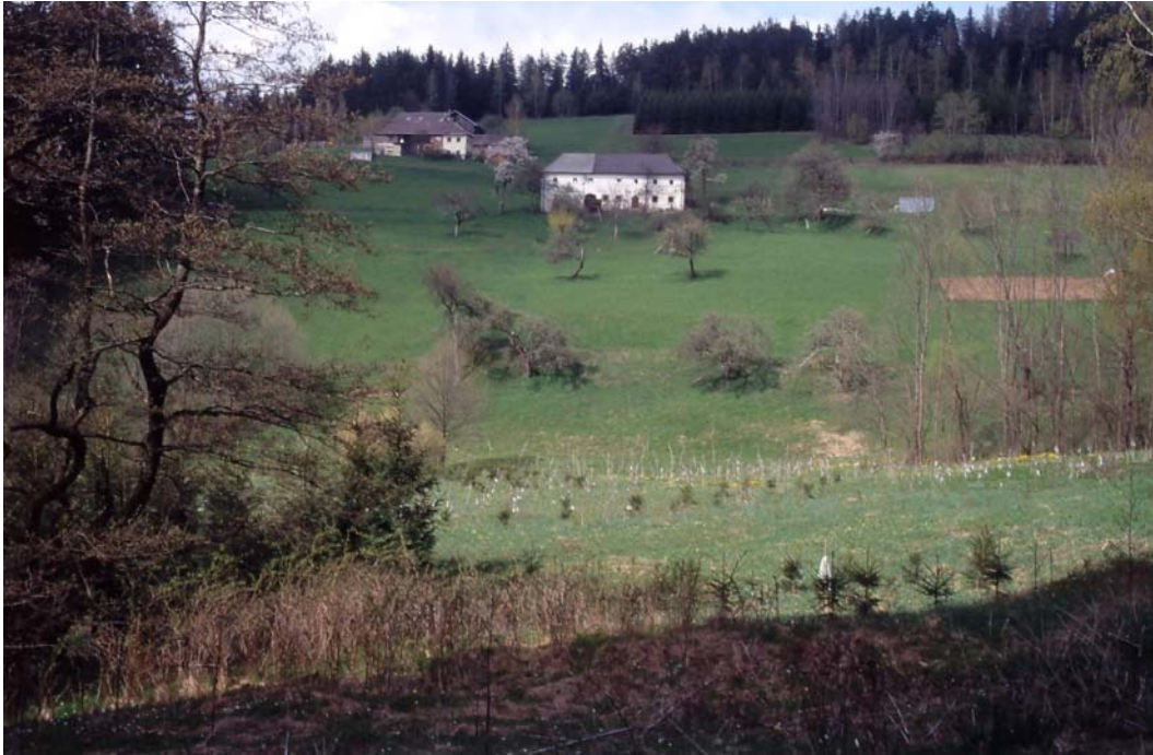
Abb. 5: Ursprünglich höchstwertiger Landschaftsausschnitt bei den Leitenhäusln von St. Peter. Die Aufforstung der Auburger Feuchtwiese im Vordergrund entspricht nicht den ÖPUL-Vorgaben zu Erhalt und pfleglichem Umgang mit Landschaftselementen.