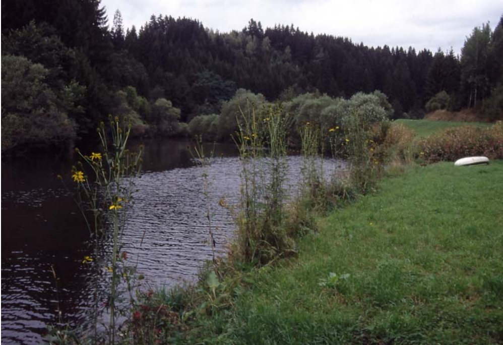
Abb. 9: Der gelbe Sonnenhut und das lila-, rosa- oder weißblühende Drüsige Springkraut sind erst in jüngerer Zeit bei uns heimisch geworden und können alteingesessene Uferpflanzen verdrängen; bei der Bachmüllerbachmündung.