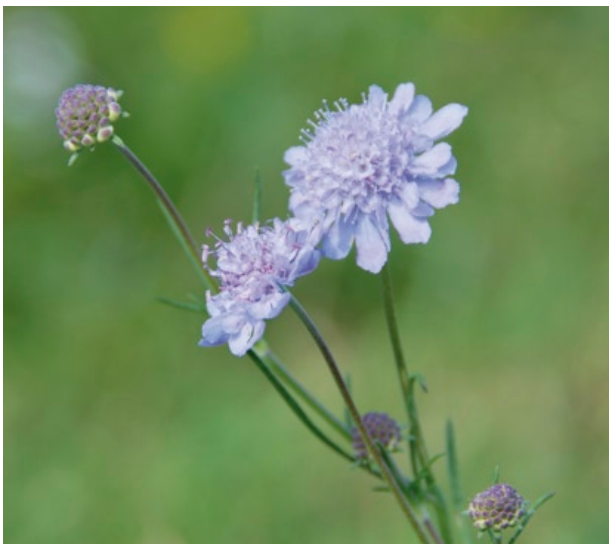
Typischer Blütenkopf der Grauen Skabiose. Die Randblüten sind zu Schaublüten vergrößert.

In der Blütezeit zwischen Mitte Juli und Anfang Oktober haben die Blütenköpfe einen Durchmesser von 15–25 mm. Die Blüten-Hüllblätter sind oval-lanzettlich, 4–6 mm lang und etwa um \frac{1}{3} bis \frac{1}{2} kürzer als die Blüten. Ein wichtiges Merkmal sind die, die einzelnen Blüten umgebenden Kelchborsten, welche mit 1–3 mm Länge etwa 2 bis 2,5 mal länger sind als der Außenkelch. Diese Borsten sind am Grunde 0,1–0,2 mm breit, rund, gelblich und an den Spitzen oft braun.