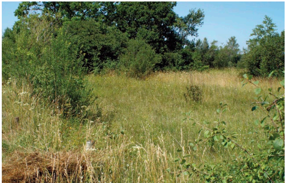
Scabiosa canescens kann eine Zeit lang in brach gefallenen Flächen und Säumen überleben, wird aber durch zunehmendes Aufkommen von Gehölzen bedroht (Foto: Wolfgang von Brackel).

bzw. des Verhaltens von Brachezeigern genau zu beobachten.