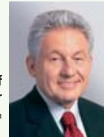
Dr. Josef Pühringer Landeshauptmann