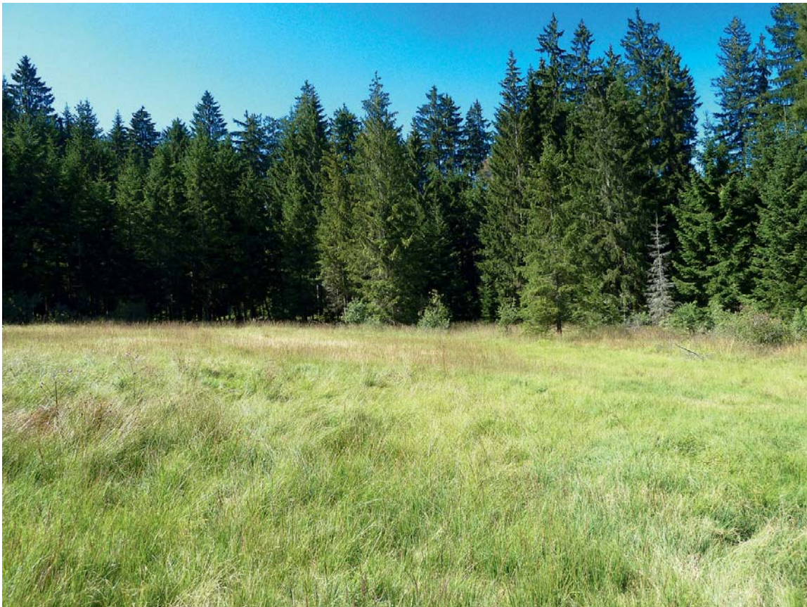
Abb. 3: Die an Poaceen feucht nasser und trockener, störungsarmer Standorte lebende Bodenwanze Ichnodemus sabuleti wird erstmals für Oberösterreich gemeldet. Probeflächen in der Semmelau: im Vordergrund die einmähdige Probefläche SE-F (Pfeifengraswiese) mit Blick auf die ungenutzte Fläche SE-M (degradierter Hochmoorrest) im Hintergrund.