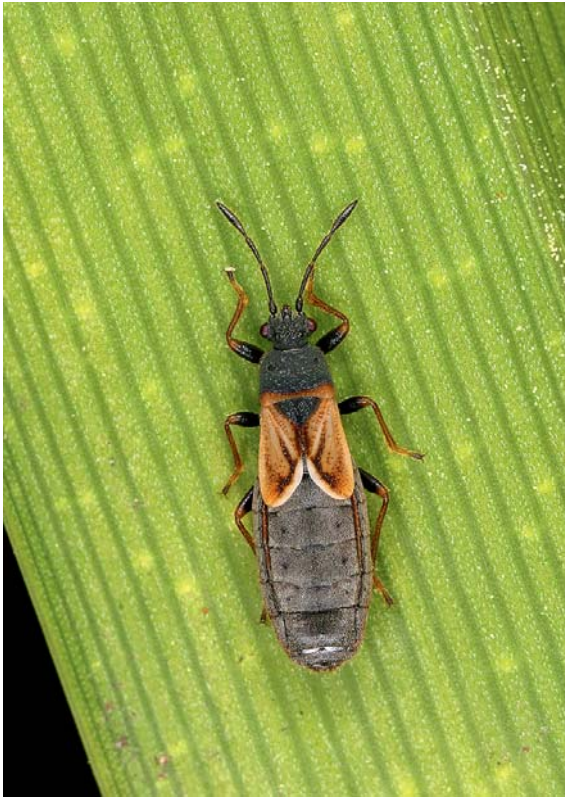
Abb. 6: Die an Poaceen feucht-nasser und trockener, störungsarmer Standorte lebende Bodenwanze Ischnodemus sabuleti wird erstmals für Oberösterreich gemeldet.