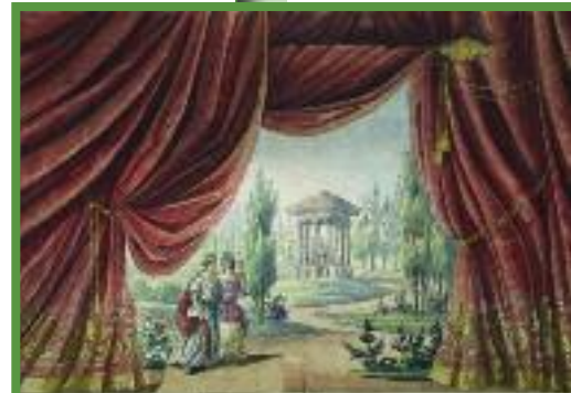
Franz Gebel, Schluß-Courtine No. 37 . Verwendet für „Othello“, Linz 12. Juli 1853

Ausstellungsdauer: 11. April bis 14. Juli 2013