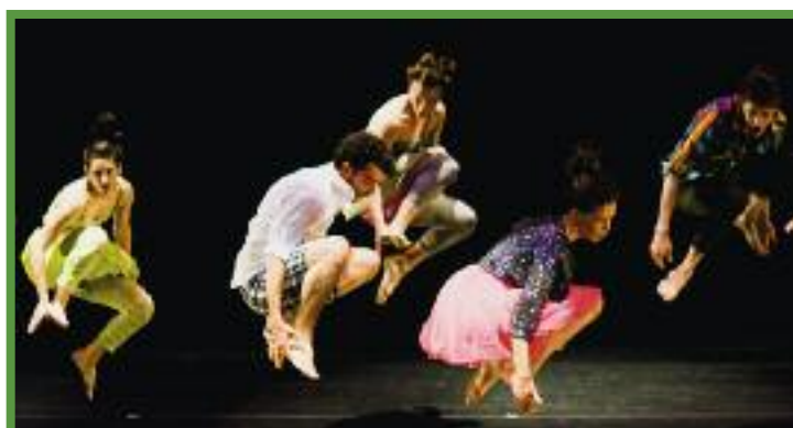
Reduktion der Mittel und kreative Fülle versus Spektakelkunst: Gallim Dance

mittag der Straßenlärm der Big City in die Euphorie der Proben mischt. Man kann sich auch vorstellen, dass eine junge Compagnie außer ihrem Können gar nicht die Mittel hat, um mehr Kostüme oder gar ein Bühnenbild einzukaufen. Man kann sich also vorstellen, dass freie Produzierende auf der ganzen Welt diesen Umständen auseinandersetzen