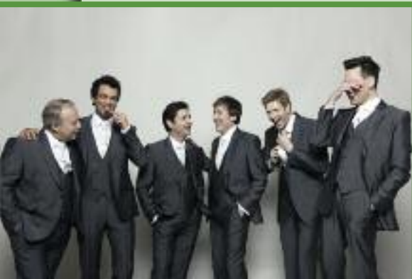
The King's Singers laughing

Meisterwerke der Kammermusik sind bekannten heimischen Ensembles übertragen, insbesondere ist das Konzert mit Musikern hervorzuheben, welche 40 Jahre lang zum unverwechselbaren Profil der Stiftskonzerte beigetragen haben. Im Einklang mit dem barocken