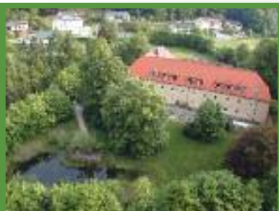
20 Jahre Biologiezentrum Linz