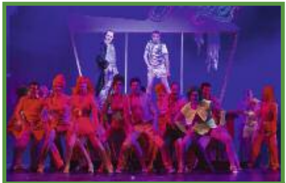
Szene des spektakulären „Tanzes mit dem Teufel“ im Musical „Die Hexen von Eastwick“