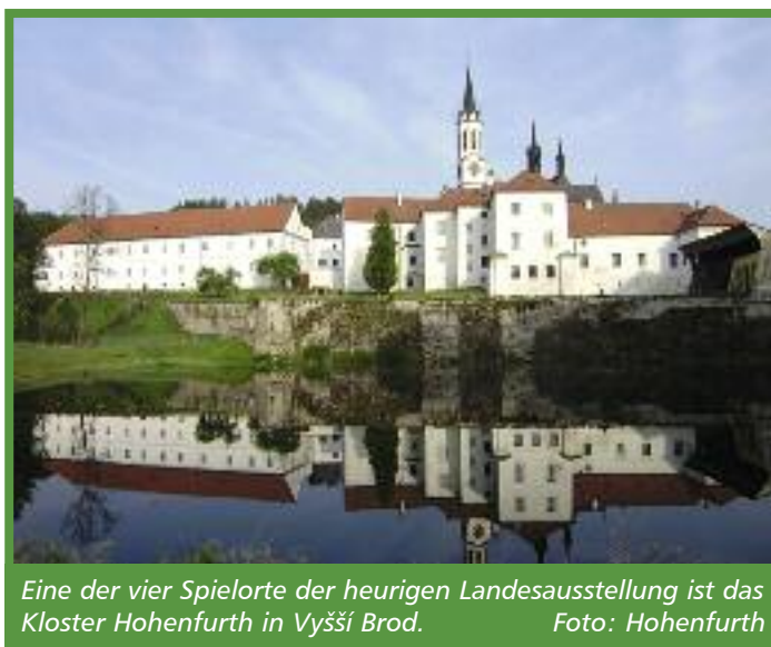
Eine der vier Spielorte der heurigen Landesausstellung ist das Kloster Hohenfurth in Vyšší Brod.

Die gegenseitige Wertschätzung, das einander Kennenlernen und das voneinander Lernen ist, wie auch bei vorangegangenen grenzüberschreitenden Landesausstellungen, ein besonderer Aspekt dieser Großveranstaltung. LH Dr. Josef Pühringer meint zu dieser Thematik: „Die Landesausstellung verfolgt auch das Ziel, Barrieren in den Herzen und Köpfen der Menschen auf beiden Seiten der Grenzen zu beseitigen und die Kultur als Brückenbauer einzusetzen.“ Mit der grenzüberschreitenden Landesausstellung „Alte Spuren. Neue Wege“, den vier Ausstellungsorten, dem flankierenden Kulturprogramm mit mehr