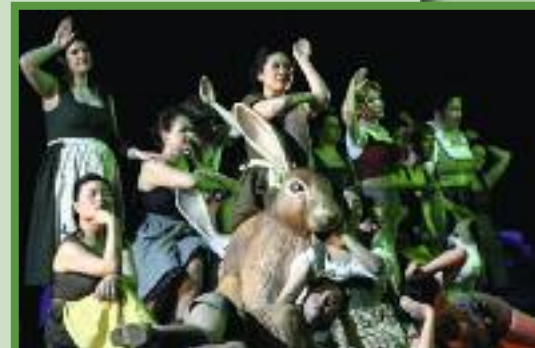
Stimmenstarker Chor- und Extrachor in „Spuren der Verirrten“

Bildstark. Den entscheidenden Anteil am Erfolg dieser monumentalen Produktion hat der erfahrene Regisseur David Pountney, der aus seiner überreichen und erprobten Phantasie schöpfen konnte. Denn der Text lässt ihm viel freien Raum zur Entfaltung bildstarker und abwechslungsreicher Passagen. Es entstand ein repräsentatives Musiktheater, das sinnvoll und aussagestark von Robert Israel (Bühne) und Anne Marie Legenstein (Kostüme) unterstützt wurde und ein bewegungsreiches, detailverliebtes Bild auf die Riesenbühne stellte. Ein tragender Teil am Gelingen ist auch dem Ballett-Ensemble (Choreographie: Amir Hosseinpour) zuzurechnen, welches mit den oft abgehackten, maschinell wirkenden Bewegungen und Figuren ein sinnsuchendes Zeit-Raum-Gefühl vermitteln.