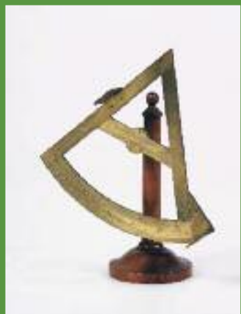
Sextant, E. 19. Jh.

Ausstellungsdauer: 8. Mai bis 25. August 2013, Innovationsecke in der Sammlungspräsentation „Technik Oberösterreich“, Schlossmuseum Linz