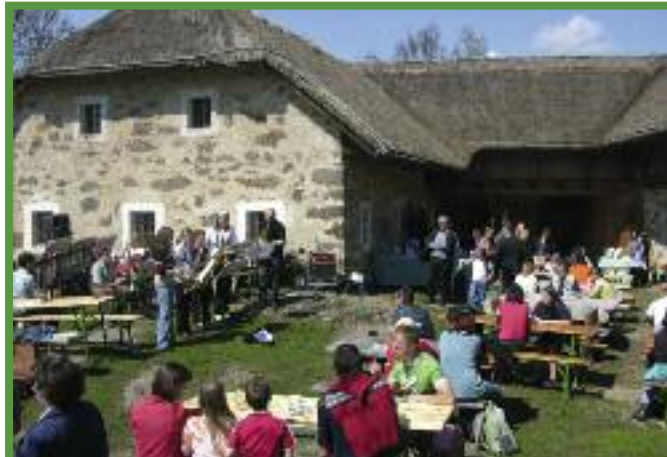
OÖ. bietet eine vielfältige Museumslandschaft mit zahlreichen Veranstaltungen. Hier im Großdöllnerhof.

pos erinnern: Im Schlossmuseum Freistadt und in der Rathausarkade wird der Film „Freistädter erinnern sich“ gezeigt, in dem Freistädter über ihre Geschichte in Freistadt im 20. Jht. erzählen. Das OÖ Schulmu-