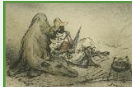
Alfred Kubin, Wüstenforscher, um 1930

Ausstellungsdauer: 8. Mai bis 11. November 2013, Raum Bibliothek und Grafische Sammlung, Schlossmuseum Linz