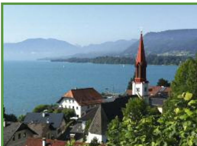
Blick auf die evangelische Martinskirche in Attersee.

Die evangelische Pfarrgemeinde Attersee nutzt das 200jährige Jubiläum, um die Geschichte der Pfarre aufzuarbeiten, gleichzeitig aber auch, Einblicke in das Leben der Pfarre heute zu geben. Eine Ausstellung im Heimathaus Attersee zeigt ab 29. Mai 2013 (Eröffnung 19 Uhr) „200 spannende Jahre für Jung und Alt“. Das eigentliche Festwochenende beginnt am Freitag, 7. Juni 2013 mit dem Kabarett „Unter uns im Attergau“, am Samstag, 8. Juni 2013 folgen Festakt (ab 15 Uhr) in der Attergauhalle und ein Festkonzert mit den Singfonikern in der Kirche (20 Uhr). Abgeschlossen werden die Feierlichkeiten mit einem Festgottesdienst am Sonntag, 9. Juni 2013, 9 Uhr. „Es soll ein großes Fest werden, ein Fest für alle Menschen in der Region“, wünscht sich Pfarrerin Gabriele Neubacher.