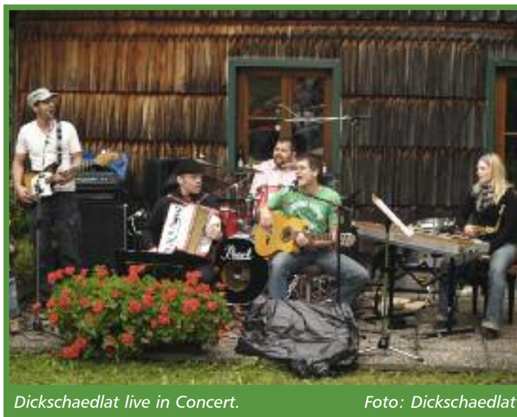
Dickschaedlat live in Concert.

Nähere Infos sowie Hörproben: www.dickschaedlat.at