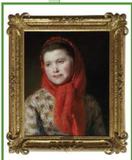
Johann Baptist Reiter, Mädchen mit rotem Schal, Privatbesitz