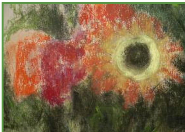
Detail aus einem Blumenbild von Margret Bilger.

„Kreativ am Vormittag. Malen, Singen, Spielen mit Sophie Bründl“ am 24.8. im Bilger-Breustedt-Haus. Weitere Infos unter www.bilger-breustadt.at