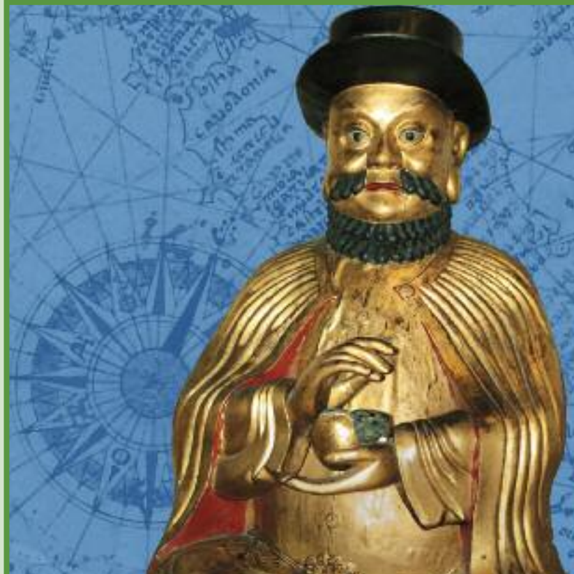
Kopie der Statue des Marco Polo, die einst im Tempel der 500 Götter in Kanton verehrt wurde, anonymen chinesischen Künstler, 19. Jh.