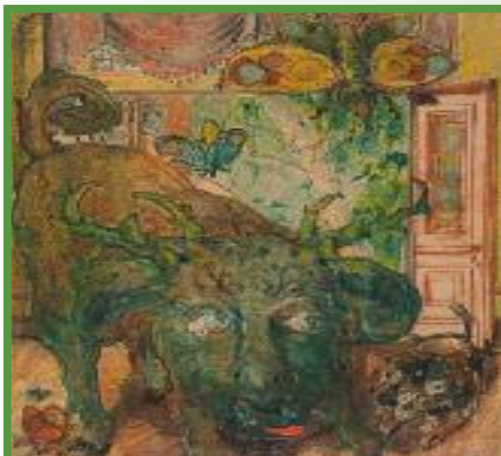
Franz Karl Bühler (Pohl), Ohne Titel , um 1909 – 1916, Fettkreide, gewischte und lavierte Kreide auf Zeichenpapier , 41,4 x 31,9 cm