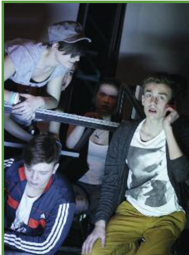
Gedichte und Veränderungen im intensiven Stück „Das Heldenprojekt“ in den Kammerspielen.

Partei hat sich breit gemacht, die mit ihren simplen Parolen die Plakatwände der Stadt beherrscht. Das lädt na-