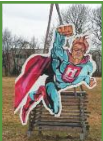
Eine Comic-Interpretation von Johann Hoffelner.

Informationen: www.galeriehoffelner.at bzw. Tel. 0699/14764719 (Herr Johann Hoffelner). Die Galerie ist jeden Samstag von 10 Uhr bis 16 Uhr oder nach Vereinbarung geöffnet. Elisabeth Mayr-Kern