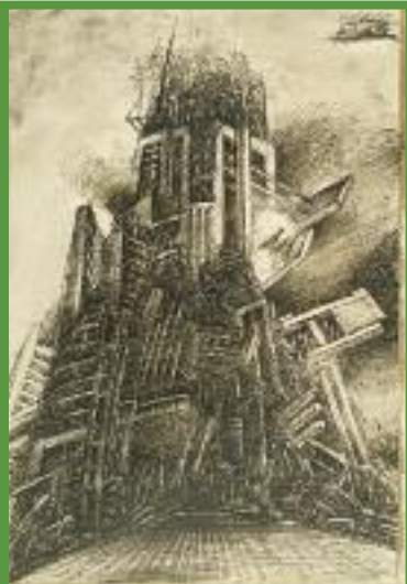
Othmar Zechyr, Synekdochische Stadt (Katastrophaler Austritt) , 1981

Dienstag, 28. Mai 2013, 19.00 Uhr, Landesgalerie Linz