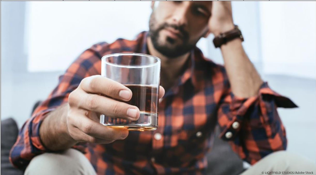
Grafik 4: Alkohol und soziales Umfeld: Etwa fünf Prozent berichten über Probleme mit einer Person im gleichen Haushalt, die durch Alkohol verursacht wird.