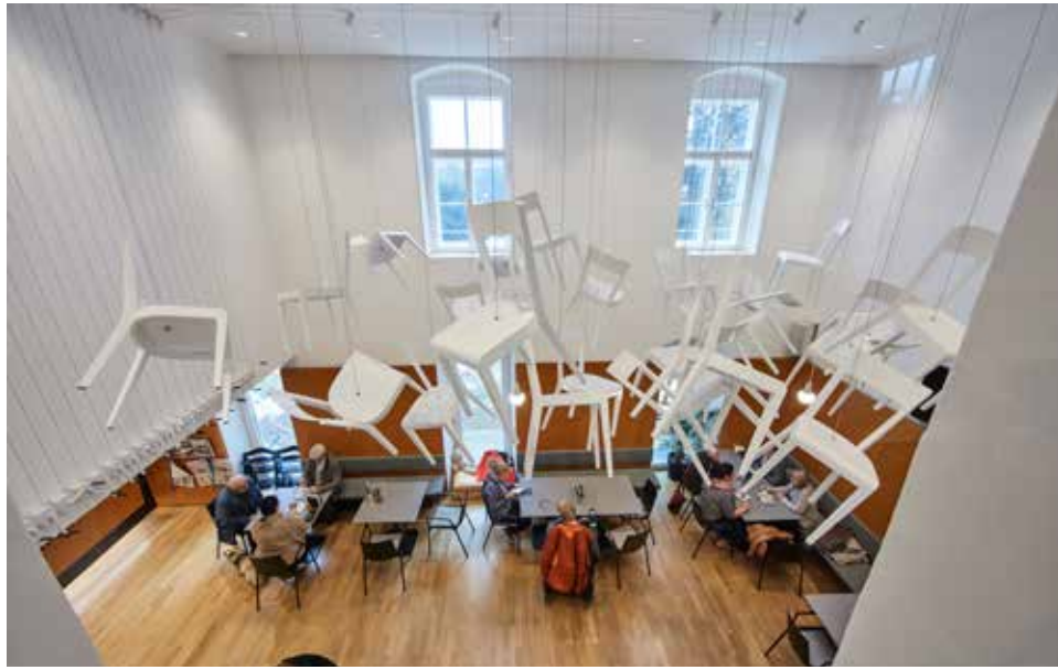
Andreas Strauss