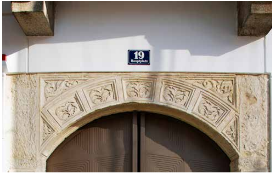
Karl Heinz Klopf