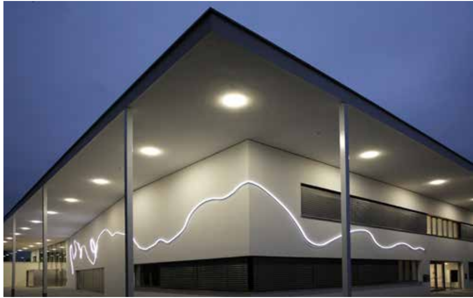
Iris Andraschek/Hubert Lobnig