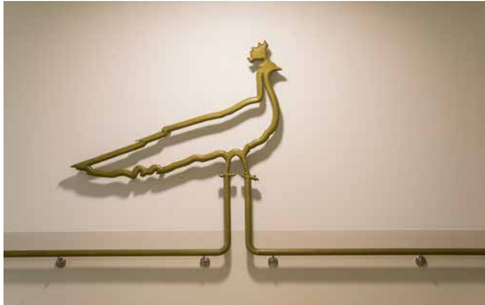
Anita Selinger