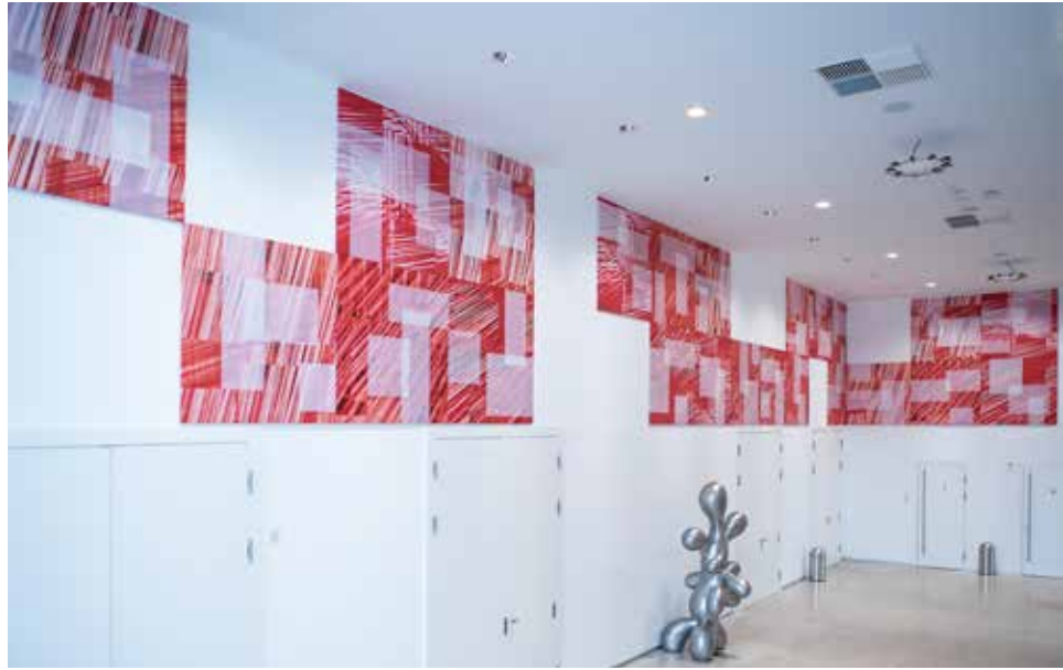
Ingrid Tragler