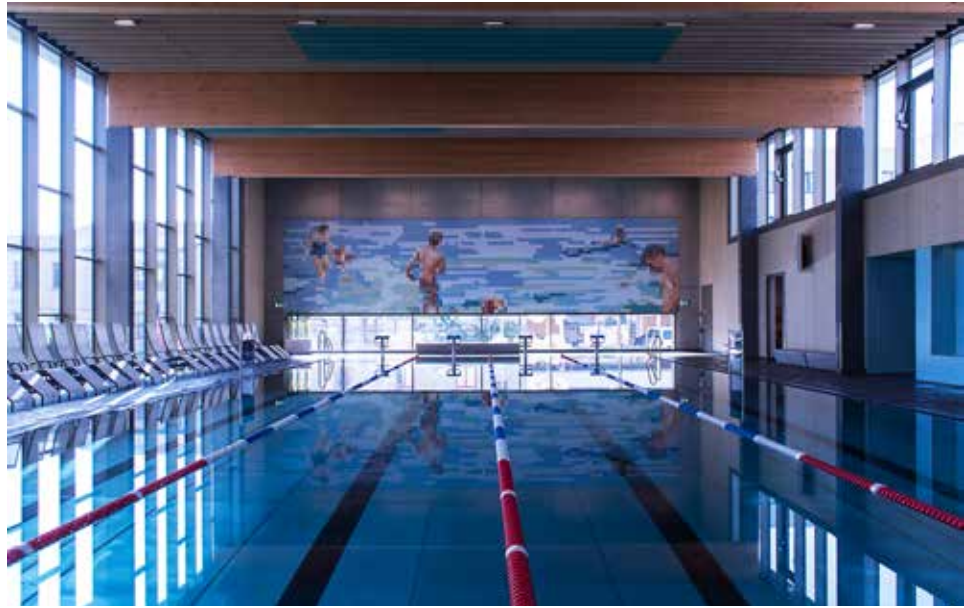
Hanna Kirmann