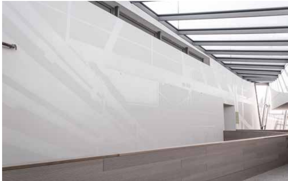
Gabriele/Alois Hain; Iris Andraschek/Hubert Lobnig