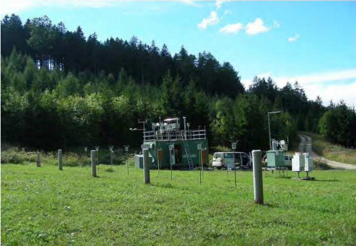
Station Zöbelboden, Aufnahmedatum 22.8.2007