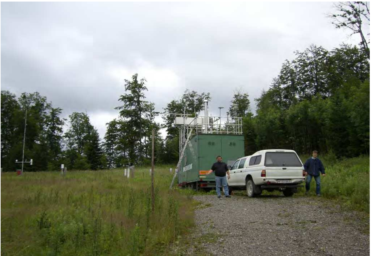
Station Zöbelboden, Aufnahmedatum 12.7.2007