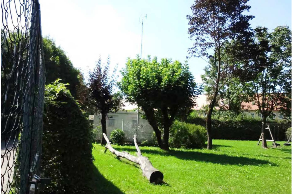
Station S409 Steyr, Ansicht Richtung Westen, Aufnahme 3.8.2012