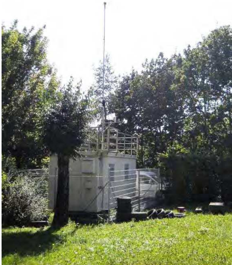
Station S409 Steyr, Ansicht Richtung Süden, Aufnahme 19.9.2016