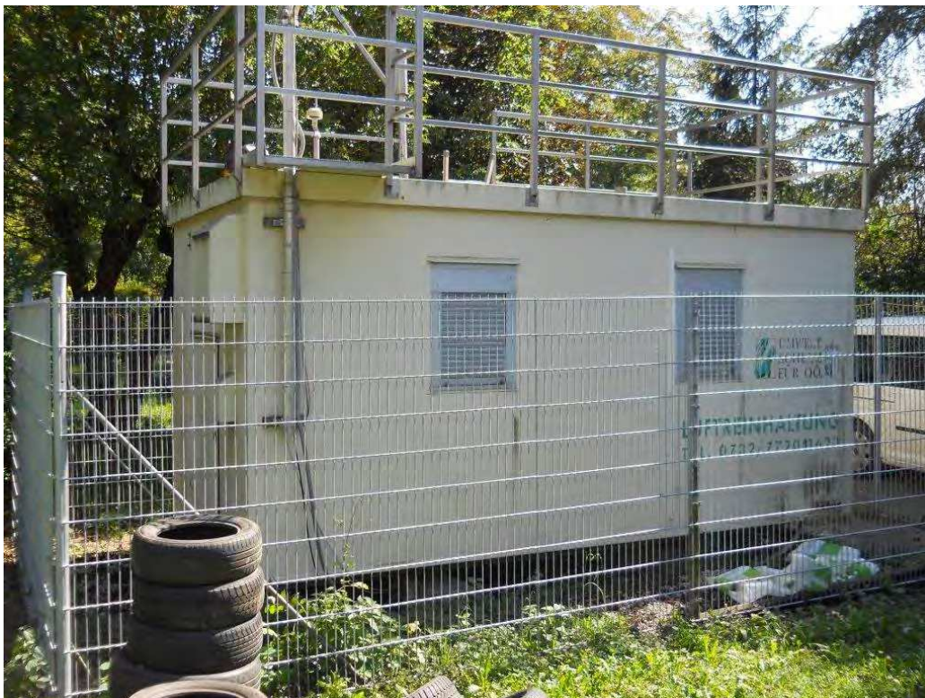
Station S409 Steyr, Ansicht Richtung Südosten, Aufnahme 19.9.2016