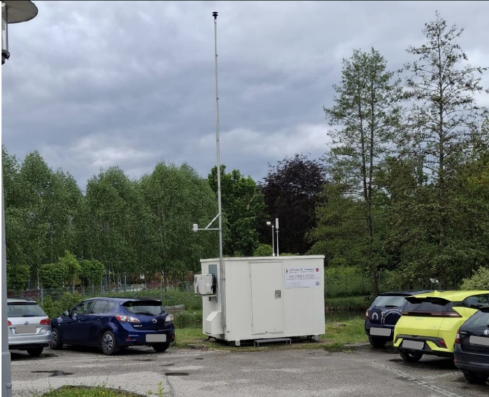
Aufnahmedatum: 19.05.2026 in Richtung Südwest