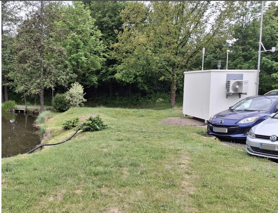
Aufnahmedatum: 19.05.2026 in Richtung West bis Nordwest