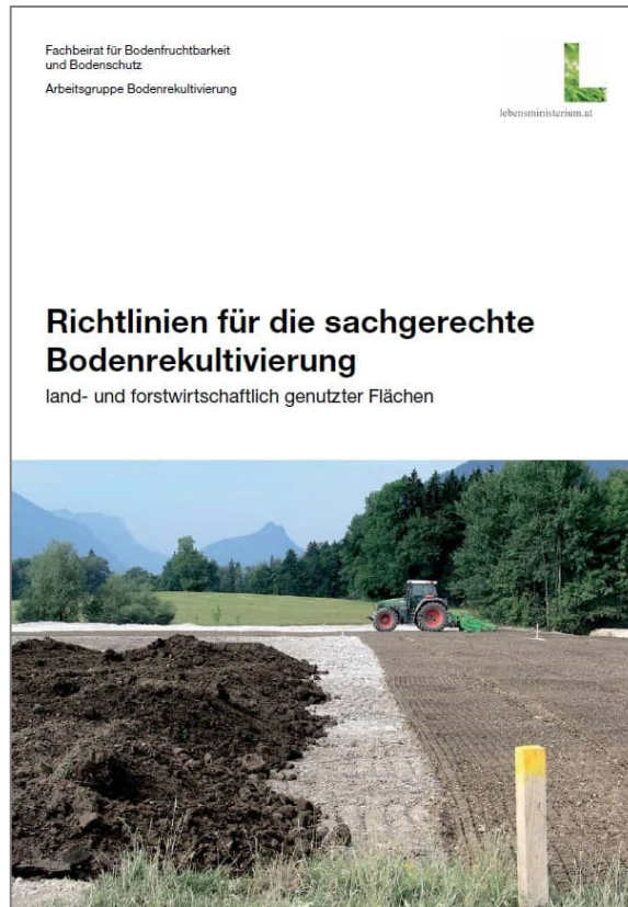
Abbildung 1: Anwendungsbereich der Richtlinie