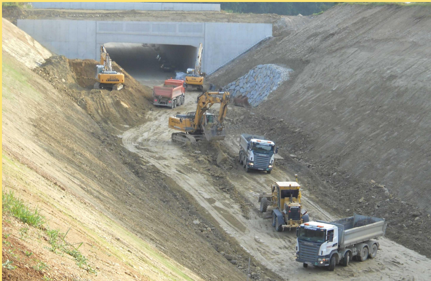
(Abb.: Arbeiten bei der Grünbrücke Födermayr)