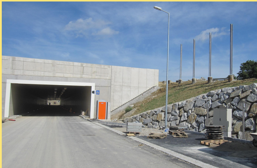
(Abb.: Grünbrücke Metz)

Die Fundamente für einen Salzsilo sowie einen Solesilo in der Nähe von Volkersdorf wurden bereits ausgeführt.