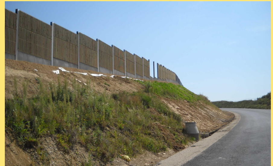
(Abb.: Lärmschutzwand am Rabenberg)

Der Verkehr läuft bereits über die beiden Kreisverkehre und die neu errichtete Autobahnbrücke.