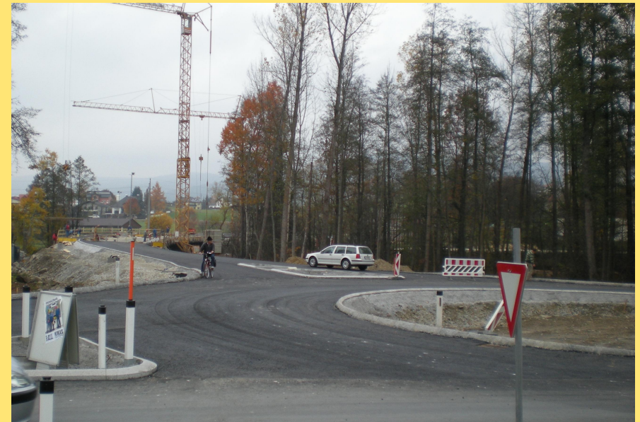
(Abb.: Kreisverkehr Hauptstraße)

Das Baulos beginnt von Rohrbach kommend beim Bahnübergang der ÖBB (Bahnlinie Linz/Urfaahr – Aigen/Schlägl), folgt auf eine Länge von zirka 700m dem Bestand der B127, verlässt diese in einem Rechtsbogen, quert die bestehende B127 in Form eines Kreisverkehrs, quert die Große Mühl mittels Brücke und endet im Bereich der Einmündung der Odenkirchner Straße, wo es mittels Kreisverkehr an die bereits errichtete Umfahrung Aigen anschließt.