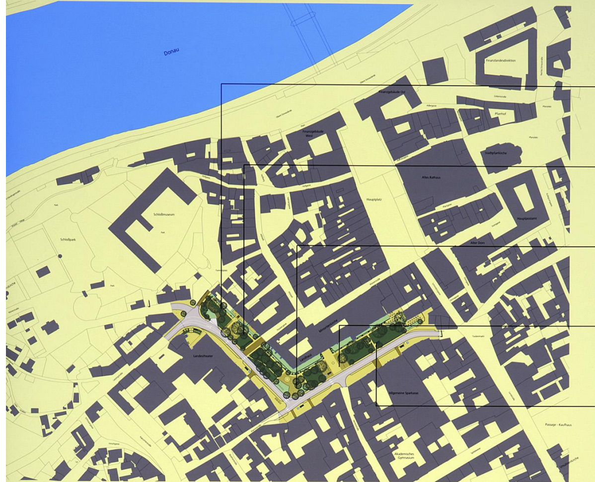
#1 Lageplan | M 1: 1000