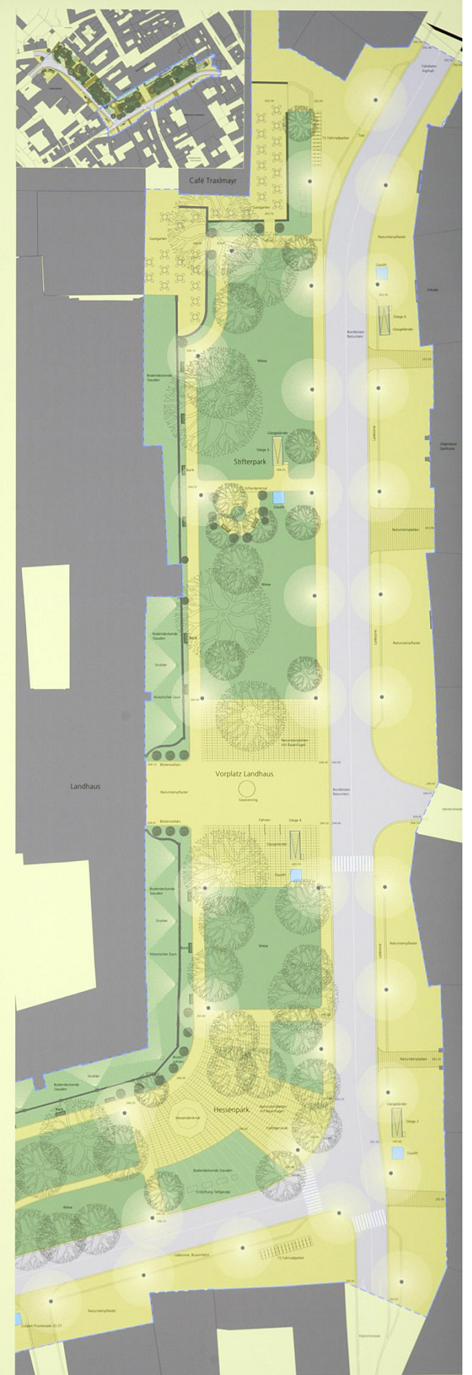
#4 Freiraumgestaltung Ostteil | M 1: 200