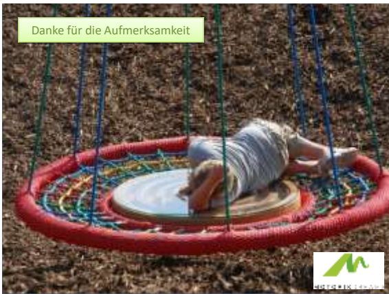
Danke für die Aufmerksamkeit