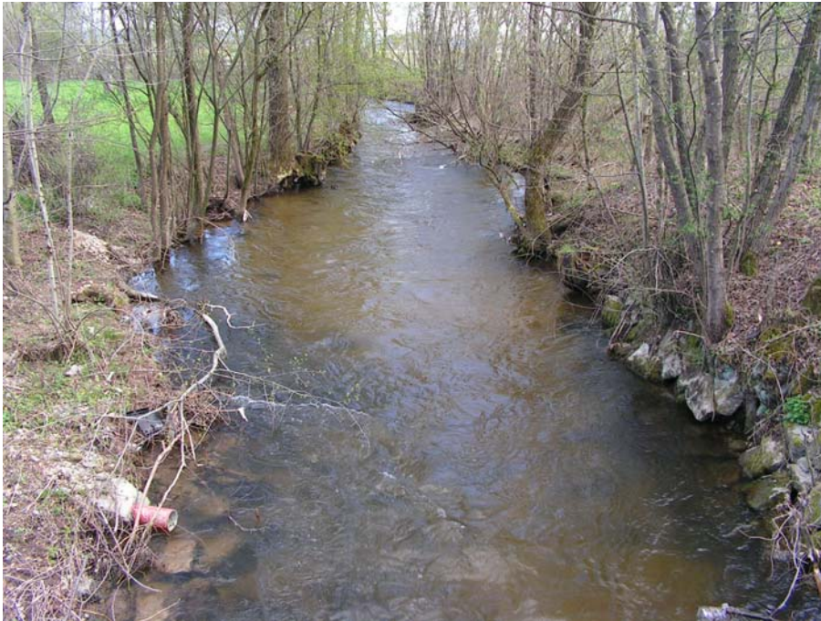
Foto 19003: Der Schwemmbach unterhalb (nördlich) von Mattighofen.