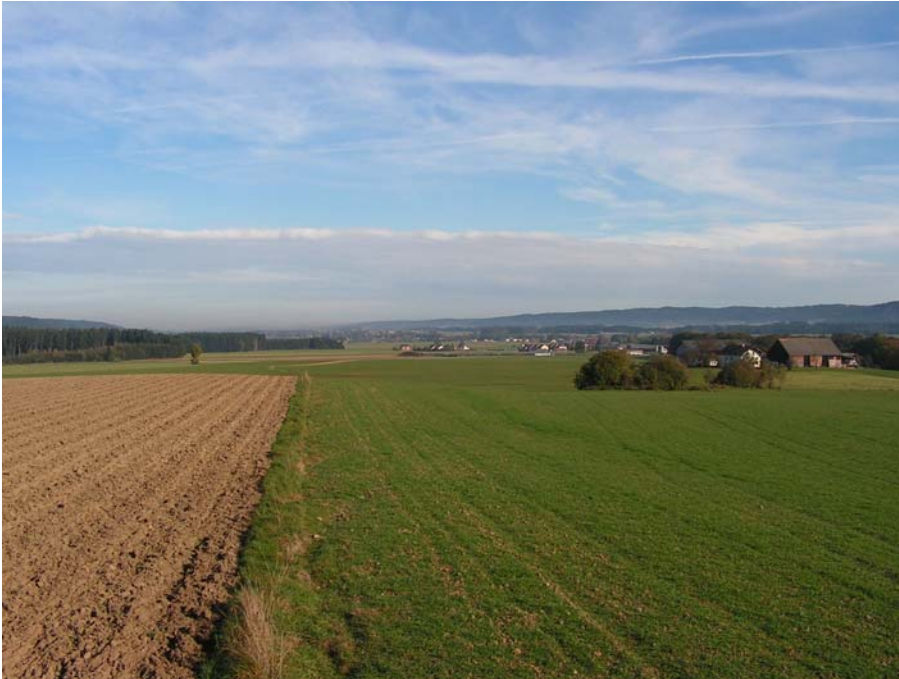
Foto 19001: Blick auf die Raumeinheit von Süden (Jeging) nach Norden.