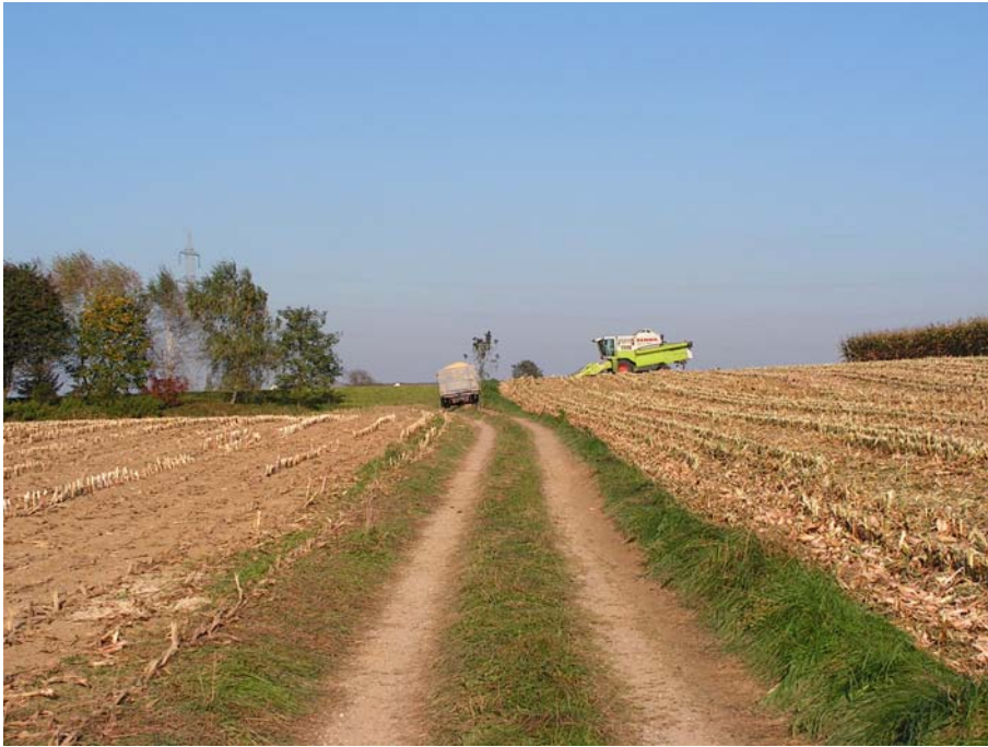
Foto 19005: Intensiver Ackerbau in der Nordhälfte der Raumeinheit.