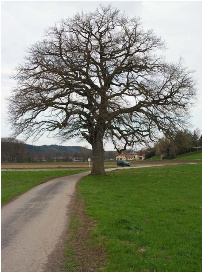
Foto 19010: Landschaftsprägender Einzelbaum südöstlich von Pfaffstätt.