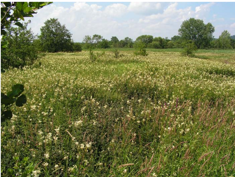
Foto 19006: Hochstaudenflur im Hochwasserrückhaltebecken Teichstätt.