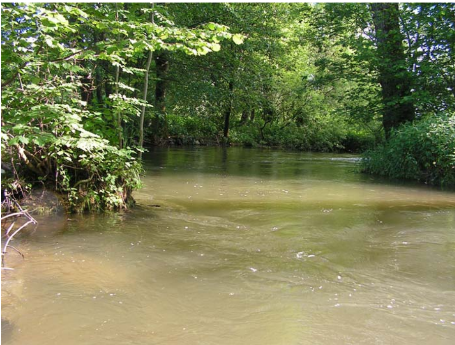
Foto 19002: Natürlicher Verlauf der Mattig bei Pfaffstätt.