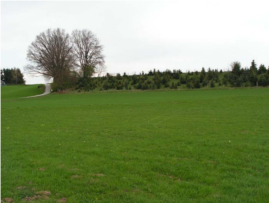
Foto 19007: Terrassenkante im Osten der Raumeinheit, zum Teil mit junger Fichtenaufforstung.