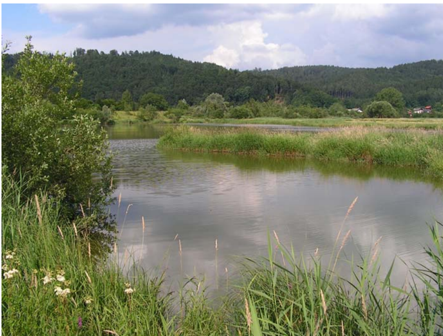
Foto 19004: Stillwasserbereich im Hochwasserrückhaltebecken Teichstätt.