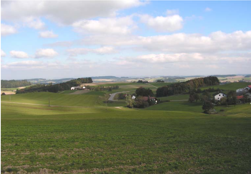
Foto 13001: Die typische Landschaft der Raumeinheit – ein Blick aufs Rieder Becken....