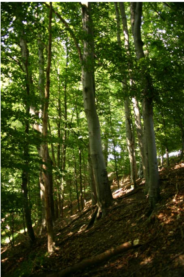
Foto 13006: Buchenwald bei Irringsdorf (nördlich der Pram).