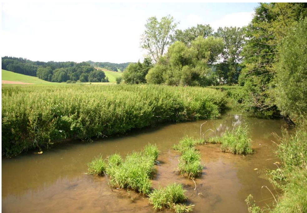
Foto 13008: Leithenbach im Bereich des Naturschutzgebietes „Koaserin“.