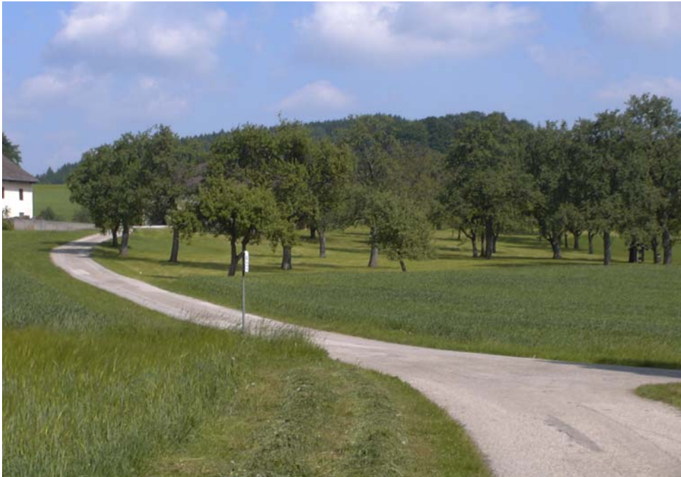
Foto 13005: Einer der für die Raumeinheit so typischen Streuobstwiesenbestände.