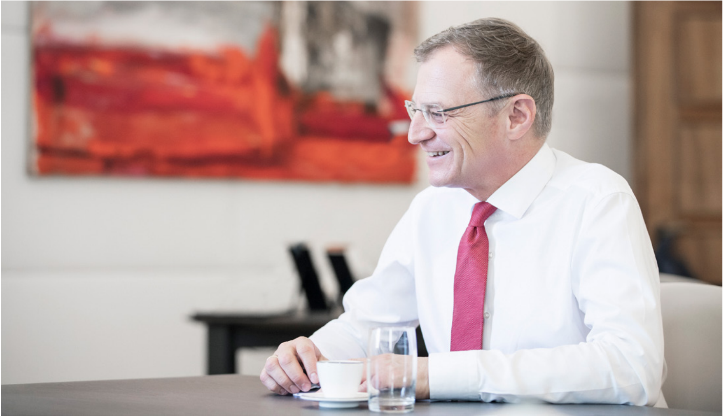
Finanz-Ref. LH Mag. Thomas Stelzer.

LH Stelzer: „Diese Zahlen sind ein klarer Beleg dafür, dass sich unser Weg auszahlt.“