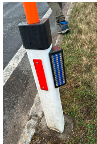
Entlang der L1511 Herzogsdorfer Straße, der L1512 Haslacher Straße und der L1513 Niederwaldkirchener Straße wurden akustische und optische Wildwarner installiert.

Die Anschaffung und Montage der Wildwarner erfolgte in enger Kooperation zwischen der Jagdgesellschaft Niederwaldkirchen, dem Landesjagdverband und dem Land. „Diese partnerschaftliche Zusammenarbeit stellt einen wichtigen Beitrag zur regionalen Verkehrssicherheitsarbeit dar“, betont Infrastruktur-Landesrat Mag. Günther Steinkellner.