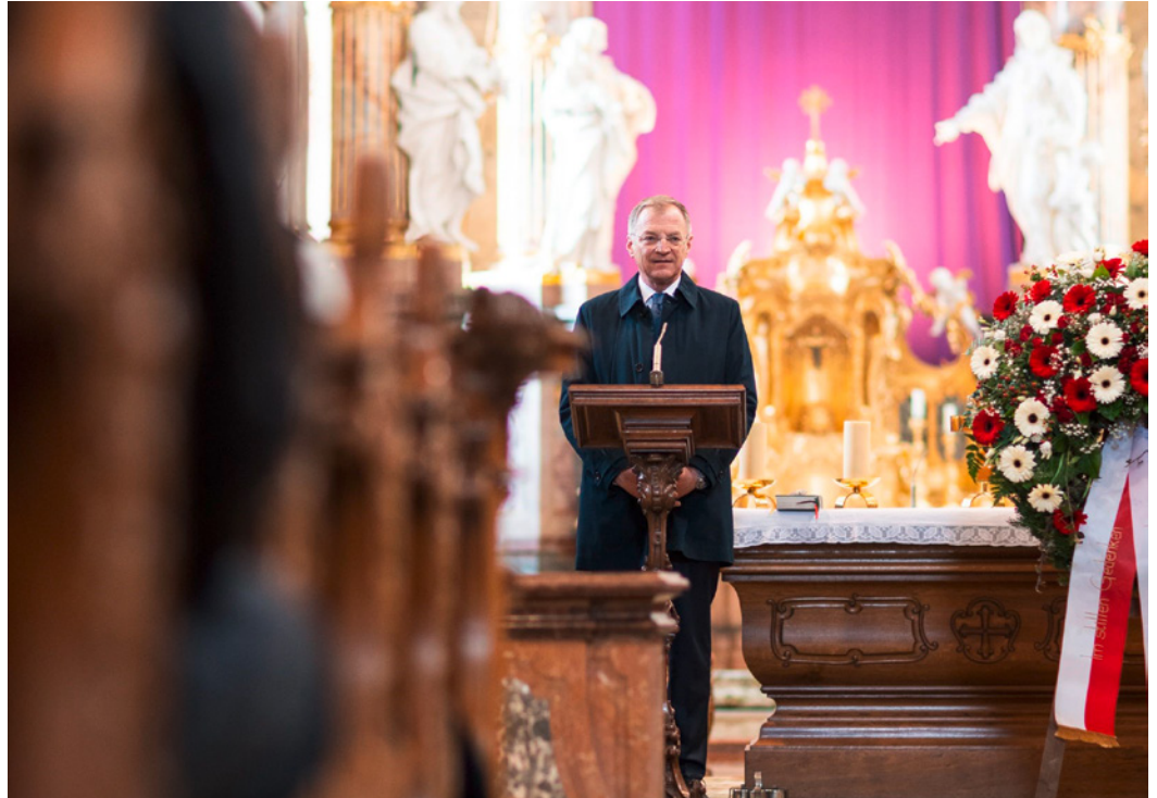
LH Mag. Thomas Stelzer würdigte die Leistungen von LH a. D. Johann Nepomuk Hauser.

Dabei betonte Stelzer: „Johann Nepomuk Hauser war eine zentrale Persönlichkeit in einer Zeit großer Umbrüche. Vor allem nach dem Ende des Ersten Weltkrieges hat er Verantwortung für unser Land und seine Menschen übernommen. Als erster Landeshauptmann Oberösterreichs hat er entscheidend dazu beigetra-