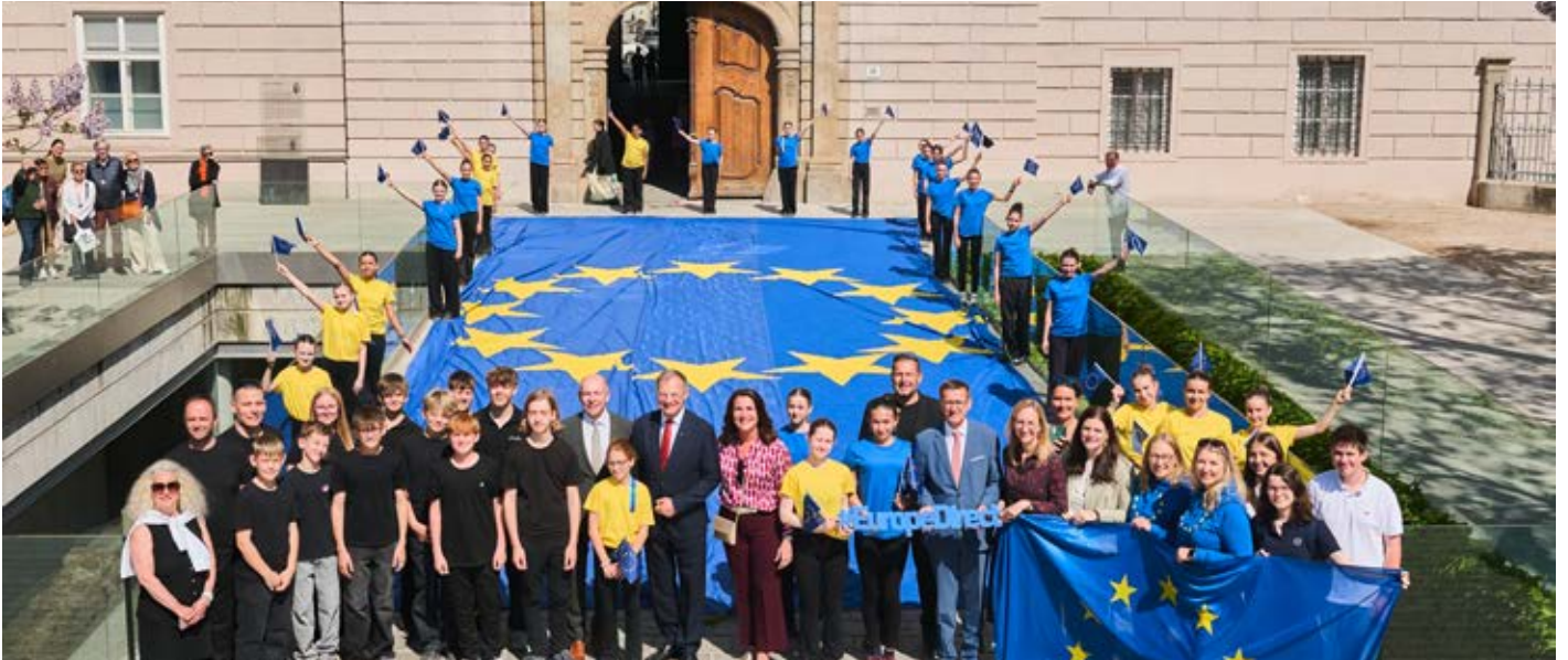
Ebenso bereits liebgewonnener Bestandteil zur Feier des Europatages am Landhausplatz ist der musikalische Flash-Mob des Landesmusikschulwerks.