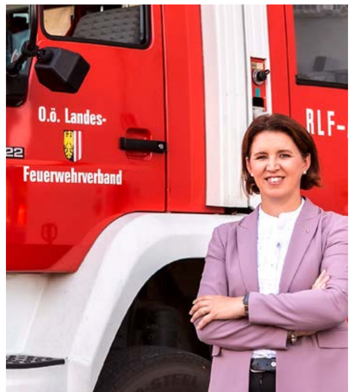
Agrar- und Feuerwehr-LR in Michaela Langer-Weninger, PMM.

Anfang Mai fand im Raum Kasberg/Steyrling im Bezirk Kirchdorf eine der größten Vegetationsbrandübungen statt, die bisher in Österreich durchgeführt wurden. Mehr als 400 Einsatzkräfte verschiedener Organisationen trainierten gemeinsam die Bekämpfung eines großflächigen Waldbrandes im alpinen Gelände.