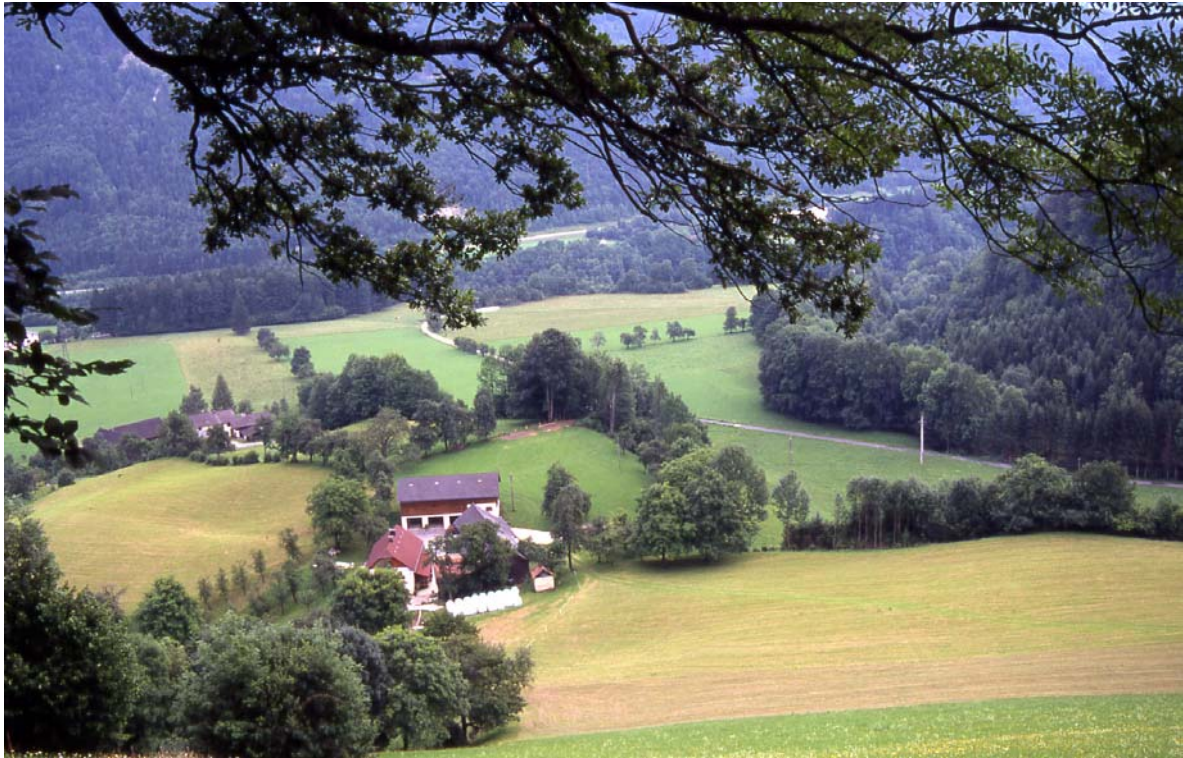
Foto 3: Typischer Hof in Streulage im Ortsteil Au (Kleinreifling) mit unterschiedlich steilen Wiesen, vielen Obstbäumen und Hecken (Bauernhof Sacklbauer)