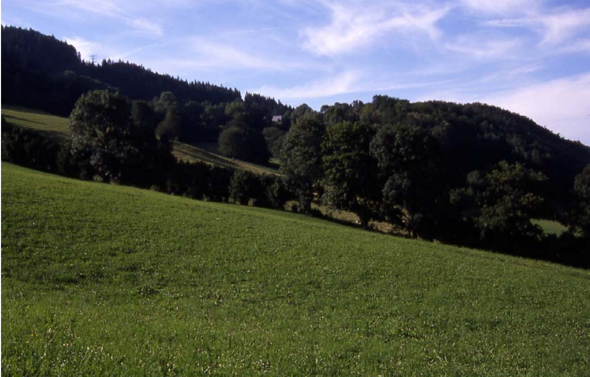
Foto 7: Weitläufige Heckenlandschaft "Am Berg", Kleinreifling: Hecken und Baumreihen grenzen Wiesen und Weiden voneinander ab