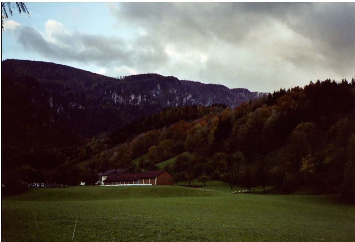
Foto 10: Intensiv bewirtschaftete Wiese am Talboden und kleinstrukturierte Wiesen und Weiden auf den Hängen Kùpfèrn