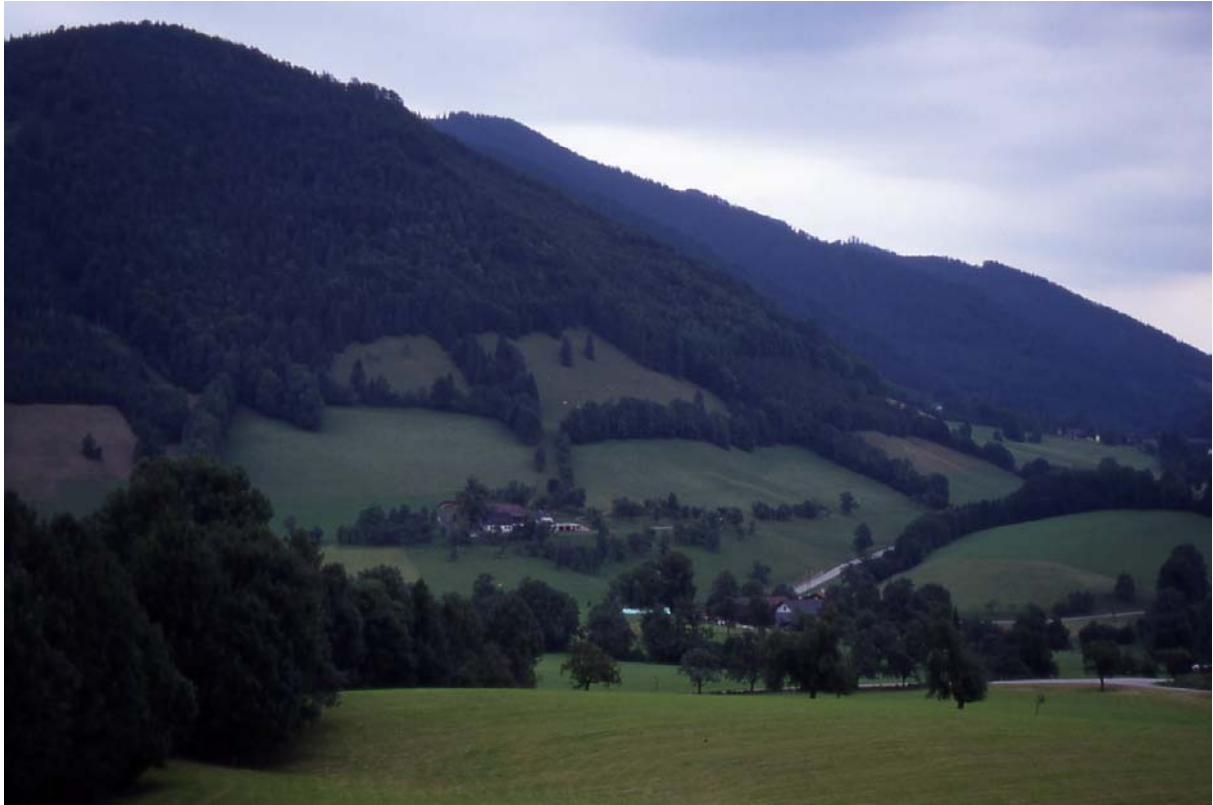
Foto 17: Pichl – reichstrukturierte Landschaft, große magere Weide- und Wiesenfläche am Hang, beim Hof großer Obstbestand (Foto Richtung N)