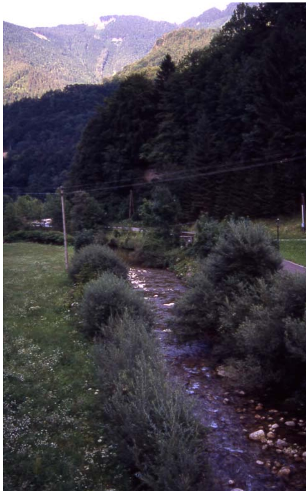
Foto 6: Der Klausbach im Hammergraben (Ortschaft Kleinreifling) mit Ufergehölzstreifen kurz vor seiner Mündung in den Rückstau der Enns