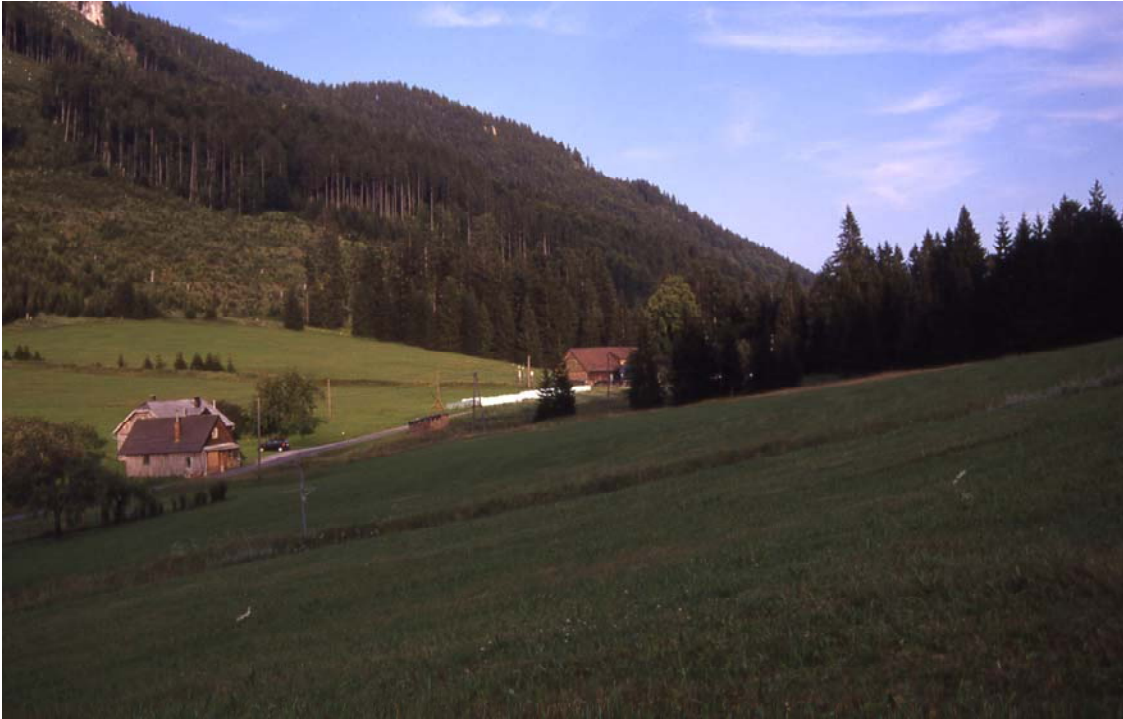
Foto 25: Blick auf Mooshöh von NW: magere, artenreiche Wiesen mit einigen Vernässungsstellen und rechts hinter den Fichten eine kleine Moorfläche; im Hintergrund Altersklassenwald Richtung Bodenwies