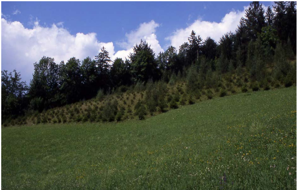
Foto 20: Pichl – Vordergrund mesophile Wiese, im Hintergrund aufgeforstete Magerwiese (typische Entwicklung)