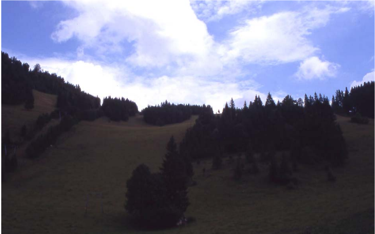
Foto 15: Bodenwies – Schigebiet – im Sommer werden die Fläche beweidet