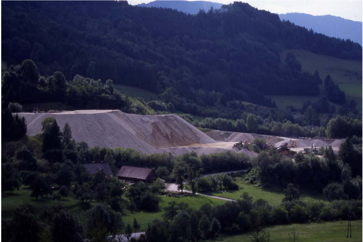
Foto 19: Pichl – Schotterabbaufäche nördlich des Hofes Heindl (typisch für die Gemeinde und wichtige Einkommensquelle)