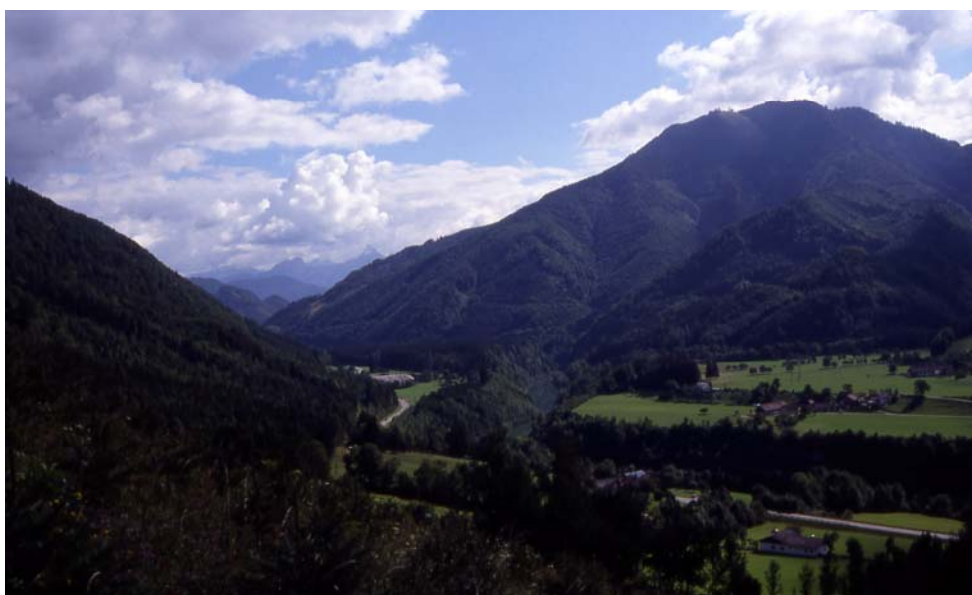
Foto 2: Ennsterrassen mit intensiver Grünland-wirtschaft bei Kleinreifling (Au), dahinter Kühberg (1415m), am Horizont Gesäuse-berge (Kl. Buchstein), Blick nach Süden