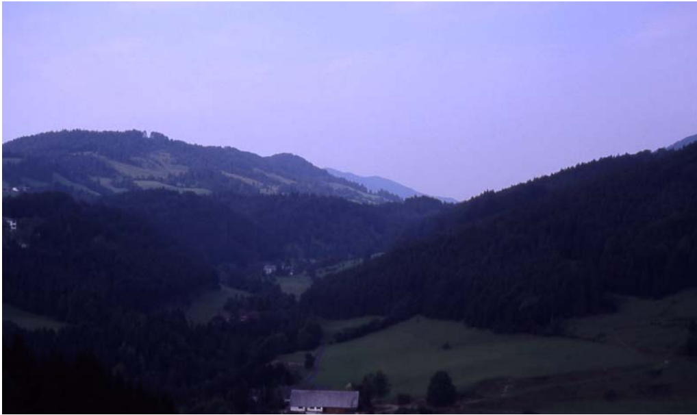
Foto 23: Breitenau, Mühleinschlucht – Überblick Richtung N – Mühleinschlucht, begleitet von Ufergehölzstreifen, angrenzend intensives Grünland, an den west- und ostexponierten Hänge magere Wiesen und Weiden, im vorderen Bereich Laub-Nadel-Mischwald