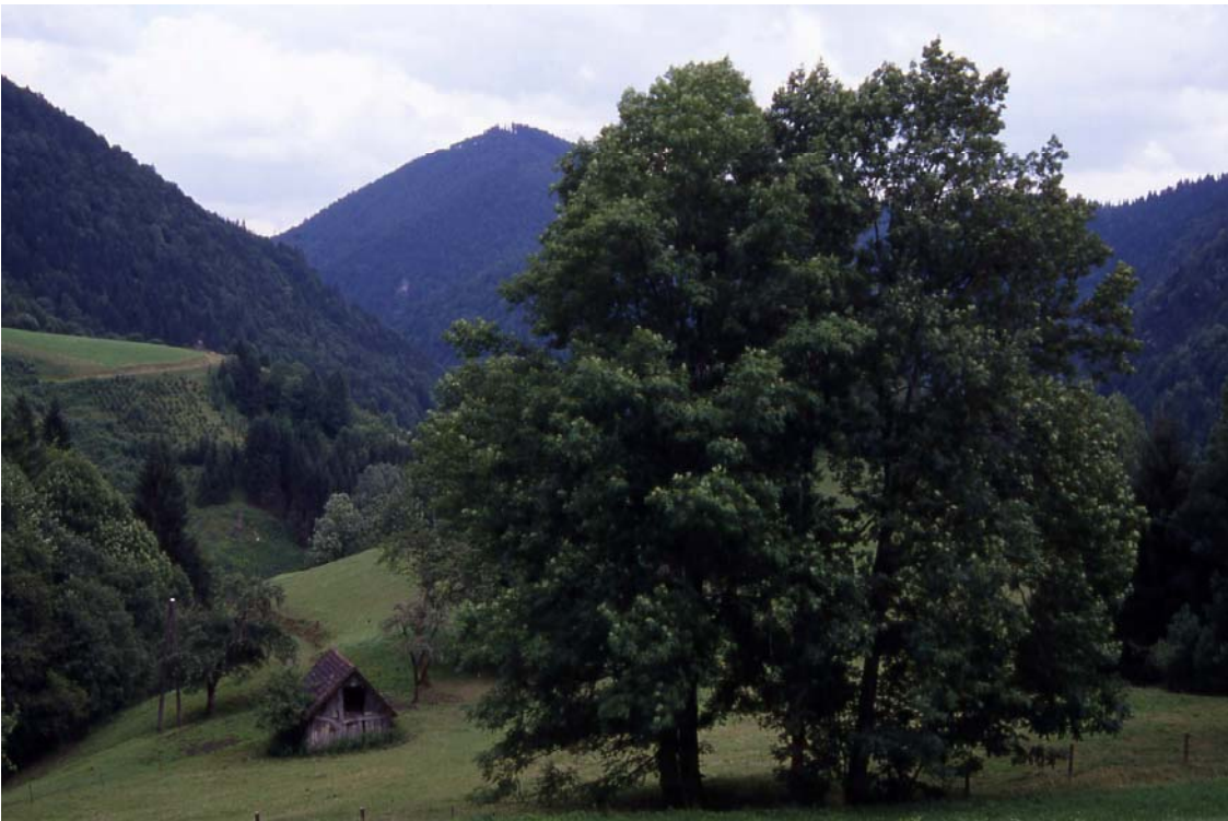
Foto 26: Die Esche ( Fraxinus excelsior ) als der häufigste Baum in der offenen Kulturlandschaft: Eschengruppe auf Kuhweide beim Bauernhof Bichlbauer oberhalb Dörfli