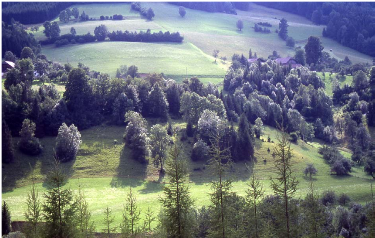
Foto 18: Pichl – reichstrukturierte Landschaft – im Vordergrund kleinstrukturierte Weidefläche mit Baumbestand (Foto Richtung S)