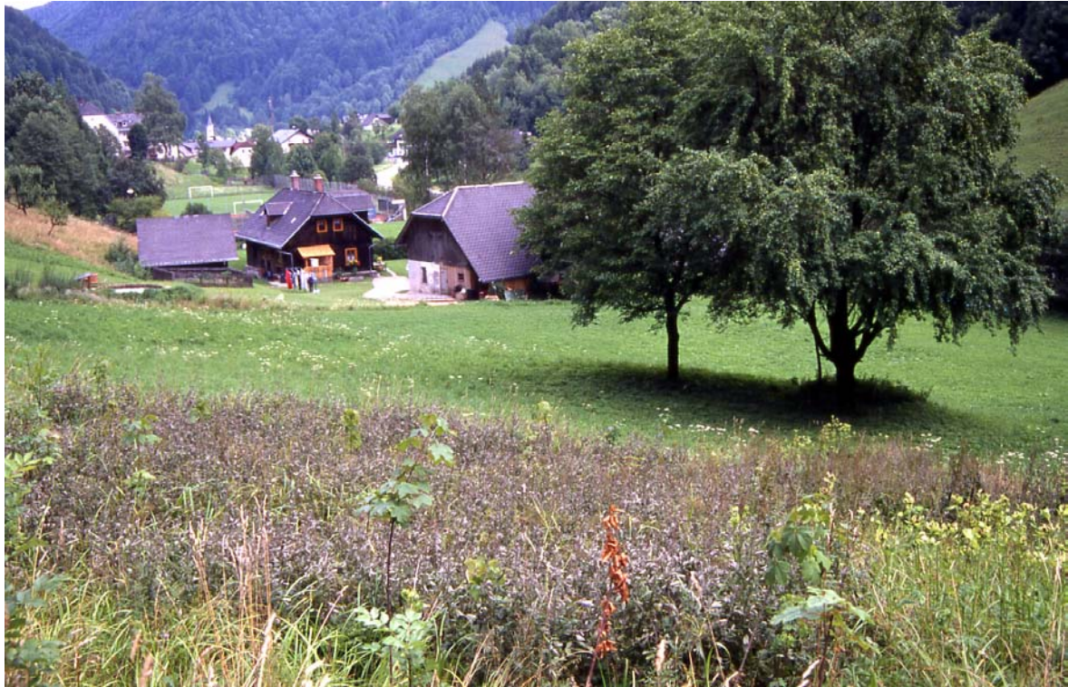
Foto 27: Blick auf Dörfli in der Unterlaussa von Westen, im Vordergrund Feuchtfläche und Mostobstbäume beim Forsthaus