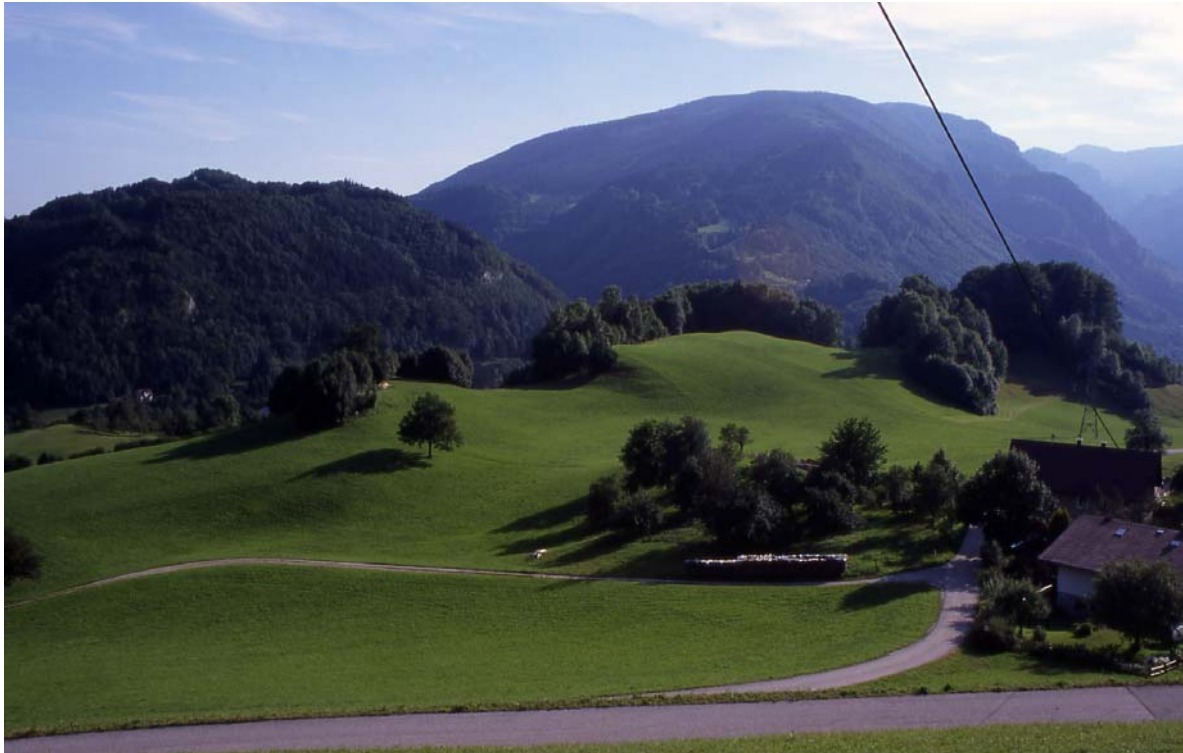
Foto 13: Anger - Bereich Weghaus, reichstrukturierte Landschaft mit Hecken, Obstgehölzen (Foto Richtung S)