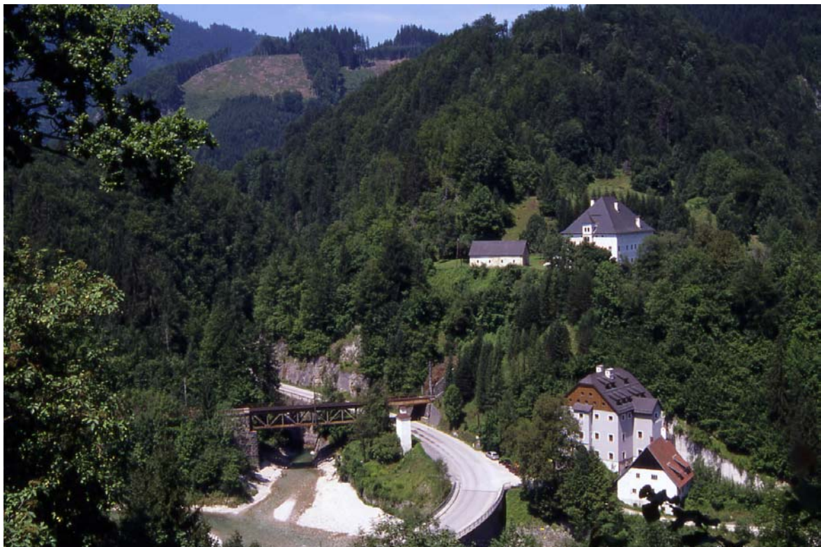
Foto 30: Blick von Altenmarkt auf die Mündung des Laussabachs in die Enns: hinter der Eisenbahnbrücke der sog. Kesselfall, auf Hochterrasse rechts das Pöglgut