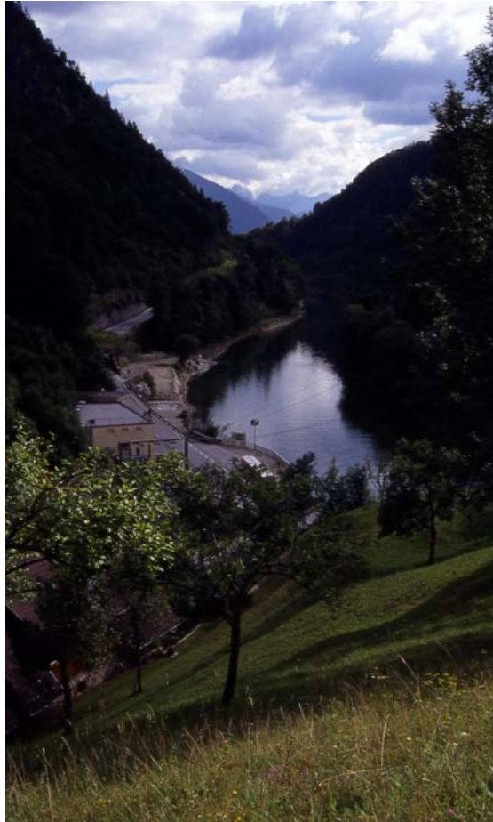
Foto 1: Das Ennstal flussaufwärts beim Kraftwerk Altenmarkt, im Hintergrund Gesäuseberge; vorne beim Ausgang Frenzgraben eine Magerwiese mit Obstbäumen