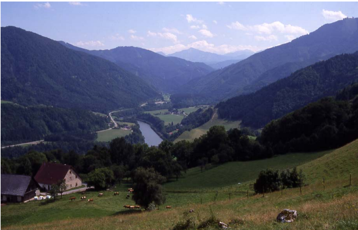
Foto 8: Blick ins Ennstal flussaufwärts von „Am Berg“ in Kleinreifling: im Tal und an den begünstigten Hängen Grünland, an den steileren Hängen Mischwald; im Hintergrund das Gesäuse (Tamischbachturm)