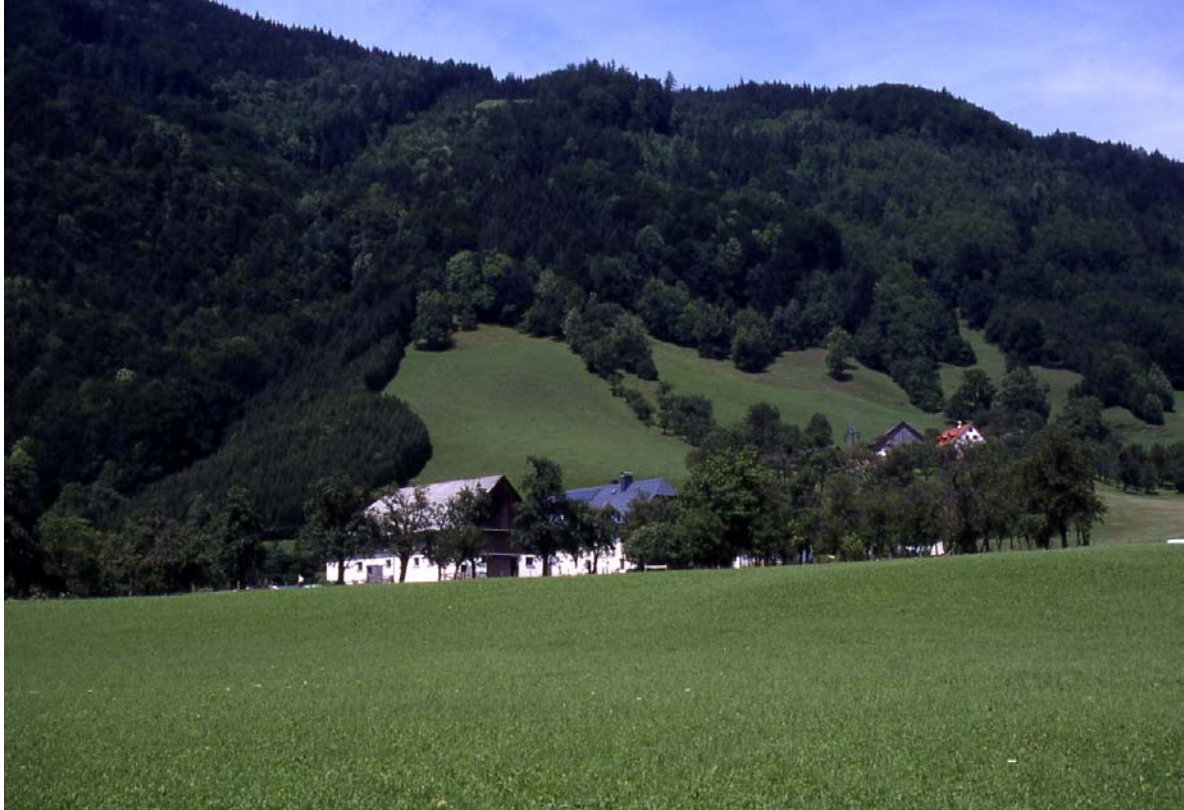
Foto 11: Anger – im Vordergrund Hof mit Obstbaumwiese und intensiv, bewirtschaftete Fläche – im Hintergrund reichstrukturierter Südhang mit Hecken, Feldgehölzen und extensiven Wiesen- und Weideflächen