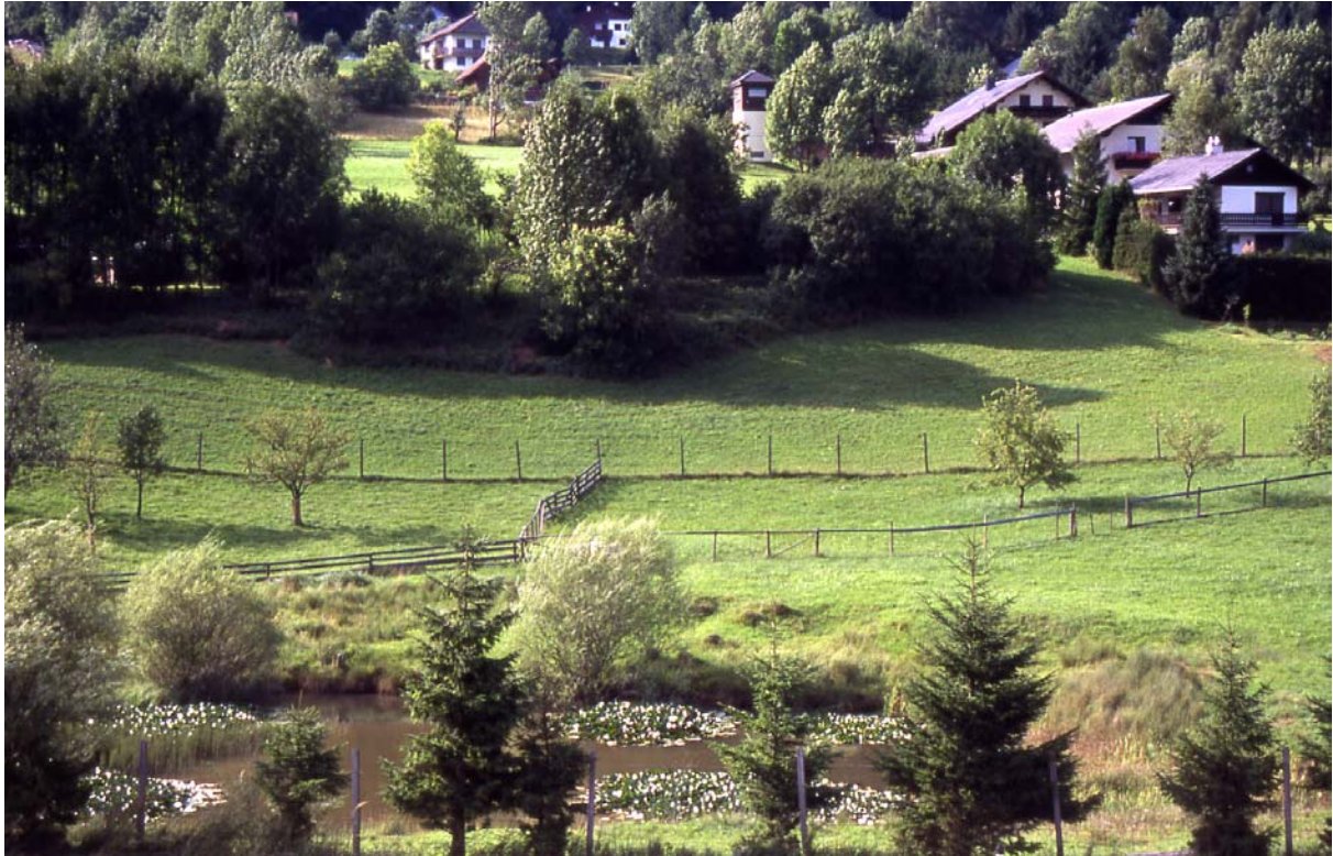
Foto 21: östlich Pichlsiedlung –Fischteiche mit kleinen Verlandungszone