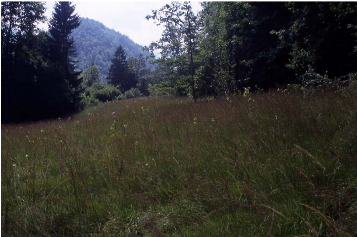
Foto 22: Pichl – östlich von Hof Heindl – nicht mehr bewirtschaftete Pfeifengraswiese im Wald mit viel Orchideen