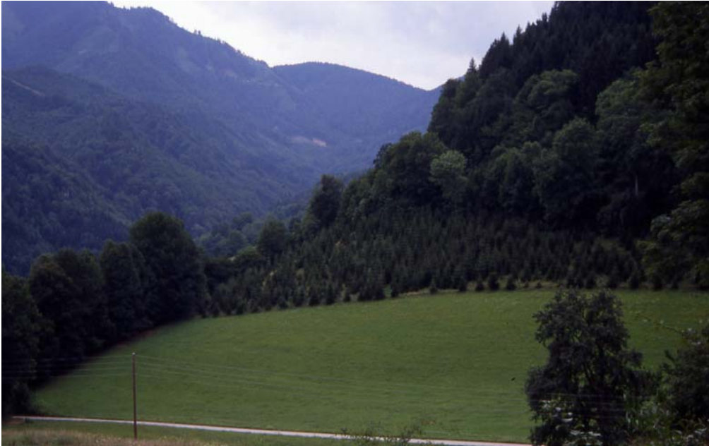
Foto 5: Der Wald wächst: Typische Fichtenaufforstung am Waldrand, Ortschaft Au, Kleinreifling