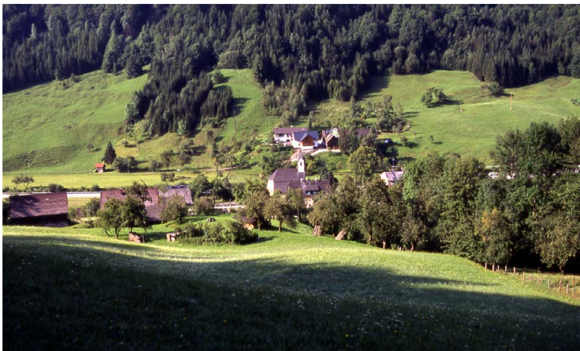
Foto 28: Kirche in der Unterlaussa/Dörfli und Umgebung vom nördlich gelegenen Waldrand aus; der Laussabach am Talboden ist Landesgrenze zwischen OÖ und der Steiermark; der Gegenhang liegt daher in der Gemeinde Weissenbach/St. Gallen (Stmk.)