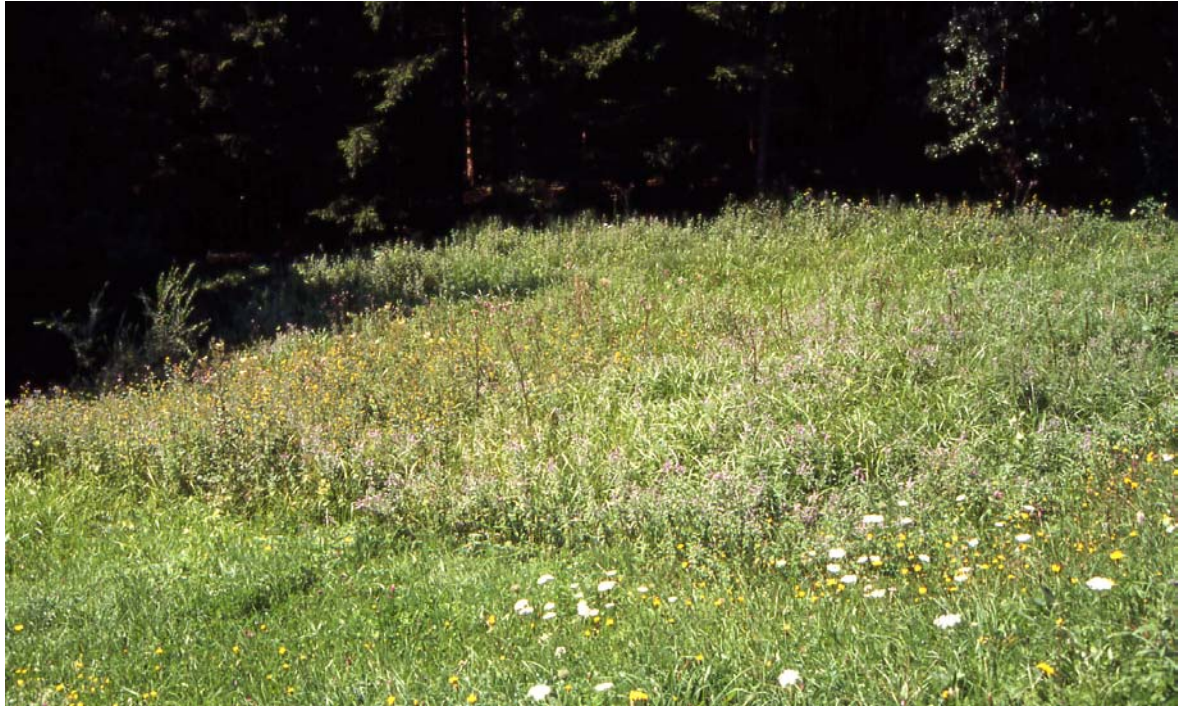
Foto 29: Typische Vernässungsstelle auf einer Weide mit Roßminze, Wald-Simse, Echtes Mädesüß; Fläche bei Bauernhof Menauer, Unterlaussa