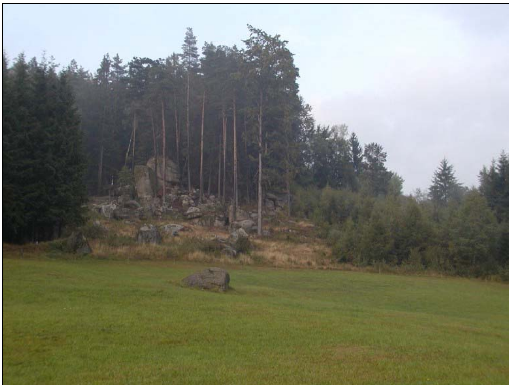
Foto 6: Wollsackverwitterung im Nadelmischwald