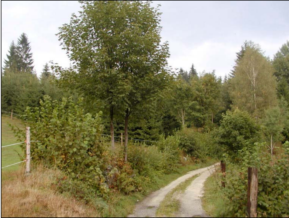
Foto 5: Hecke auf Steinriegelböschung entlang eines Flurwegs nördlich Stumberg [Photo: A. KNOLL, 10. September 2003]