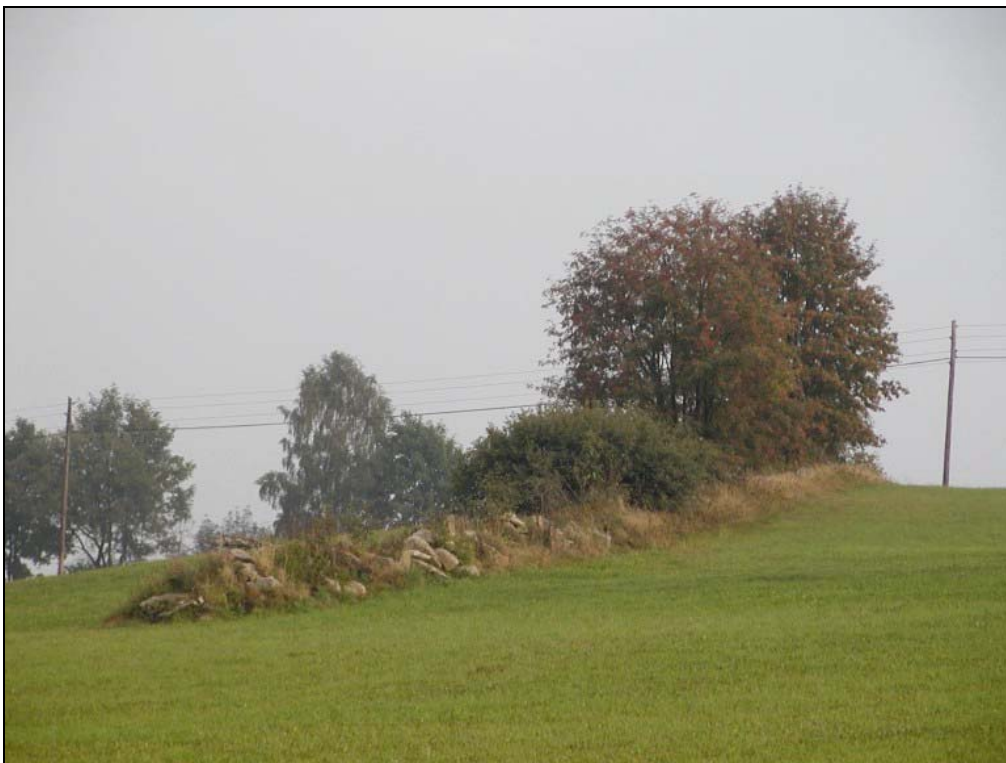
Foto 4: Hecke auf Steinriegel mit Haselnuss und Eberesche östlich Wienau [Photo: A. KNOLL, 10. September 2003]