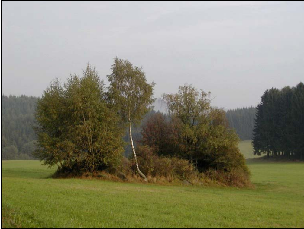
Foto 3: Gehölzbestandener Steinriegel mit Weißbirke, Eberesche u.a. in der landwirtschaftlich genutzten Flur östlich Wienau [Photo: A. KNOLL, 10. September 2003]