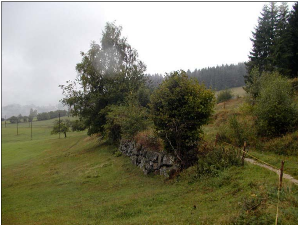
Foto 8: Trockenmauer an einem Feldweg im Gebiet Knauser; im Vordergrund Grünland mit Halbtrockenrasencharakter [Photo: A. KNOLL, 10. September 2003]