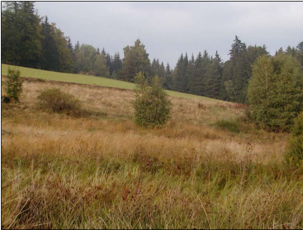
Foto 1: Feuchtgrünland mit beginnender Gehölzsukzession östlich Wienau [Photo: A. KNOLL, 10. September 2003]