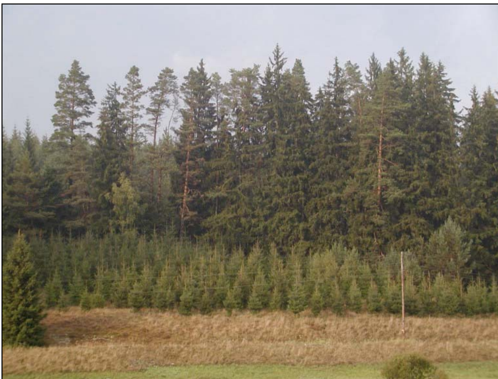
Foto 2: Neubewaldung im Europaschutzgebiet südlich Saghammer [Photo: S. ZOBL, 10. September 2003]