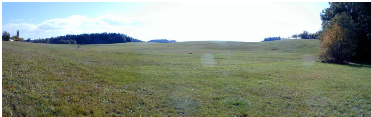
Foto 10: Blick Richtung Süden im Bereich der Ortschaft Dankmairing