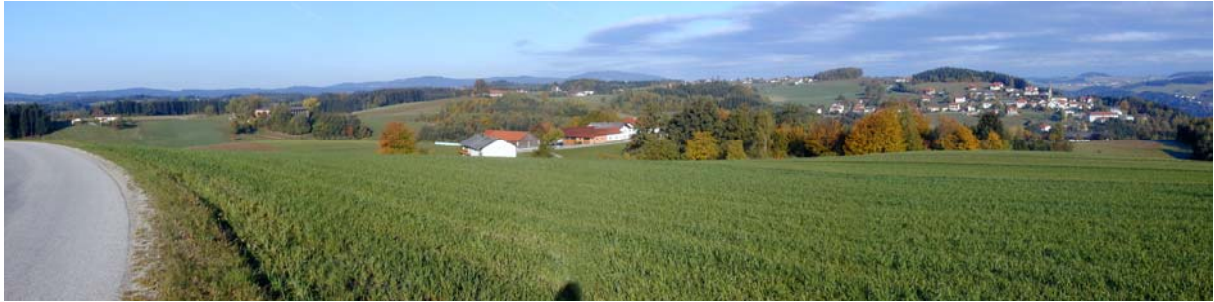
Foto 15: Blick von der Ortschaft Erledt Richtung Nordwesten (Waldkirchen Ort)