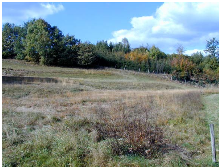
Foto 2: Feuchte nährstoffarme Extensivwiese im Bereich der Ortschaft Atzgersdorf