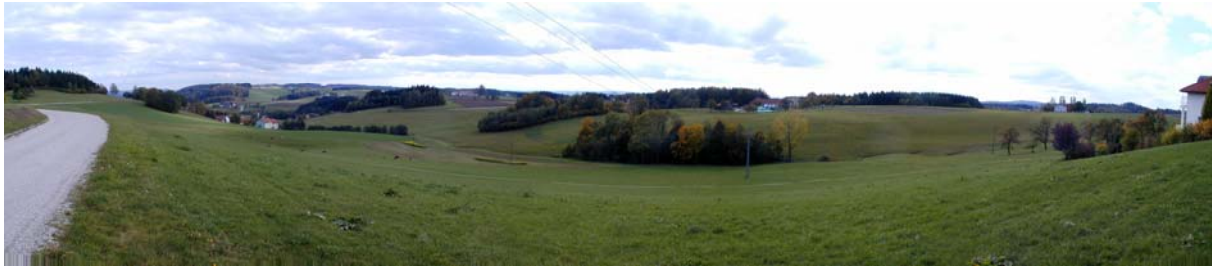
Foto 4: Blick im Bereich der Ortschaft Aichberg-Buchen Richtung Süden