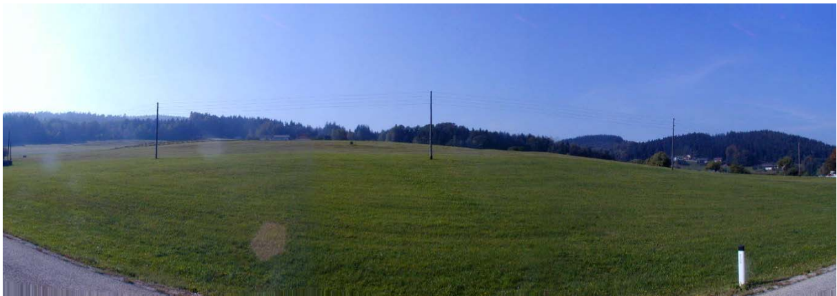
Foto 1: Blick Richtung Süden (Ortschaft Berg), Fotostandpunkt östlich des Ortes Vichtenstein