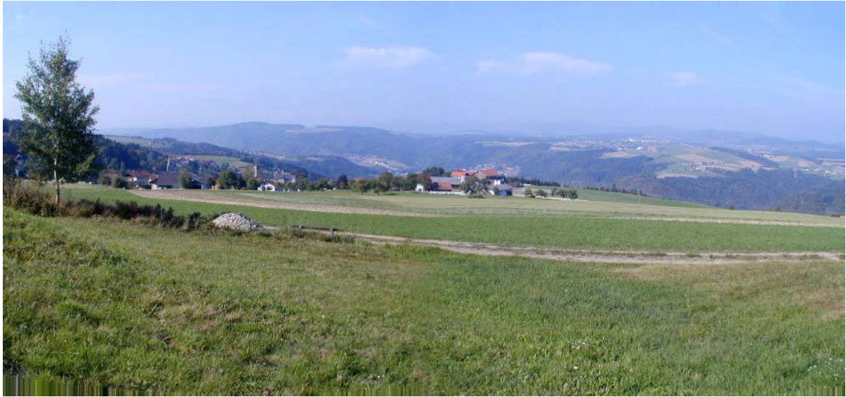
Foto 5: Blick Richtung Norden, Fotostandpunkt im Nahbereich der Ortschaft Berg