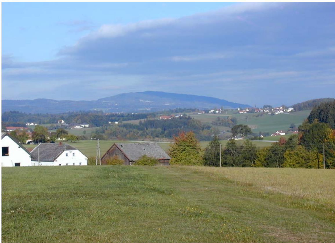
Foto 6: Blick auf den Haugstein, Fotostandpunkt Waldkirchen am Wesen