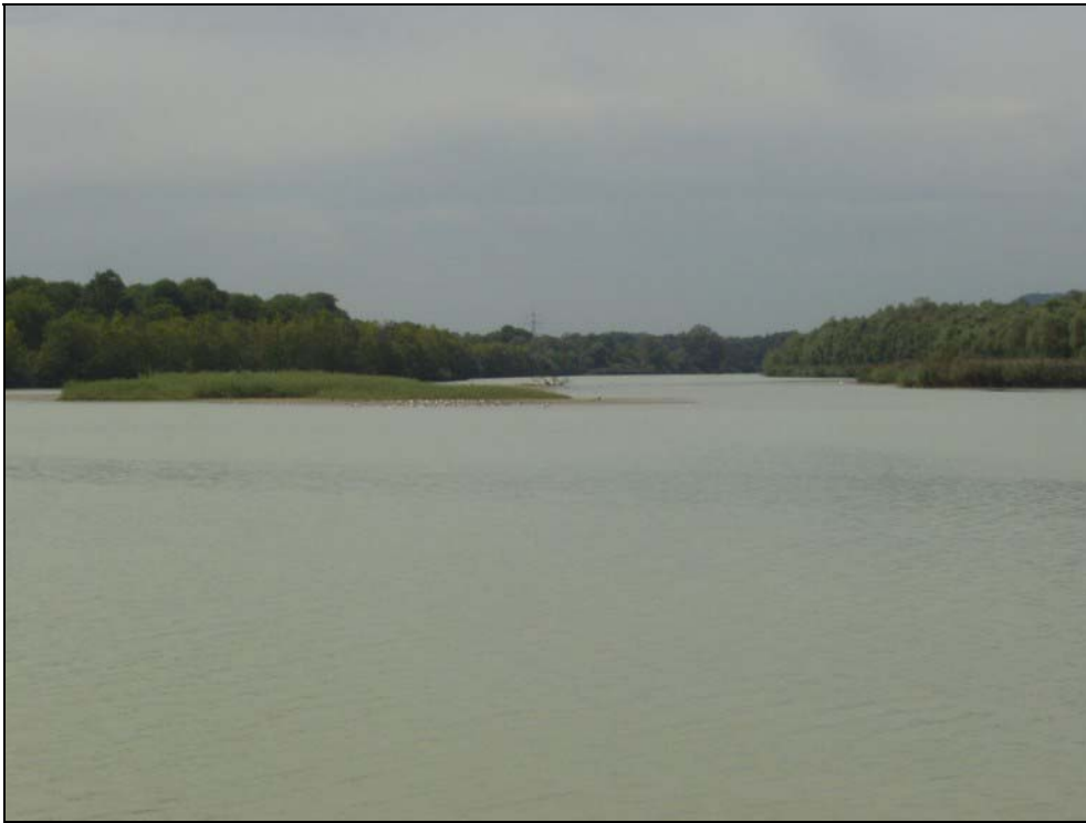
Abb. 1: Silberweidengebüsche und Schilfröhricht am Innstausee