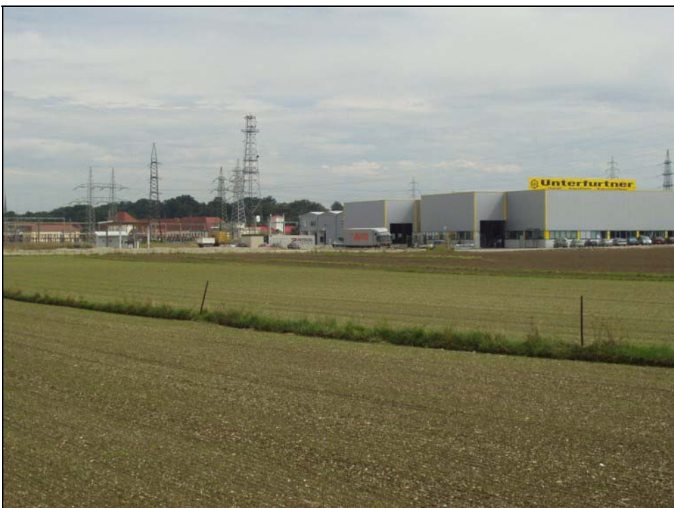
Abb. 16: Gewerbegebiet und VERBUND-Umspannwerk westlich Mooswiesen