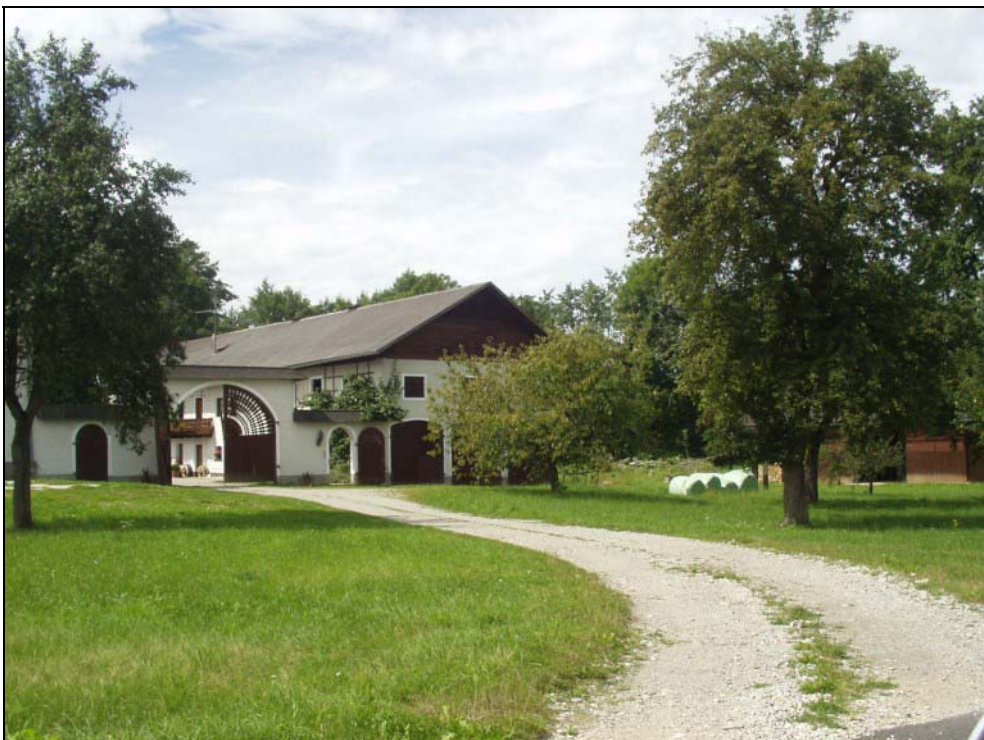
Abb. 10: Bauernhof in Bogenhofen