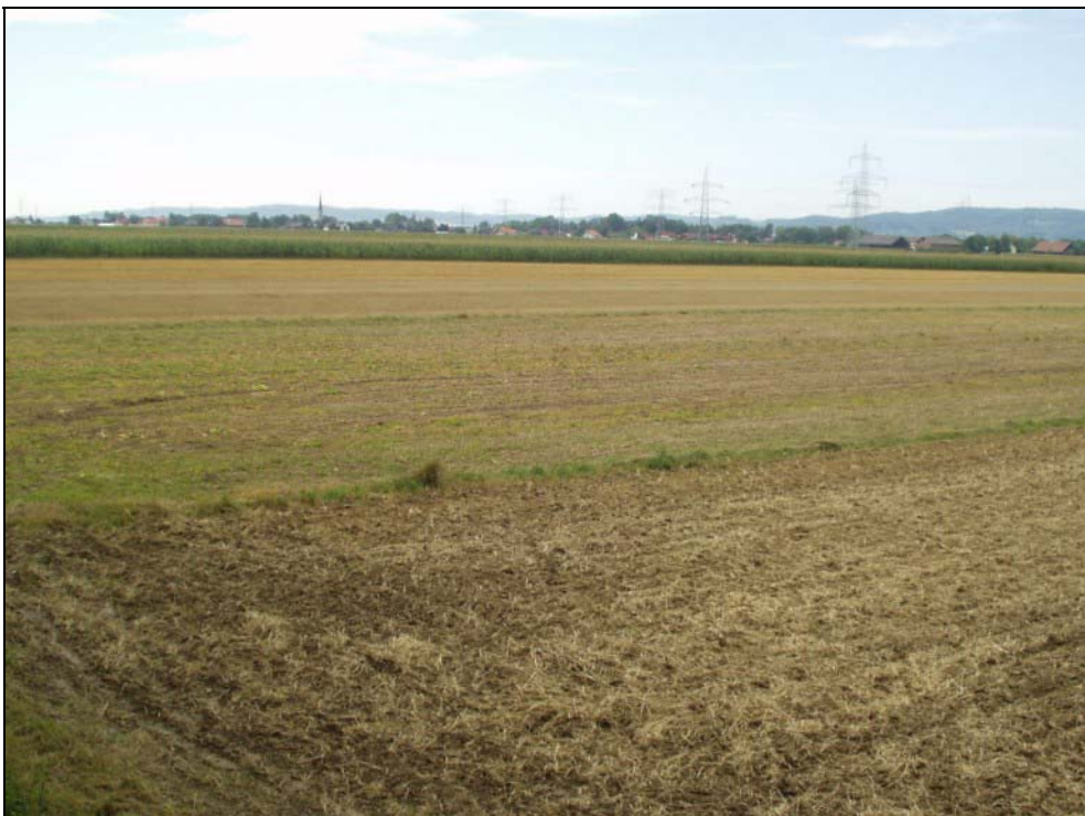
Abb. 12: Niederterrasse südlich von Neubergham; im Hintergrund St. Peter am Hart [Photo: A. KNOLL, 23. August 2004]