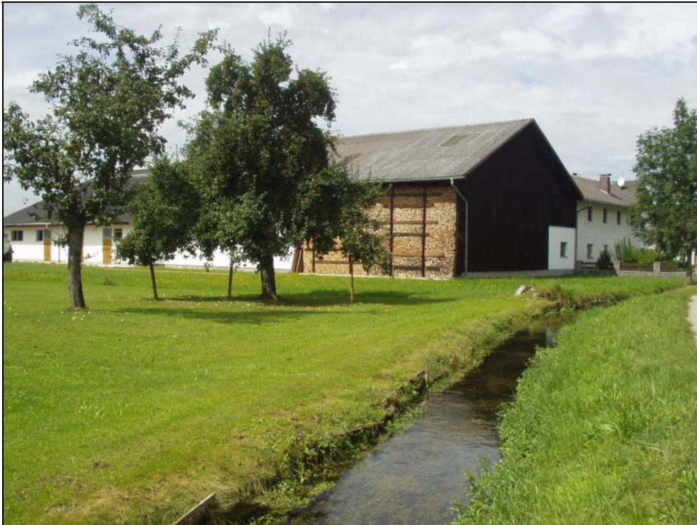
Abb. 9: Kanal und Bauernhof südlich Schloss Bogenhofen