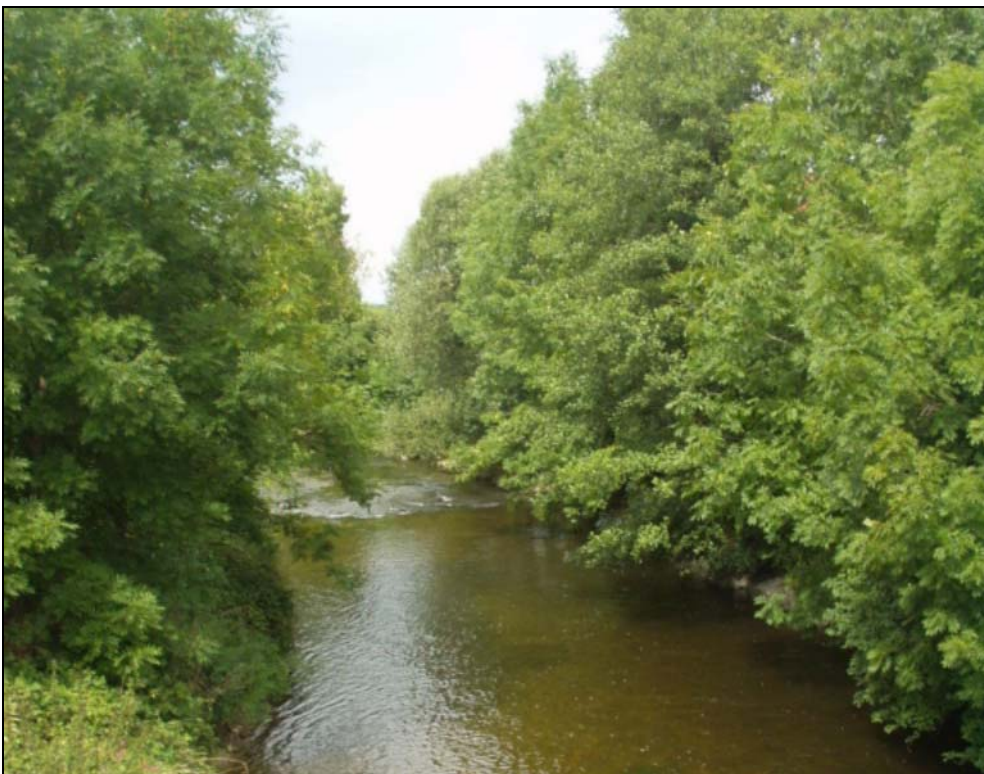
Abb. 14: Untere Mattig bei Aching