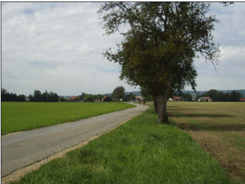
Abb. 8: Flussterrasse mit Obstbaumreihe Richtung Hagenau