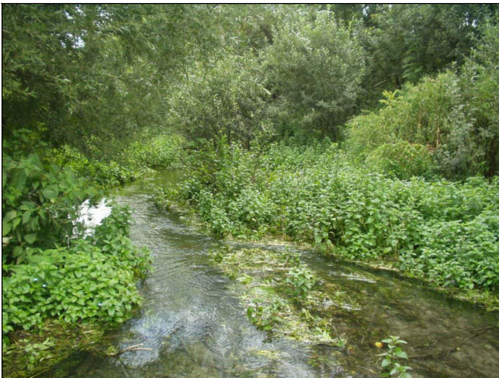
Abb. 2: Naturnaher Gießen mit Laichkrautvegetation bei Nöfing