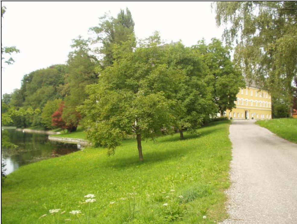
Abb. 5: Schloss Hagenau