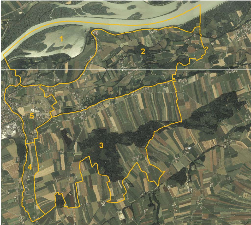
Abb. 2: Übersichtsplan mit Orthophoto und Teilgebietsabgrenzungen

Teilgebiet 1 „Reikersdorfer und Nöfinger Inn-Auen“