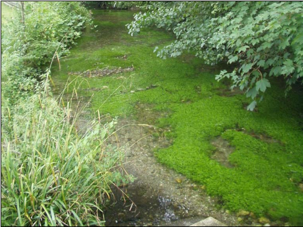
Abb. 3: Naturnaher Gießen mit Laichkrautgesellschaft bei Hundslau