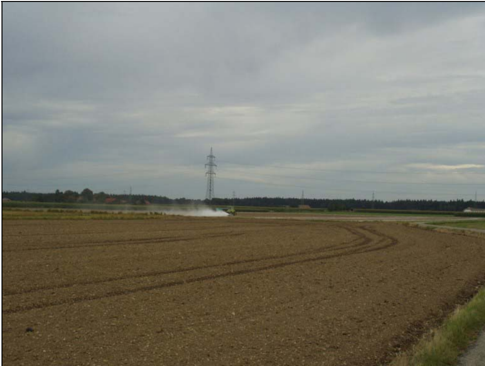
Abb. 13: Niederterrasse bei Ofen; im Hintergrund der Hartwald