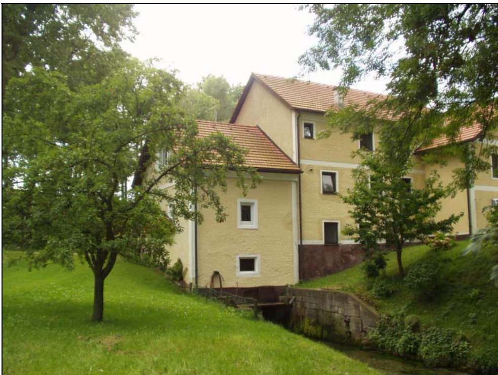
Abb. 4: Ehem. Wassermühle (heute KWK) bei Schickenedt