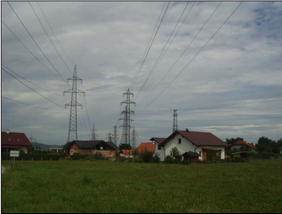
Abb. 17: Siedlungsrand Jahrsdorf unter Freileitungen