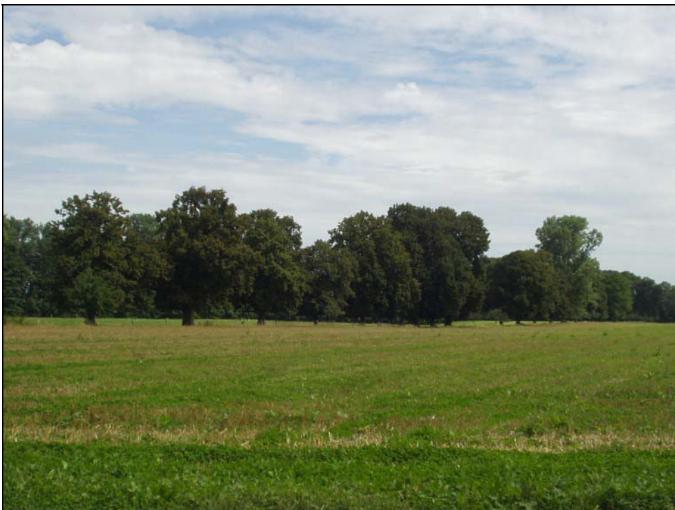
Abb. 6: Flussterrasse mit Landschaftsparkcharakter bei Schloss Hagenau