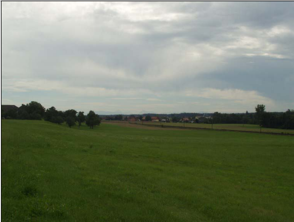
Abb. 15: Tal der unteren Mattig südlich Aselkam; in Hintergrund die Kalkalpen