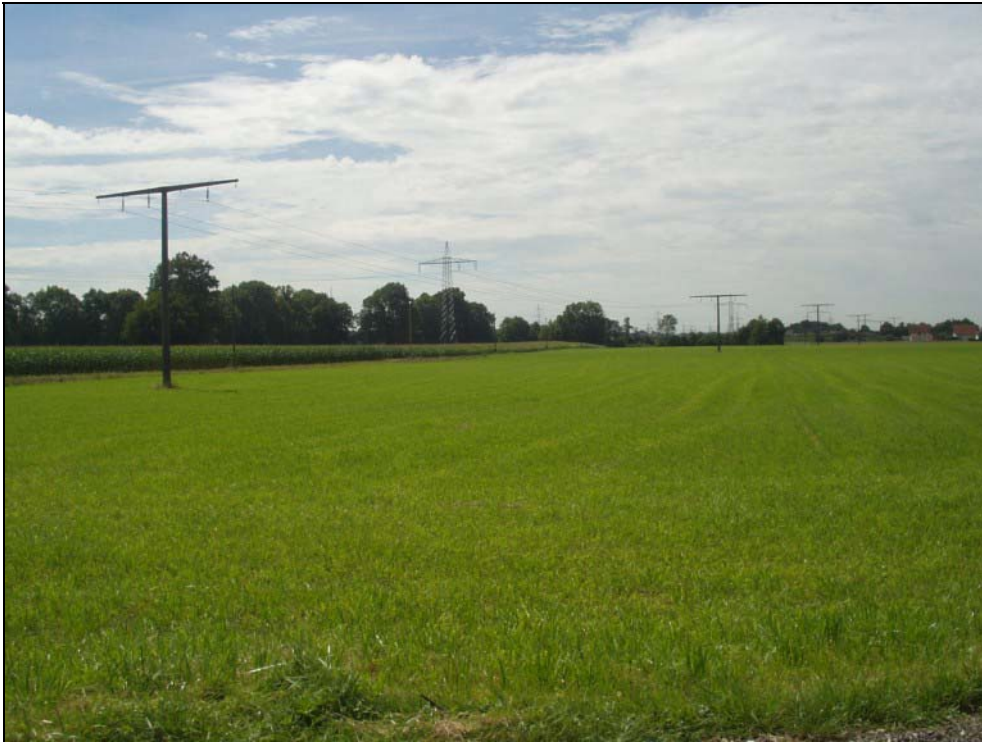
Abb. 7: Flussterrasse südöstlich von Hagenau