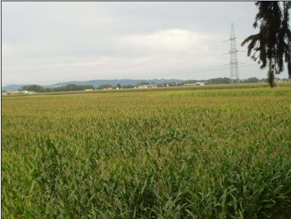
Abb. 11: Niederterrasse südlich von Neubergham; im Hintergrund bewaldete Höhen in Bayern [Photo: A. KNOLL, 23. August 2004]