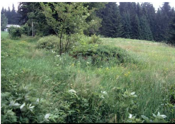
Foto 38: Viehberg: Aufforstungsgefährdete Brachflur mit verwachsenem Hohlweg, Wiesen- und Feldbrachen