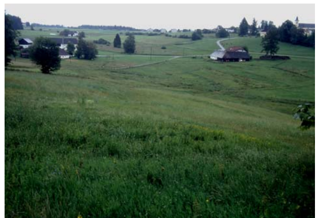
Foto 18: Graben bei Sandl – 2003 Bruthabitat von Braunkehlchen, Wiesenpieper und Neuntöter