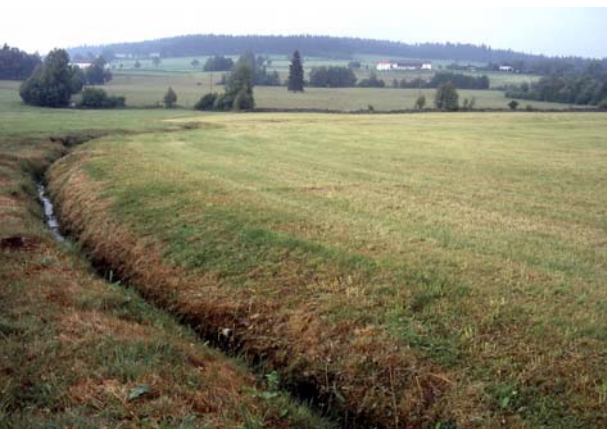
Foto 17: Überblick über das Wiesenbrütergebiet Viehberg – durch massive Gehölzaufwüchse und abschnittsweise Intensivgrünlandnutzung stark entwertet