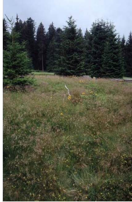
Foto 53: Zwergstrauchheide/Magerrasen mit Wachtelweizen, Drahtschmiele, Bürstling und Arnika beim Quas