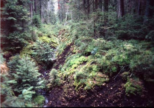
Foto 27: Massive Entwässerung von Waldhochmoor, hier in totholzreichem Waldbestand von hoher ornithologischer Bedeutung – östlich Großem Rosenhofteich