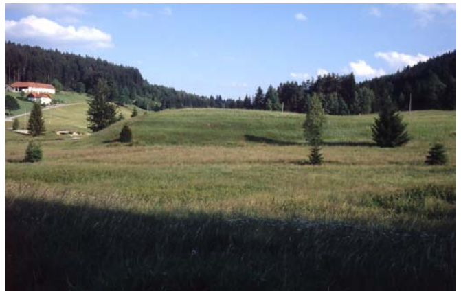
Foto 49: Hundsberg – Hacklbrunn: Brutplätze von Neuntöter, Braunkehlchen und Wachtelkönig