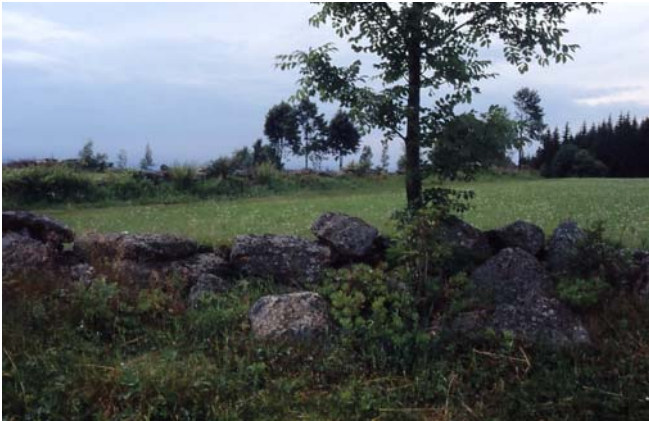
Foto 58: Steinwälle (mit Fettheue) als Reststrukturen in Intensivgebiet – auf der Eben