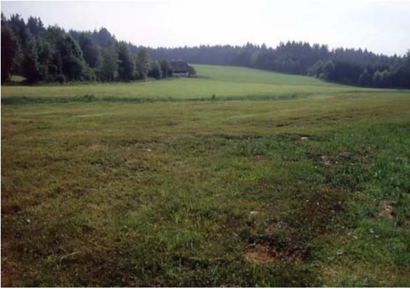
Foto 82: Intensivwirtschaft südl. Luckawirt: Jauchedüngung bis in den Gewässerbereich (Mittelgrund)