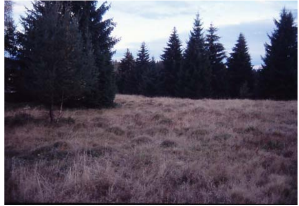
Foto 77: Äußerst wertvolle Bultheide Schönberg-West, unter Kapelle, bereits in fortschreitender Verwaltung