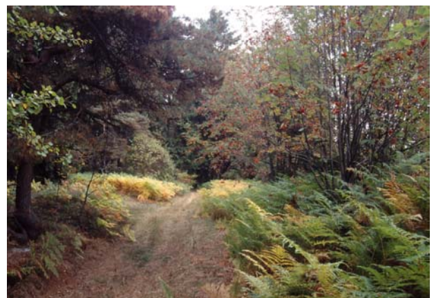
Foto 6: Verbuschter Hohlweg im Bereich Viehberg - Steinkreuz