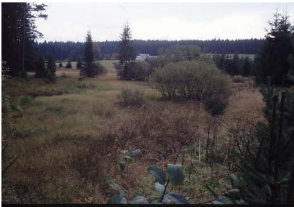
Foto 36: Verbuschte und aufgeforstete ehemalige Feuchtwiesen beim Pumhiasl/Rothenbachl