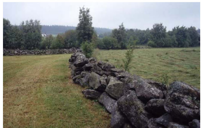
Foto 32: Steinschlichtwälle in Viehberg – Heckenwüchse verdrängen anspruchsvolle Pflanzen- und Tierarten