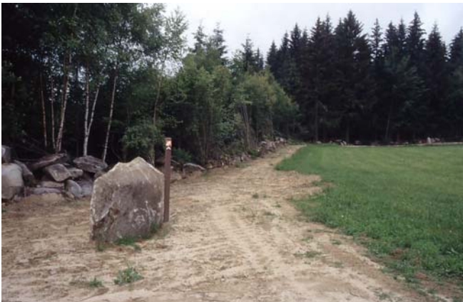
Foto 54: Naturschutzfachlich ungünstige Wegrevitalisierung – Hundsberg/Maltschtal