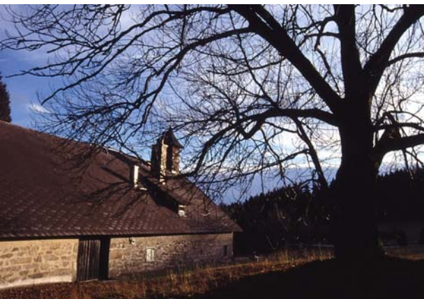
Foto 11: Landschaftsprägender Einzelbaum beim Hennerbichler in Schönberg