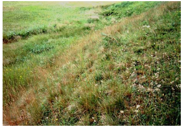
Foto 2: Antennaria dioica an kleiner Böschung zu sehr artenreicher Feuchtwiese zwischen Rindlberg und Reisingermühle