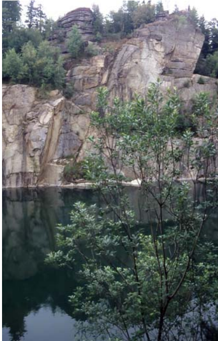
Foto 23: Natürlich regenerierter Teich im aufgelassenen Steinbruch Plochwald