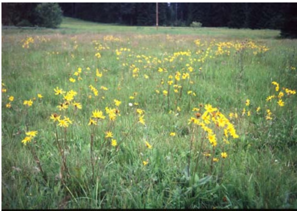
Foto 3: Der FFH-Lebensraumtyp Bürstlingsrasen – im Arnikaaspekt