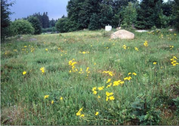
Foto 19: Steinablagung in und Brunnenbau neben Arnika-Bürstlingsrasen – beim Luckawirt