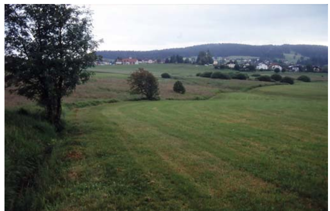
Foto 57: Hochwertige Herrschaftsbrachen neben Sandl, hinten fortschreitende Verbuschung