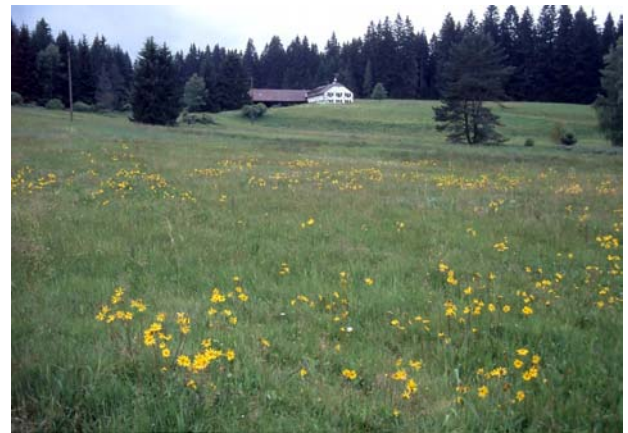
Foto 4: Botanisch hochwertiger Wiesenkomplex in Pürstling-Südwest