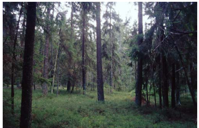
Foto 26: FFH-Lebensraumtyp Moorwald: Lebensraum von Hasel- und Auerhuhn, Sperlings- und Raufußkauz, Dreizehen- und Schwarzspecht