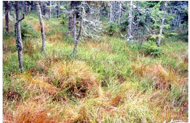
Foto 30: Hochmoor im Herbstaspekt mit Scheidigem Wollgras