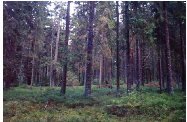
Foto 67: Naturwaldreservatsfähiger, totholzreicher Moorrandwald bei der Sepplau, u.a. Dreizehenspechthabitat