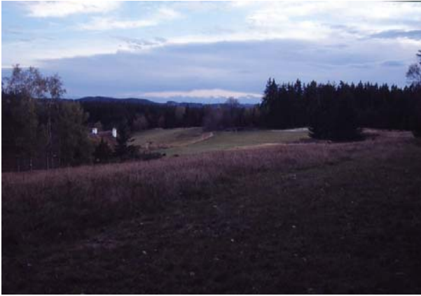
Foto 76: Oberster Bereich von Schönberg, (noch) mit Fernblick, lauter naturschutzfachlich wertvolle Grünlandbestände