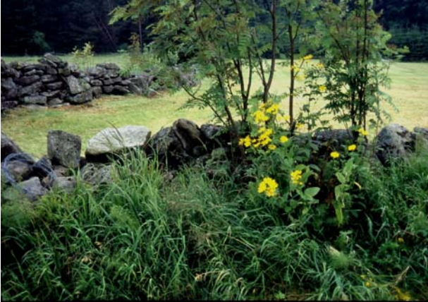
Foto 33: Doronicum austriacum an Steinwall am Viehberg