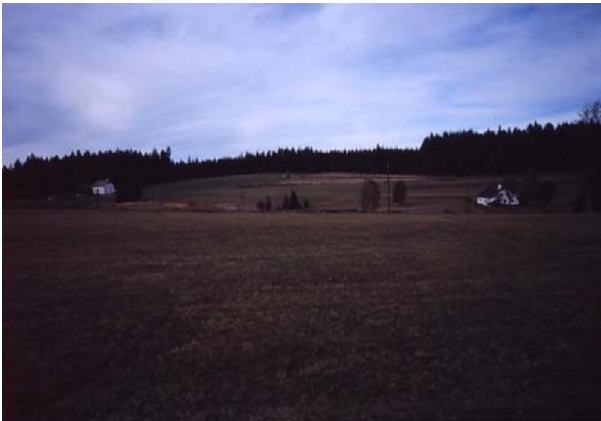
Foto 74: Wiesenbrütergebiet bei der Reisingermühle, Mitte hinten neu aufgeforstet