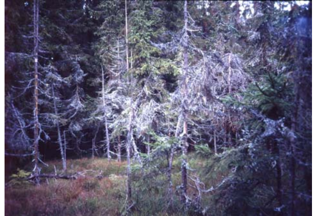
Foto 28: Krüppelfichten in Waldmoorkern – Moor nördlich Großem Rosenhofteich