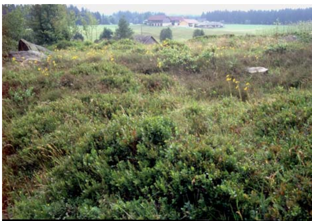
Foto 5: Noch wenig verbuschte Heidevegetation an einem typischen Steinwall-Hohlweg – bei der Reisingermühle