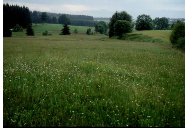
Foto 14: Magerwiese im Graben - durch zunehmenden Baumbestand schwindende Wiesenbrütereiernung