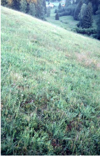
Foto 52: Verbrachende Flur am Hundsberg Richtung Maltschtal mit sehr wertvoller Trockenböschung im Vordergrund