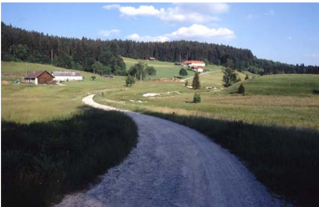
Foto 48: Wiesenbrütergebiet Hundsberg – Hacklbrunn, im Wachtelkönigrevier