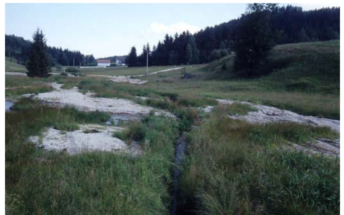
Foto 12: Malsch in Hacklbrunn – Aufsandungen vom Hochwasser 2002, bedeutende Wiesenbrüterfläche