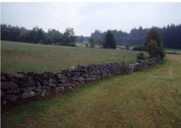
Foto 31: Schönste Steinschlichtwälle Sandls in Viehberg, bei extensiver Wiesennutzung Lebensraum der Kreuzotter