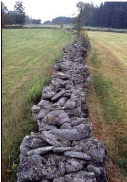
Foto 62: Steinwall mit Magersaum am Viehberg, aus Wiesenbrüterschutzsicht zu frühe Mahd im Juni