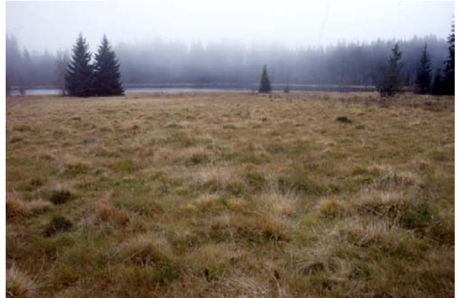
Foto 71: Magerwiesen mit Kreuzottervorkommen beim Kl. Rosenhofteich