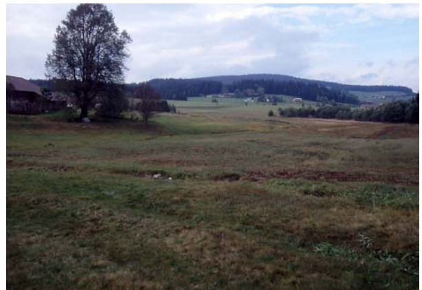
Foto 37: Nicht ÖPUL-konformer Umgang mit dem „Landschaftselement Feuchtwiese“: Bodenbearbeitung mit Neueinsaat beim Pumhiasl