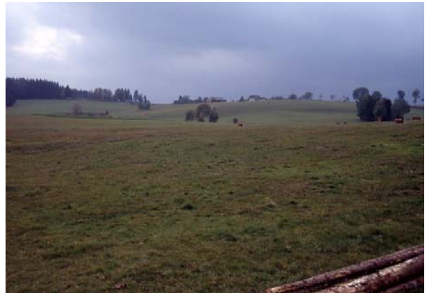
Foto 75: Durch punktuelle Extensivierungen aufwertbares Wiesenbrütergebiet Neuhof-West