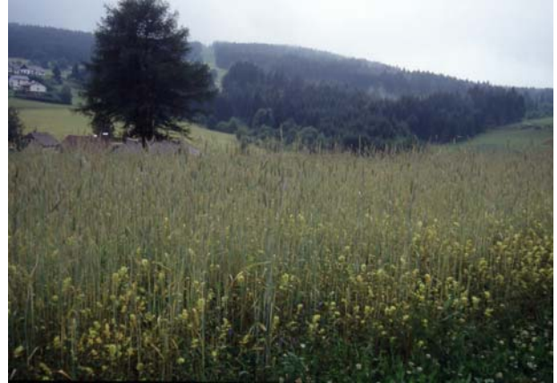
Foto 8: Getreidefeld als Lebensraum – hier mit Rhinanthus alectorolophus