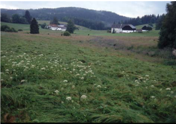
Foto 15: Noch wenig verbuschte Feuchtwiesenbrache mit sehr hohem Naturschutzwert - Graben