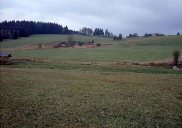
Foto 13: Intensivgrünland und alte Feuchtbrache im Wiesenbrütergebiet Neuhof