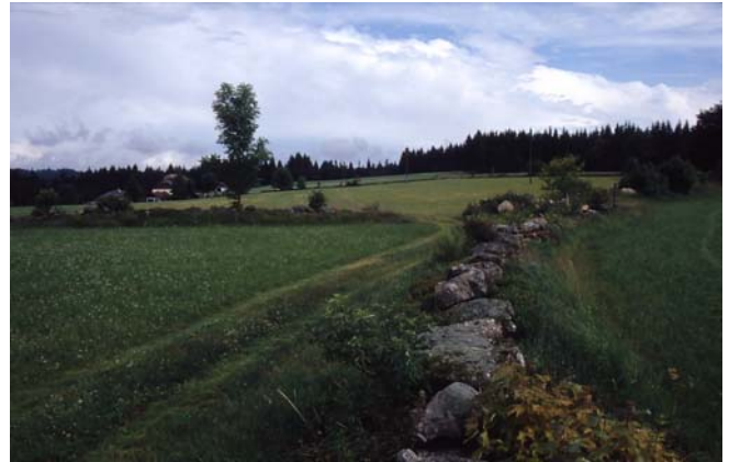
Foto 59: Noch vorbildlich offen erhaltene Steinwälle auf der Eben