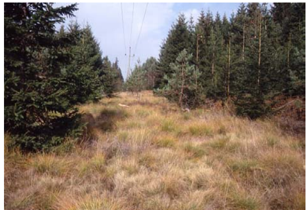
Foto 45: Leitungsschneise durch teilweise verforstete Moorteile der Lambartsau