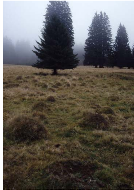
Foto 24: Magerwiese bzw. -weide mit markanten Solitärbäumen beim Kleinen Rosenhofteich