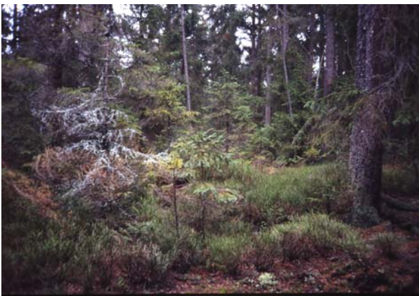
Foto 25: Detail aus Moorwald östlich Großem Rosenhofteich