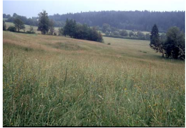
Foto 83: Brutwiesen am Viehberg: sollten möglichst spät gemäht werden