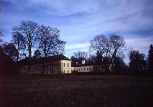
Foto 7: Schloß Rosenhof mit seinen landschaftsprägenden Parkgehölzen