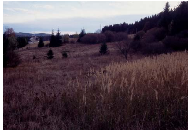
Foto 16: Für Wiesenvogelarten zu stark verbuschte Brache in Schönberg