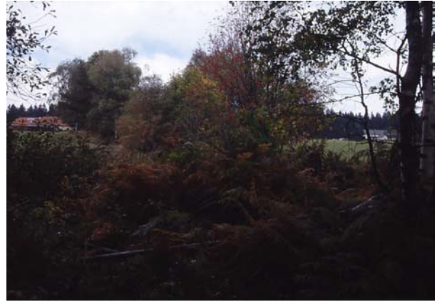
Foto 41: Hohlweg Steinkreuz – Viehberg: Stark verwachsener Bereich, Heckeneinmündung