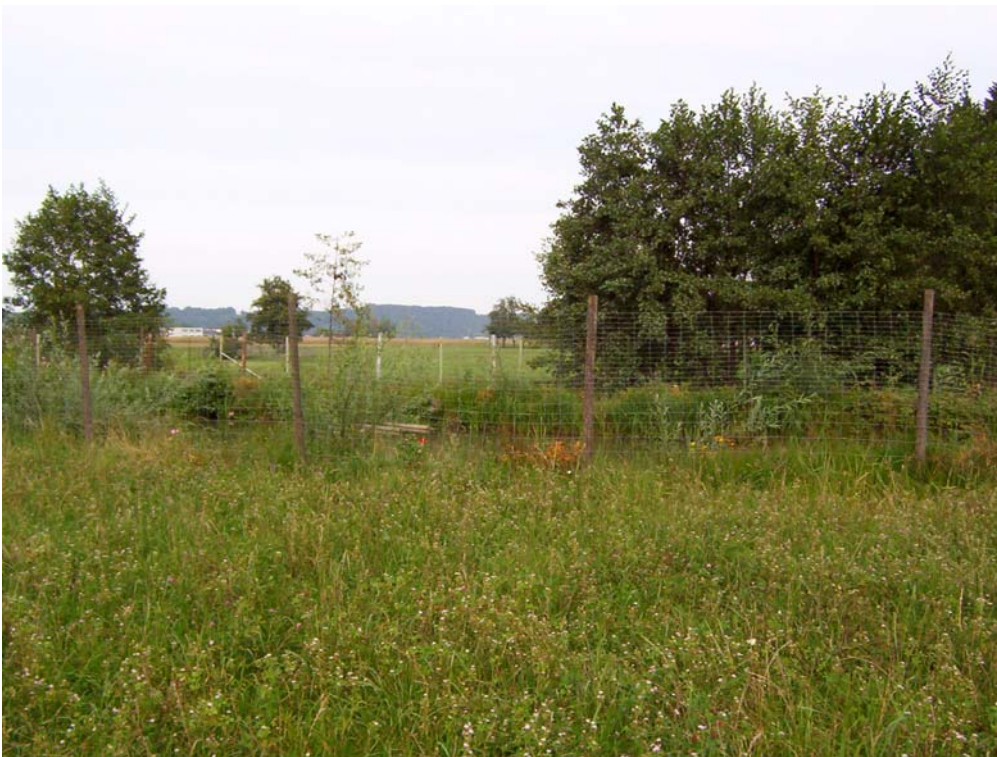
Foto 4: Fischeich westlich Oberregau, Teilraum „Ebenes Ager-Aurachtal strukturarm, mit ausgedehnten Siedlungsgebieten“