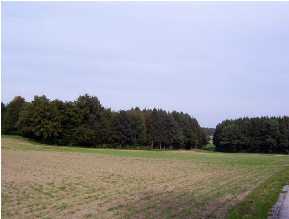
Foto 1: Fichtenwaldflächen mit Laubgehölzsaum und intensiver Ackerbau bei Roith im Teilraum „Wenig strukturiertes Hügelland südlich des Buchberges“