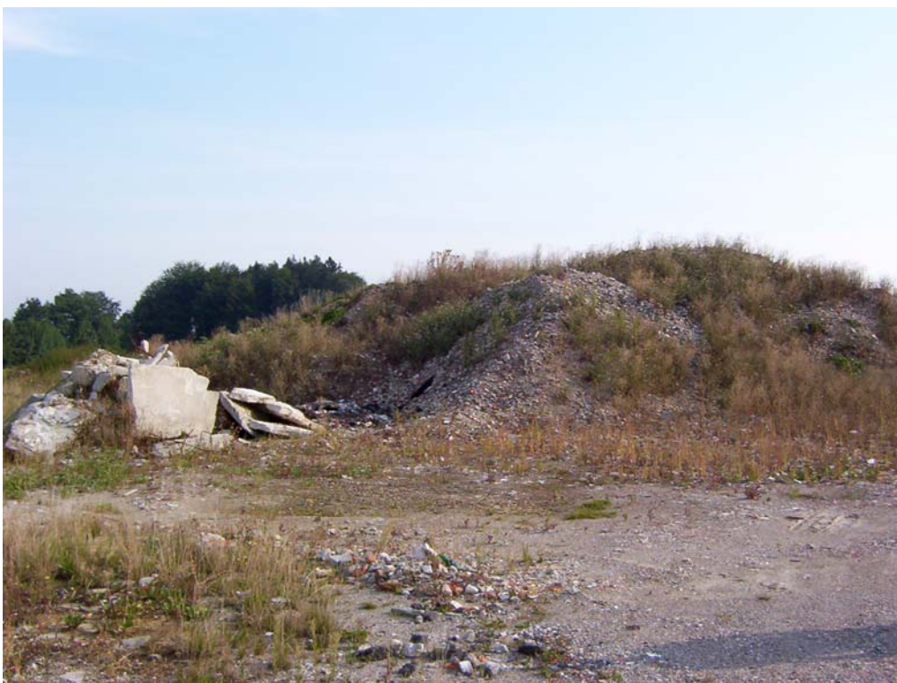
Foto 6: Bauschuttdeponie bei Weinberg im Teilraum „Strukturarme Ager-Hochterrasse“