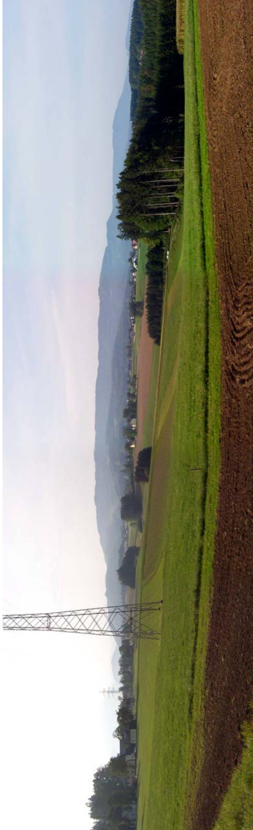
Foto 14: Blick von Kirchberg in den Teilraum „struktureiches Hügelland“, im Hintergrund der Teilraum „Bewaldete Traun-Atterseer Flyschberge“