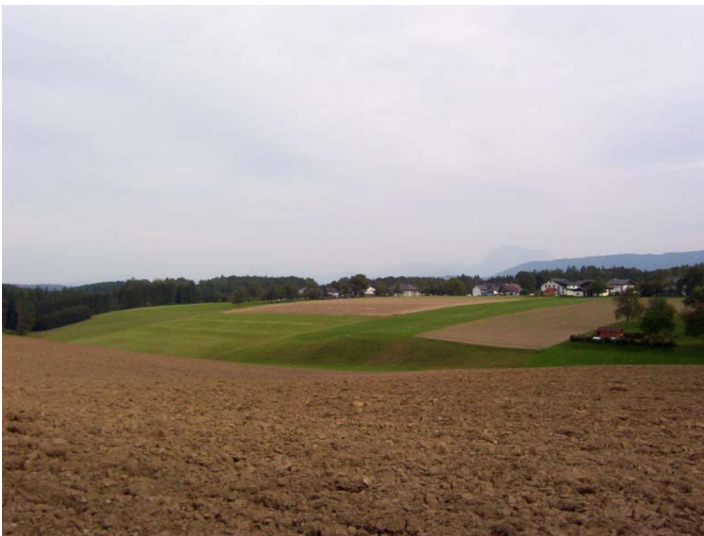
Foto 2: Intensive Landwirtschaft und Siedlungsnutzung bei Schönberg im Teilraum „Wenig strukturiertes Hügelland südlich des Buchberges“