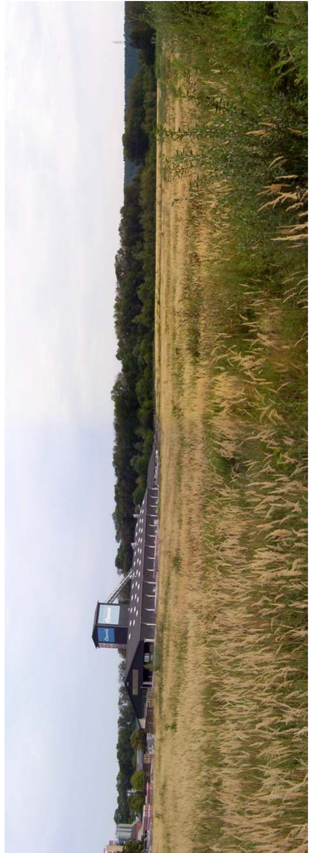
Foto 13: Sukzessionsfläche im Agertal, im Hintergrund Ufergehölz der Ager und bewaldeter Terrassenkante