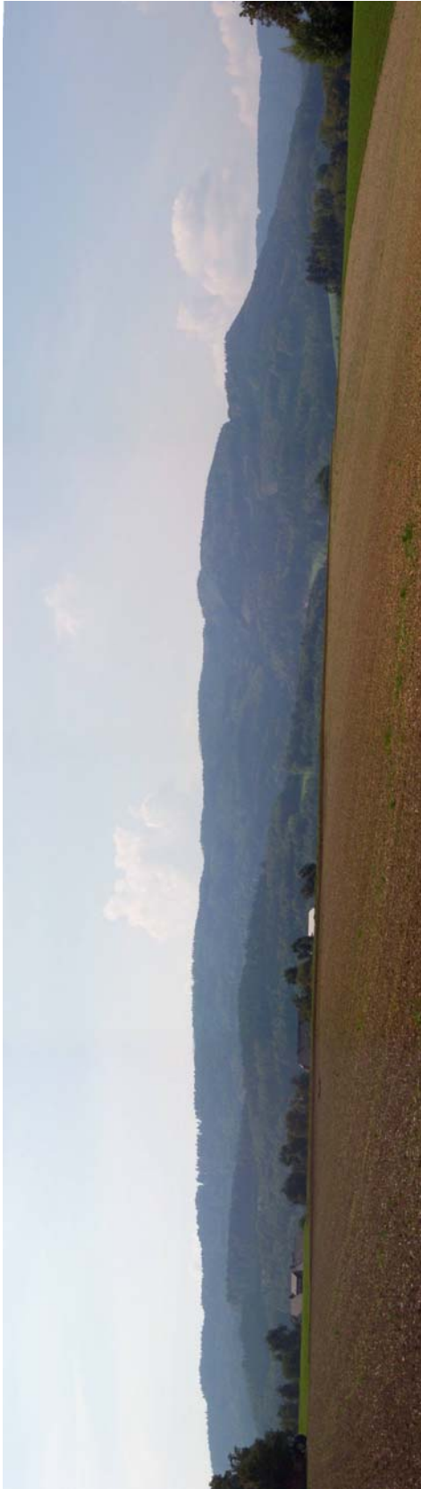
Foto 16: Teilraum „Bewaldete Traun-Atterseer Flyschberge“, im Vordergrund der Kropfberg (626m), dahinter der Höhenzug des Hongars mit Schimpelgupf (838m) und Hohe Luft (917m)