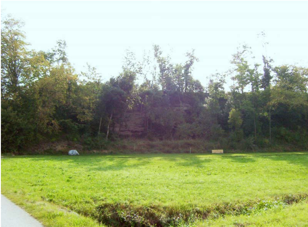
Foto 7: Markante Terrassenböschung östlich Dorf, im Teilraum „Strukturreiches Hügelland mit höherer Reliefenergie“