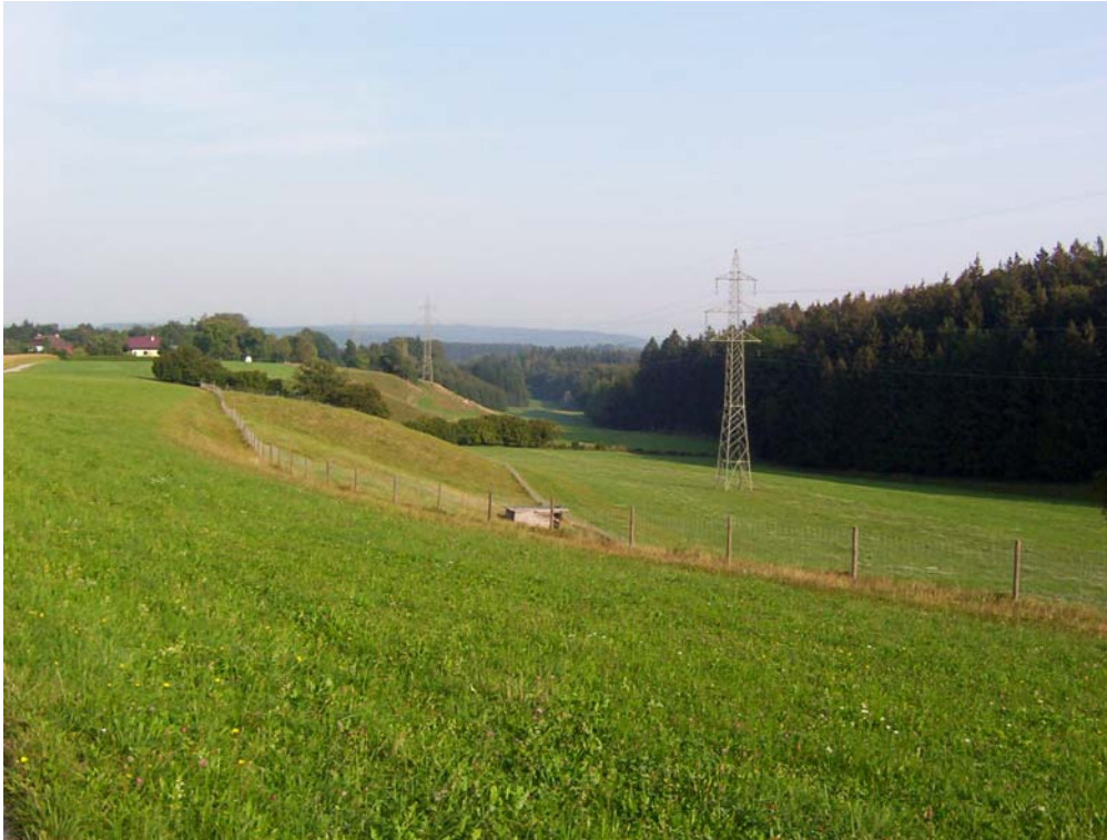
Foto 5: Markante Böschung als Weidefläche genutzt, nördlich Kirchdorf Teilraum „Strukturreiches Hügelland mit höherer Reliefenergie“