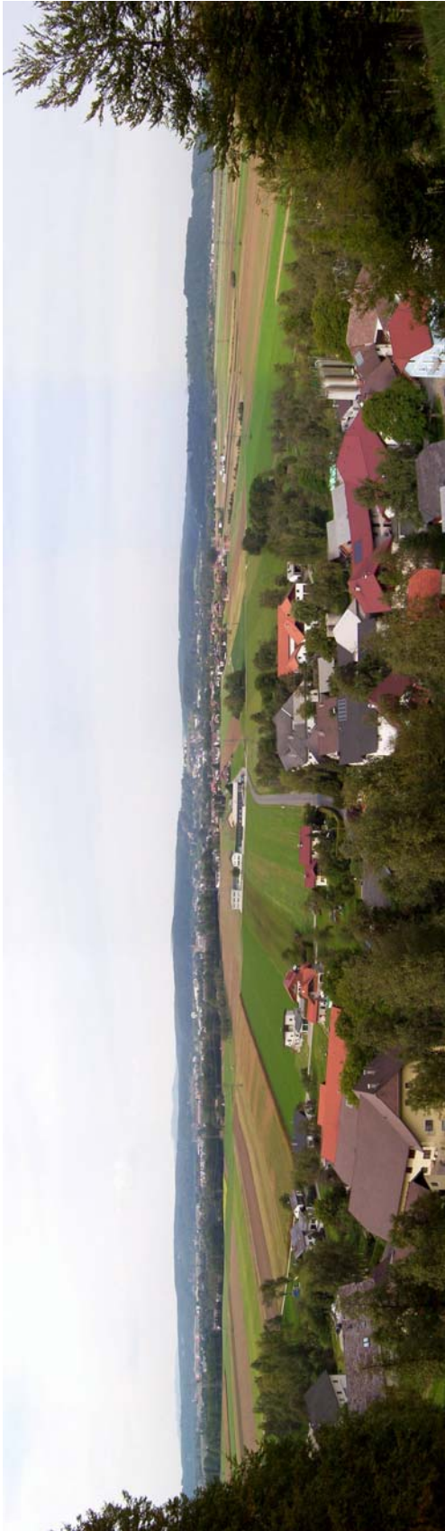
Foto 12: Blick in das Agertal mit intensiver landwirtschaftlicher Nutzung und Siedlungstätigkeit, im Vordergrund Oberregau