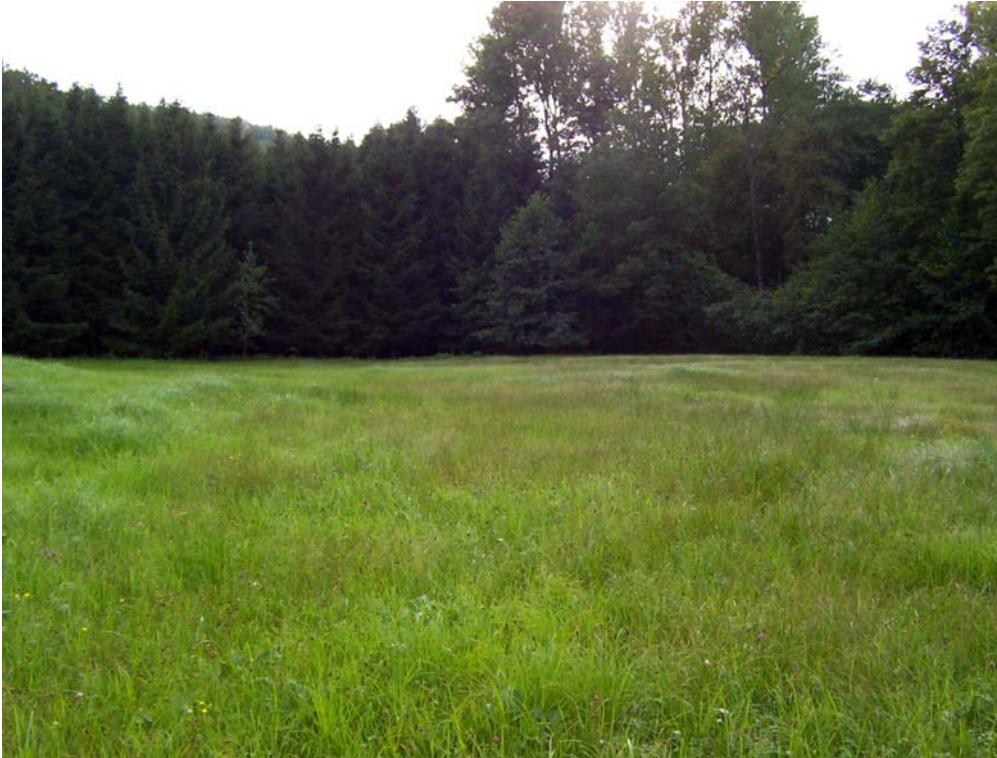
Foto 3: Feuchte Wiese westlich Oberregau, Teilraum „Ebenes Ager-Aurachtal strukturarm, mit ausgedehnten Siedlungsgebieten“