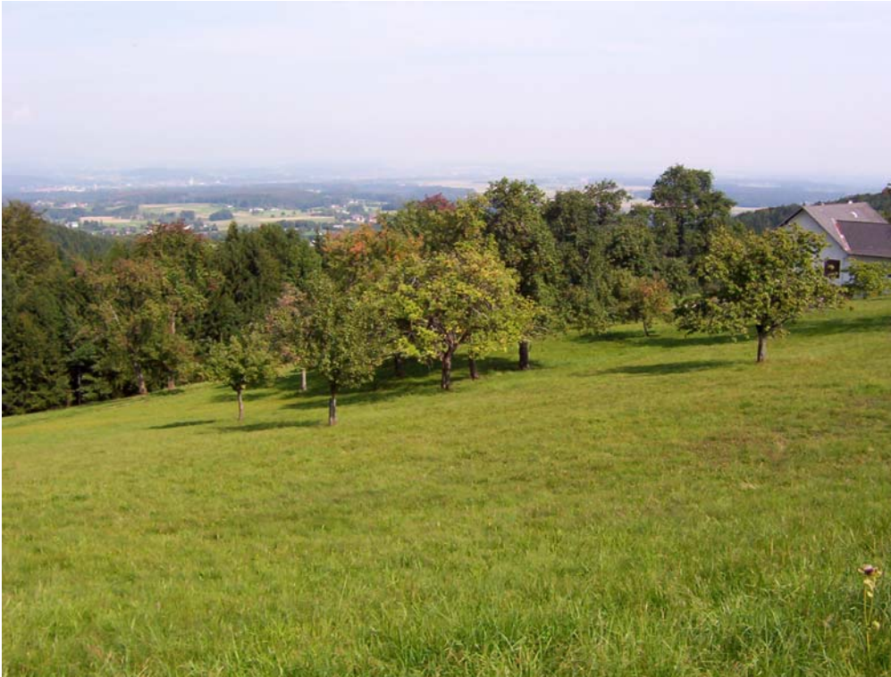
Foto 11: Streuobstwiese bei Vöcklaberg im Teilraum der „Bewaldeten Traun-Atterseer Flyschberge“