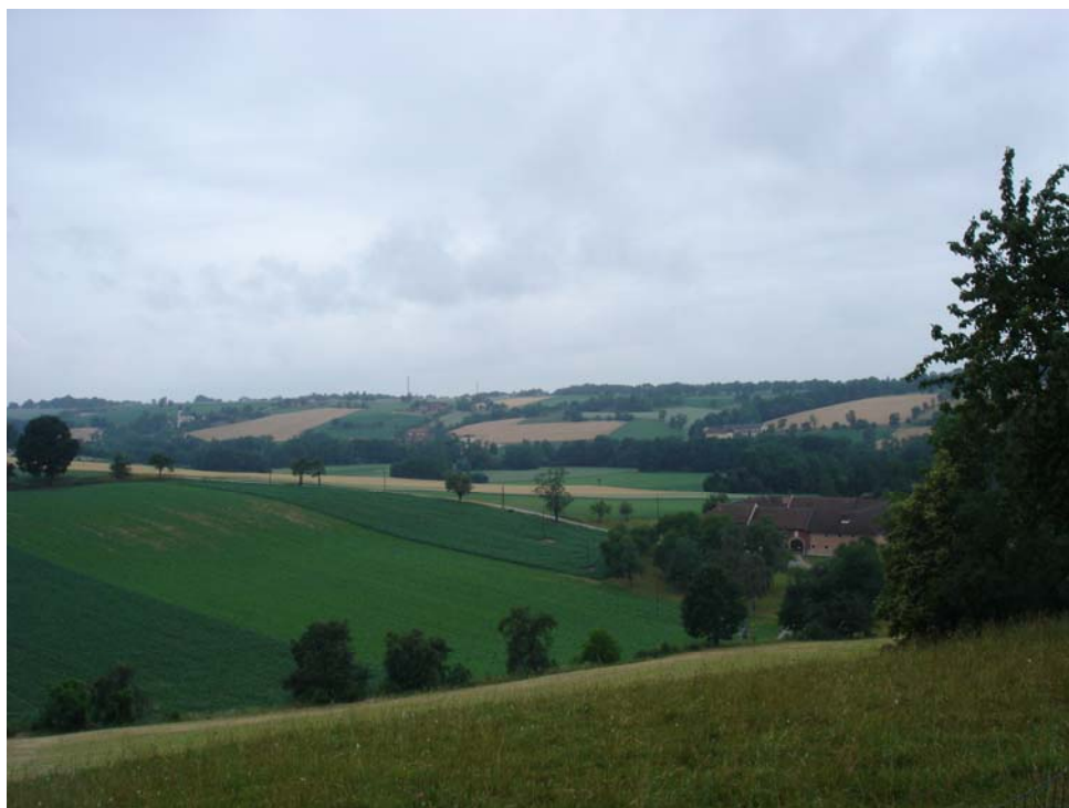
Abb. 13: Landschaftsüberblick