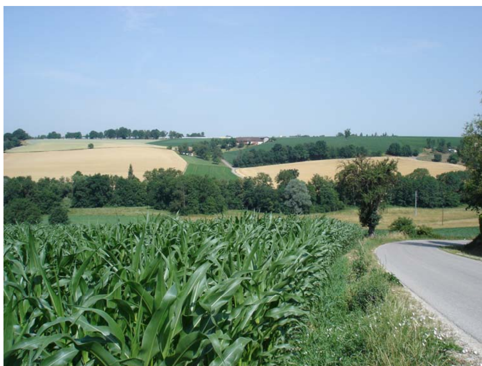
Abb. 16: Puckinger Leiten mit Gehöften und Laubwald