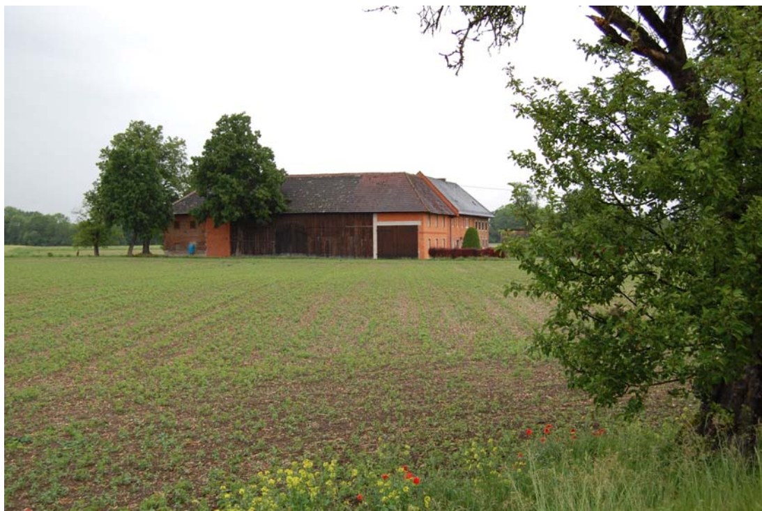
Abb. 5: Landschaftstypischer Vierkanthof