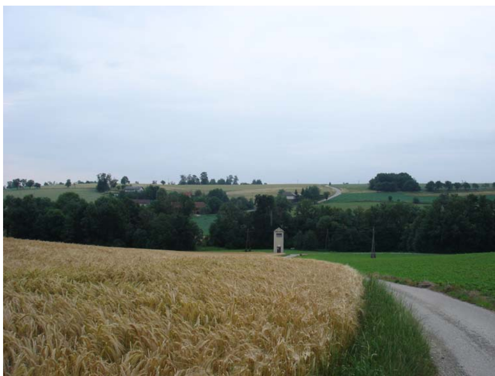
Abb. 8: Blick über Moränenhügelland Richtung Süden