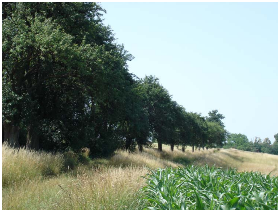
Abb. 17: Obstbaumreihe