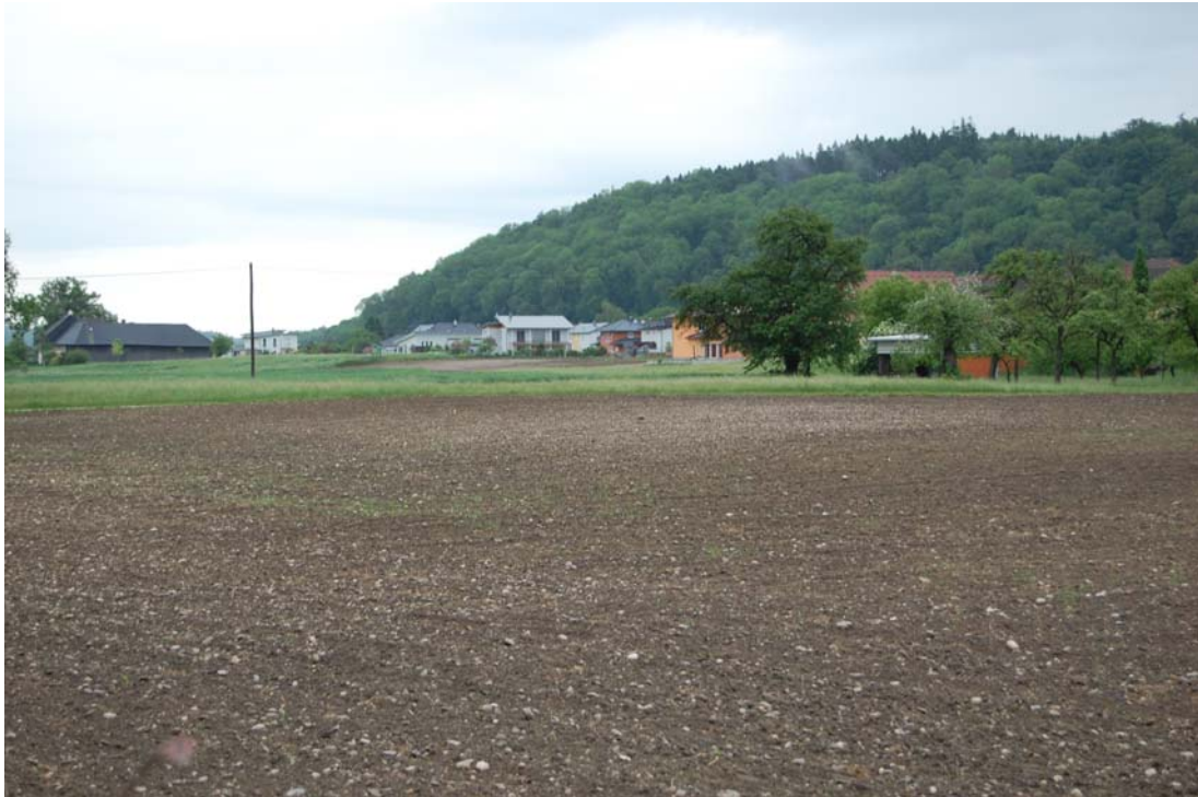
Abb. 3: Siedlungsrand zur Puckinger Leiten mit lockerem Streuobstbestand