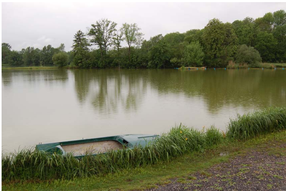
Abb. 1: Stillgewässer Nr. 425