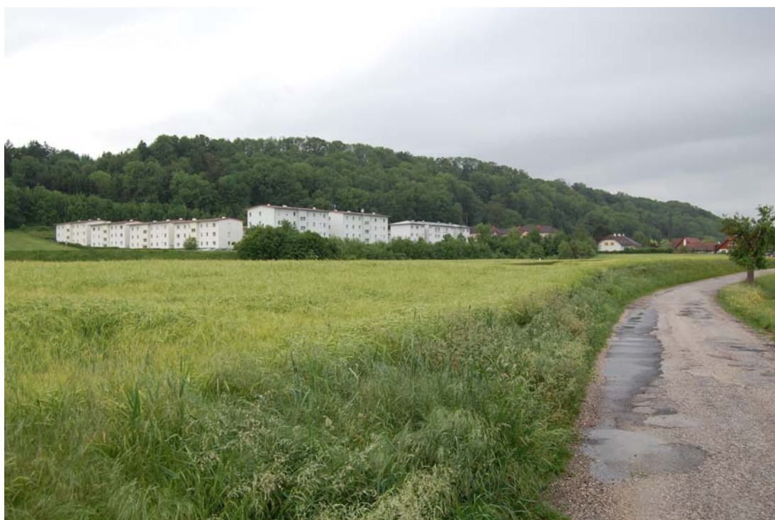
Abb. 6: Beispiel für nicht landschaftsgerechte Bauweise