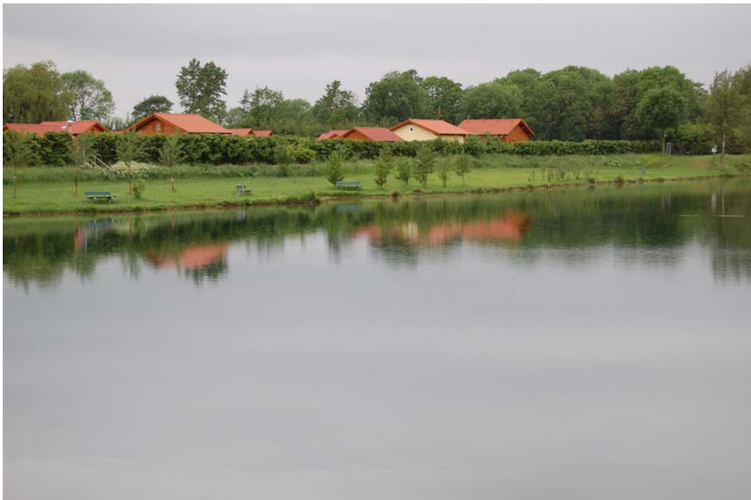
Abb. 4: Stillgewässer Nr. 411: Puckinger Badesee