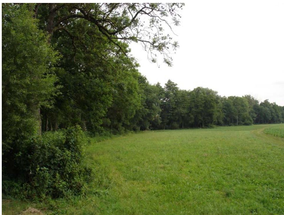
Abb. 10: Gut Strukturiertes Uferbegleitgehölz