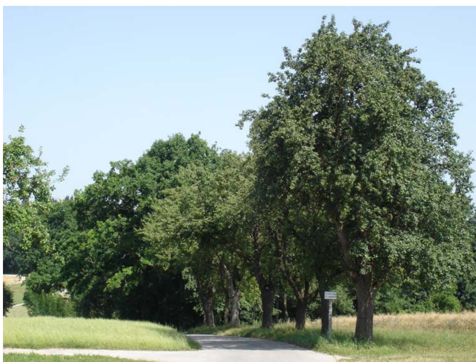
Abb. 14: Obstbaumreihe