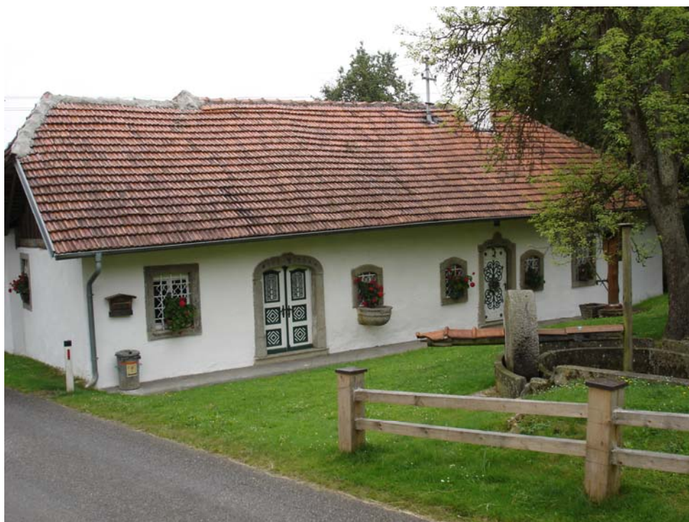
Abb. 12: Altes Gehöft