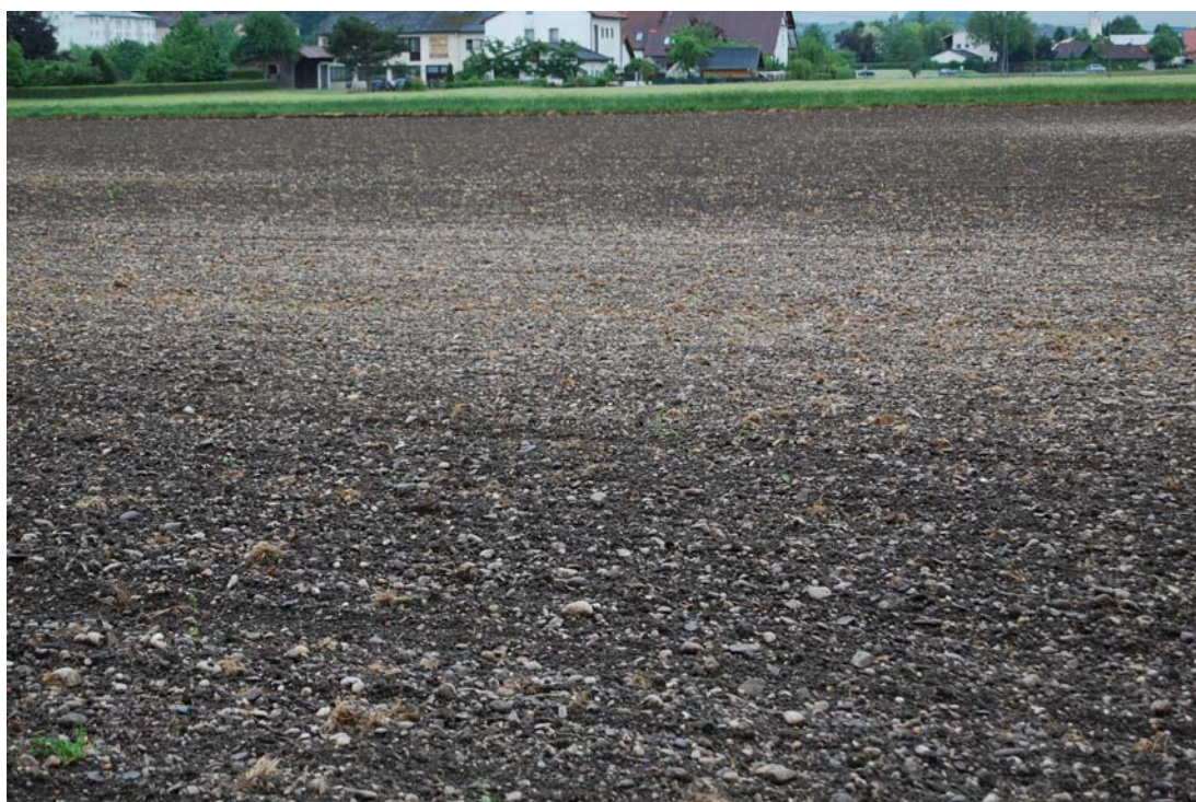
Abb. 2: Kiesacker auf einer Niederterrasse