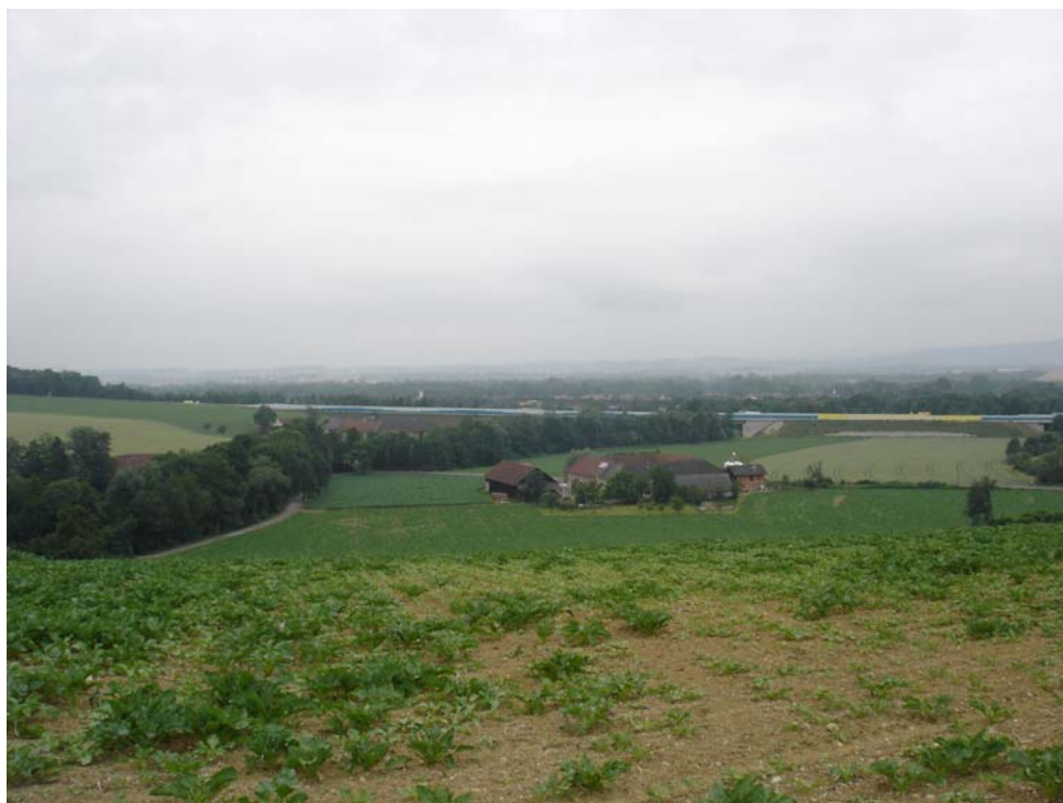
Abb. 11: Blick über Vierkanthof, im Hintergrund die Autobahn