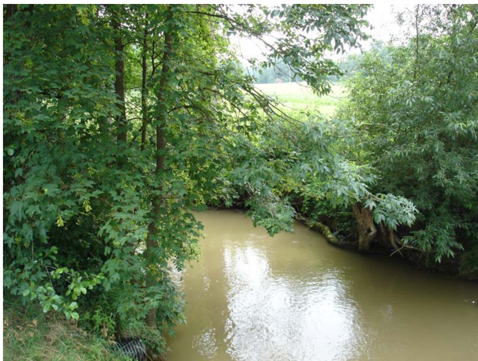
Abb. 9: Fließgewässer mit Uferbegleitgehölz