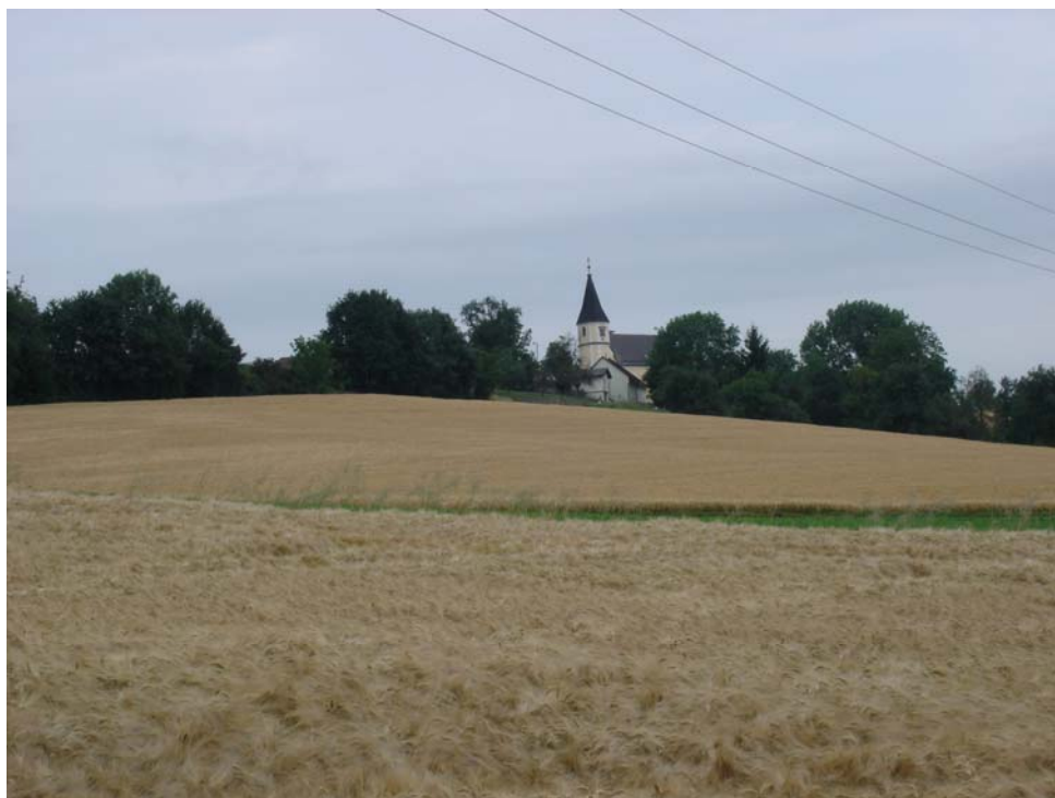
Abb. 7: Intensiver Getreideanbau, im Hintergrund die Kirche St. Leonhard