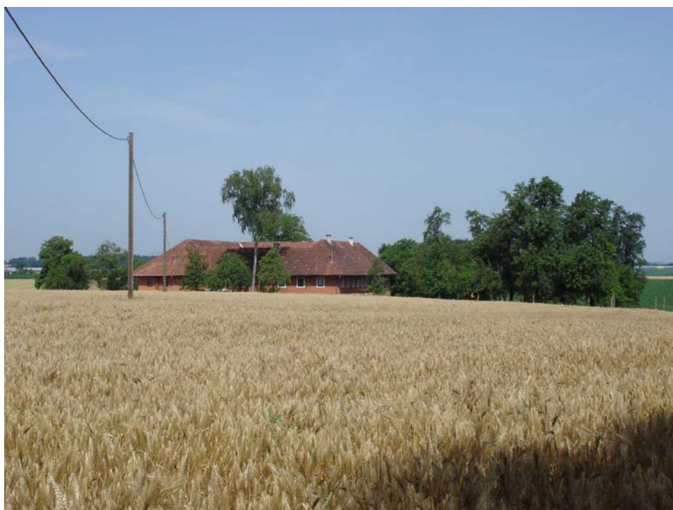
Abb. 18: Gehöft mit Getreideanbau und Streuobstwiese