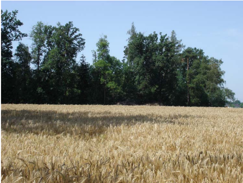
Abb. 19: Getreidefeld mit Mischwald