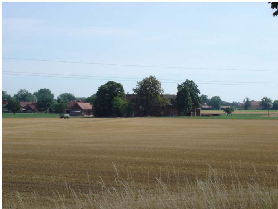
Abb. 15: Gehöft mit Ackerflächen und Streuobstbestand