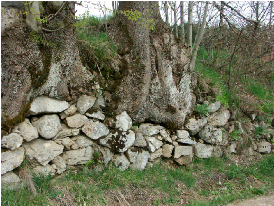
Abb. 5: Schlichtsteinmauer mit alten Eschen bei Berlesreith