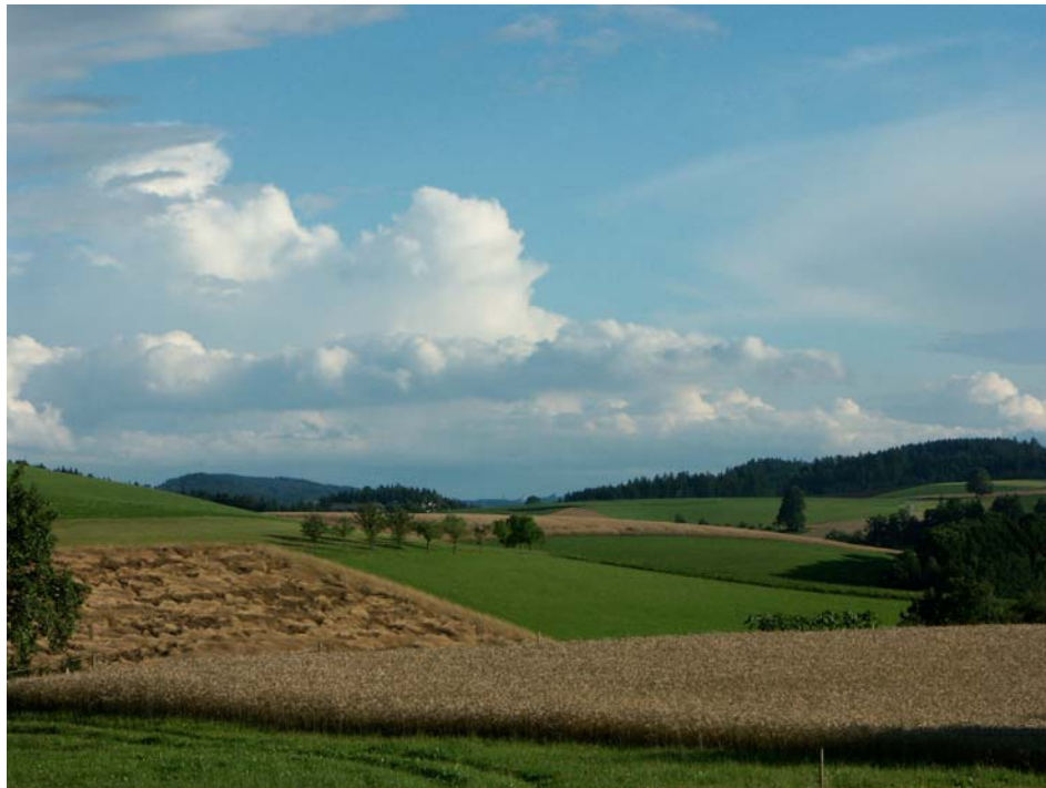
Abb. 1: Südblick von Peherstorf