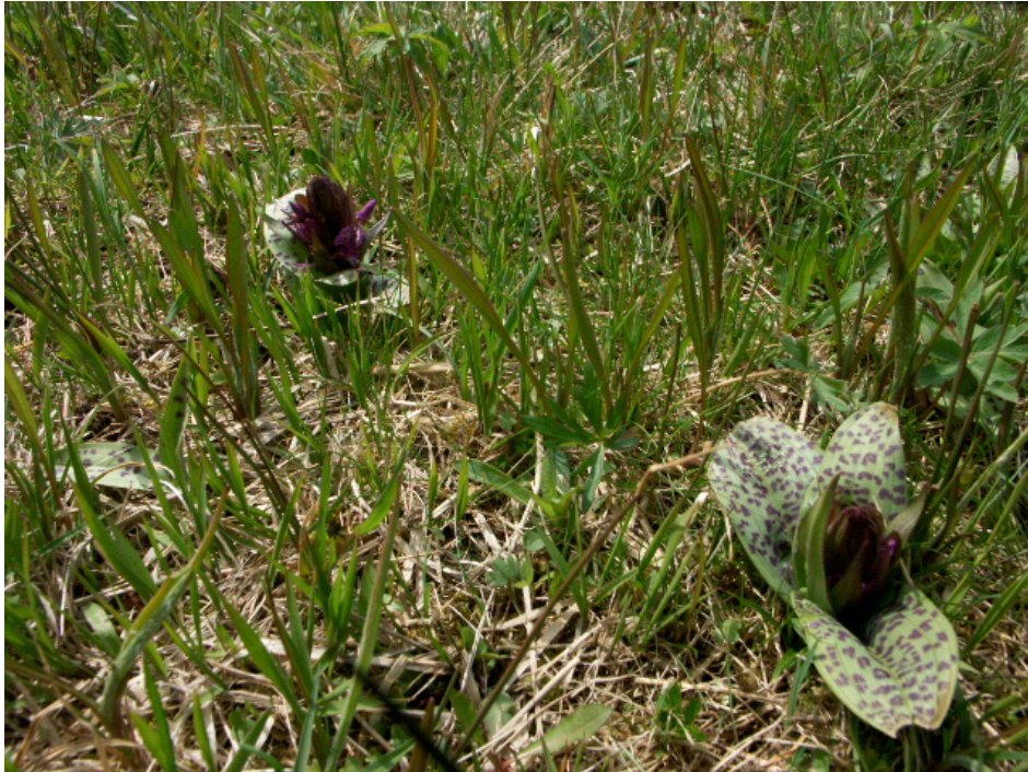
Abb. 7: Breitblättriges Knabenkraut zwischen Oberneudorf und Haugsberg