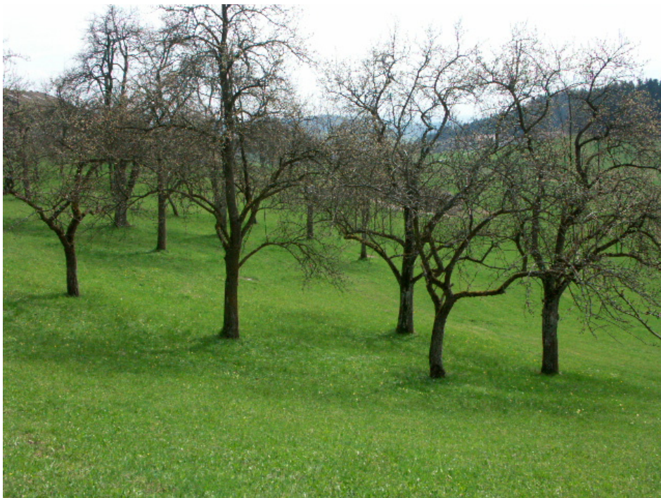
Abb. 8: Ausgedehnter Obstgarten bei Oberneudorf, Standort des Hohlen Lerchensorns