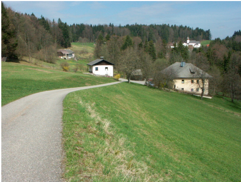
Abb. 11: Landwirtschaftliches Grenzertragsgebiet und buchenreiche Mischwälder bei St. Wolfgang