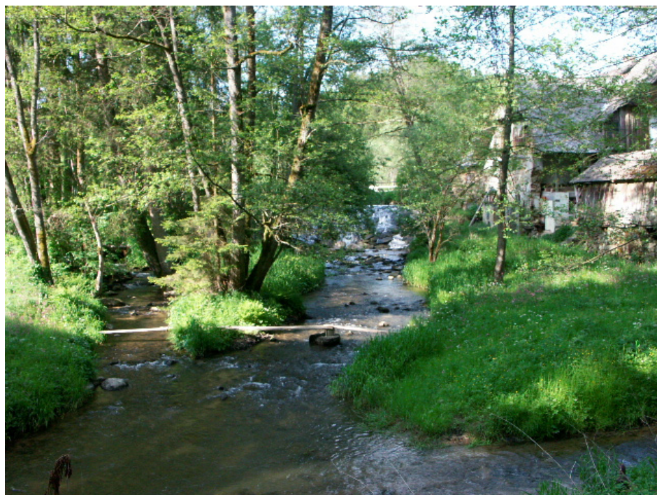
Abb. 17: Kleine Mühl bei der Neumühle