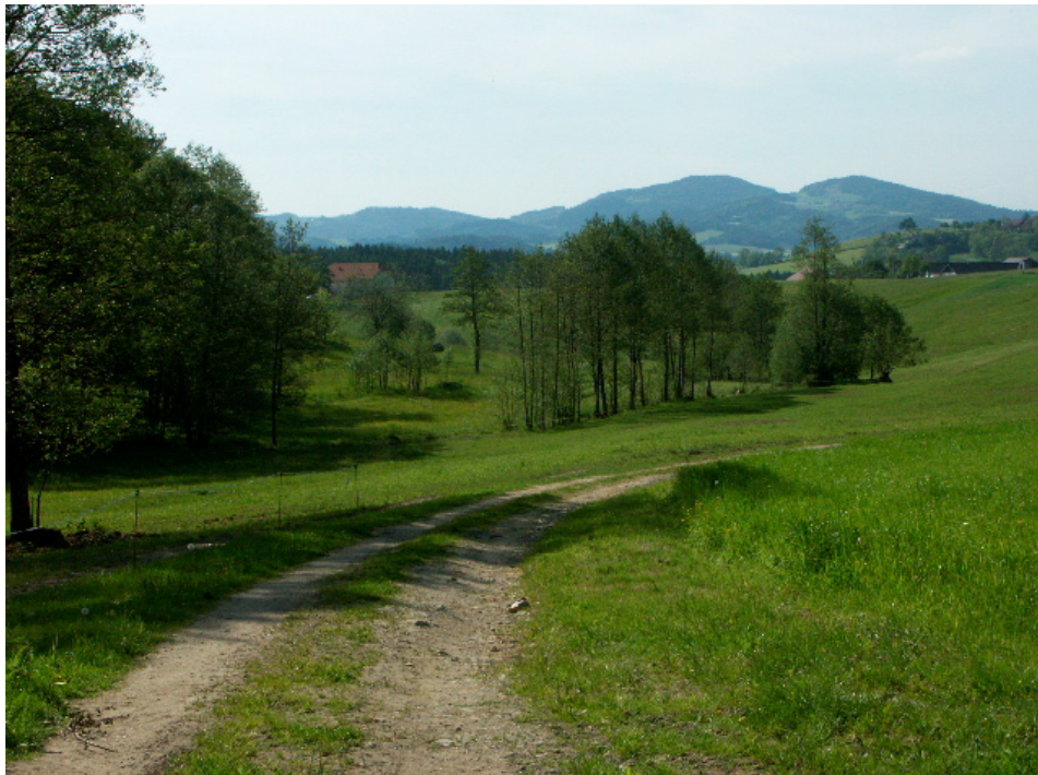
Abb. 12: Landschaft südöstlich Dobretshofen