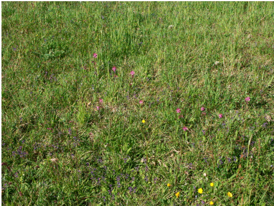
Abb. 13: Grusrasen mit Buntem Vergissmeinnicht bei Peherstorf