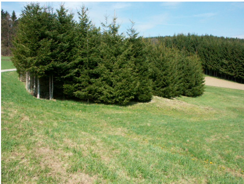
Abb. 10: Aufgeforstete Extensivwiese mit kleinem Quellmoor bei Oberneudorf