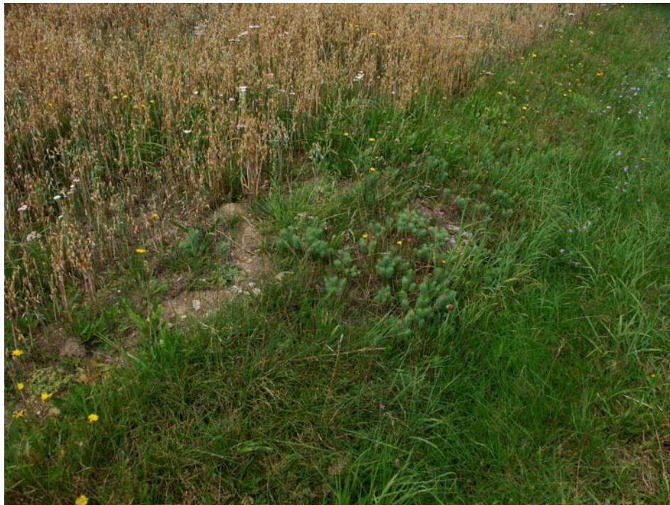
Abb. 3: Magerer Feldrain und Ackerrand bei Untergrünau