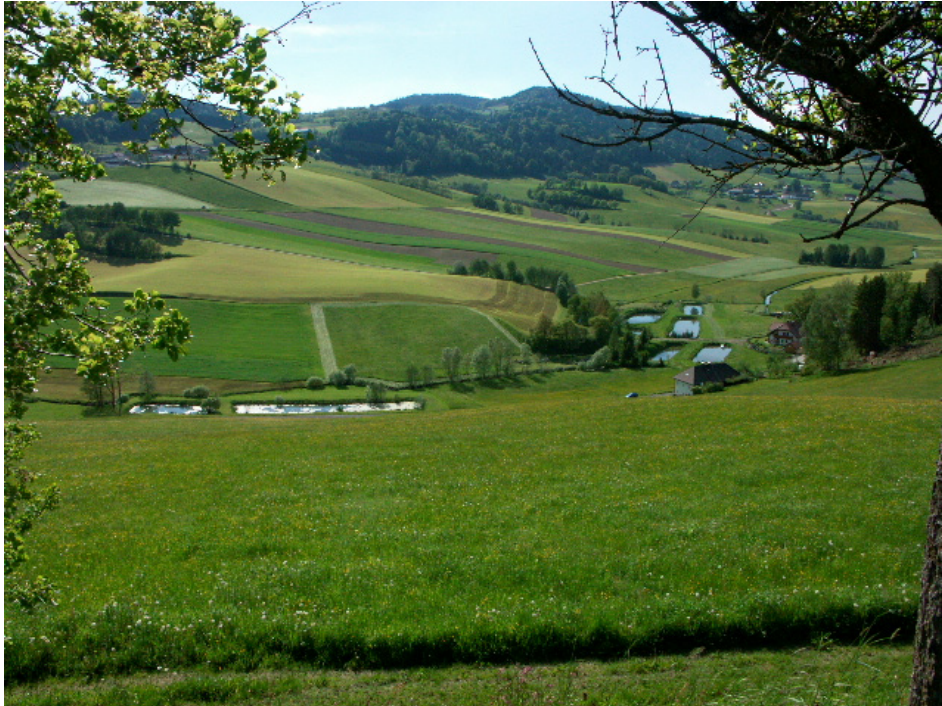
Abb. 15: Tal der Kleinen Mühl an der Peilsteiner Ortsgrenze