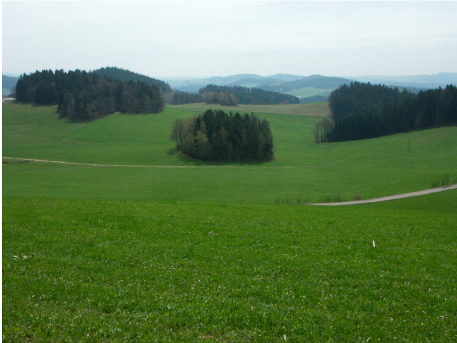
Abb. 9: Großflächige Wiesenflur bei Oberneudorf