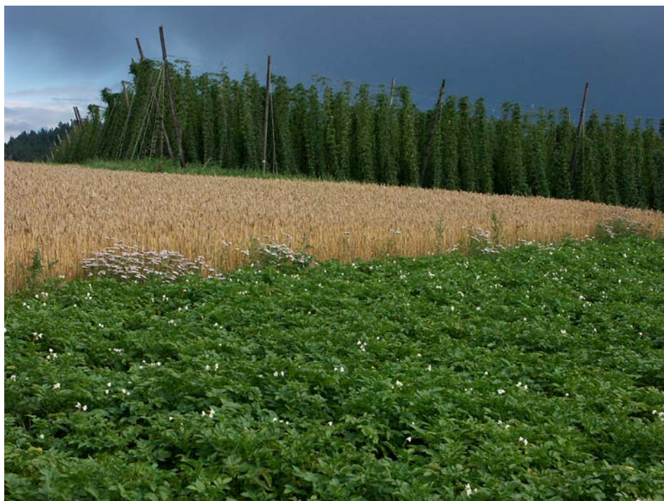
Abb. 2: Salaberger Hopfenkultur