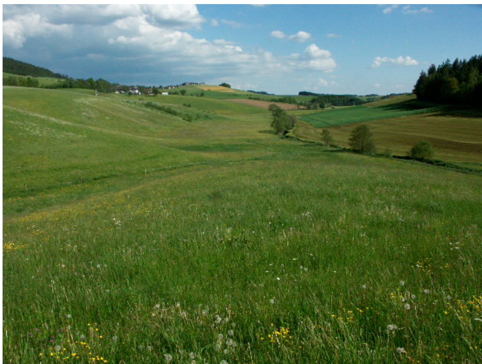
Abb. 14: Wiesengebiet bei Obermayrhof