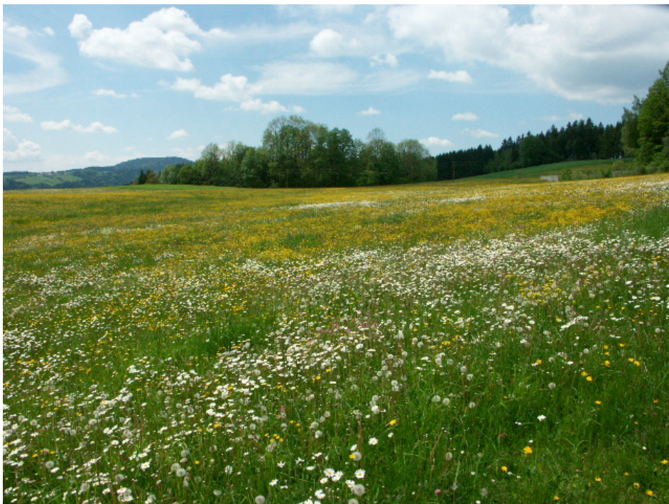
Abb. 16: Blumenwiesen bei Berlesreith / Hochreit