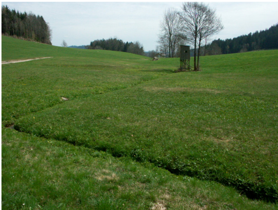
Abb. 6: Magerwiese und traditioneller Wiesengraben bei Haugsberg