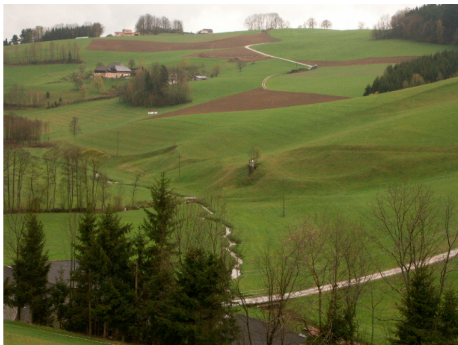
Abb. 4: Tallandschaft am Fischbach mit Magerwiesen an Böschungen