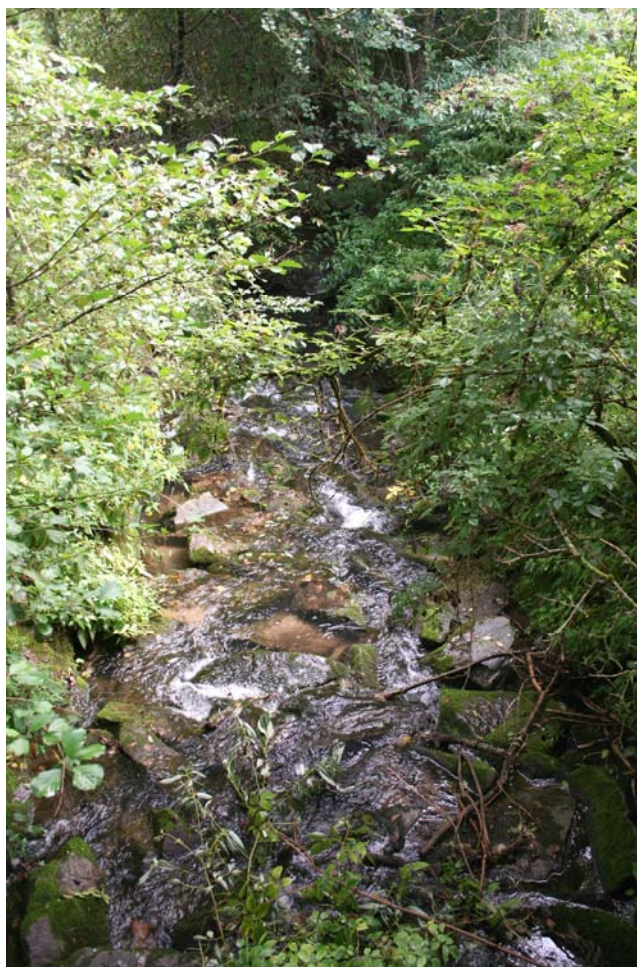
Abb. 3: Gewässer bei Albertsham, flussabwärts