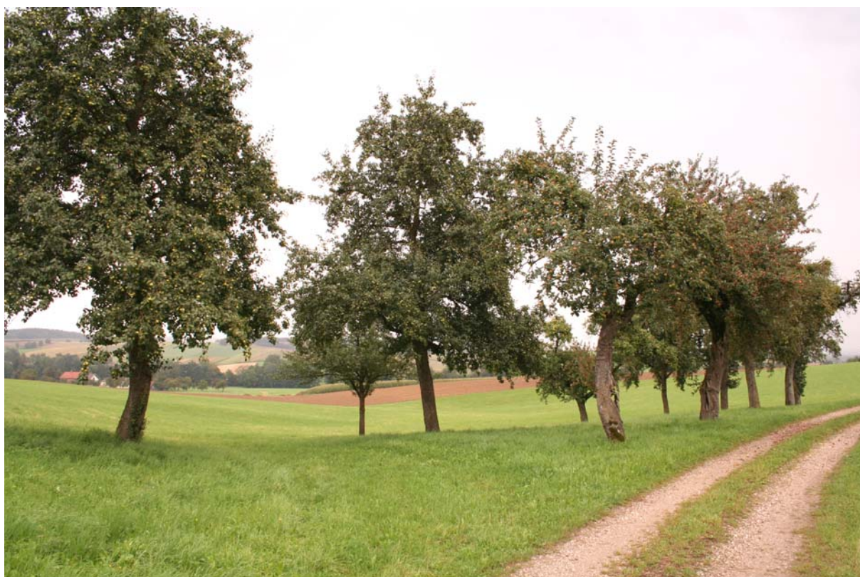
Abb. 2: Streuobstwiese östlich von Bergham