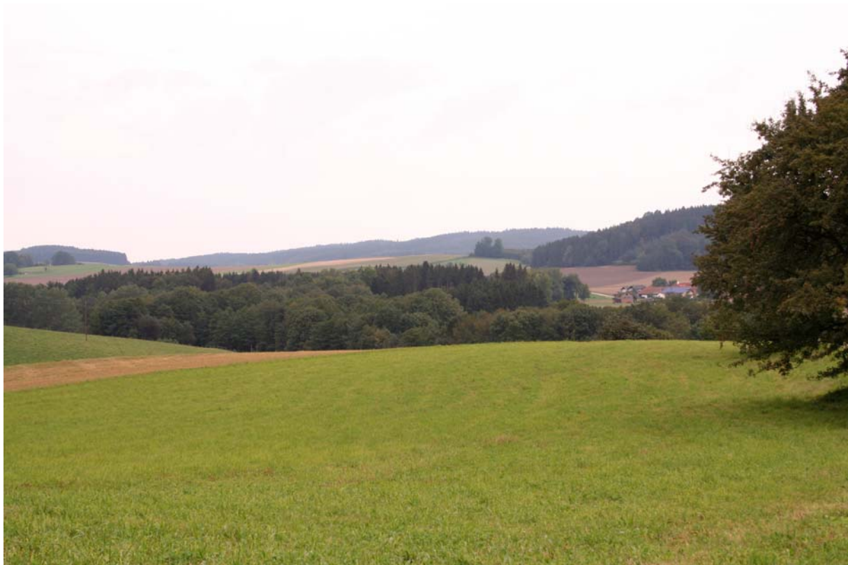
Abb. 7: Wald- und Ackerdominierte Landschaft bei Moosham