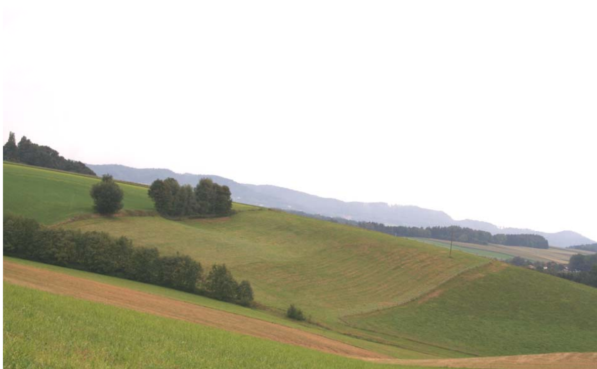
Abb. 1: Böschungsstrukturen mit Hecke und Baumreihe