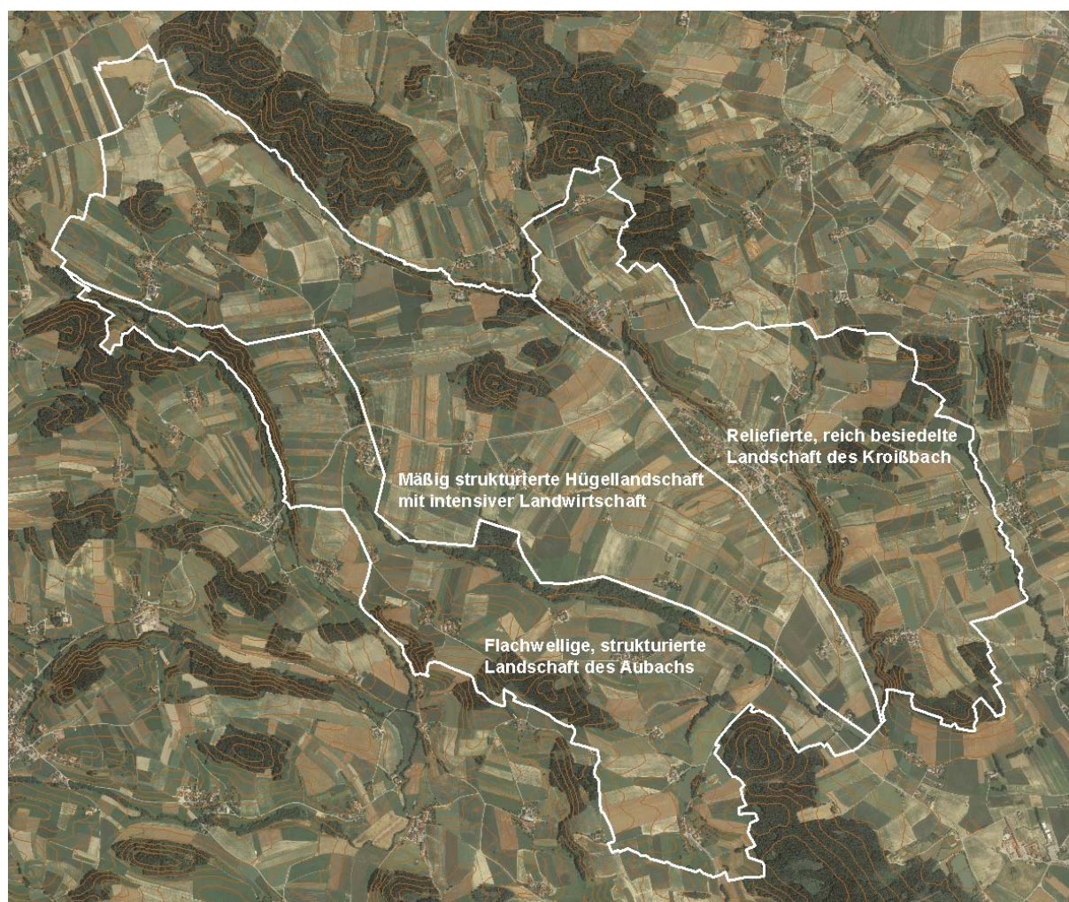
Abb. 2: Übersicht über das Erhebungsgebiet, Abgrenzung der Teilgebiete; Grundlage: Orthofoto

Teilgebiet 1: Reliefierte, reich besiedelte Landschaft des Kroißbach