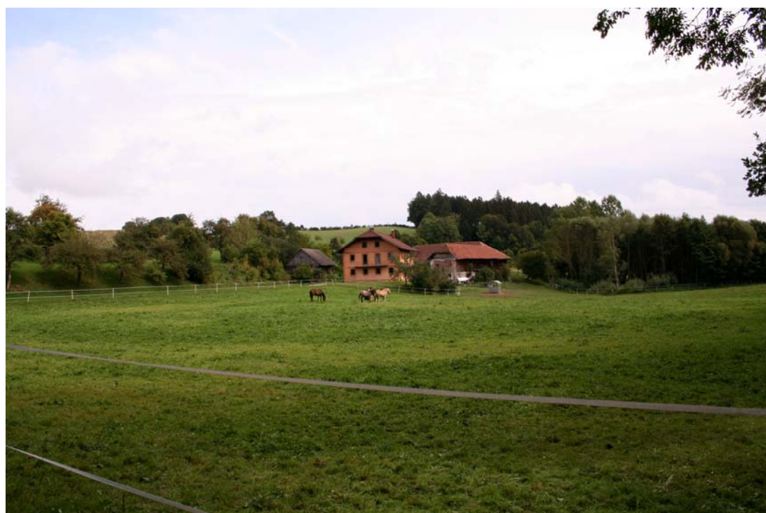
Abb. 4: Pferdehof südlich Albertsham