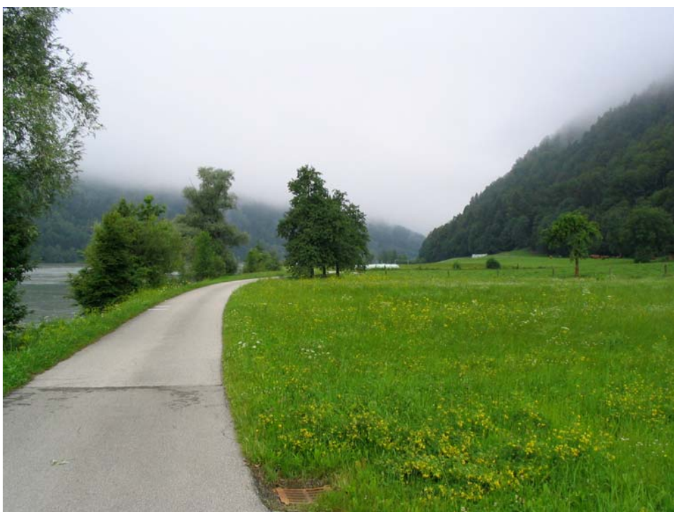
Foto-Nr. 41322010. Im Gebiet von Grafenau ist den Donauhängen ein schmaler landwirtschaftlich genutzter Streifen vorgelagert, der größtenteils als Natura 2000 Gebiet nominiert ist (Teilgebiet 2).