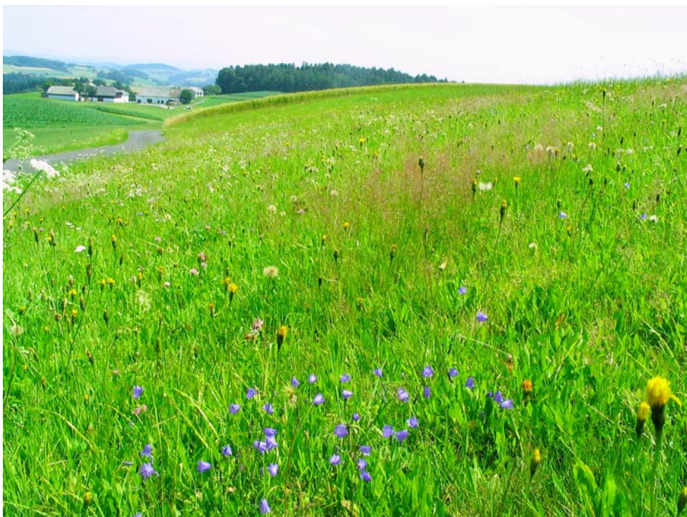
Foto-Nr. 41322004. Flachgründige und dadurch meist etwas trockenere Stellen im Grünland zeigen sich in größerem Artenreichtum.