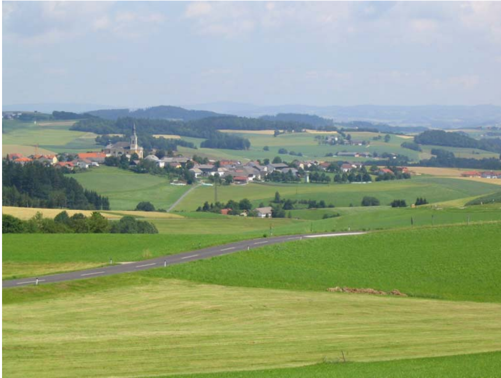
Foto-Nr. 41322013. Überblick über das reliefierte Kuppenland mit dem Hauptort Niederkappel (Teilgebiet 1).