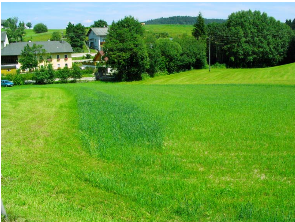
Foto-Nr. 41322006. Eine kürzlich abgeschlossene Verrohrung eines Wiesengrabens ist noch an der frischen Begrünung erkennbar. Ein Großteil der Kleinst-Fließgewässer in der Kulturlandschaft ist davon betroffen.