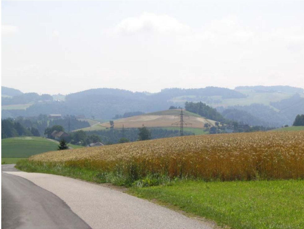
Foto-Nr. 41322011. Vor dem Abfall ins Donautal wird das Hochland besonders hügelreich.