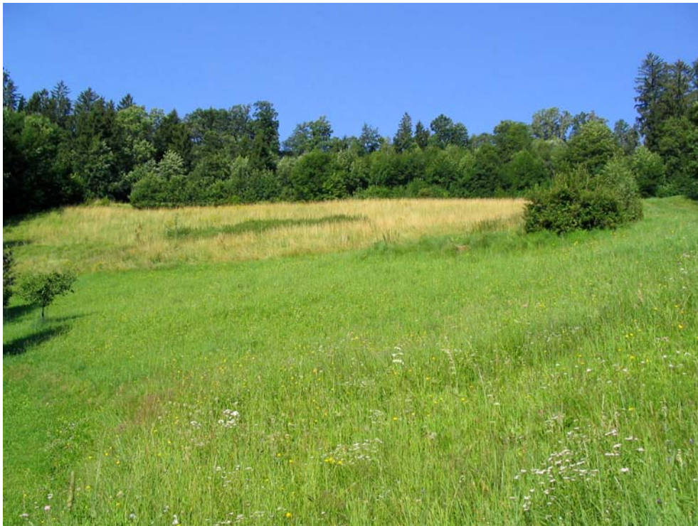
Foto-Nr. 41322001. Die meisten Magerwiesen auf Böschungen sind von Nutzungsaufgabe und Verbrachung betroffen.