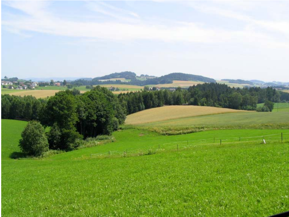
Foto-Nr. 41322003. Im Übergangsbereich zu Wäldern treten viele kleine Fließgewässer wieder zu Tage. Erkennbar ist dies schon von weitem anhand begleitender Gehölzsäume.