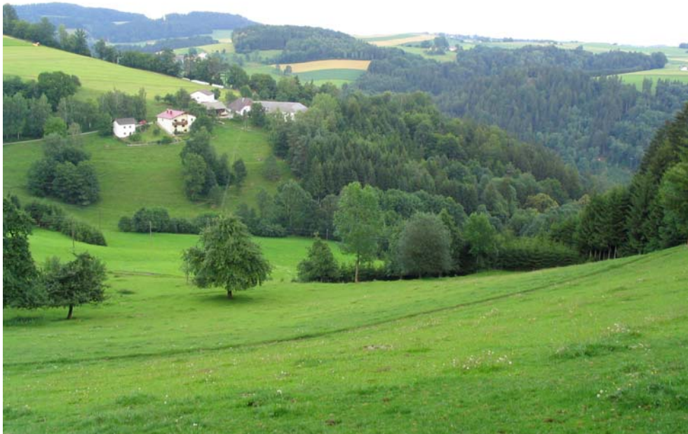
Foto-Nr. 41322009. Reichstrukturiertes Kulturland am Ostabfall zum Tal der Kleinen Mühl (Teilgebiet 3).