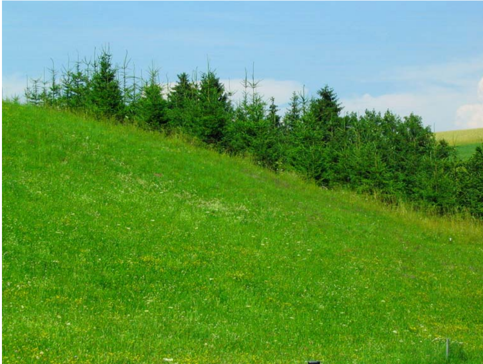
Foto-Nr. 41322007. Im Vordergrund eine noch bewirtschaftete Magerwiese. Der hintere aufgefurstete Teil der Böschung gibt die weitere Richtung vor.