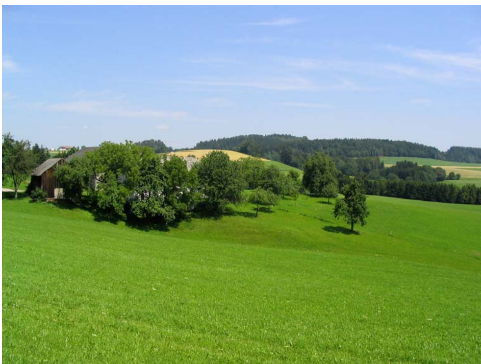
Foto-Nr. 41322002. Streuobstwiesen gehören zu den häufigsten Elementen der Kulturlandschaft von Hofkirchen. Sie verleihen dem oberen Mühlviertel ein Stück seiner Identität und genießen daher meist hohe Wertschätzung und Pflege.