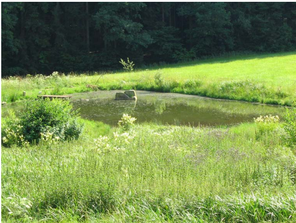
Foto-Nr. 41322008. An den feuchtesten Stellen im Grünland werden häufig kleine Stillgewässer angelegt, die jedoch nur selten naturnah ausgebildet sind. Hier fehlen standortgerechte Gehölze.