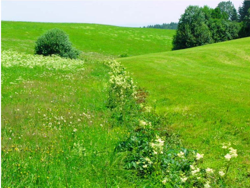
Foto-Nr. 41322005. Die kleinsten Wiesenbäche sind oft nur an schmalen Hochstaudensäumen erkennbar. Meist reicht die Wiesenbewirtschaftung direkt ans Gewässer heran.