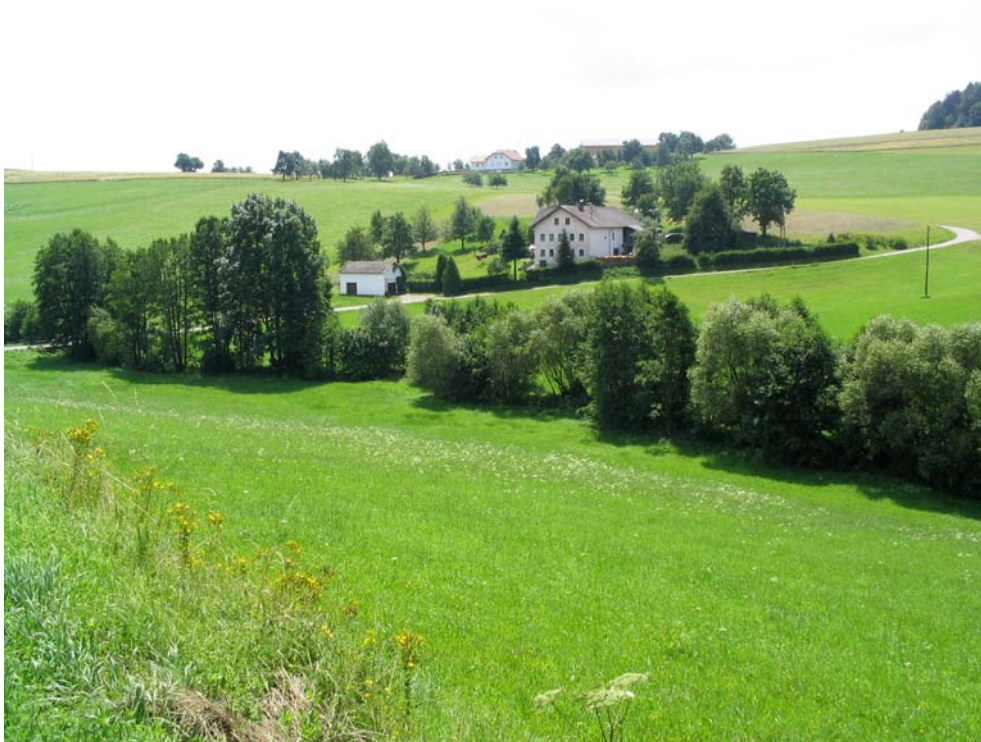
Foto-Nr. 41322012. Naturnahe Bäche mit ausgeprägten Ufergehölzstreifen sind wichtige verbindende Elemente in der intensiv genutzten Kulturlandschaft.