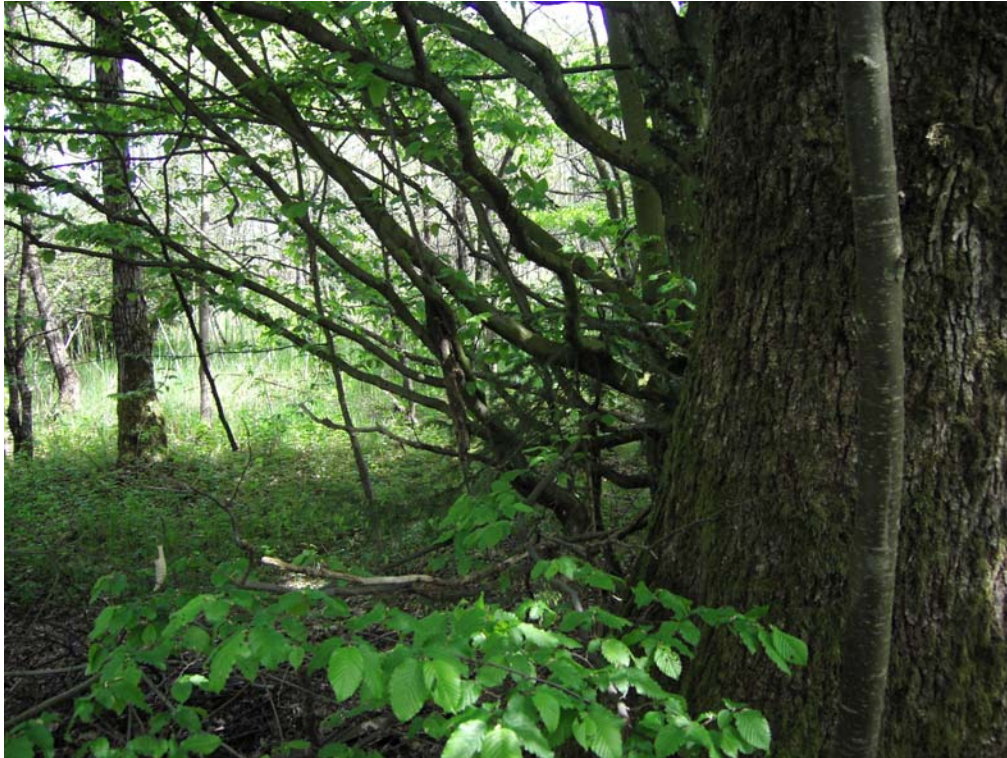
Abb. 07: Feldulmen im Schwarzerlen-Uferbereich am Mondsee.