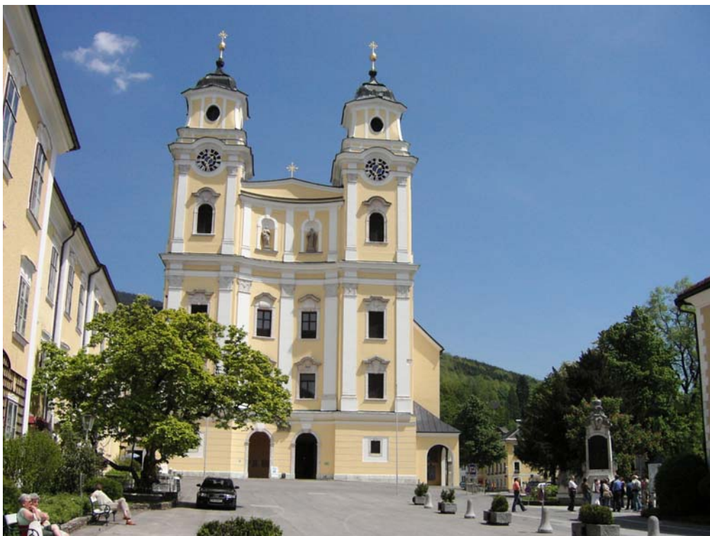
Abb. 08: Stiftskirche Mondsee.