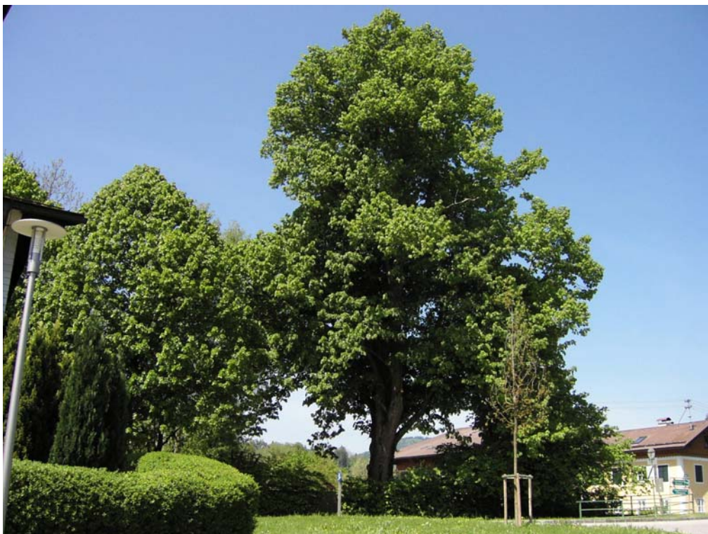
Abb. 16: Einzelbaum: ca. 30 m hohe Sommerlinde.