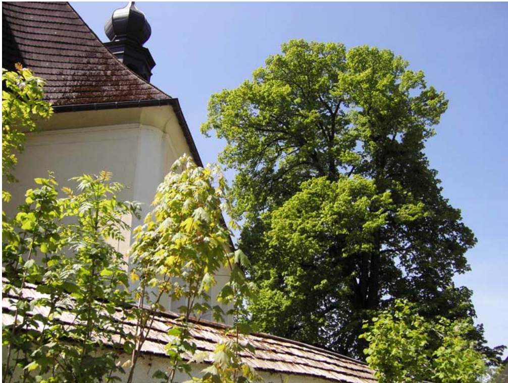
Abb. 13: Prächtige Linde bei Hilfbergkirche.