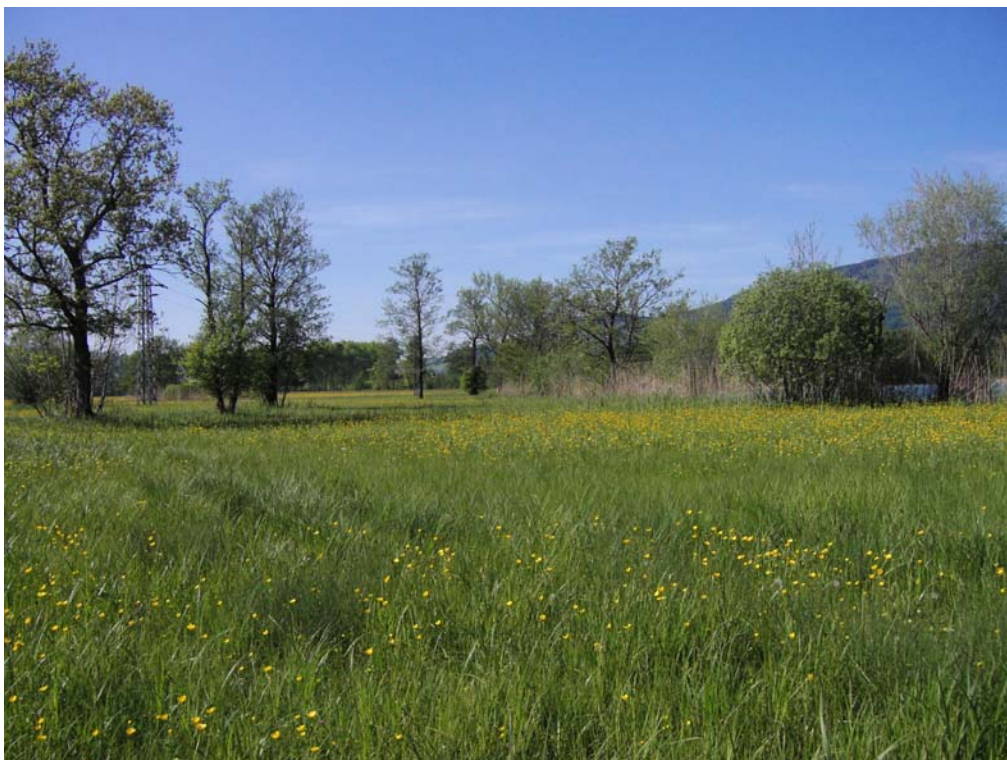
Abb. 04: Streuwiese am Mondseeufer Schwarzindien.