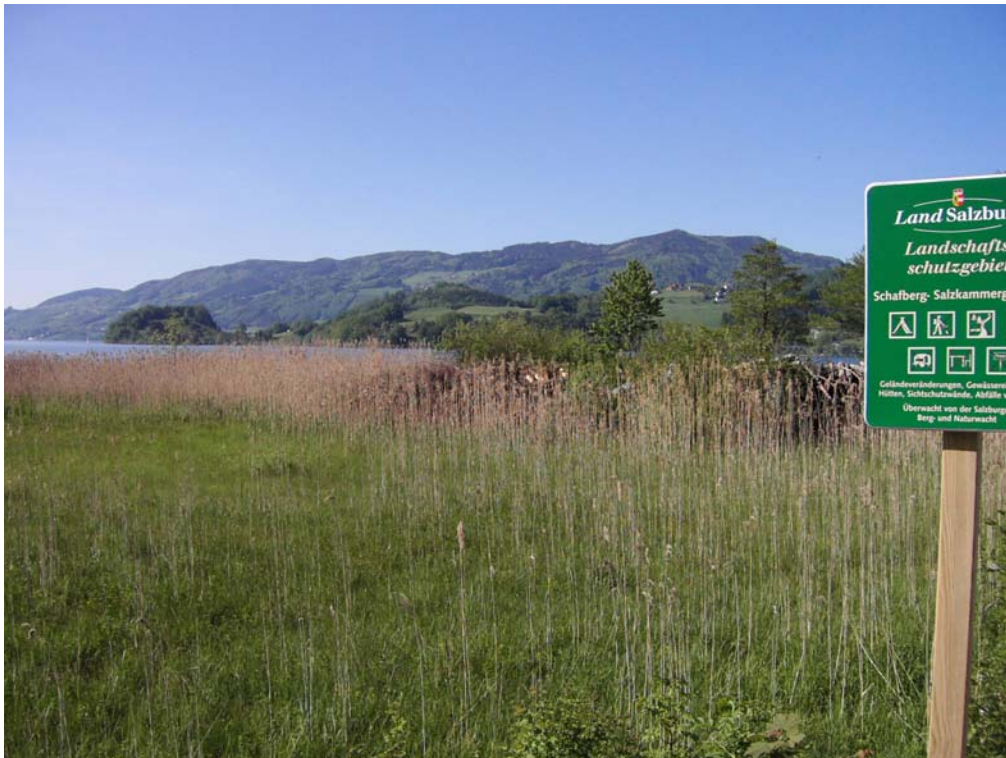
Abb. 01: Schilf- und Seggensumpf N Egelsee