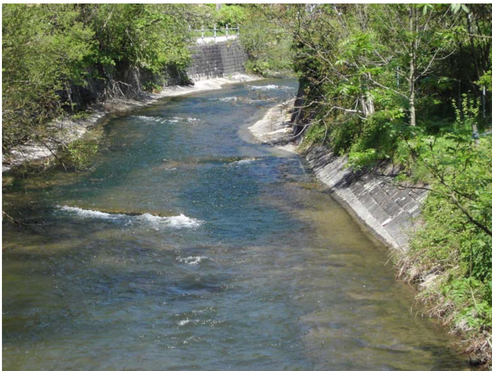
Abb. 16: Verbauter Abschnitt der Zeller Ache.