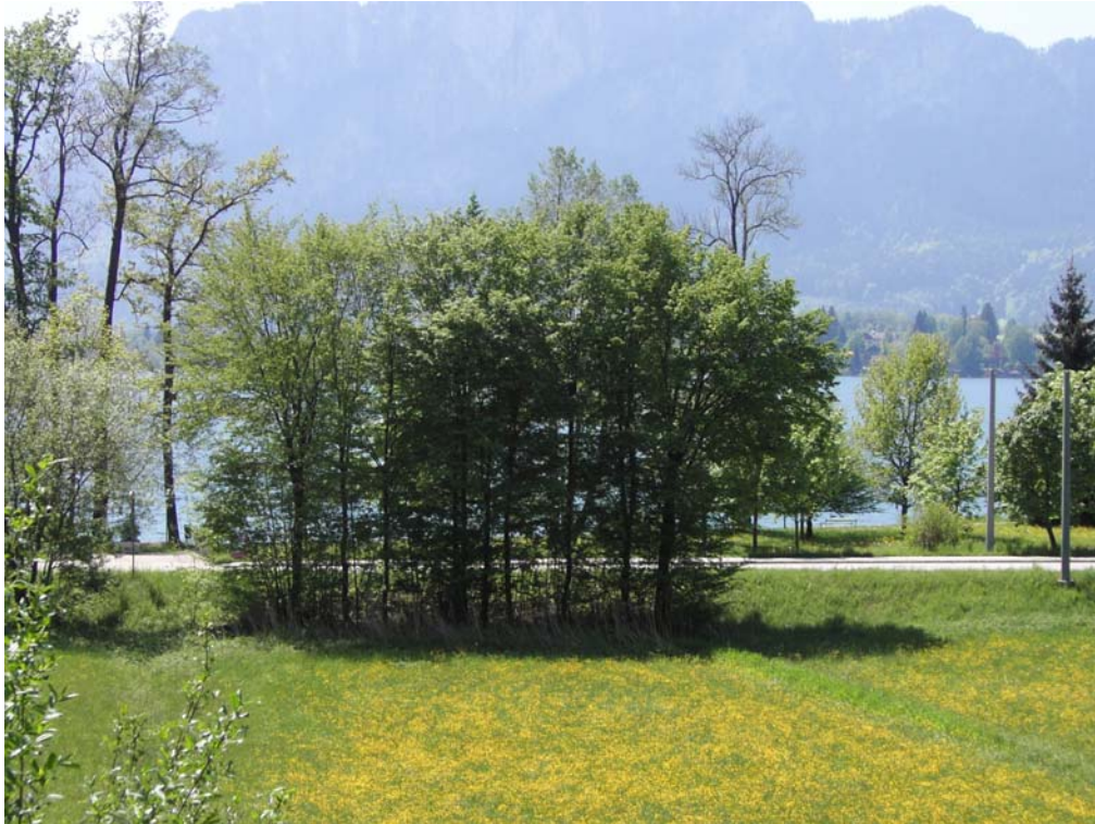
Abb. 11: Kleines Feldgehölz aus Schwarzerlen.