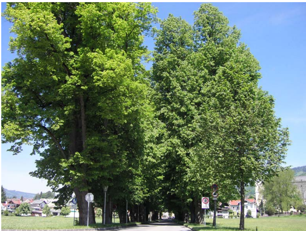
Abb. 10: Lindenalle S Ortsgebiet Mondsee.