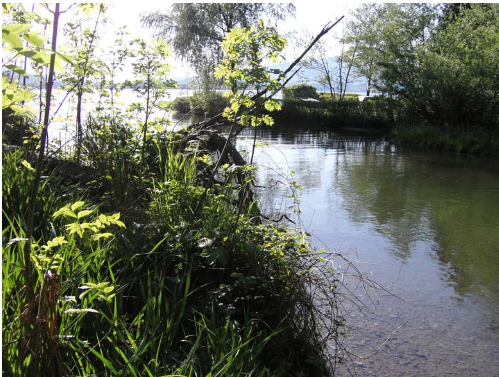
Abb. 02: Mündungsbereich der Wangauer Ache.