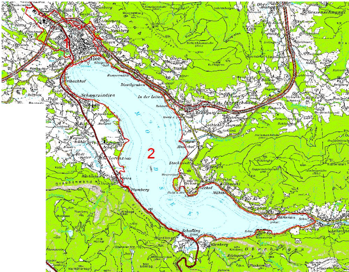
Abb. 1: Übersicht Erhebungsgebiet mit Abgrenzung der Teilgebiete und ÖK50