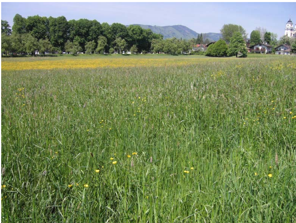
Abb. 12: Fettwiesen-Aspekt eine ehemaligen Streuwiese.