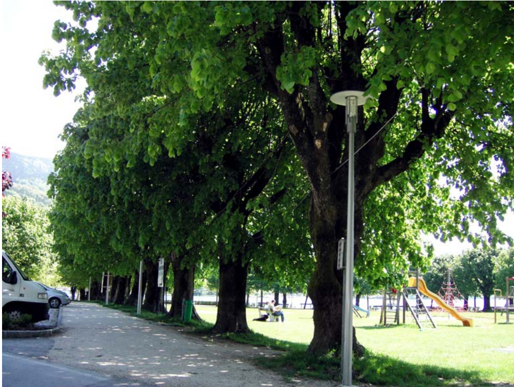
Abb. 17: Junge Lindenallee, Spielplatz und Mondsee im Hintergrund.