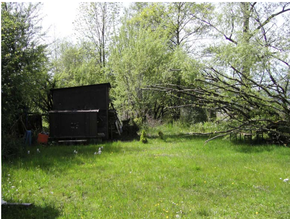
Abb. 06: Privatbadeplatz inmitten Schwarzerlen-Uferbereich am Mondsee.