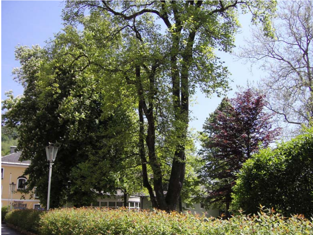
Abb. 09: Parkbäume S Stiftskirche.