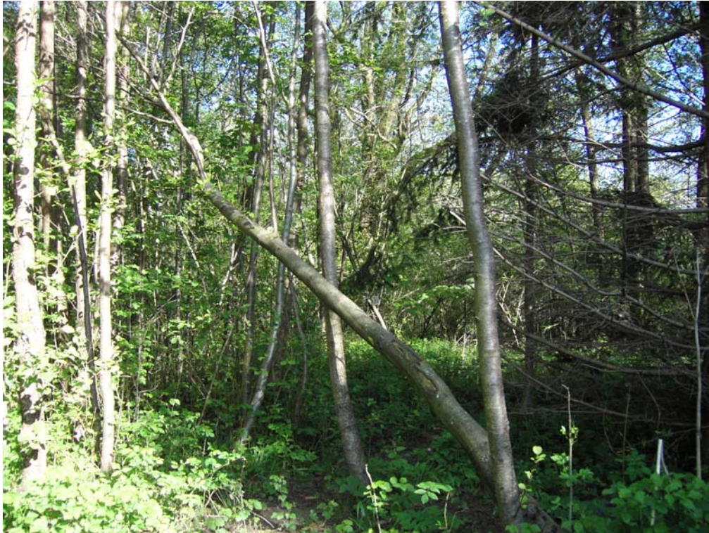
Abb. 03: Auwald-artige Ufervegetation im Mündungsbereich der Wangauer Ache.