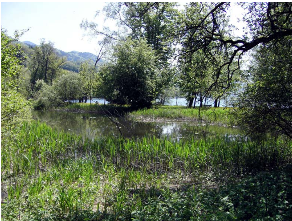
Abb. 14: Ökologisch hochwertiger Weiher nahe Seeufer.