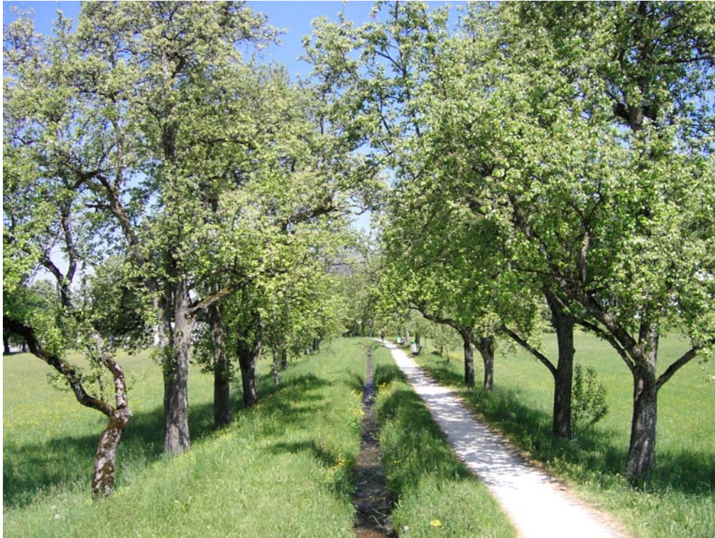
Abb. 15: Unterlauf Kandlerbach mit Obstbaumallee.