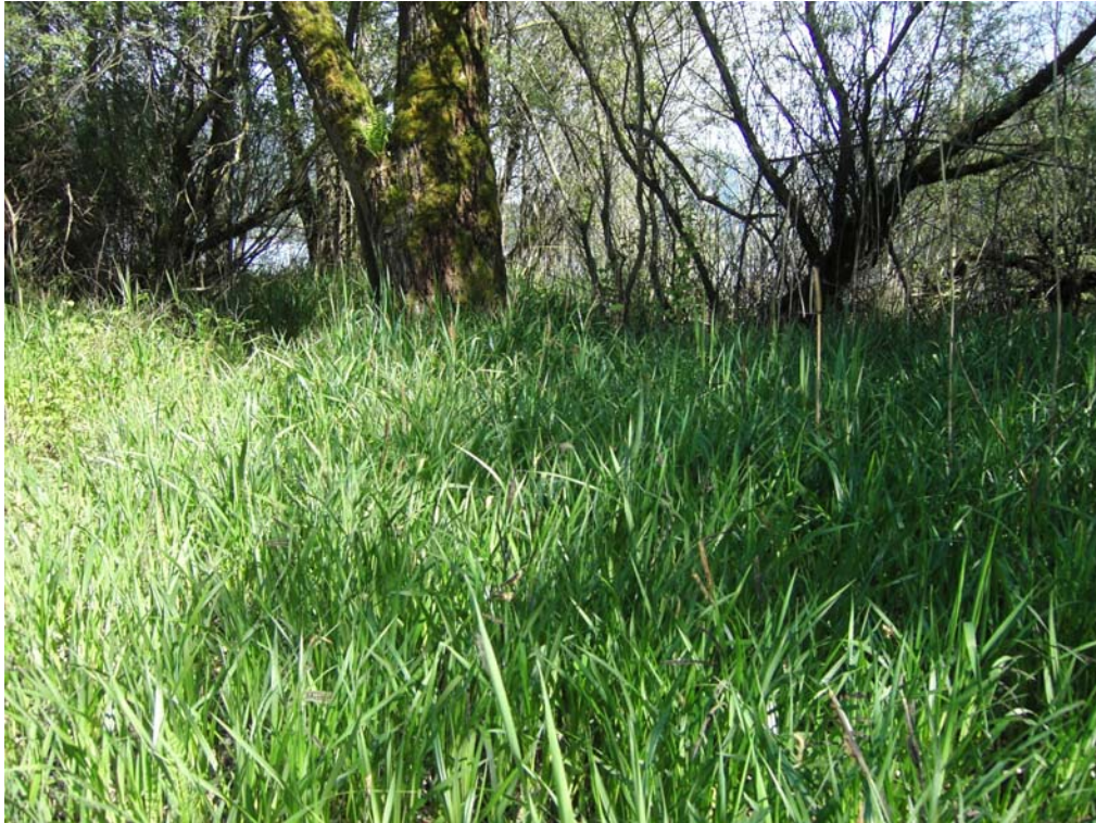
Abb. 05: Großseggensumpf im Mündungsbereich der Fuschler Ache.