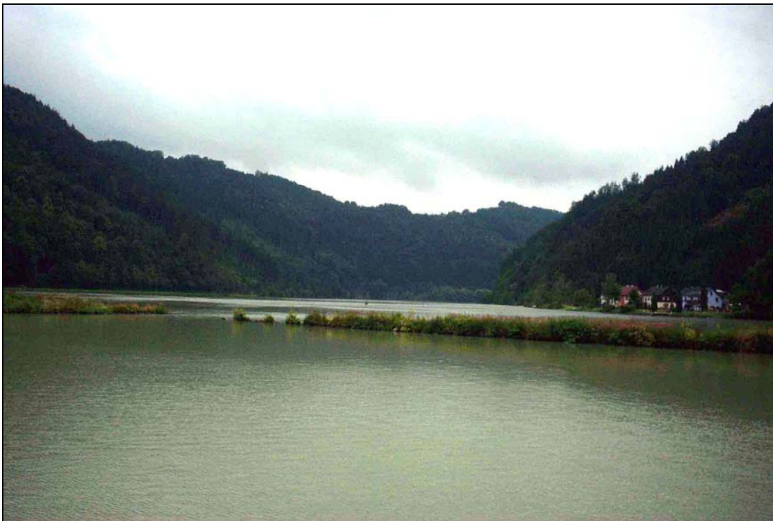
Abb. 2: Donauschlucht im Bereich der Mündung der Großen Mühl, links und rechts im Bild die bewaldeten Hänge Blick flussaufwärts