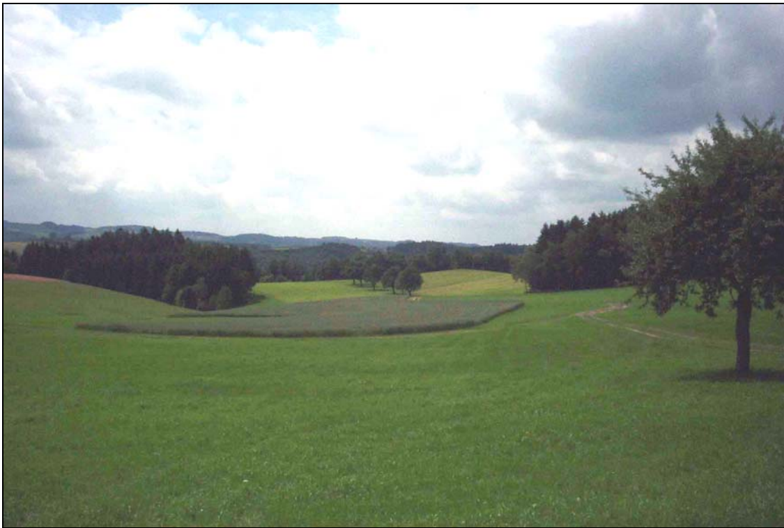
Abb. 5: Landschaft zwischen Stieberberg und Haiden (Teilgebiet 3), intensives kaum strukturiertes Grünland, wenige Obstbäume, das Oberflächenrelief und die Waldsilhouette der Hangwälder im Hintergrund strukturieren die Landschaft