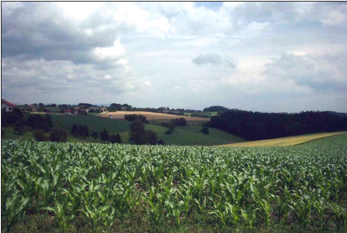
Abb. 3: Landschaft südlich von Kirchdorf; Strukturierung des intensiven Grün- und Ackerlands durch Obstbäume und Gehölzgruppen