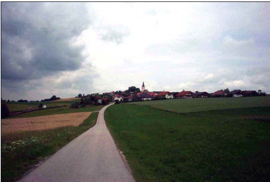
Abb. 4: Blick auf die Ortschaft Kirchberg ob der Donau; die Ortschaft liegt an der höchsten Erhebung des Gemeindegebiets, Blick Richtung Nordwesten