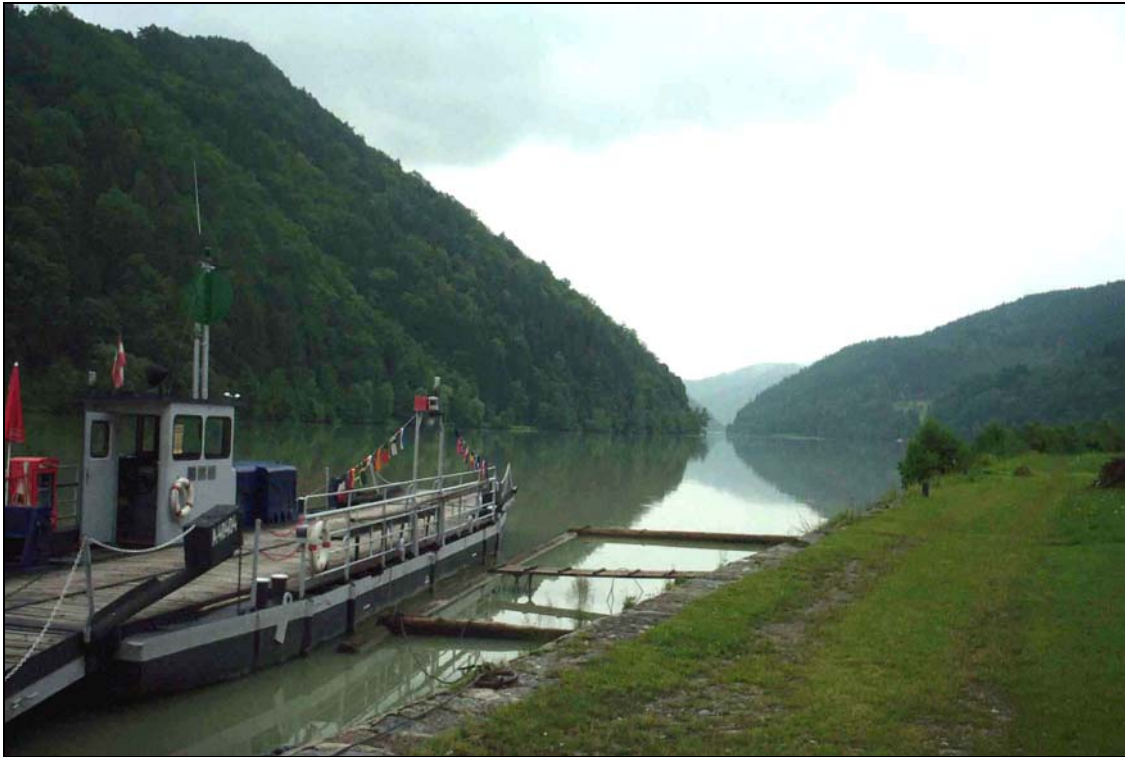
Abb. 1: Donauschlucht flussab der Mündung der Kleinen Mühl, Blick flussabwärts