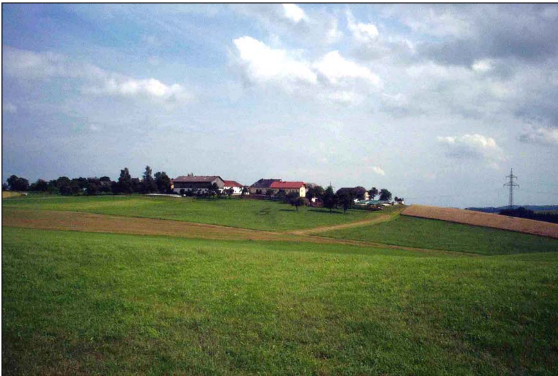
Abb. 6: Bauernhöfe von Gumpesberg, Obstbaumwiesen konzentrieren sich im Bereich von Bauernhöfen; im Vordergrund intensives Grünland