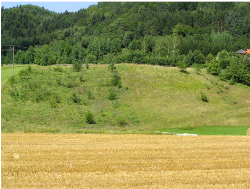
Foto-Nr. 41312008. Die meisten der artenreichen Magerwiesen an den Sonnenhängen von Niederranna sind bereits verbracht.