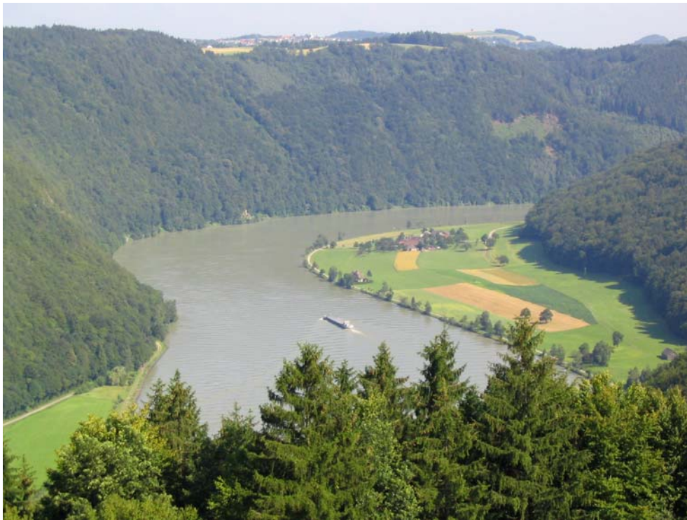
Foto-Nr. 41312001. Blick von Dorf auf die Schlögener Schlinge mit der Siedlung Au im dritten Teilgebiet.