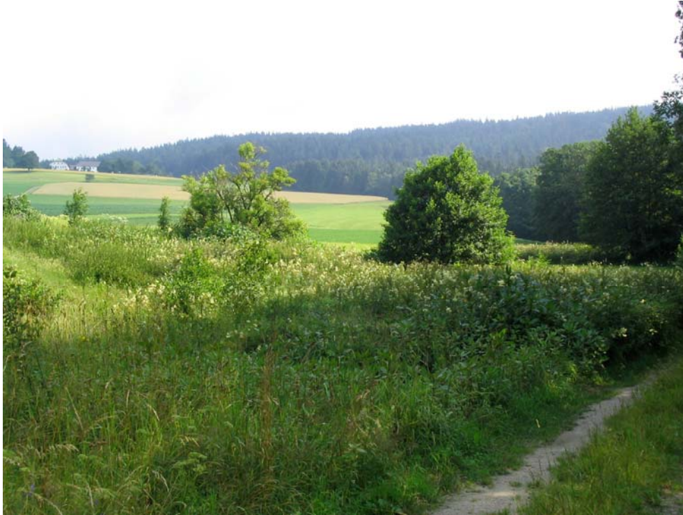
Foto-Nr. 41312005. Feuchte Hochstaudenbestände mit Einzelgebüsch sind besonders wertvolle Lebensräume für Vögel.