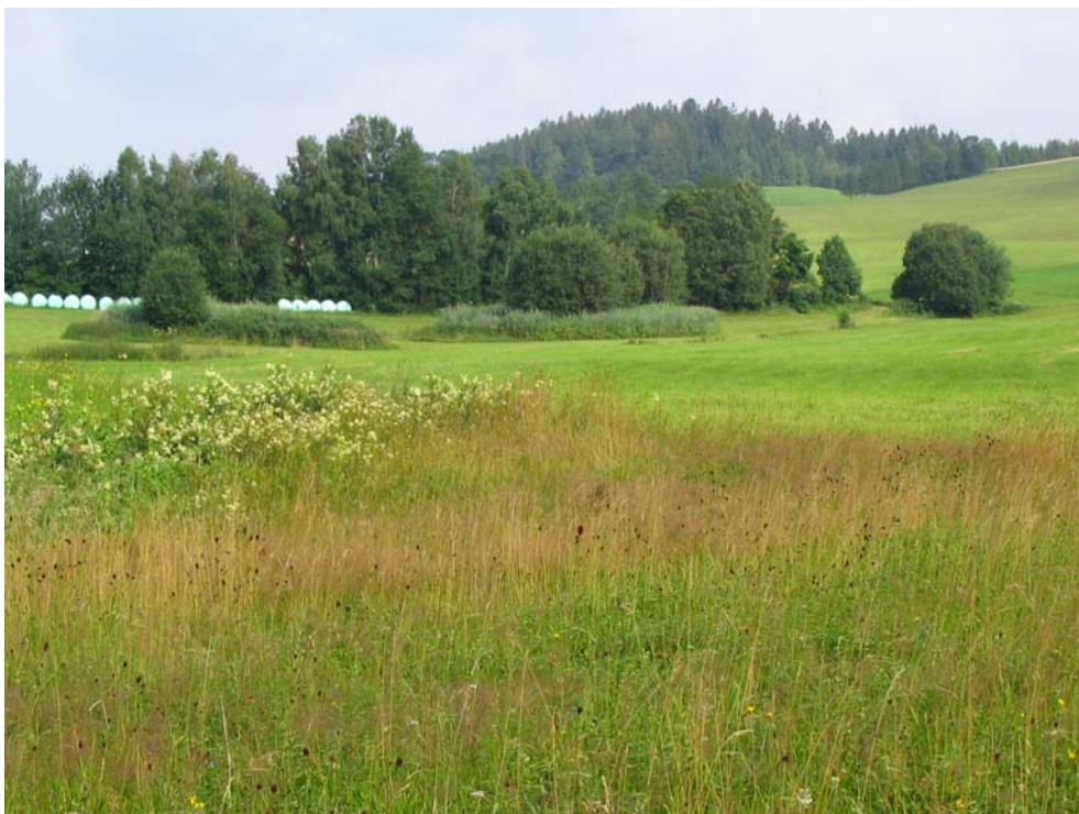
Foto-Nr. 41312004. Feuchtwiese, Hochstaudenflur und Kleingehölze bilden hier ein wertvolles Mosaik.