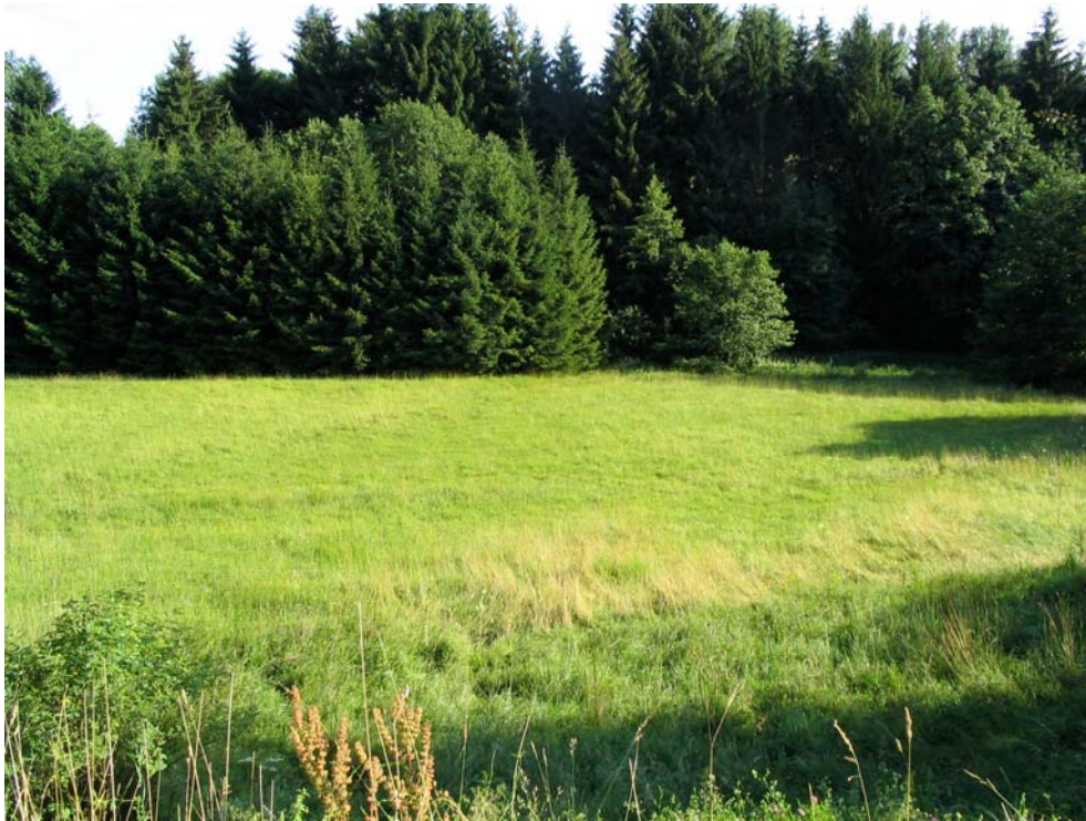
Foto-Nr. 41312003. Eine der letzten extensiven Feuchtwiesen in der Gemeinde mit zahlreichen regional seltenen Pflanzenarten. Ob sie noch regelmäßig gepflegt wird ist ungewiss.