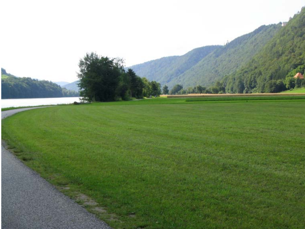
Foto-Nr. 41312009. Im Gebiet von Frezell ist den Donauhängen ein schmaler landwirtschaftlich genutzter Streifen vorgelagert, der größtenteils als Natura 2000 Gebiet nominiert ist.