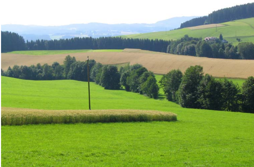
Foto-Nr. 41312002. Naturnahe Bäche mit ausgeprägten Ufergehölzstreifen sind wichtige verbindende Elemente in der intensiv genutzten Kulturlandschaft.