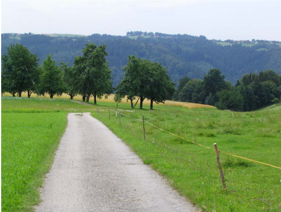
Foto-Nr. 41312007. Streuobstwiesen gehören zu den häufigsten Elementen der Kulturlandschaft von Hofkirchen. Sie verleihen dem oberen Mühlviertel ein Stück seiner Identität und genießen daher meist hohe Wertschätzung und Pflege.