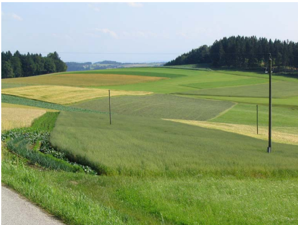
Foto-Nr. 41312010. Die gut zu bewirtschaftenden Bereiche im Kuppenland von Hofkirchen (Teilgebiet 2) sind vielerorts komplett ausgeräumt.