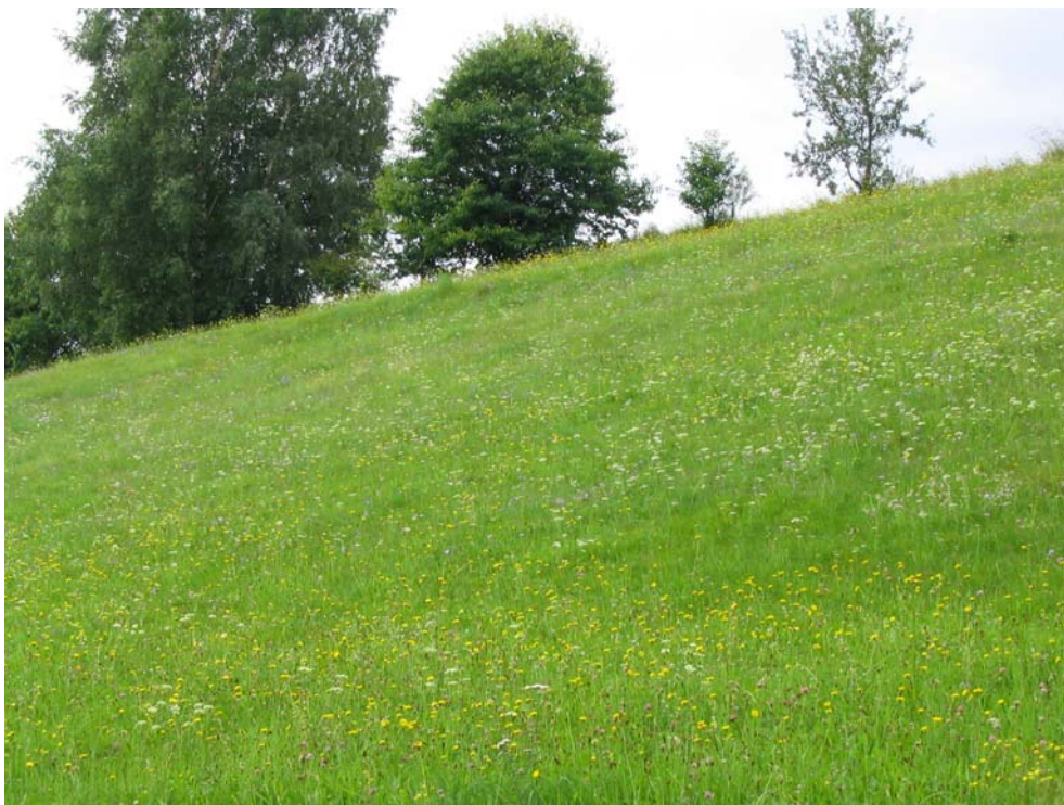
Foto-Nr. 41312006. Magere und bunte Mähwiesen findet man praktisch nur mehr auf steilen Böschungen, die eine Intensivierung erschweren.