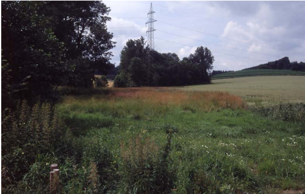
Abb. 9: Typische bachbegleitende Feuchtbrache mit hoher Naturschutzbedeutung. Foto: K. Nadler)