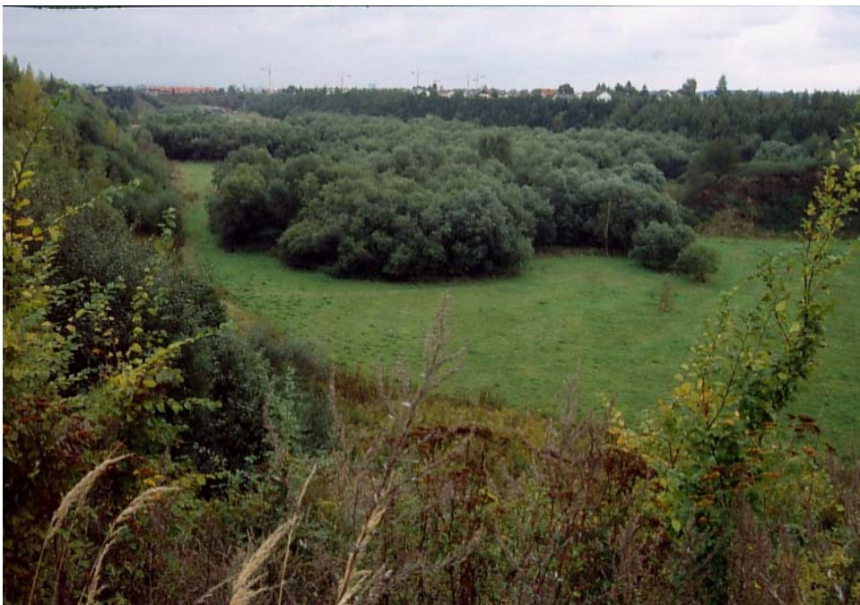
Abb. 6: Pflegeflächen in ansonsten verwaldender alter Schottergrube östlich Gunskirchen. Solche Gruben bilden Naturrefugien.