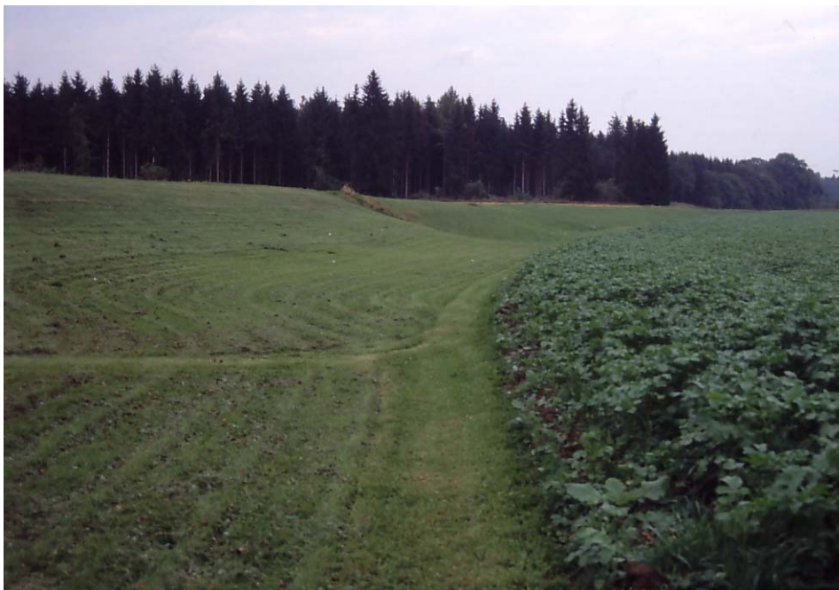
Abb. 2: Wertvolle Extensivwiesenböschung bzw. -graben, hervorn aber intensiv genutzt; untere Traunau.