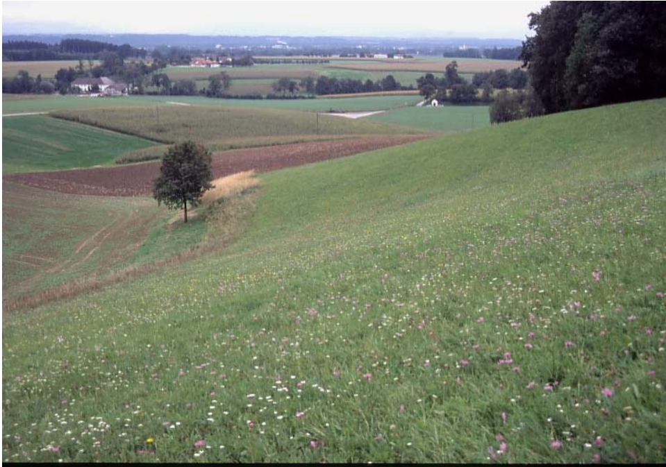
Abb. 11: Eine der wertvollsten Extensivwiesen Gunskirchens, bis auf Böschungsabschnitte vorbildlich gepflegt; zwischen Fernreith und Vornholz. Außer verbreiteten Extensivwiesenpflanzen kommen hier auch seltene Arten wie Kahler Wiesenhafer und Wiesenraute vor; auf der weniger gemähten Böschung wächst viel Heilziest.