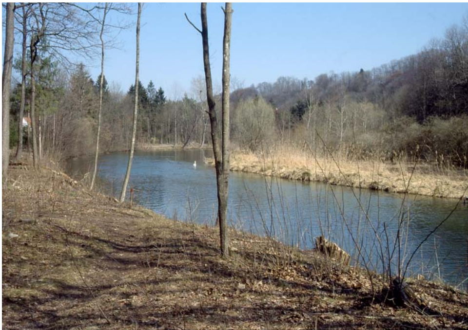
Abb. 1: Der Mühlbach in einer alten Traunschlinge; rechts zoologisch interessantes Röhrichtufer.