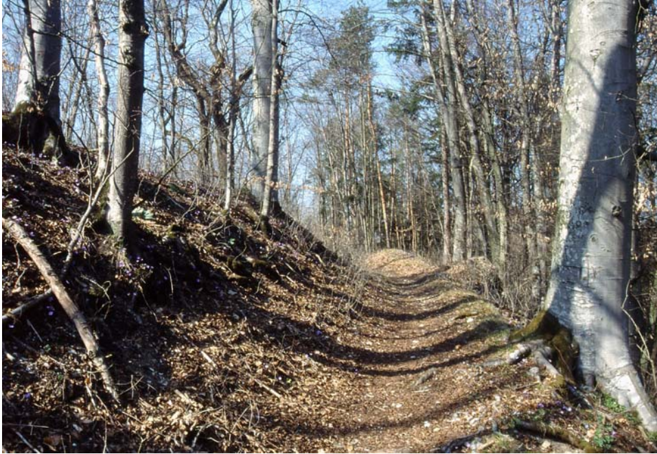
Abb. 3: Wertvoller Buchen-Altholzkomplex auf der großen Terrassenböschung im Naturschutzgebiet nahe der Welser Stadtgrenze.