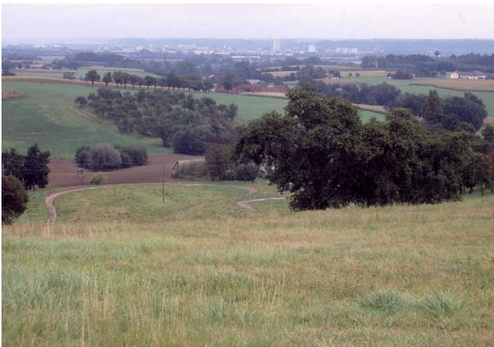
Abb. 10: Vorne „Testgelände“ mit wertvollen Trockenbrachen, weiters wertvolle Obst-Altholzbestände; Blick gegen Wels.