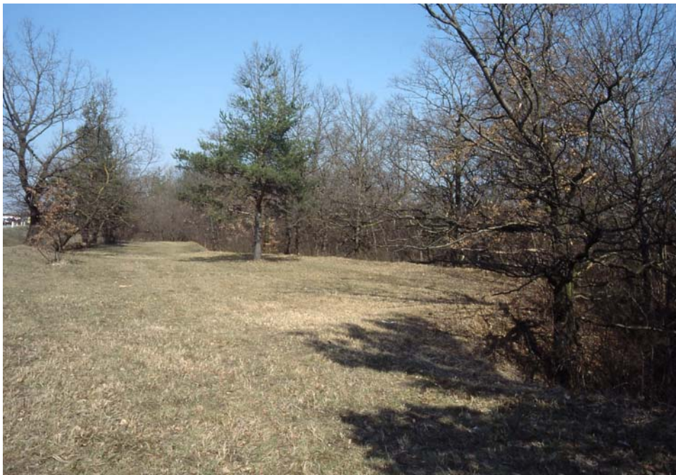
Abb. 4: Wahrscheinlich der letzte Kuhschellenstandort Oberösterreichs im Halbtrockenrasen beim Wirt am Berg.