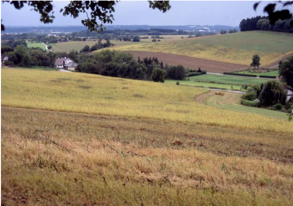
Abb. 13: Extensiver, offensichtlich spritzmittelfreier Maisbau (gelbgrüne Felder) - ein Spezifikum um Fernreith.