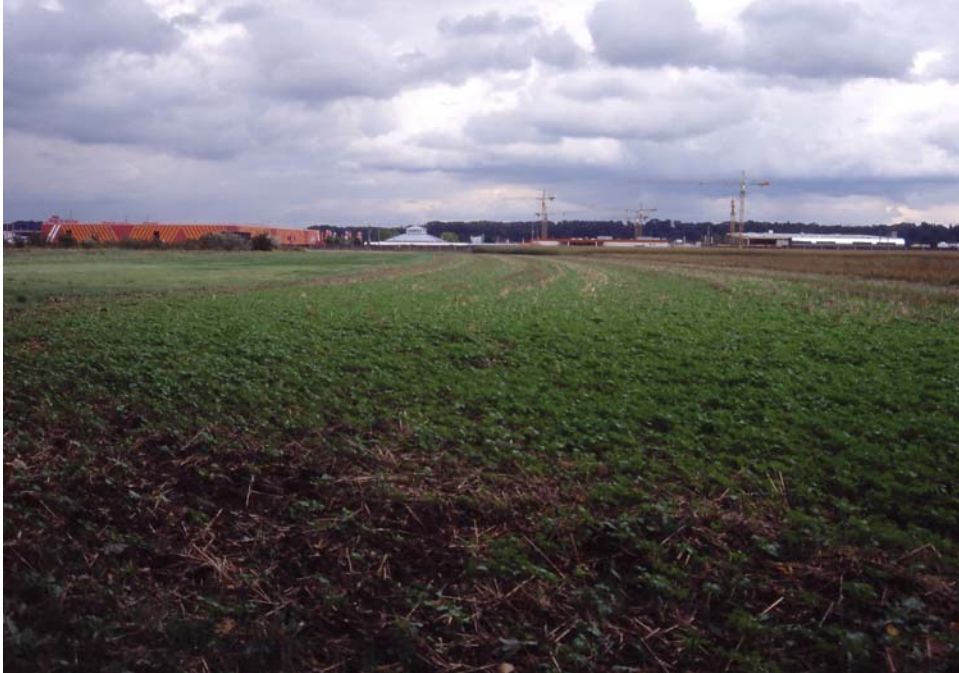
Abb. 7: Gewerbeansiedlung ersetzt landwirtschaftliche Nutzung im stadtnahen Teil der Niederterrasse.