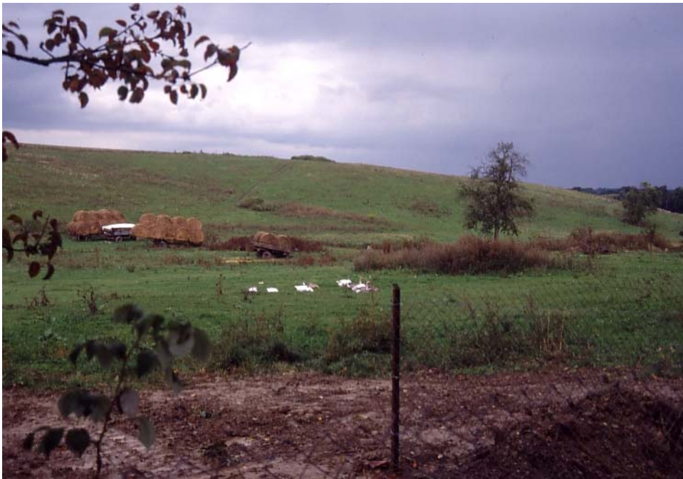
Abb. 12: Großflächiges, naturschutzfachlich wertvolles Extensivweidegebiet in Fernreith.