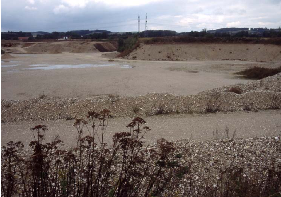
Abb. 5: Offene Schottergrubenböden - bei geringem Verkehrsaufkommen bedeutender Vogellebensraum.