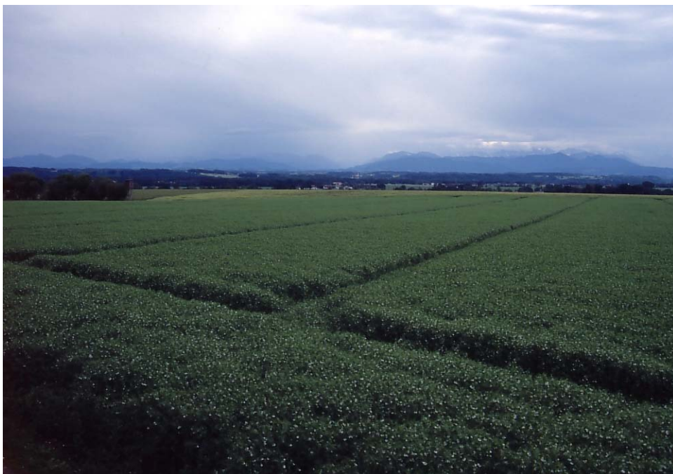
Abb. 8: Extrem großschlägige Intensiv-Agrarflur bei Sierfling; hier mit Erbse.