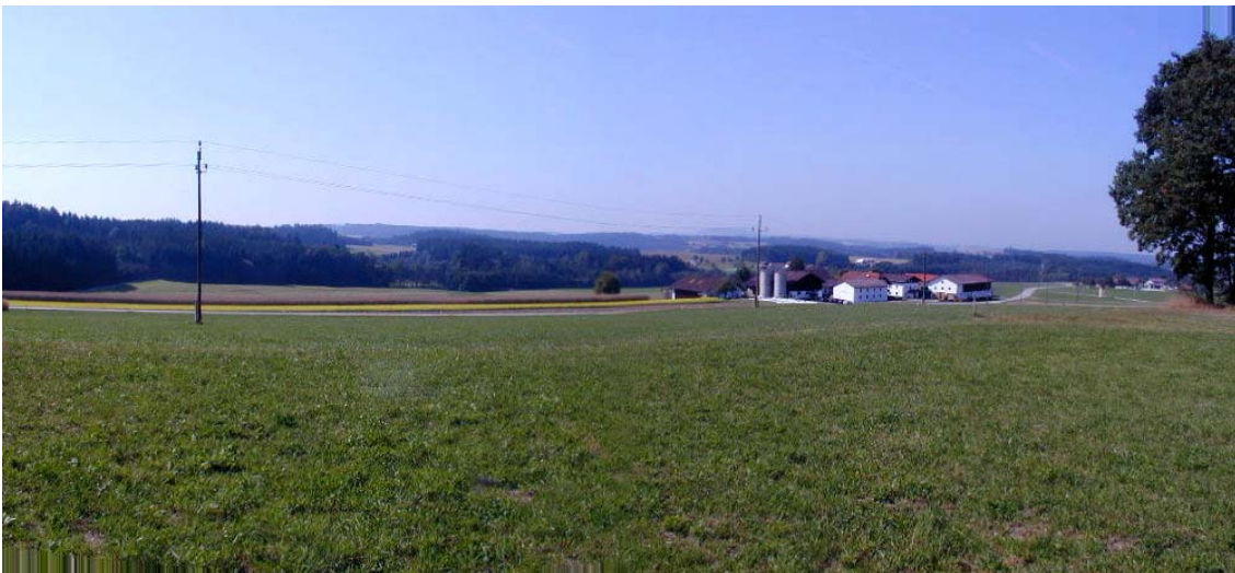
Foto 5: Blick im Bereich der Ortschaft Seebach Richtung Südwesten