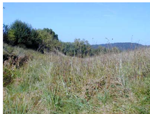
Fotos 6a und 6b: Feuchte Sukzessionsfläche in der Nähe der Ortschaft Winterhof