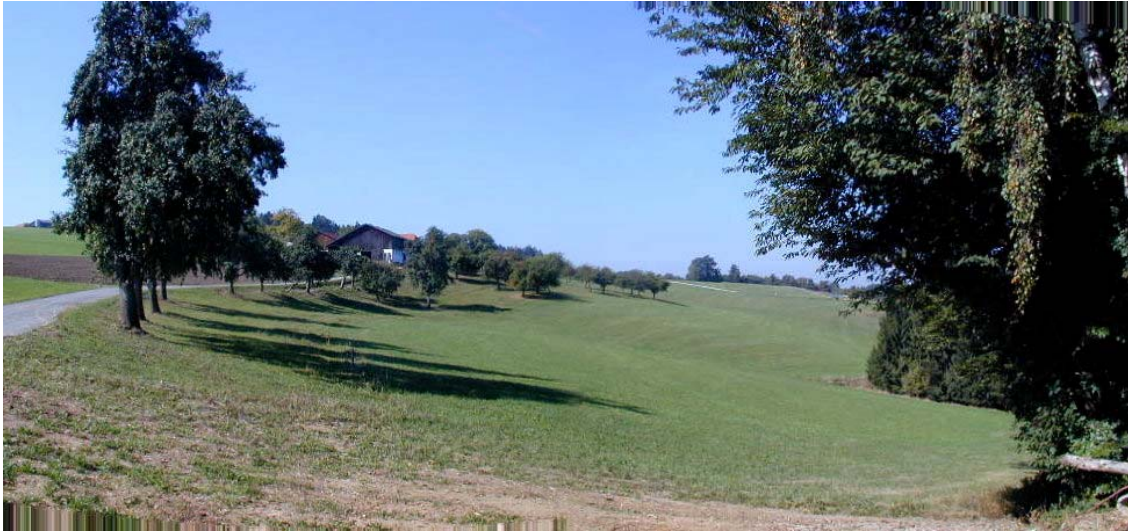
Foto 4: Blick auf Streuobstwiese im Bereich der Ortschaft Rauhegg