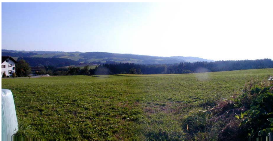
Foto 11: Blick Richtung Südwesten im Bereich der Ortschaft Zeilberg