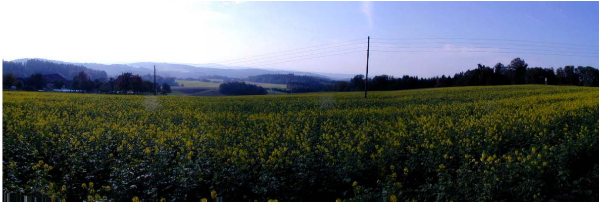
Foto 1: Blick Richtung Westen im Bereich der Ortschaft Urschendorf