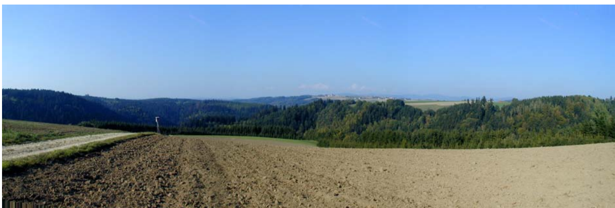
Foto 15: Aufnahme in der Nähe von Gersdorf, Blick Richtung Nordosten