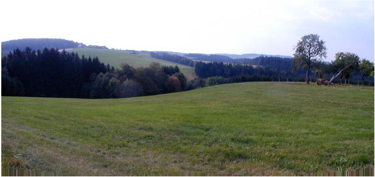
Foto 19: Blick von der Ortschaft Gersdorf Richtung Weiler Lanzendorf