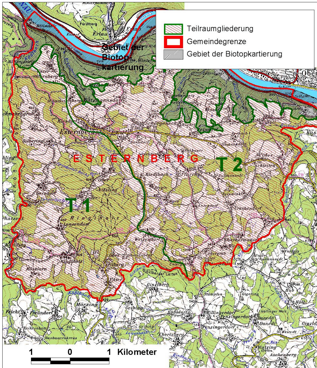
Abb. 1: Übersicht landschaftsräumliche Gliederung Esternberg

Teilgebiet 1: Stark reliefierte Hügellandschaft mit markanten, tiefen Flusstälern