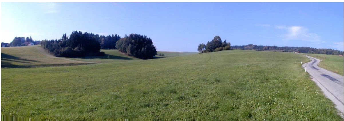
Foto 3: Blick Richtung Norden im Bereich der Ortschaft Oberharmansedt