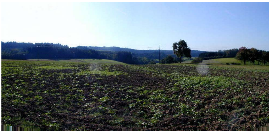
Foto 8: Aufnahme im Bereich der Ortschaft Ezendorf, Blick Richtung Westen