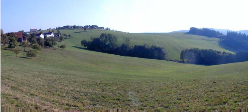
Foto 16: Aufnahme in der Nähe von Schwabengrub, Blick Richtung Nordosten