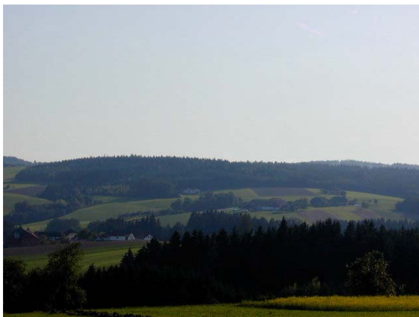
Foto 12: Aufnahmepunkt zwischen Pfarrhof und Eckbauer, Blick Richtung Nordosten