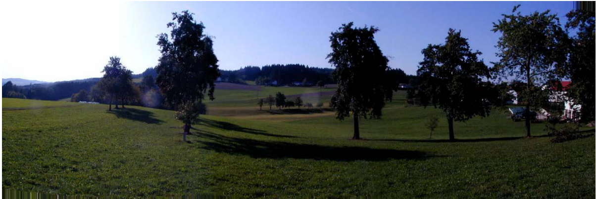
Foto 10: Blick im Bereich der Ortschaft Wetzendorf Richtung Südwesten