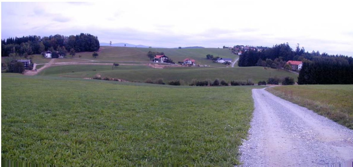
Foto 27: Blick von der Ortschaft Esternberg Richtung Norden (Hötzmannsdorf/Dietzendorf)