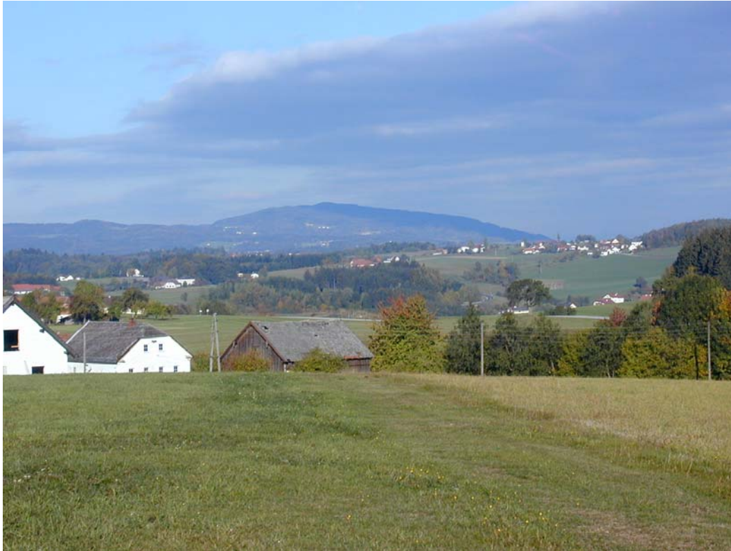
Foto 9: Blick auf den Haugstein (Fotostandpunkt Waldkirchen am Wesen)