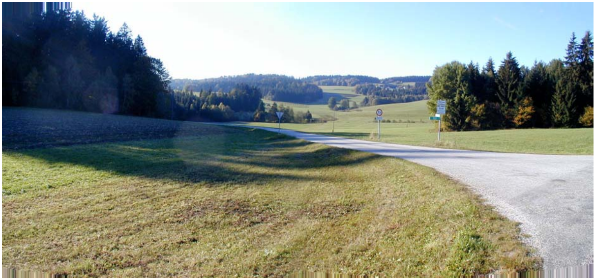
Foto 1: Blick im Bereich der Ortschaft Vierling Richtung Südwesten