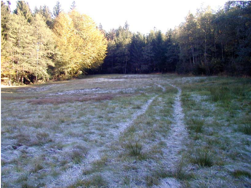
Foto 4: Feuchte Extensivwiese mit vorwiegend Binsen und Seggen (südlich von Stadl)