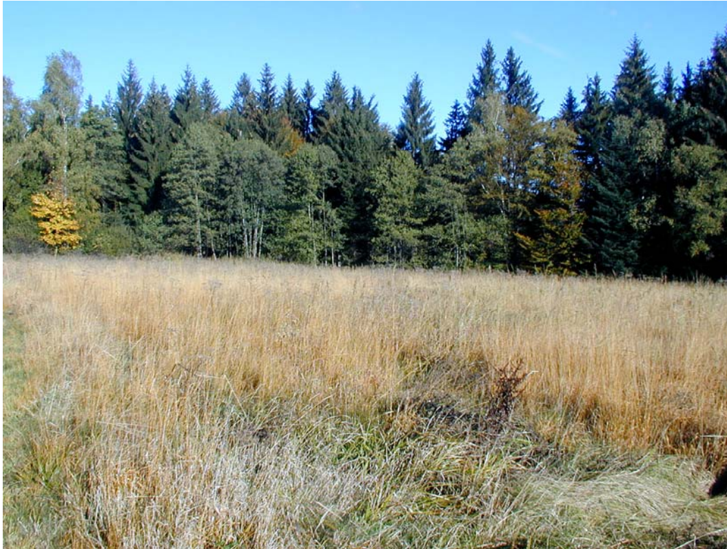
Foto 3: Sukzessionsfläche mit vorwiegend Pfeifengras und Engelwurz (südlich von Stadl)