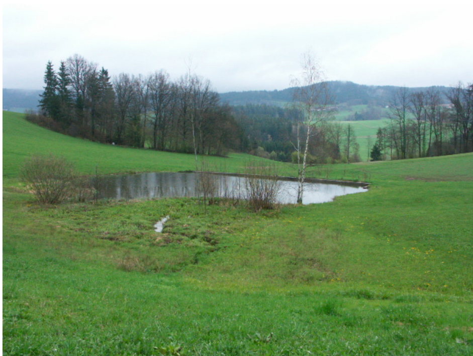
Abb. 11: Sehr naturnaher Teich bei Reith