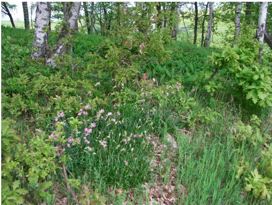
Abb. 17: Typisches Bühel, bei Hundbrenning