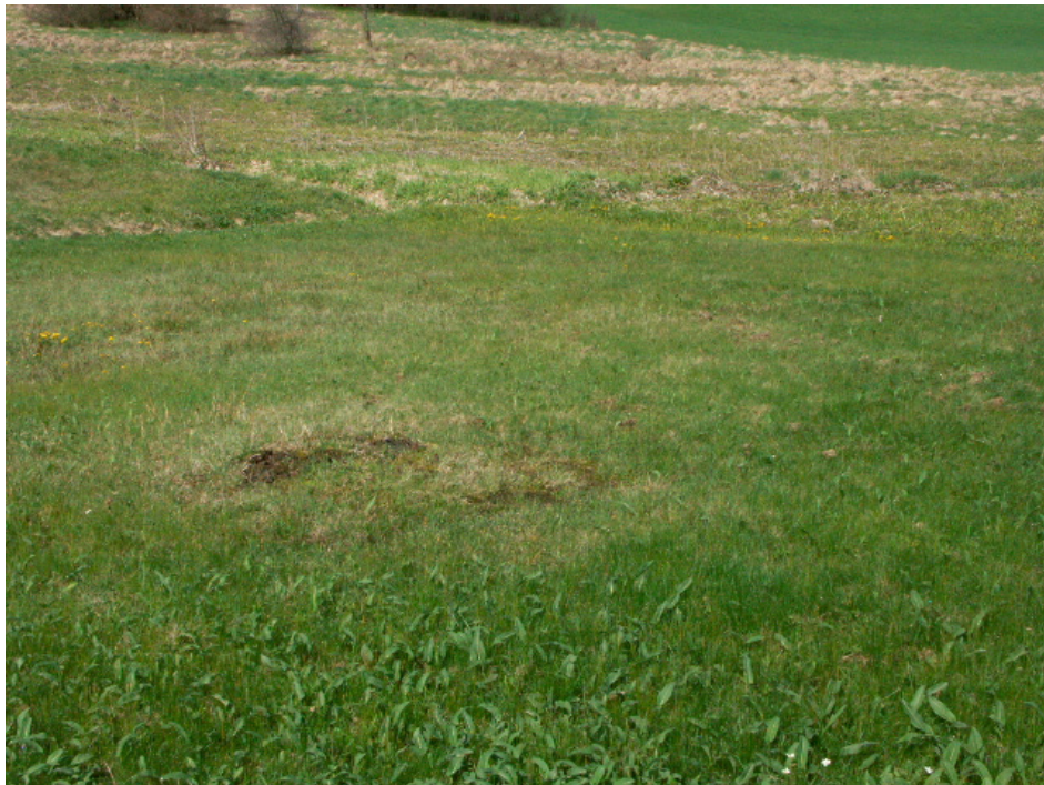
Abb. 4: Wertvollste Flächen Bergs bei Kollonödt