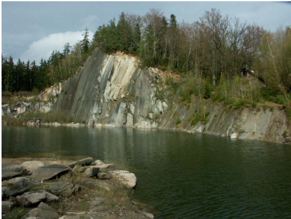
Abb. 6: Aufgelassener Steinbruch bei Steineck