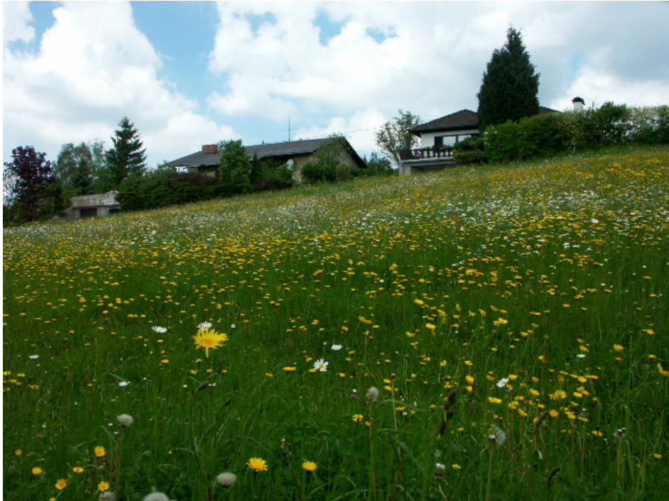
Abb. 16: Blumenreiche Fettwiese im Siedlungsgebiet von Berg