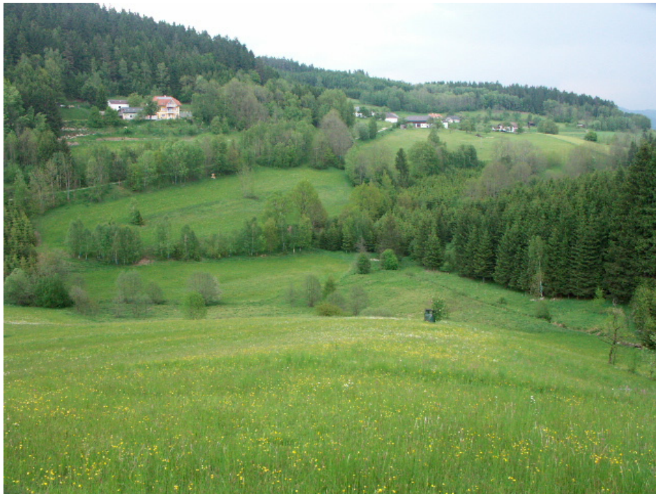
Abb. 18: Fortschreitende Verwaldung bei Fraundorf