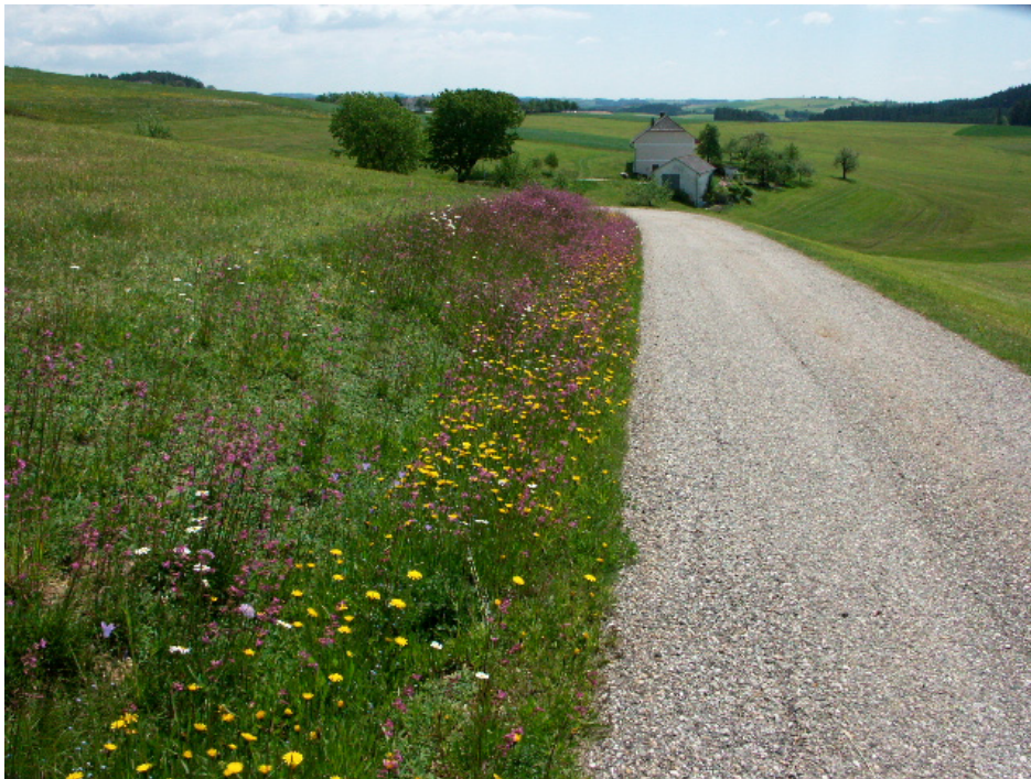
Abb. 2: Blumenreiche Wegböschung südwestlich Gollner