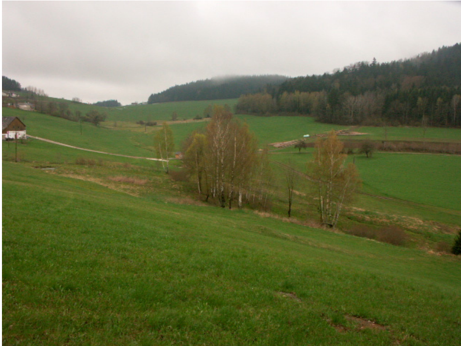
Abb. 12: Verwaltungsgefährdete hochwertige Flächen bei Kollonödt