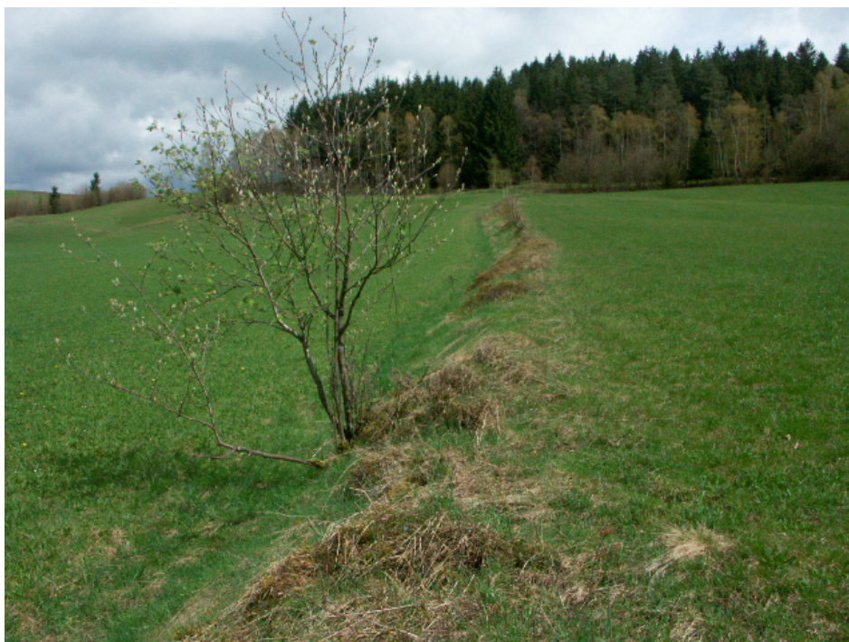
Abb. 3: Magerer Heidelbeerrain bei Rothberg