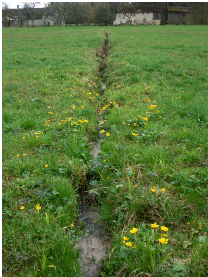
Abb. 9: Uriger Wiesengraben bei Steineck