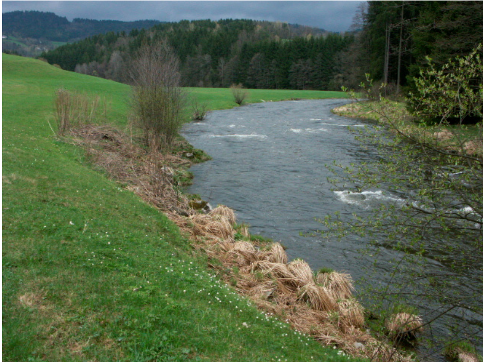
Abb. 8 Große Mühl beim Voitenhof