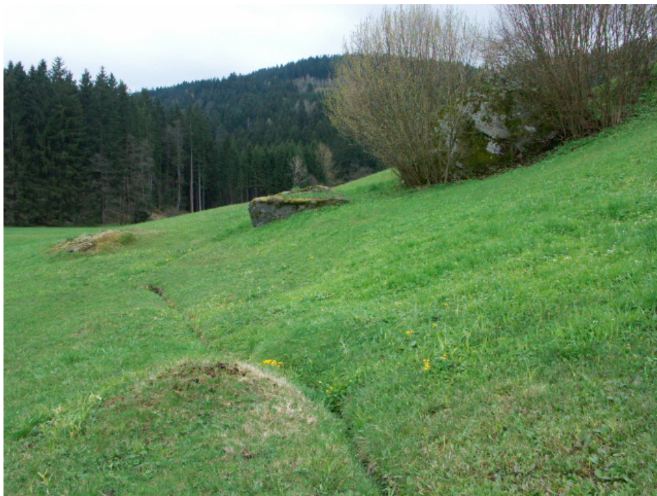
Abb. 7: Teils händische Biotoppflege beim Voitenhof