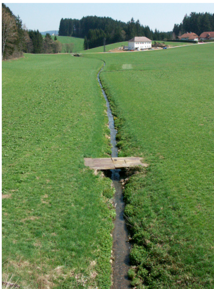
Abb. 15: Sehr naturferner Froschbachabschnitt an der Rohrbacher Grenze