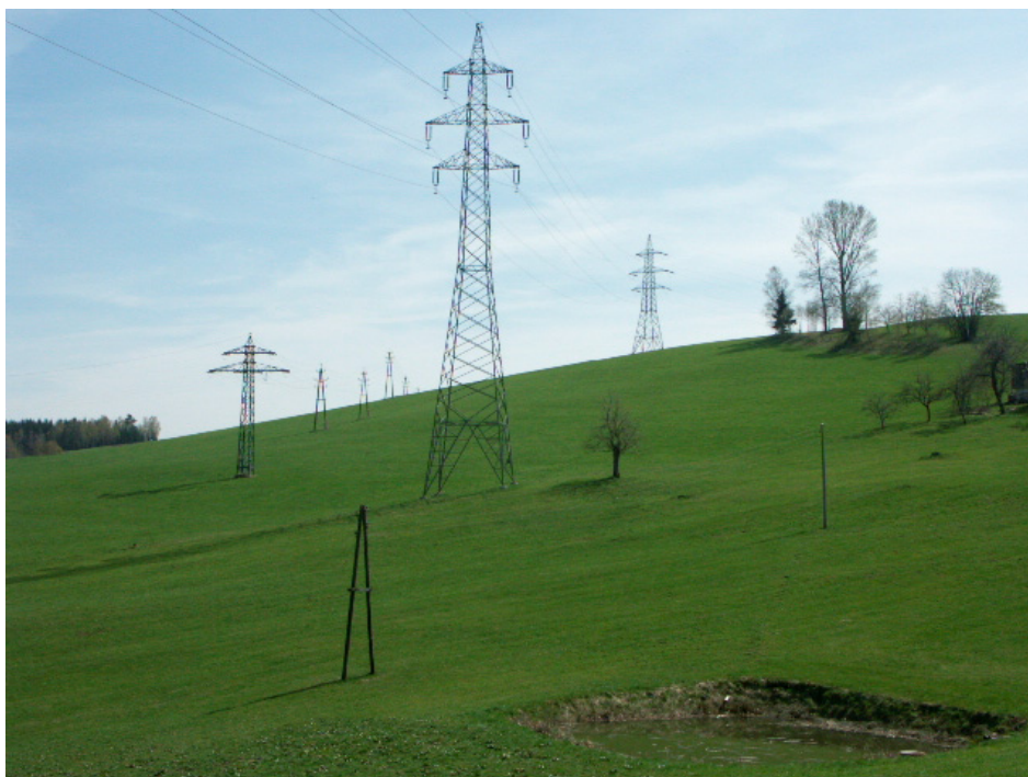
Abb. 14: Landschaftsprägende Energieinfrastruktur bei Scheiblhof