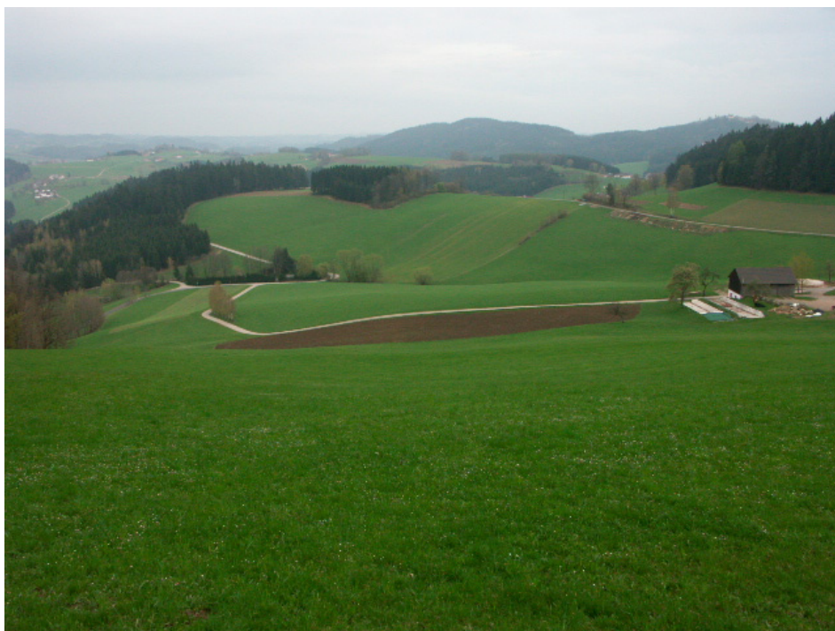
Abb. 5: Landwirtschaftliches Intensivgebiet bei Obermärzing