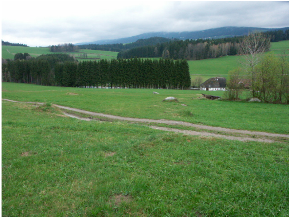
Abb. 10: Magere Steinwiese bei der Pfeffermühle