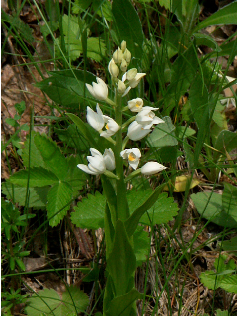
Abb. 1: Langblättriges Waldvöglein bei Gintersberg