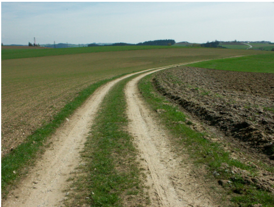
Abb. 13: Agrarisches Offenland bei Scheiblhof