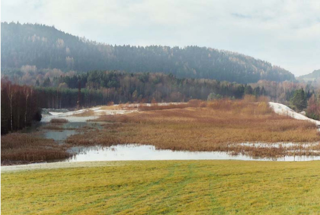
Foto 3: Einer von mehreren großen Teichen im Kaolin-Abbaugbiet. Sie sind Lebensraum für sonst nur mehr selten vorkommende Tier- und Pflanzenarten