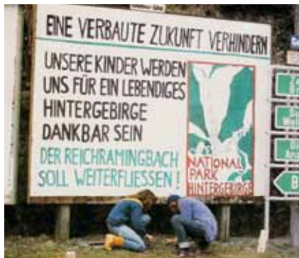
Vielfalt im Wald am Weg zur Wildnis.

„Wildnis spüren“ propagiert der Nationalpark in der Region. Infozentren, Wander-, Reit- und Radwege, geführte