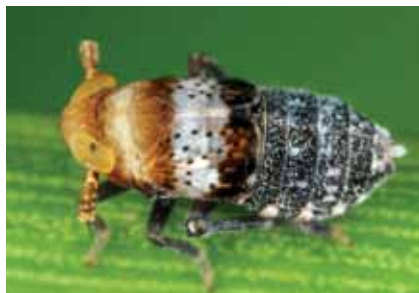
Die Gemeine Binsenspornzikade ist die häufigste Art in den Mooren des Böhmerwaldes. Sie ernährt sich von Pflanzen der Gattung Juncus .