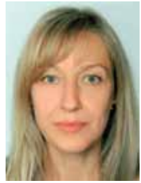
Mag. Birgit Schober-Pointinger Presse NATUR-SCHAUSPIEL.at