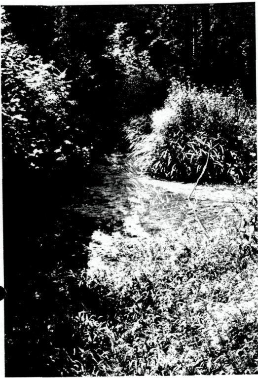
Abb.5: Alter Mühlbach bei der Schmiedleithen (5231/5100).