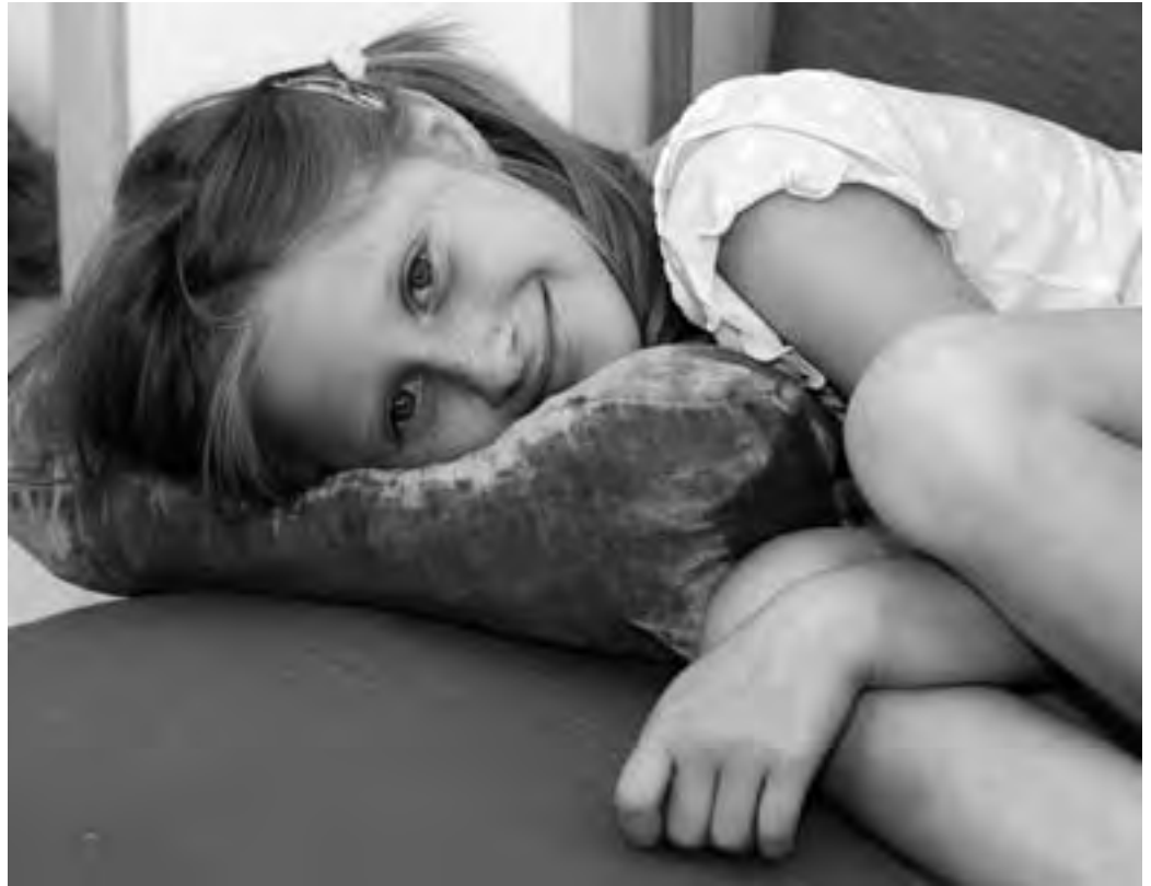
Das Kindeswohl steht im Mittelpunkt.

dem Jahr zuvor. Seit dem Jahr 2001 ist diese Zahl sogar um 135 % gestiegen“, erklärt LH-Stv. Ackerl.