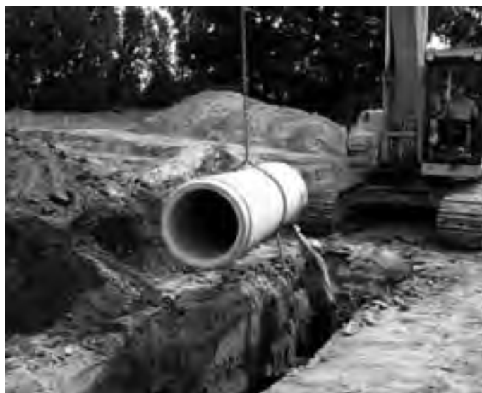
Das Land erlässt den Gemeinden Altsschulden aus dem Wasserleitungs- und Kanalbau.

sen wurde, ist auch vereinbart, dass das Land den Gemeinden die Rückzahlung von Landesdarlehen für die