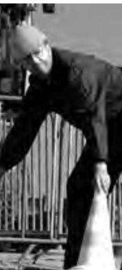
Die Arbeit stellt das Fundament für eine wirtschaftlich und sozial positiv entwicklungs-fähige Gesellschaft dar.