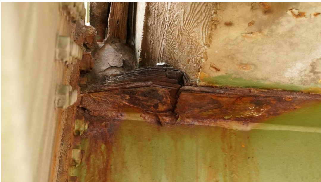
Abbildung 2: Schäden an der Brücke

Durch die massiven Einwirkungen auf Grund des Verkehrs (hoher Schwerlastanteil, hohe Verkehrszuwächse in den letzten Jahren) und durch die jahrzehntelangen Belastungen durch Streusalz, weist die mittlerweile 56 Jahre alte Stahl- und Betonkonstruktion massive Schäden auf. Ein Großteil dieser Schäden tritt bei den Anschlussbereichen der Querträger an die Längsträger auf.